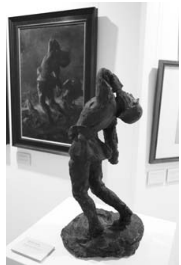
Fallender Soldat, undatiert, Gips gefaßt mit Ölfarbe

Auf den Soldaten- und Kriegsbildern von Reumann wandelt sich der Naturalismus der späten Münchner Schule ins aggressiv Militärische und Düstere. Farbauftrag und Pinselstrich sind genauso gekonnt und schmissig wie Anatomie und Zeichnung. Das Grauen des Krieges wird mal dynamisch, mal pittoresk dargestellt. Bei der Darstellung von toten Soldaten