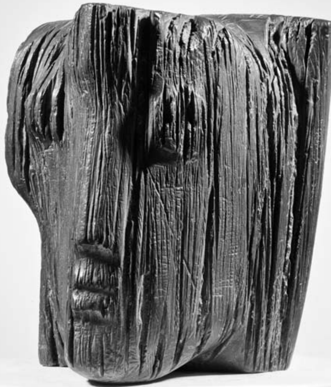
Engelskopf II, 1955, Bronze, Abb.: Katalog