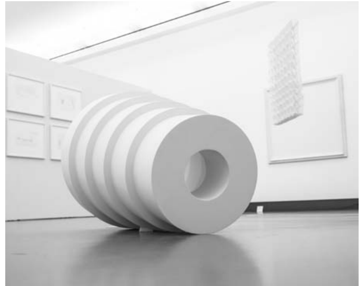
Im Vordergrund: o-1503, eine Skulptur aus dem Jahr 2005 von Reinhard Roy

krosanken Bildträger, den er schwarz hinterlegte und dadurch den Eindruck von Verletzungen durch gewaltsame Eingriffe erweckte. In den Jahren nach dem 1. Weltkrieg orientierten sich auch einige Plastiker völlig neu. Als Werkstoff hatte hier weißer Marmor zwar eine lange Tradition. Doch die russischen Konstruktivisten, in der Ausstellung eine „Raumkonstruktion“ von Alexander Rodtschenko, griffen nicht mehr zu edlen Materialien, sondern bemalten Holzlatten oder Metalle weiß und verabschiedeten sich nicht nur von jedweder Figur, sondern auch von Volumen und Masse. Wie ein kleiner Krahn sticht Rodtschenkos maschinenartiges Konstrukt in den Raum.