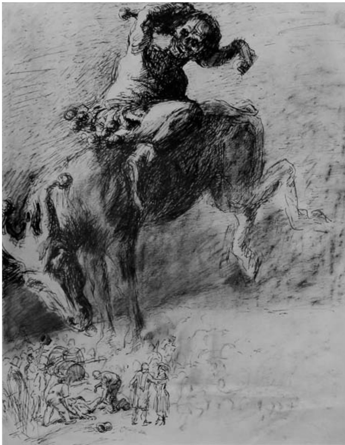
Tod als reitender Narr auf einem Esel, undatiert, Feder, Tusche und Kreide

wird der Geschmack des Betrachters nicht verletzt. Es sind keine zeretzten Leichen zu sehen. Sterben, Tod und Leid der Soldaten erhalten ihren Ausdruck durch Körperhaltungen, Schritt- und Sturzmotiven sowie dem Schwarzbraun der Farbpalette. Diese Soldaten- und Kriegsbilder bewegen sich zwischen distanzierter künstlerischer Umsetzung und dem Willen zum Pathos, zwischen Akademismus und Heroismus.