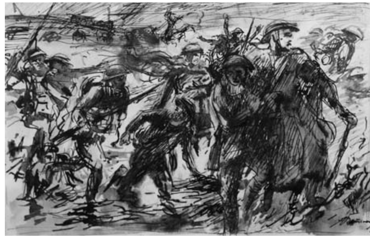
Voranschreitende Infanterie, 1918, Feder laviert