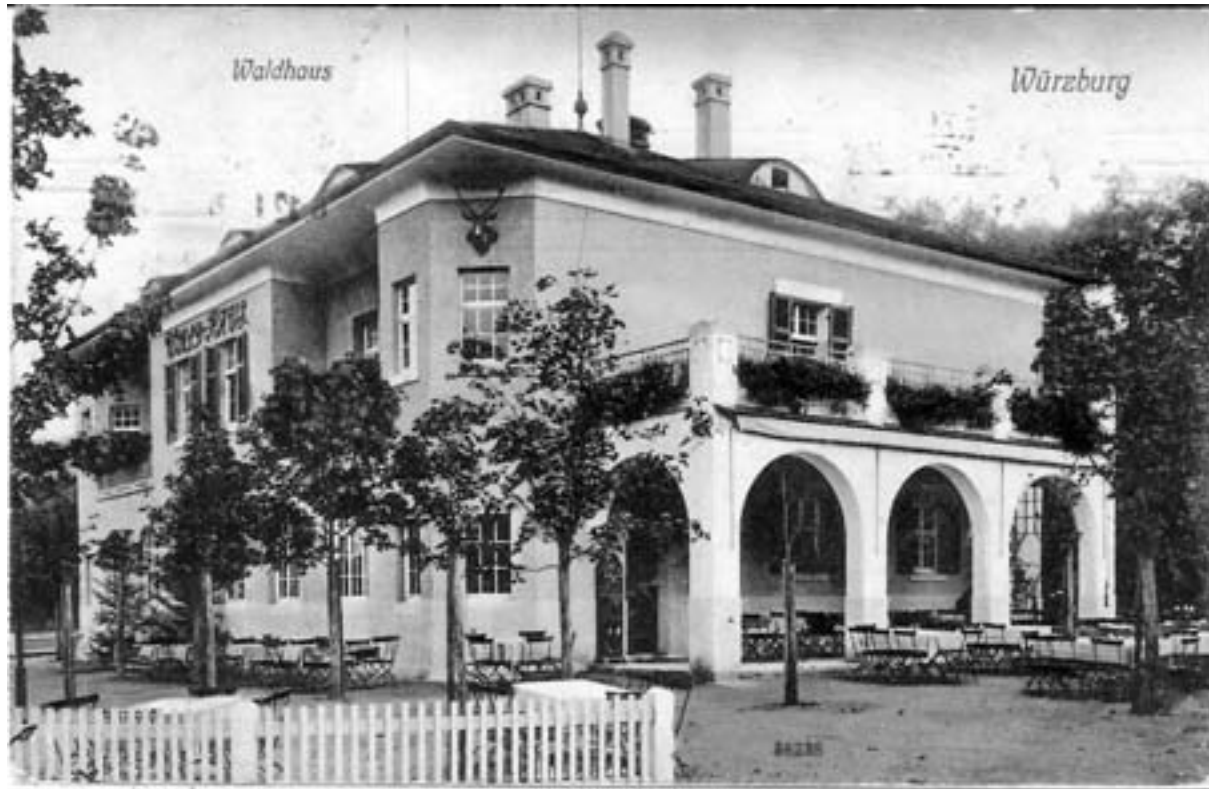
Das Waldhaus, ein Ort der Geselligkeit