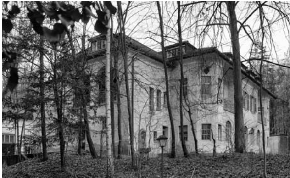
Das Waldhaus heute

Wie man auch den Vorgang bezeichnen will, tatsächlich war der „Kauf“ eine kalte Enteignung, ohne Rechtsgrund erzwungen, wie eben in diesem nationalsozialistischen Räuberstaat Besitzwechsel organisiert worden sind. Dazu paßt, daß zum Ausgleich zugesagte Förderungen später nicht geleistet wurden. Wir sprechen über Raubkunst, hier besitzen wir ein Beispiel für die Kunst des Raubes. Der Verein für Verschönerung und Gartenkultur vegetierte noch eine zeitlang während der Kriegsjahre, ohne rechte Tätigkeit entwickeln zu können, bis er nach dem Krieg aufgelöst wurde. Die Idee des Bürgervereins war auch unter dem Schutt der zerbombten Stadt lebendig geblieben. Der Verschönerungsverein erlebte eine Auferstehung in einer Lage, die sich vollkommen von der seiner ersten Gründung unterschied. Welche Ziele sollte er verfolgen? Wie sollte er agieren? Weitermachen wie früher oder neuen Zielen folgen? ¶