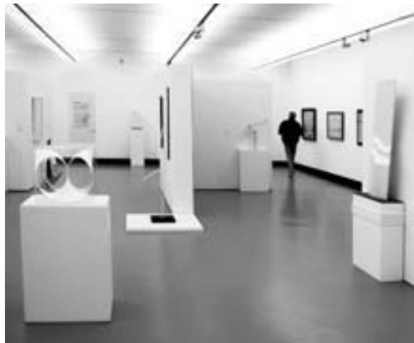
Nicht alle Exponate sind gänzlich weiß.