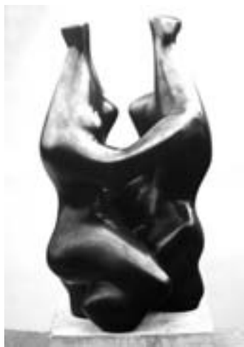
Tanzendes Paar, um 1947/48, Bronze, Abb.: Katalog

Er war immer auf der Suche nach der Urform: Figur und Natur inspirierten einen der wohl bedeutendsten Bildhauer der Nachkriegszeit, Karl Hartung (1908-1967), zu beeindruckenden Werken aus Bronze, Stein oder Holz, die auch in der Abstraktion noch das Ursprüngliche ahnen lassen. Die Kunsthalle Schweinfurt zeigt nun im Tiefgeschoß eine umfassende Retrospektive mit 50 Werken des Künstlers unter dem Titel „Aufbruch – Aufbrüche“, einem Motto, das die Tochter des Bildhauers vorgab. Das beinhaltet einerseits den Impetus, der Hartung nach der Erstarrung des Krieges dazu antrieb, sich vom vorher geltenden Diktat des „Gegenständlichen“ zu befreien, Aussage und Mittel zu verändern, andere Formen zu finden. Denn Hartung widmete sich nach dem Krieg der neuen, jungen Kunst; andererseits lassen manche Oberflächen seiner Plastiken denken an „aufgebrochene“, rissige Strukturen, etwa von Holz. Die umfängliche Schau, mit starken, bewußten Akzenten auf charakteristischen großen Bronzen, beginnt mit dem Frühwerk, das noch orientiert war an der realistischen Erfassung etwa einer weiblichen Figur oder eines Tieres wie eines Vogels. Hartung, in Hamburg ausgebildeter Holzbildhauer, studierte in den 30er Jahren auch in Paris und Florenz, interessierte sich sehr für die Skulpturen der Etrusker und rückte ab 1935 unter dem Eindruck etwa von Brancusi oder Arp seine Werke immer mehr in den Bereich des Abstrakten. Schon hier