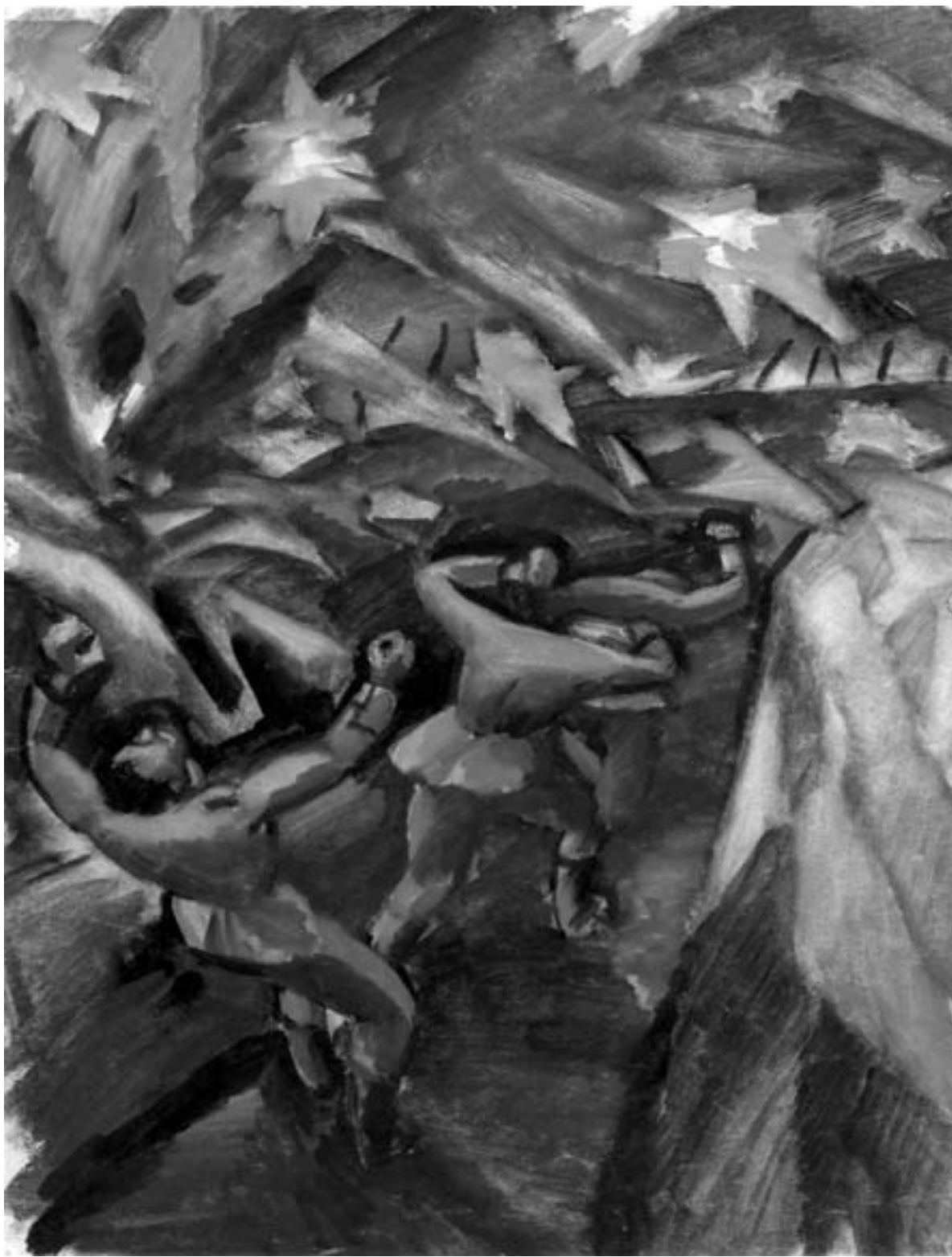
Otto Fischer-Trachau, Überraschender Handgranatenüberfall auf der Giesslerhöhe, 1916, Slg. Gerhard Schneider © Joachim Baake

Die bis dahin unvorstellbaren Grausamkeiten der Kämpfe fanden bald Eingang in die Werke vieler bildender Künstler, prominenter wie heute vergessener. Daß dieser expressive Ausdruck des Entsetzens, des Protests, der Trauer, vornehmlich in der Graphik, wenig bekannt ist, liegt vor allem an der Diffamierung durch die Nazis in den folgenden Jahrzehnten; sie nannten solche Werke „entartet“, verboten sie als „Wehrkraftzersetzung“.