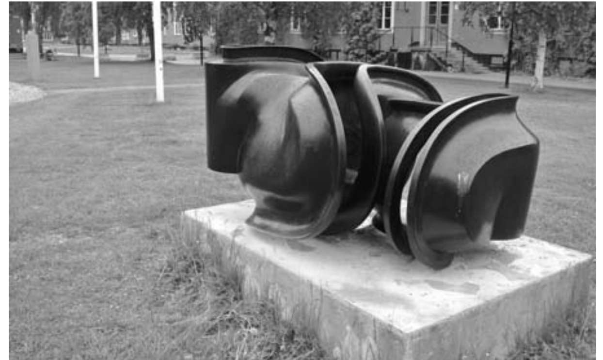
Tony Cragg: Stevensson.

einem Museum für Kunst und visuelle Kultur auf dem „künstlerischen Campus“, einer Fläche mitten in der Stadt auf dem alles in allem vereint ist: Ausbildung, Forschung, Unternehmensgründung und künstlerische Entwicklungsarbeit im Bereich Architektur, Design, Fotografie und freie Kunst, zentral am Ufer des Umeälven gelegen. Ende November 2014 wird das Kulturhaus Väven, das auch für Ausstellungen geplant ist, eröffnet.