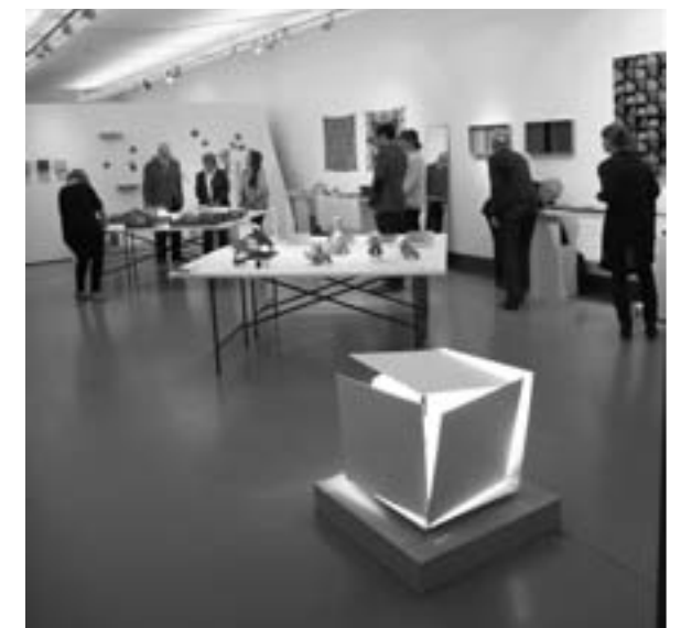
... Tragbares, Wohnliches