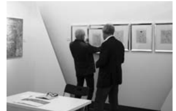
Der prüfende Blick