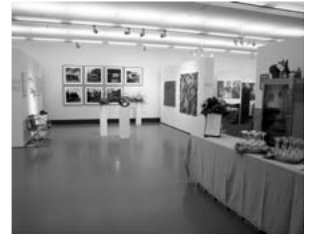
Gemälde, Skulpturen, Fotografien und natürlich Wein