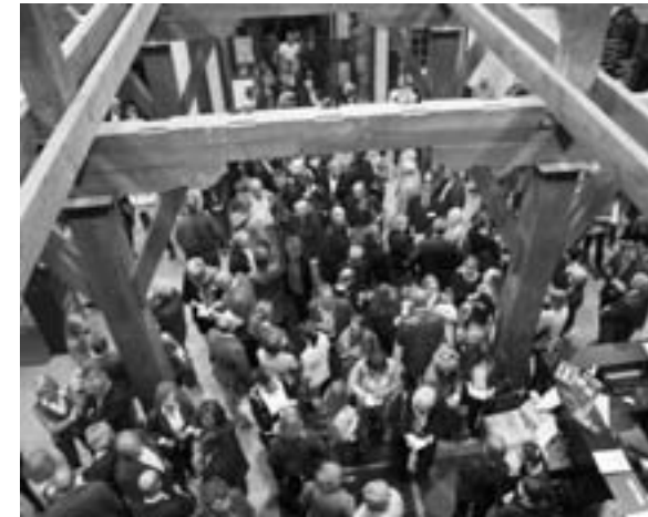
Publikumsandrang zur Vernissage