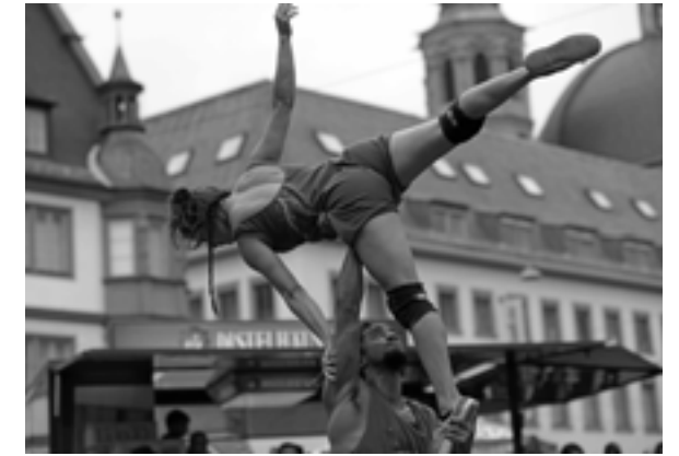
Brasilianische Akrobatik und Tanz mit Cia Delpraka