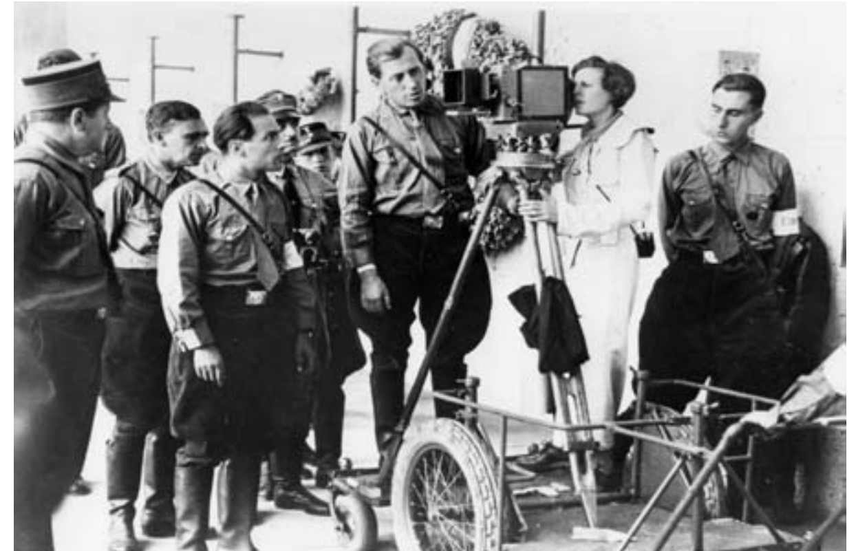
Leni Riefenstahl bei den Dreharbeiten ihres Films