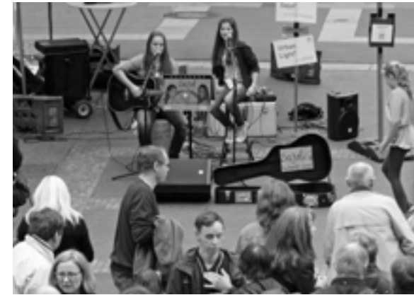
Sajul - das Geschwisterduo aus Assamstadt

Das Stramu mausert sich immer mehr zum genreübergreifenden Event, welcher nicht nur der Musik, sondern auch den anderen „Straßenkünsten“