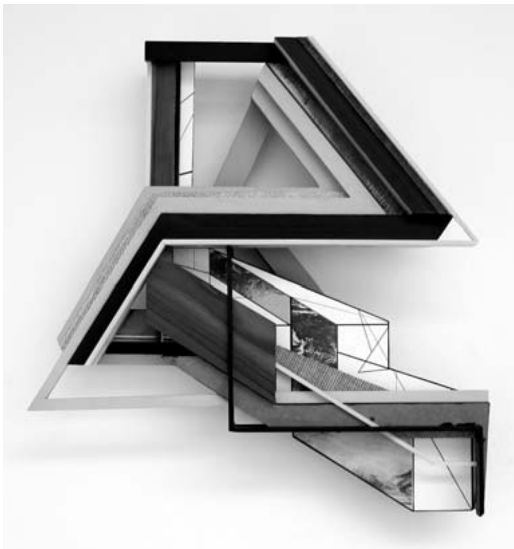
Zwei Fotos - aber das gleiche Kunstwerk aus Holz, Farbe, Klebefolie und Digitalprint.

nem recht pragmatischen Sinn. Hierbei schöpft Nicole Nickel aus einem großen Fundus an Fotos und Scans, auf denen beispielsweise Oberflächenstrukturen aus Natur und Alltag zu sehen sind. Zusammen mit Siebdruckausschnitten sorgen diese und andere Elemente für graphische Momente in ihren Werken, die mitunter wie Skulpturen von der Wand in den Raum kragen.