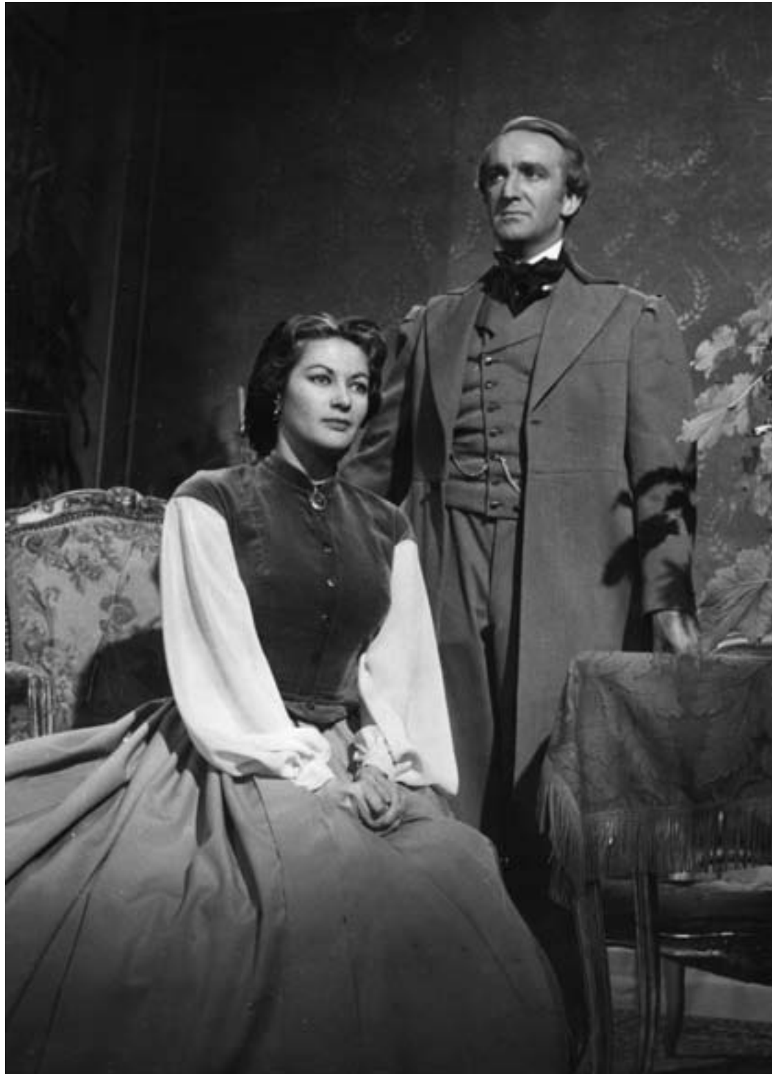
Nicht „Vom Winde verweht“, sondern „Richard Wagner und die Frauen“ von 1954/55 Abb.: Deutsches Filminstitut

chen gedreht wurde, sondern laut Herbert Heinzelmann auch in Rothenburg ob der Tauber. „Aber darüber spricht vor Ort natürlich keiner“, so Heinzelmann weiter. Die unverkennbare Silhouette der mittelfränkischen Stadt ist in dem Film zu sehen, als ein HJ-Trupp durch die fränkische Landschaft zieht. „Haben wir nicht ein schönes Vaterland?“ fragt der Scharführer die Hitlerjungen angesichts dieses fränkischen Idylls. „Begreift ihr jetzt, warum zwei Millionen deutsche Männer und Frauen ihr Leben opfern mußten...“ Und in diesem Stil geht das so weiter. Rothenburg o.d.T. war bereits zur Zeit der Weimarer Republik eine Hochburg des Nationalsozialismus. Beim Publikum fand der Film „S.A.-Mann Brand“ wenig Anklang, Goebbels bezeichnete das Werk später als „nationalen Kitsch“.