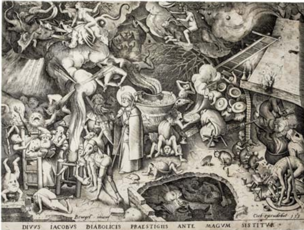
Der heilige Jakob besucht den Zauberer Hermogenes; Kupferstich nach Pieter Bruegel d.Ä.

Die Ausstellung zeigt an exemplarischen Einzelfällen, welche haarsträubenden Vorwürfe zu einer Anklage reichten: Da habe eine Frau ihrem Nachbarn die Manneskraft weggezaubert oder das Vieh krank gemacht, schlechtes Wetter herbeigeführt oder einen Weinkeller ausgesoffen oder gar eine Hostie ausgespien (es war ihr nur schlecht geworden). Auch Hebammen lebten gefährlich, ebenso Frauen mit roten Haaren oder einer Katze oder solche, die sich mit Heilkräutern auskannten. Unter dem Deckmantel der Frömmigkeit verschonten die Hexenjäger auch Schwangere nicht oder sogar den 16jährigen Neffen des Fürstbischofs; ein angeblich unsittlicher Lebenswandel gereichte einem Geistlichen zum Verhängnis. Schon aus Angst vor den Folterqualen erfolgten „Geständnisse“. Die Folterwerkzeuge, die Knochen brachen oder Sehnen reißen ließen, jagen