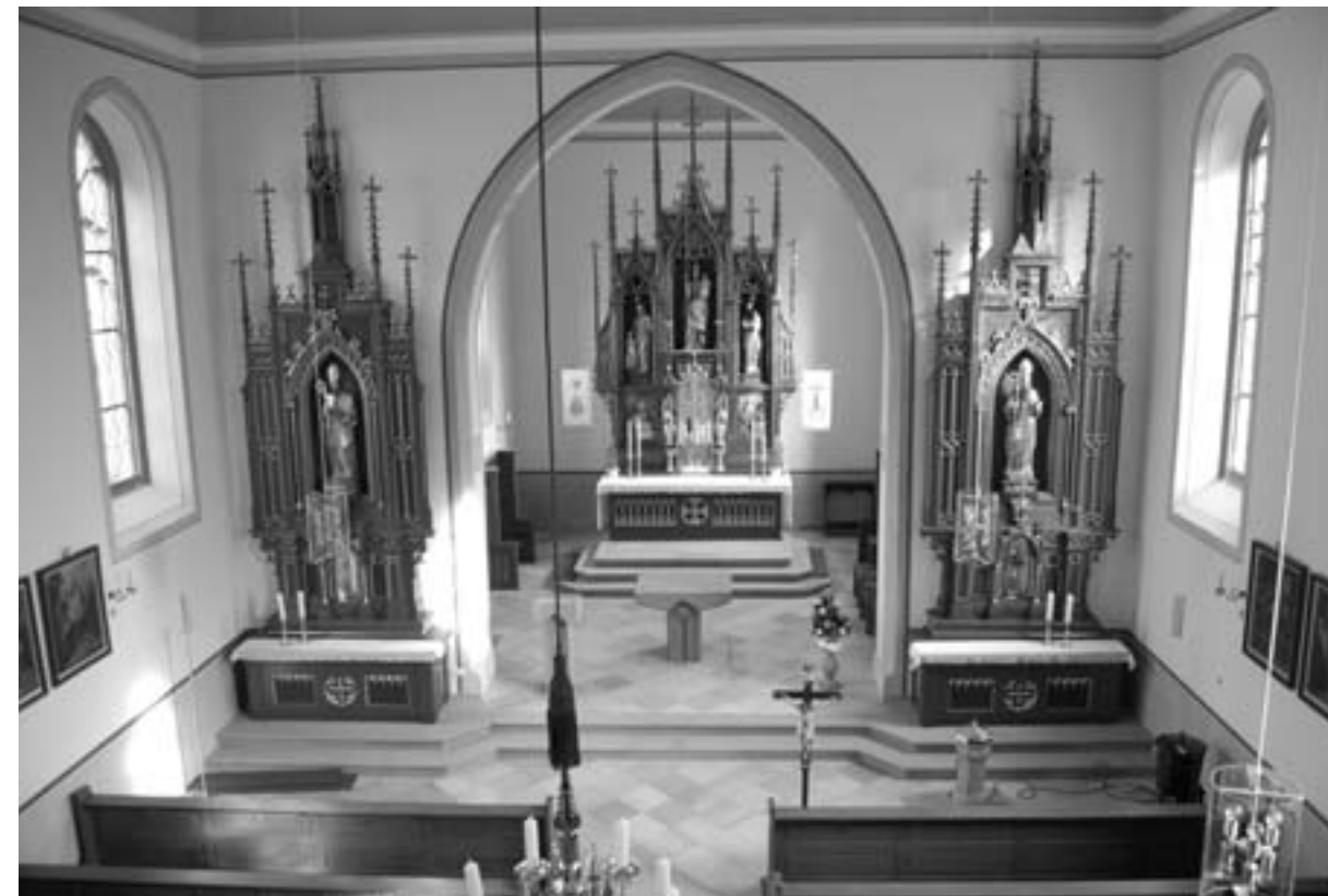
Schleerieth - Blick auf Altäre

Wie fragil die mit Gewalt aufrecht erhaltene innere Ordnung der deutschen Staaten war, zeigt sich im Revolutionsjahr 1848, nachdem schon 1830 mit den Juliunruhen in Paris und 1832 dem Hambacher Fest die Fundamente bebten. Ludwig I. mußte zurücktreten, die Affäre mit Lola Montez war nur der Auslö-