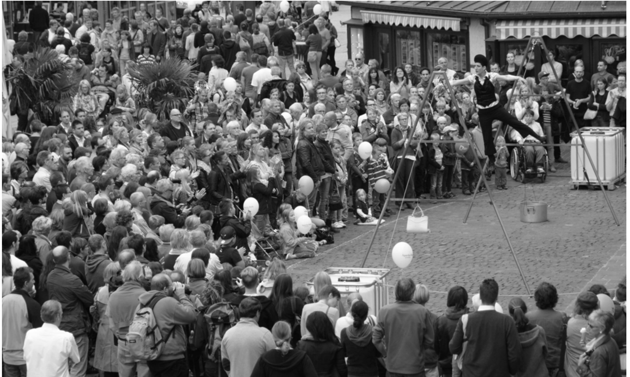
Ein theatralischer Balanceakt mit dem Kölner Rope Theatre