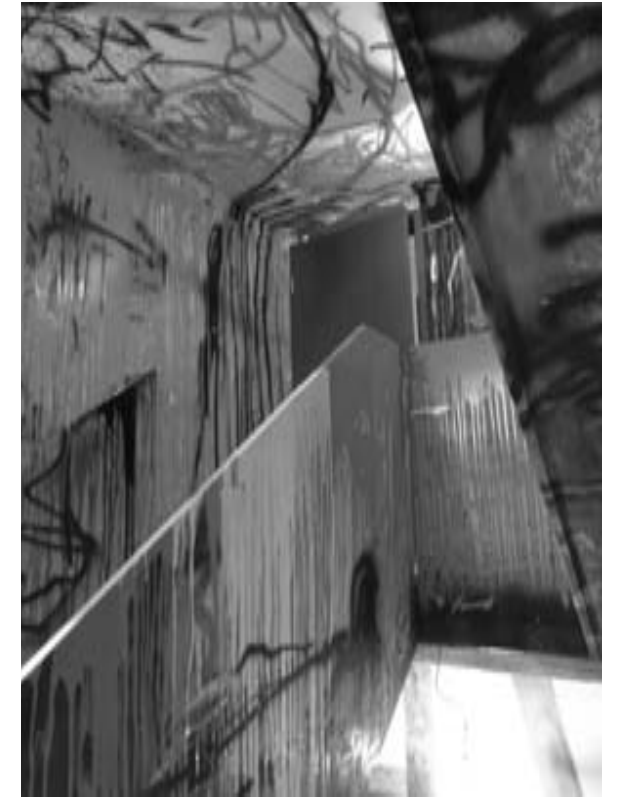
So sieht ein Farbrausch von Thomas Lange in Schwarzweiß aus.

Die Farben sind in mehreren Ebenen aufgetragen, teils flächig, teils wie Graffiti zeichenhaft gesprüht. Die Textur der Flächen wechselt von matt und stumpf zu glatt, dazwischen immer wieder offen, unbehan-