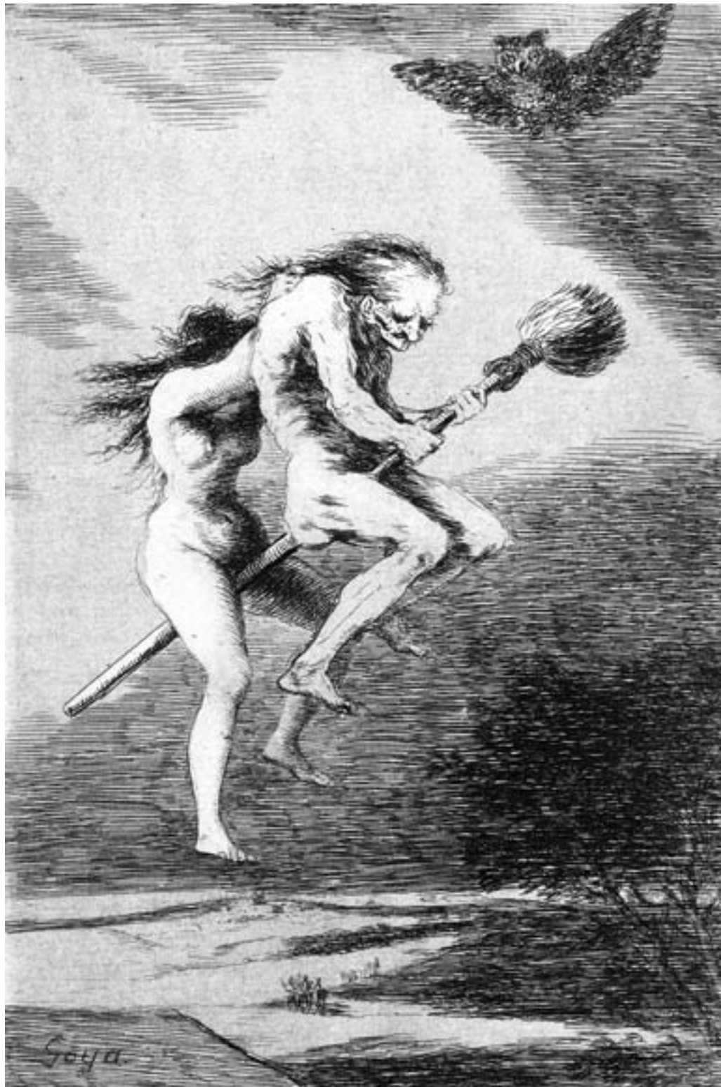
Hexenbesen taxi gab's schon 1799. Eine Aquatintaradierung von Francisco de Goya