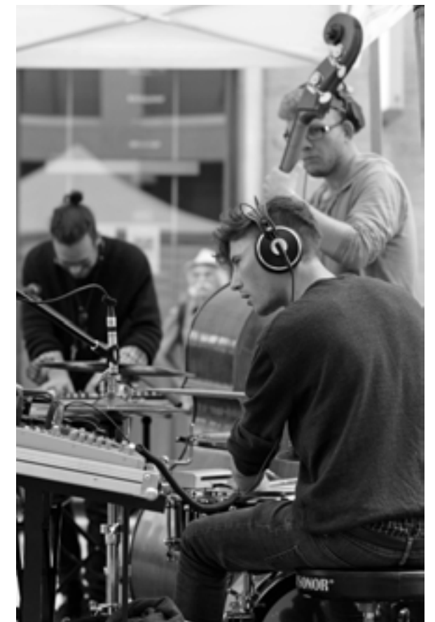
Lektron Feat. MC Nyce - Loop Jazz aus Mannheim