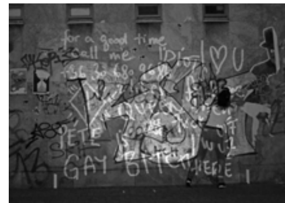
Eine Tanzperformance von Bandart Productions aus Ungarn

ein Forum bietet. So hinterlassen Graffiti-Künstler auf ausgewiesenen Flächen ihre phantasievollen, gesprühten Bilder von beachtlicher, künstlerischer Qualität. Viele Open Air Präsentationen sind mitun-