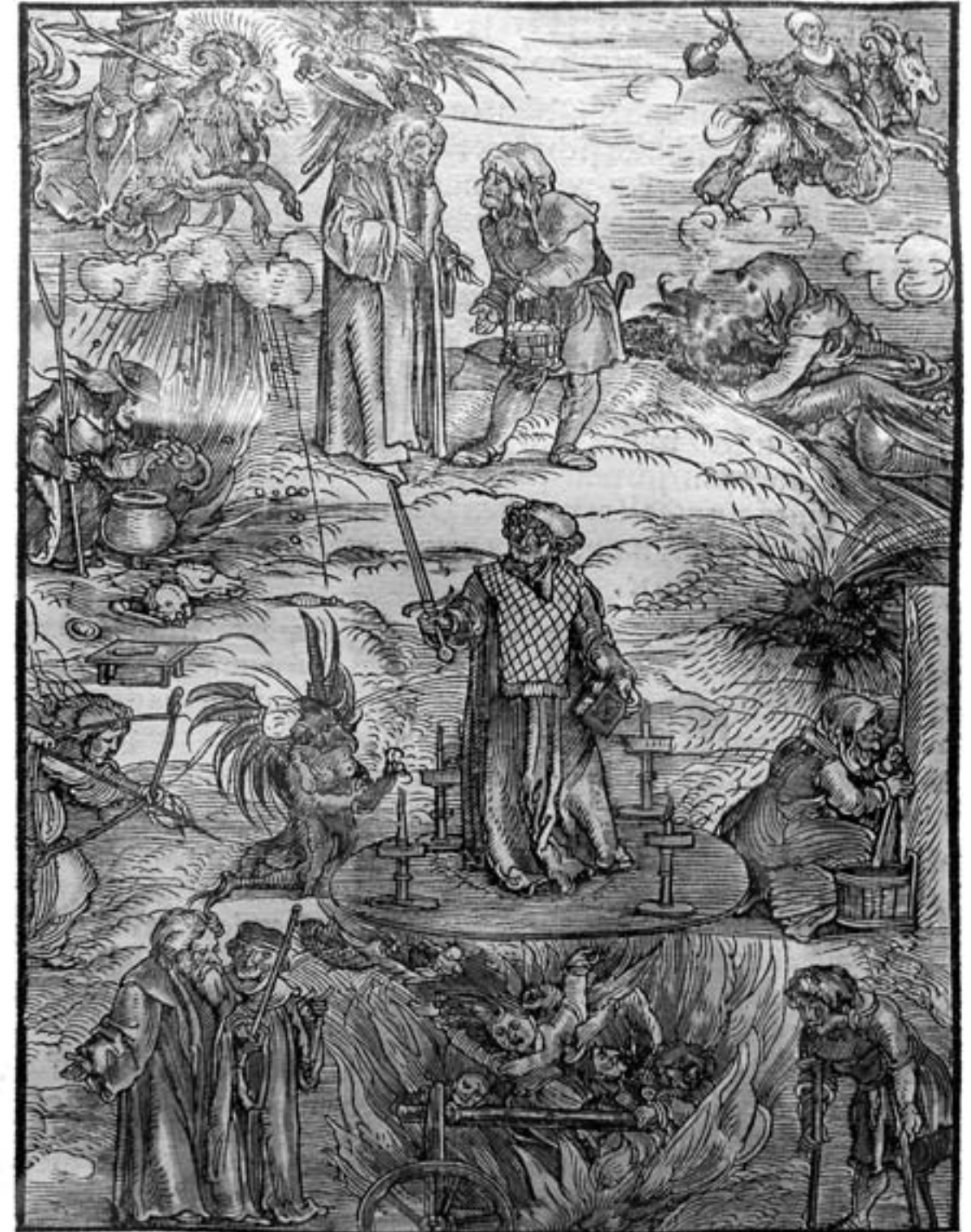
Hexerei- und Zaubereidarstellung; Holzschnitt von Hans Schäußelein; erstmals abgedruckt in New Layenspiegel 1511