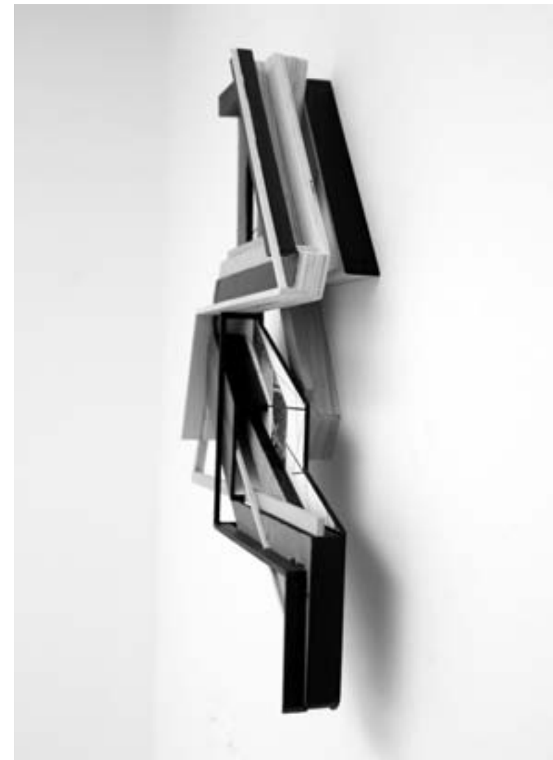
Der seitliche Blick zeigt die Vielschichtigkeit des Wandobjektes „Scat“.