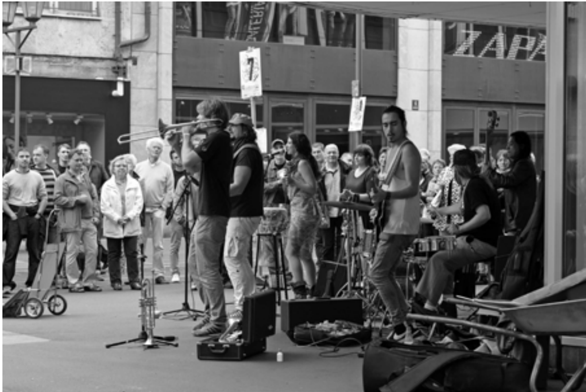
Palo Santo - Rhythmische Mestizo Musik aus Südamerika