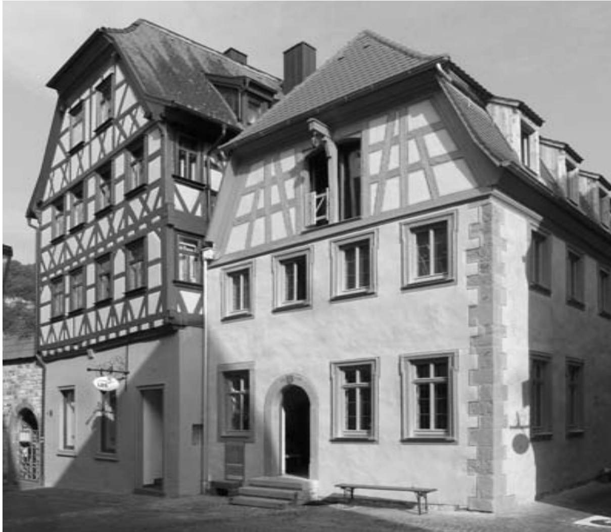
Das ehemalige Stapelrechts- und Handelshaus (rechts) in Karlstadt