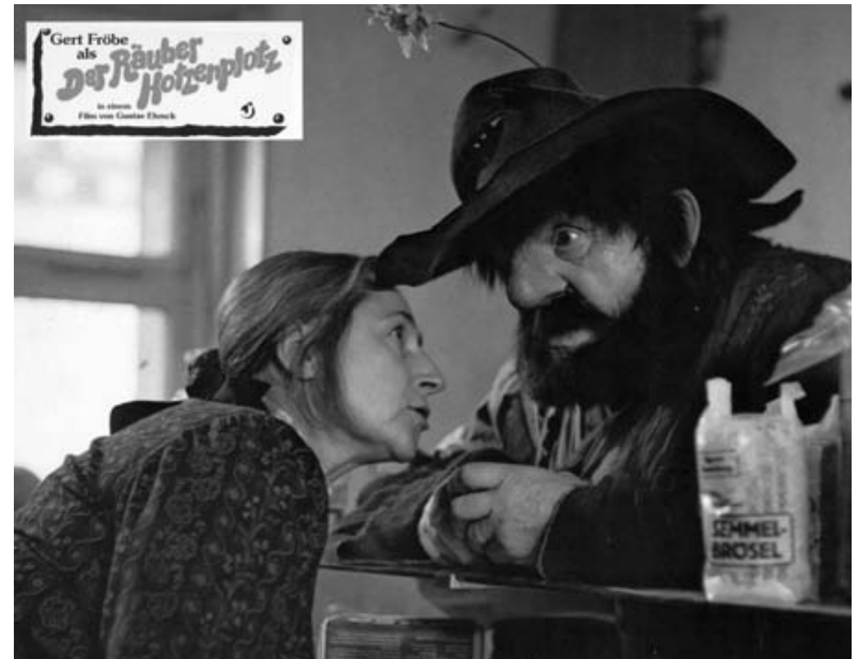
Gert Fröbe war der grimmige „Räuber Hotzenplotz“

Schein von Authentizität. Die Krise des Scheins, die ein Wesensmerkmal aller modernen Kunst ist, existiert im kommerziellen Kino nicht. Glaubwürdigkeit durch möglichst großen Realismus, lautet das Credo des Films seit seinen Anfängen. Experimentalfilme, die Surrealisten und die Dokumentarfilme sind hier die Ausnahmen, die die Regel bestätigen. Und diese Regel lautet, daß das Kino dem Publikum eine plausibel und glaubwürdig erscheinende Filmwelt präsentiert. Erreicht wird dies einerseits filmtechnisch, andererseits durch das erzählerische Element (der Plot, das Skript). Die wirtschaftlich erfolgreichen Filme sind immer noch das, als was Adorno das Kino insgesamt bezeichnete: eine „Mesalliance von Roman und Photographie“. Ob es sich hierbei stets um große Kunst handelt, darf getrost bezweifelt werden – auch wenn die Filmindustrie stets von neuem besonderen Wert darauf legt, Kunstwerke