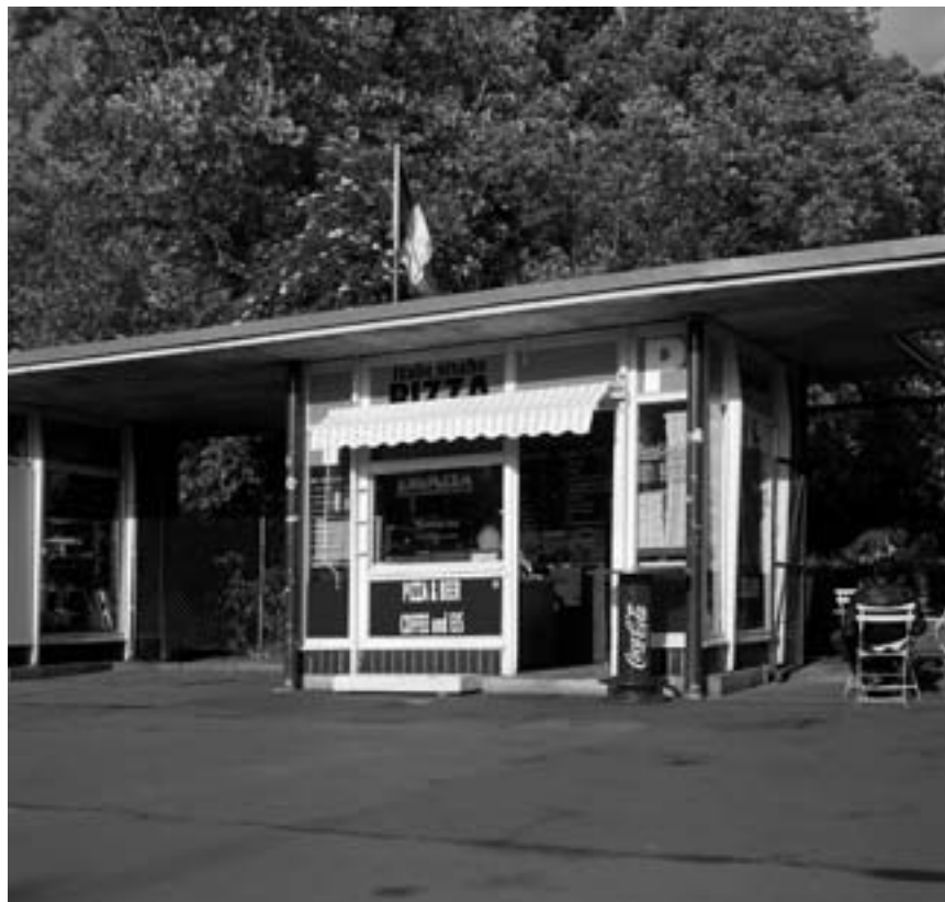
Beste Pizza am Bahnhof.