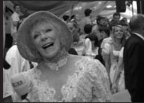
Elke Sommer verkleidet