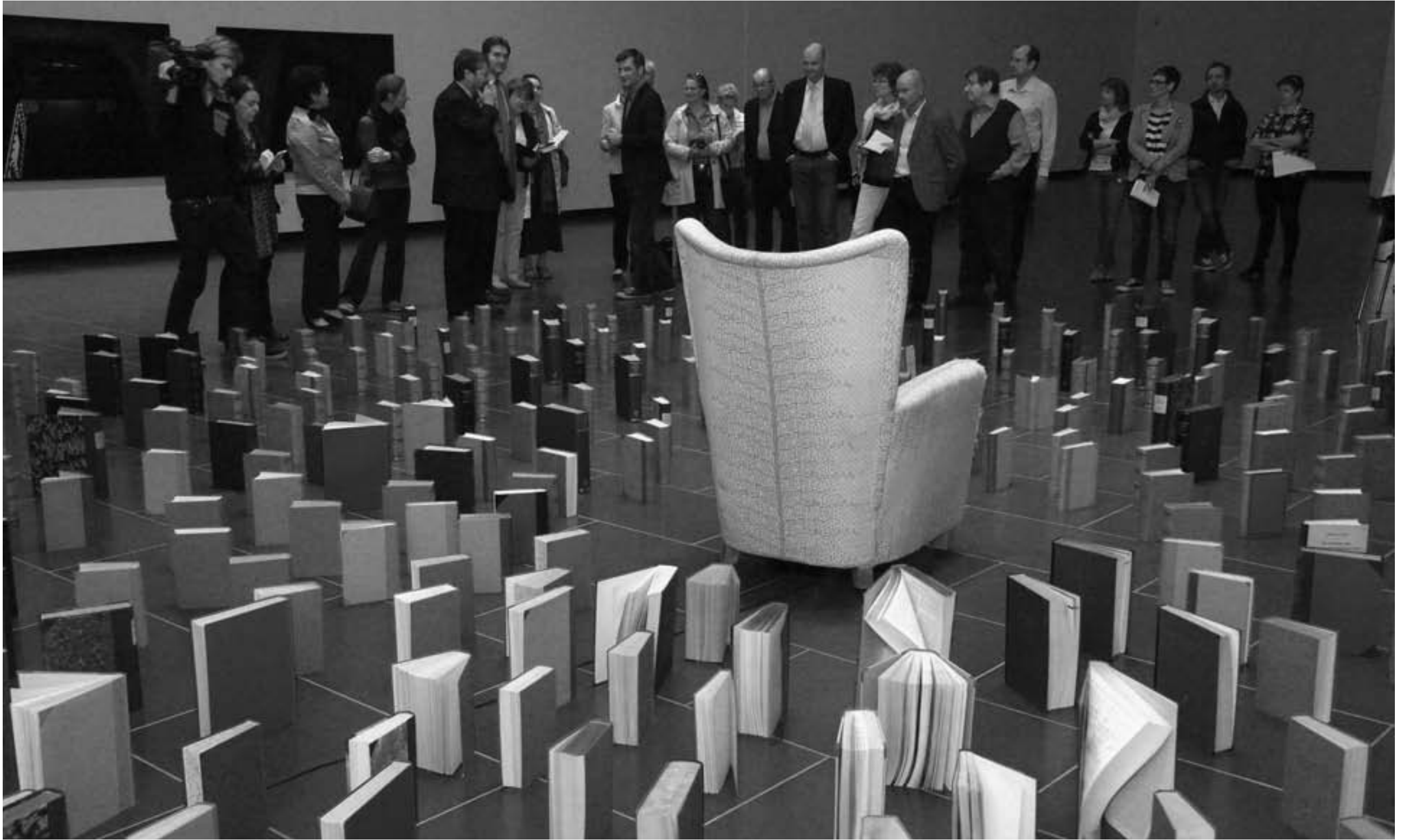
Begutachtung der Rauminstallation - das Publikum hat Zeit.