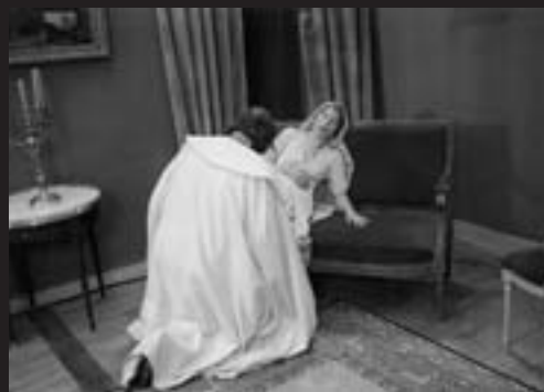
Die Marquise von O.