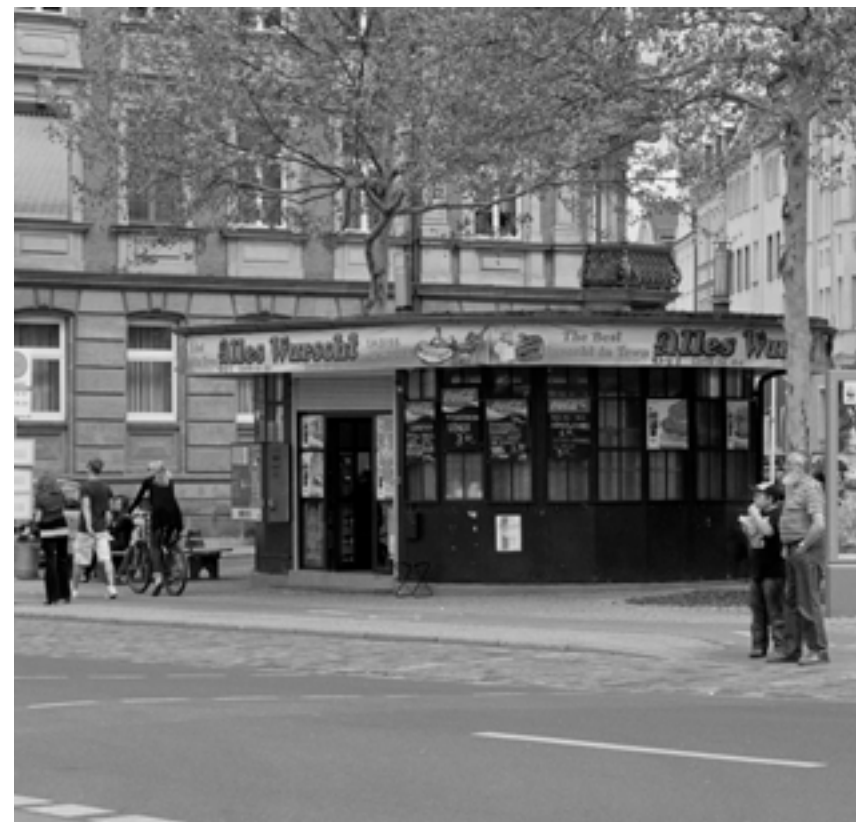
Hier -in Bamberg- ist eh alles wurscht

Ein Budenbetreiber, der die Currywurst frisch zubereitet, hat seine Bestimmung verfehlt. Sie muß tagelang auf dem Rost liegen, muß triefen vor Fett in völlig ausgetrockneter Rinde und darf nur noch mit viel Ketchup und Curry-Granulat als Lebensmittel durchgehen. Ähnlich: Das Döner oder der. Meist steht es in der Ecke wie ein offenes Bein, von