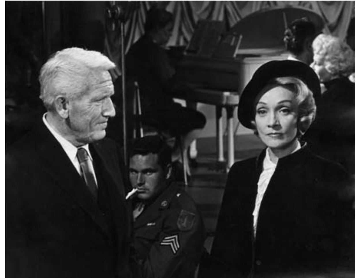
Spencer Tracy und Marlene Dietrich in „Das Urteil von Nürnberg“

Weit über 60 Kinofilme sind in den vergangenen Jahrzehnten in Franken gedreht worden. Und wer nachfragt, erhält von den Franken vor Ort gerne und bereitwillig Informationen über Filme, die im Heimatort ganz oder teilweise entstanden. Freilich, wer die Region Franken mit seinen idyllischen Flußläufen von Regnitz, Pegnitz und Main, seinen sanften Mittelgebirgserhebungen sowie seinen mittelalterlichen und frühneuzeitlichen Stadtansichten als Filmkulisse würdigen will, kann niemals Anspruch auf erschöpfende Vollständigkeit erheben. Doch immerhin waren einige der in Franken gedrehten Zelluloidstreifen nicht nur internatio-