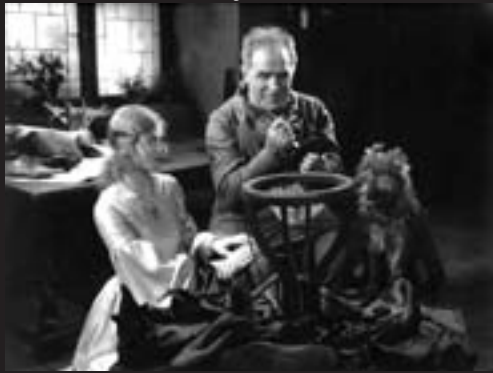
Der Meister von Nürnberg