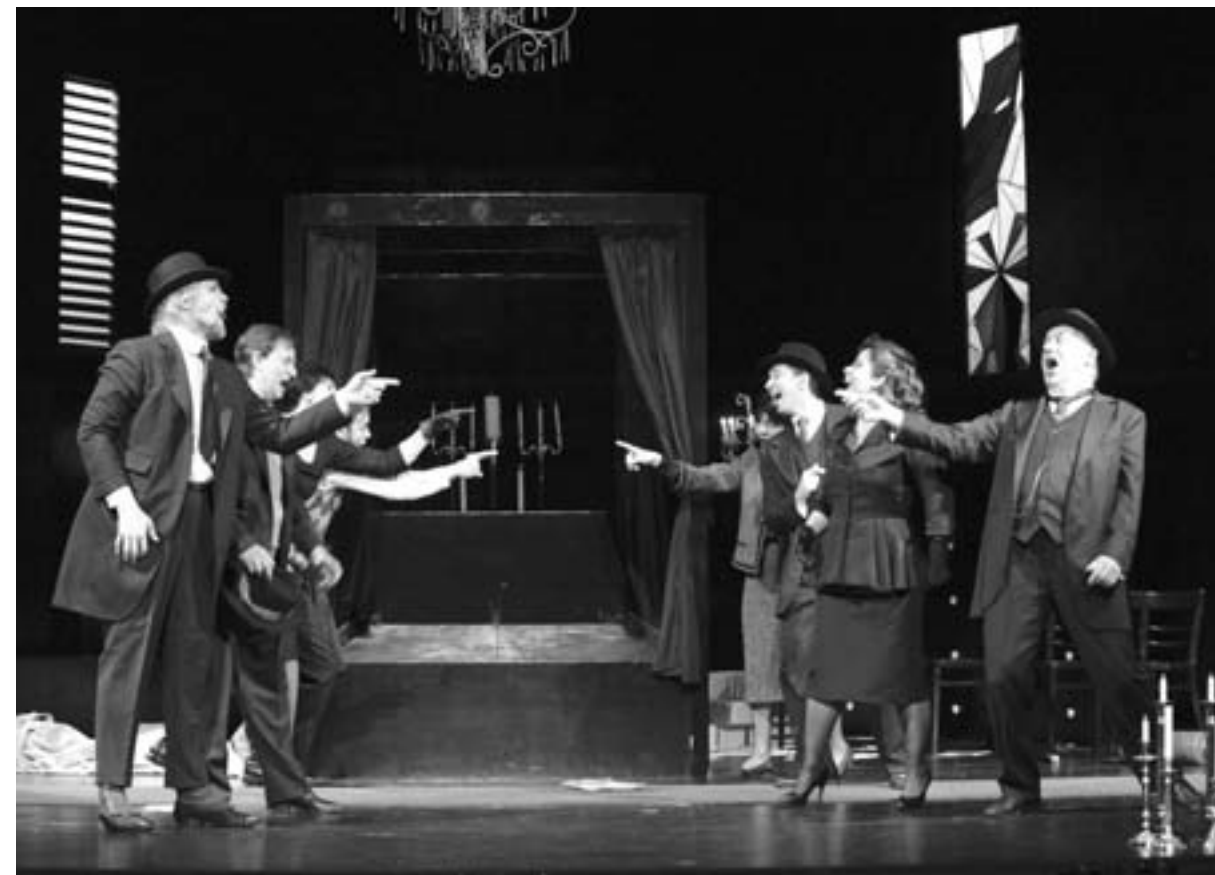
Das Ensemble in Gianni Schicchi

Es sollte also Theater über Theater im Theater sein – etwas verwirrend. Ein Regisseur, der im Prolog dem Publikum das Vorhaben seiner Aufführung erläutert hat, war gleichzeitig im Stück auch der Sänger Tonio und später, im 2. Akt, der Diener Taddeo in der Komödie. Er mußte also ständig die Rollen wechseln.