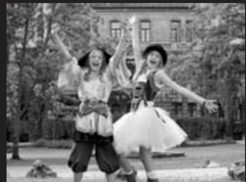
Hanni und Nanni