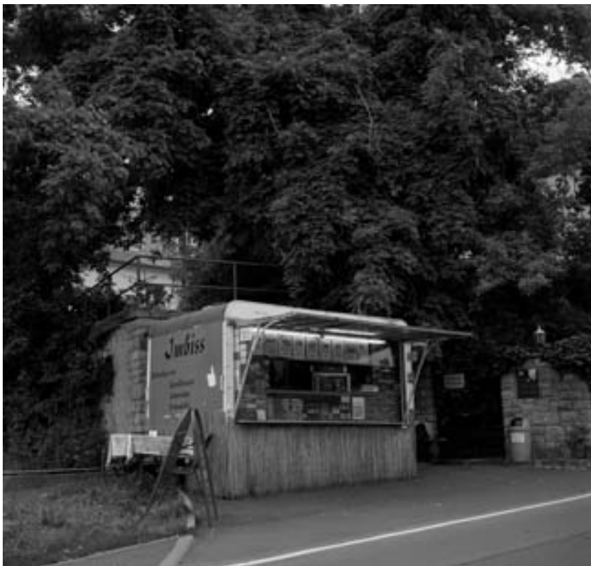
Diese s Amüseum in Grombühl konnte nicht mehr gerettet werden.