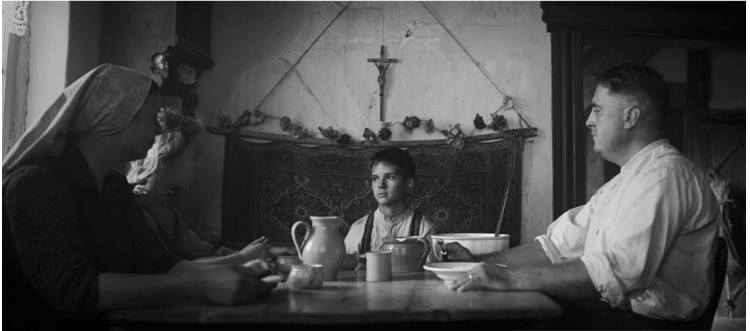
Aus dem aktuellen Film „Lauf Junge lauf“ von Pepe Danquart, gedreht im Freilandmuseum Bad Windsheim.