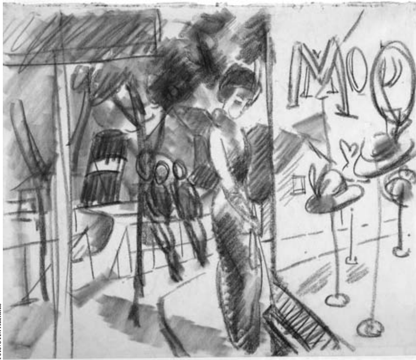
August Macke, Modegeschäft am Hafen, 1914, Landesmuseum für Kunst und Kulturgeschichte, Oldenburg

Außer einer berückenden Bleistiftzeichnung dreier Männerköpfe von Adolph von Menzel, entstanden 1890, als der Künstler die Malerei längst aufgegeben hatte und sich fast manisch der Graphik widmete, bleibt die zweite Hälfte des 19. Jahrhunderts seltsam still. Doch dann wieder ist eine ganze Koje mit Edvard Munch (1863 - 1944) bestückt, die in fünf Beispielen die Hauptthemen und -techniken Munchs belegen. Weil der von den „Brücke“-Künstlern verehrte Norweger wohl 30 000 Abzüge von rund 500 Graphiken zog, begegnet man ihm unumgänglich in fast jedem Graphikkonvolut. Auch hier sind solche Schlüsselwerke, wie „Pubertät“ (Radierung 1902),