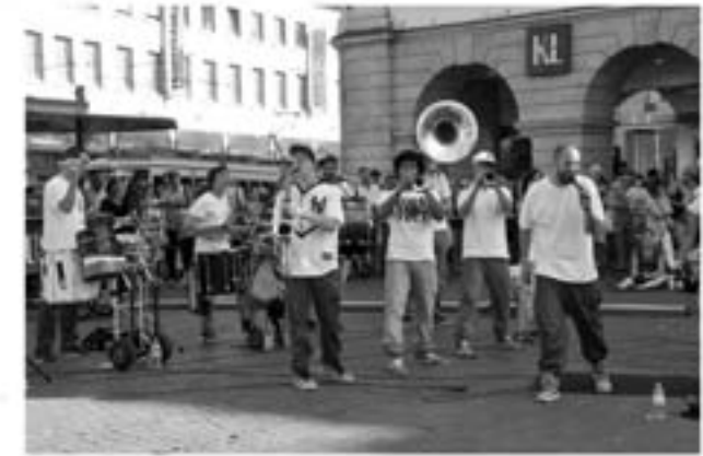
Pullup Orchestra, Schweiz