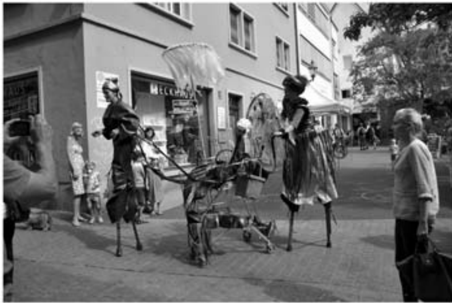
Stiltlife aus Amsterdam

B isweilen tönt, dröhnt, klimpert, zupft, trällert und scheppert es in der Stadt an allen Ecken und Enden. Die Konzert- und Festivalflut schwappt unaufhaltsam durch Würzburg. (Und weil das nicht reicht, braucht's auch mindestens noch diverse Weinfeste, Weinparaden, Open Air Events für blaue Zipfel.)