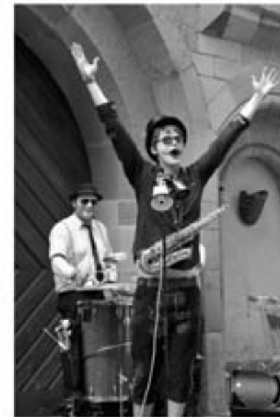
The Instant Voodoo Kit