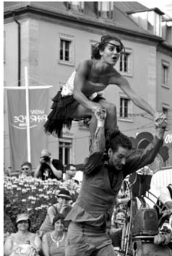
Die Firebirds in Aktion

Die vielen zigtausend Besucher – in Würzburg greift man diesbezüglich gerne zum geschätzten, sechsstelligen Superlativ – waren begeistert von den Darbietungen, und unser Fotograf, selbst kein Hüne von Gestalt, fand, so erzählte er uns jedenfalls, manchmal kaum ein Durchkommen durch die Besuchermassen. ¶ [as]