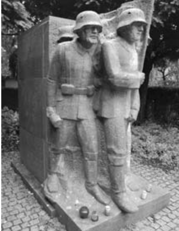
Kriegerdenkmal in Volkach von Fried Heuler (1935)

unmöglich und weitab von jeder realer Trauer. Allerdings wies Bogumil zu Recht auf den größten Unterschied zwischen dem Volkacher und dem Würzburger Denkmal hin. Denn zwar tragen die Soldaten sowohl in Würzburg wie auch in Volkach Stahlhelme aus dem Ersten Weltkrieg, und daß die Würzburger Soldaten weite Mäntel tragen, während sie in Volkach Felduniform anhaben, ist nicht so augenfällig wie der Umstand, daß die Würzburger Soldaten keinerlei Waffen bei sich führen, während es in Volkach anders aussieht: Einer der Soldaten des Volkacher Denkmals hat sogar eine Handgranate in der Hand. Dadurch wird das Volkacher Denkmal – trotz des bodenständigen Muschelkalks – modern-militaristischer, als es das Würzburger Denkmal ist. Doch der Grundzug einer gesuchten, den Betrachter erschlagenden Monumentalität ist auch dem Würzburger Denkmal zu eigen, das freilich weniger platt aggressiv daherkommt als das Volkacher, bei dem das Würzburger Motiv des Lastentragens an nach vorne gerichteter Dynamik gewinnt, die auf einen imaginären Feind hin ausgerichtet ist.