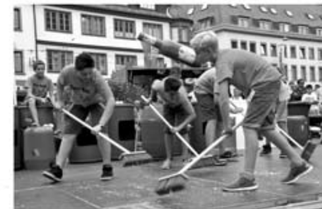
Four-Beat, Rhythmus mit Besen