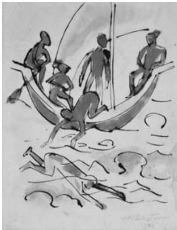
Badende, Palau 1914, Feder und Aquarell, Privatbesitz

miteinander und mit der Natur lebten. Leider war dies auch nur ein Traum, denn als er dort war, sozusagen auf den Spuren Paul Gauguins, war das Paradies schon verloren. Eigentlich ist es verwunderlich, daß die enge Verknüpfung von Reisen und künstlerischer Arbeit bei Pechstein noch nie thematisiert wurde. Diesem wichtigen Aspekt widmet sich nun die Ausstellung „Pechstein auf Reisen – Utopie und Wirklichkeit“ im Würzburger Kulturspeicher, die vorher in Stade und Zwickau zu Gast war. Nach den jeweiligen Aufenthalten gehängt, kann der Besucher anhand vieler noch nie öffentlich gezeigter Werke Entwicklung und Schaffen des Künstlers begleiten. Lockere Skizzen, Aquarelle, kantige Holzschnitte, illustrierte Reisetagebücher, bemalte Postkarten und farbgesättigte Ölbilder führen den Betrachter durch die einzelnen Stationen, von den Moritzburger Seen, wo er sich mit seinen Brücke-Kollegen zum Malen traf, von Nidden am Kurischen Haff, über Leba in Pommern, wo er in Abgeschiedenheit über Jahre hinweg unermüdlich arbeitete, über Monterosso al Mare in Ligurien bis zu den Pyrenäen oder in die Schweiz an den Genfer See, wohin er eingeladen war. Der eigentlich länger geplante Aufenthalt auf Palau, vorfinanziert durch seinen Galeristen, fand durch