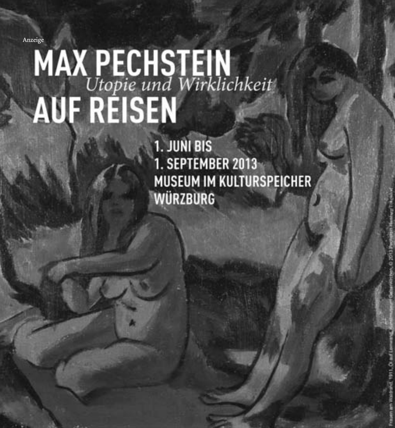
Frauen am Walstrand, 1911. Öl auf Leinwand, Kunstmuseum Gelsenkirchen, © 2013 Propädeutik Verlag, Tübingen

1. JUNI BIS 1. SEPTEMBER 2013 MUSEUM IM KULTURSPICHER WÜRZBURG