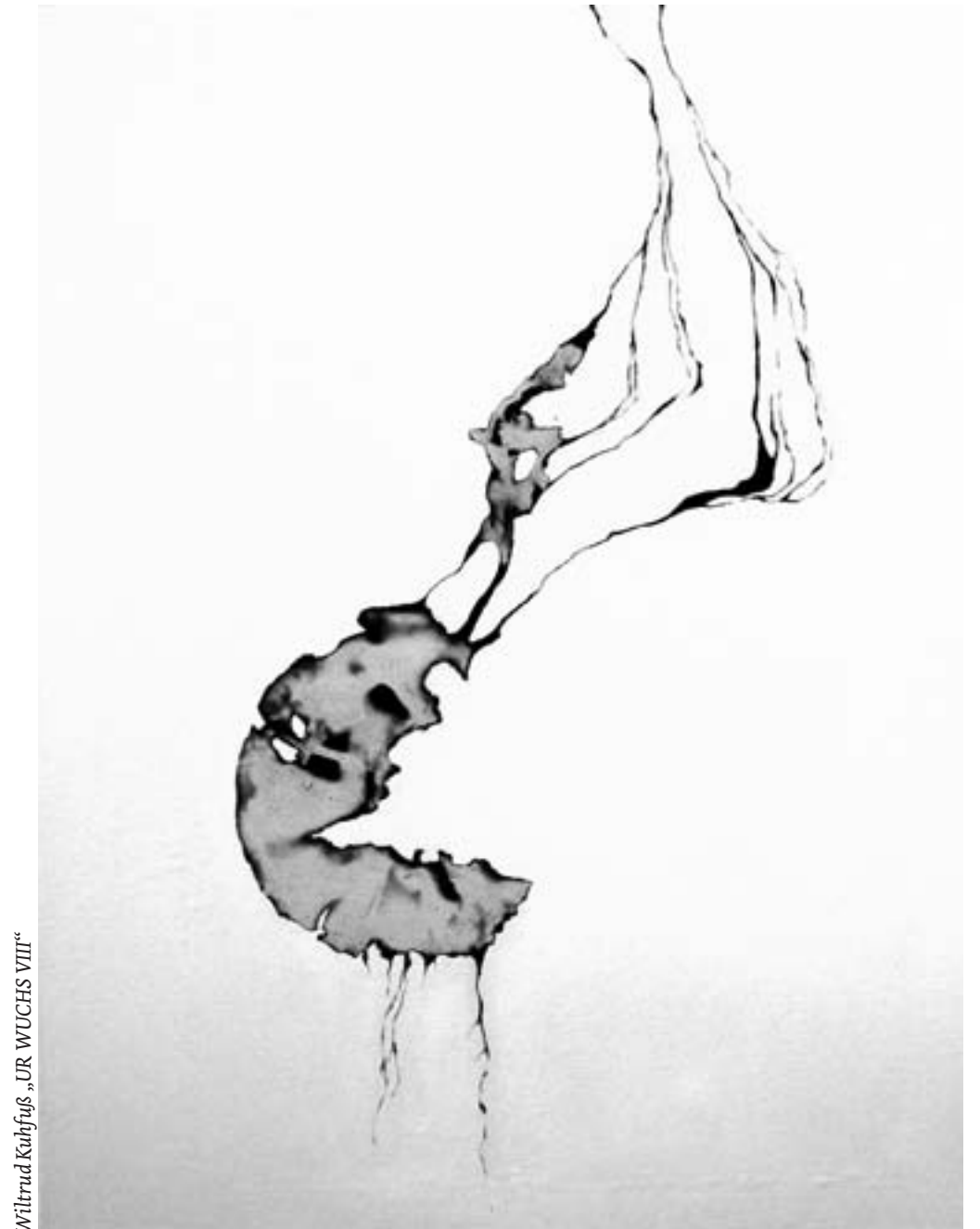
Wiltrud Kuhfuß „UR WUCHS VIII“

Altar gelegt und als Symbole für das Ende alles Organischen inszeniert: Es ist nicht viel, was am Ende des Lebens bleibt. Aber es wirkt tröstlich. In den vier ausgelegten großen Werkbüchern, in denen in Zeichnungen und Collagen die großen Themen vorbereitet wurden, darf geblättert werden. ¶