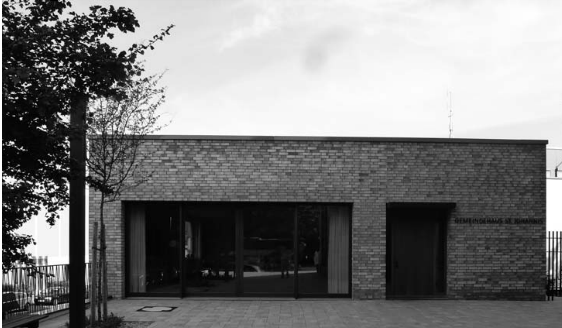
Das neue Gemeindehaus

Klinkern zeigt. Das Rot und Grau der Steinquader aus der Ruine des Vorgängerbaus zusammen mit den Klinkern erzeugt ein lebhaftes Farbspiel. Riemerschmid ist ein Bau gelungen, der Neues und Altes zu einer geschlossenen Einheit verschmolzen hat. Die Erinnerung an die Geschichte der Kirche ist ablesbar und doch ist sie unverkennbar in der Zeit nach dem Krieg. Damit besetzt sie einen besonderen Platz in der Diskussion der Erbauungszeit, die ja wesentlich um die Frage kreiste, ob Wiederaufbau oder Neubau der zerstörten Orte und Städte richtiger sei. Heute ist die unverwechselbare Silhouette der Kirche weit hin über die Stadt