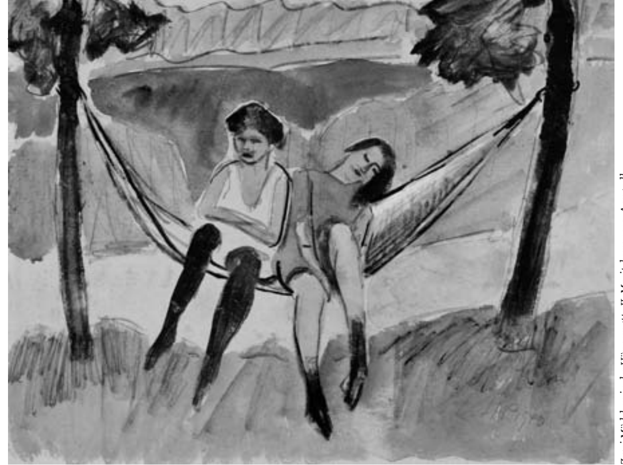
Zwei Mädchen in der Hängematte II, Moritzburg 1910, Aquarell