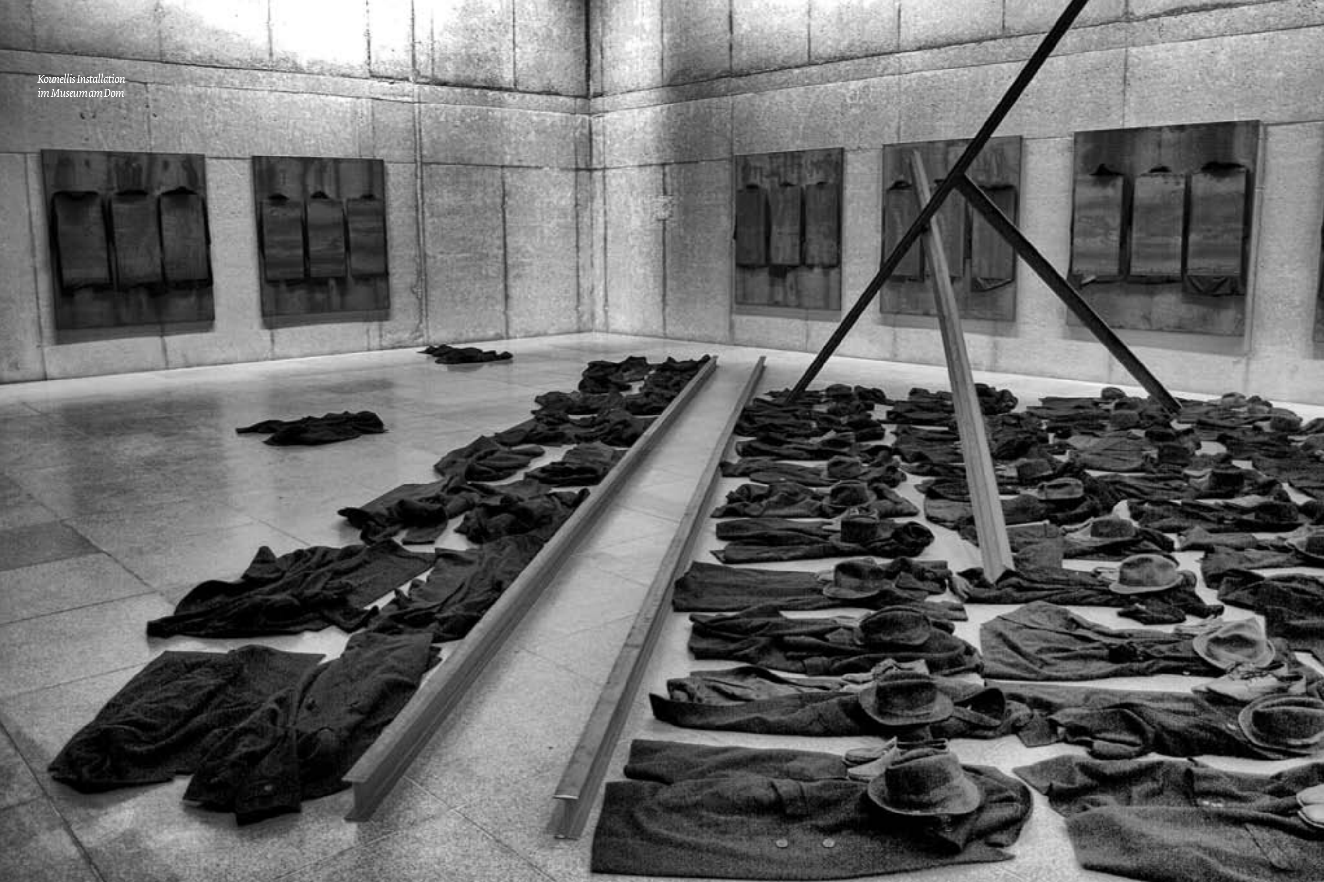
Kounellis Installation im Museum am Dom