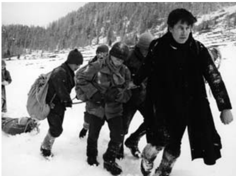
Szene aus dem großartigen Film „Schwabenkinder“ - rechts: Tobias Moretti

1908 sorgte der Artikel eines Kaspar Reiter in einer amerikanischen Zeitschrift in Deutschland für Aufsehen, der das berühmte „Schwabengehen“ tiroler Bauernkinder zum mit einem Sklavenmarkt verglichenen Kindermarkt in verschiedenen Städten Oberschwabens anprangerte. Es dauerte freilich noch bis 1940, bis diese Form der Kinderarbeit endgültig abgeschafft war. Seit dem 16., vor allem aber im 19. Jahrhundert, haben alljährlich Anfang März einige Tausend Kinder zwischen fünf und 14 Jahren aus tiroler und schweizer Bauerndörfern den beschwerlichen und gefährlichen, mitunter Hunderte Kilometer (z.B. aus dem Vintschgau) weiten Weg über die