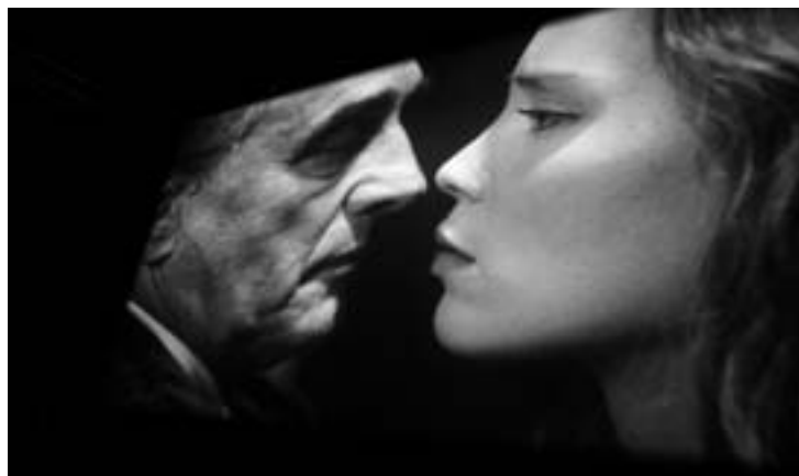
Szene aus „Leo und Claire“

Der Film erzählt die Geschichte des jüdischen Schuhfabrikanten Leo Katzenberger, der ein leerstehendes Fotoatelier an die angehende Fotografin Irene Scheffler vermietet. Obwohl verheiratet mag Leo Katzenberger etwas mehr als nur väterliche Gefühle zu der jungen, hübschen Frau entwickelt haben. Er hilft ihr, stundet ihr die Miete, gibt ihr Fotoaufträge, läßt sich selbst fotografieren, führt sie auch einmal aus, besucht sie ab und an, auch abends. Was nun selbst Leos Ehefrau Claire mißtrauisch macht, ist für die ohnehin von Neid und Minderwertigkeitsgefühlen – ganz so wie es Götz Aly („Warum die Deutschen? Warum die Juden? Frankfurt a.M. 2011) lehrt – zerfressenen Nachbarn ein unmoralisches Verhältnis, zumal die Fotografin (im Film) die üble Nachrede dadurch bebildert, daß