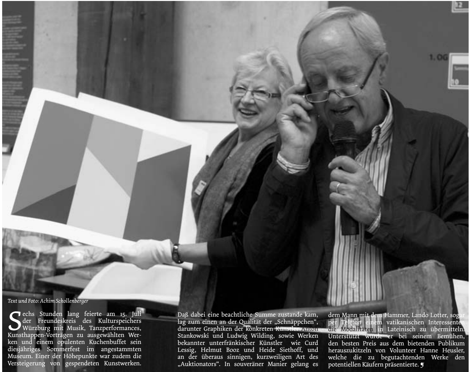
Text und Foto: Achim Schollenberger

Infos unter: Tel: 0 93 21/59 68, kunstkraempel@web.de , www.wuerzburg.ihk.de