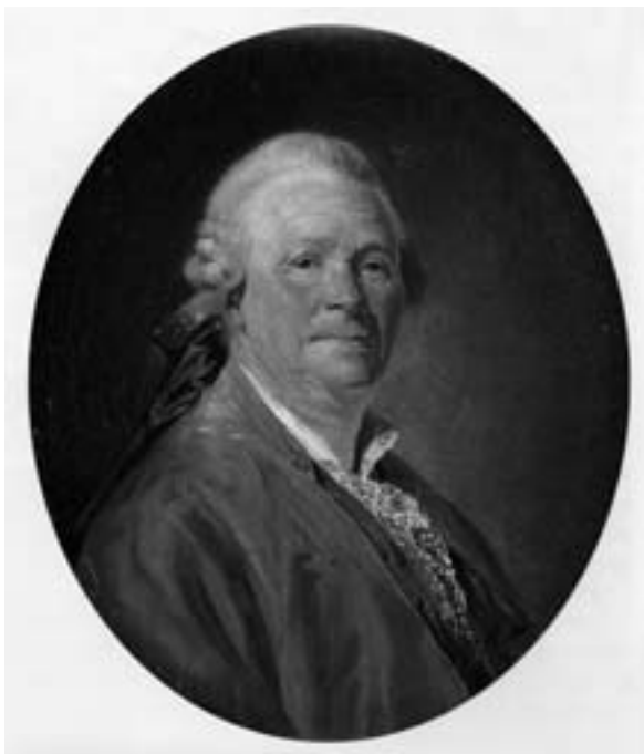
Porträt von Christoph Willibald Gluck

ein paar kleinen, musikalischen Lücken im Manuskript des vollständig erhaltenen Librettos. Warum die Telemann-Oper in Vergessenheit geriet, hängt wohl auch mit dem zusammen, was Johann Mattheson, der damalige Hamburger „Musikpapst“ als „Mischmasch“ abqualifizierte: Telemann benutzte nicht nur die deutsche, italienische und französische Sprache, um die diversen wechselnden Gemütsverfassungen der Akteure zu kennzeichnen, er schöpfte auch aus diesen drei nationalen Musikstilen die Anregungen für die oft virtuoseren Arien und die Chöre (die vor allem im französischen Stil). Darin zeigte sich eine gewisse psychologische Raffinesse. Sogar tragikomische Elemente baute er in Nebenhandlungen ein. Ob all dies der Grund war, warum die Oper nach 1736 nicht mehr auf die Bühne fand, ist heute nicht mehr nachzuvollziehen. Daß die Orpheus-Oper von Rossi heute nahezu vergessen ist, hat wohl ihren Grund in der ursprünglichen Länge – etwa sechs Stunden – und in ihrem eher konventionellen Stil. Im Würzburger Theater in der Bibrastraße fand nun eine gelungene Kurzfassung von nur zwei Stunden statt. Anders als ihr „Original“, das von der französischen höfischen Zuhörerschaft einst als eintönig, zu wenig dramatisch und unglaublich empfunden wurde, war dieses „ausstaffierte Skelett“ der ursprünglichen