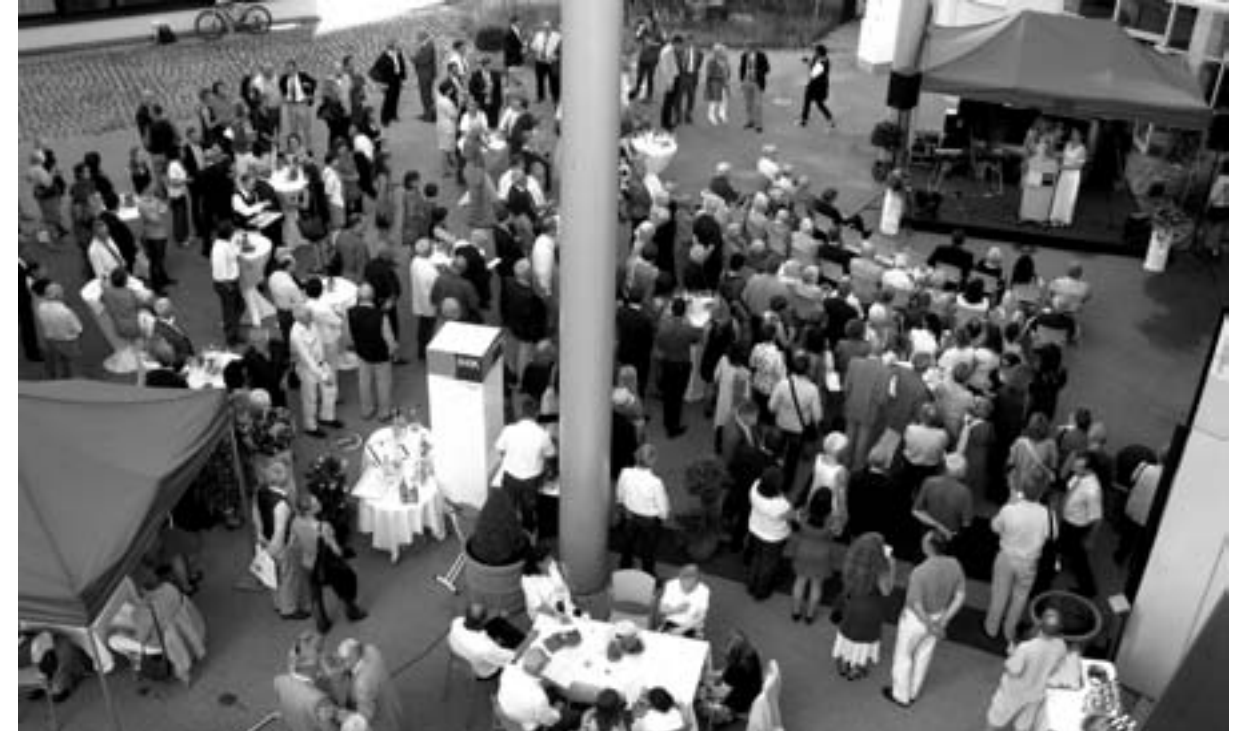
So feiert Kunst.