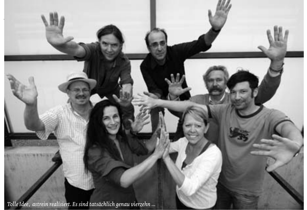
Tolle Idee, astrein realisiert. Es sind tatsächlich genau vierzehn ...

bewacht, die die Besucher nur selektiert und tropfenweise in den Ausstellungsraum einließen. Man kann sich vorstellen, wie die Stimmung in der langen Schlange der noblen Kunstjetsetter und Kunsttrendsetter war. Wer es nach sehr, sehr langem Warten endlich in den Ausstellungsraum geschafft hatte – sah : nichts. Der ganze Raum war in dieses süffige, sehnsuchterweckende, mediterrane, grenzerweiternde Yves-Klein-Blau-Licht (er hatte sich die Farbe patentieren lassen) getaucht. Aber sonst eben nichts. Weiße Wände, keine Sitzgelegenheit, nicht mal ein Garderobenhaken. Nichts. Nur blaues Licht. Wer das nur liest und sich nicht die Beine in den Bauch stehen und im zwar Bodenlangen aber Schulterfreien frösteln muß, mag das zu Recht für erhellend, sehr witzig, sozialkritisch, richtig schön hinterfotzig halten. Vor allem ist es aber logisch. „Leere“ war angekündigt, „Leere“ wurde ausgestellt. Hier aber sind die Räume von BBK-Galerie und BBK-Werkstatt proppenvoll mit Objekten, Graphiken, Gemälden (wenige), Fotografien, Collagen und einer Videoinstallation. Als ich versuchte einem Künstler etwas Info abzurufen und ihn fragte, ob die von ihm gezeigten Arbeiten aktuell seien, antwortete er mit groß ausladender Geste: „Alles was Sie im Augenblick rezipieren ist aktuell.“ Ob das eine kommunikationskritische Äußerung oder