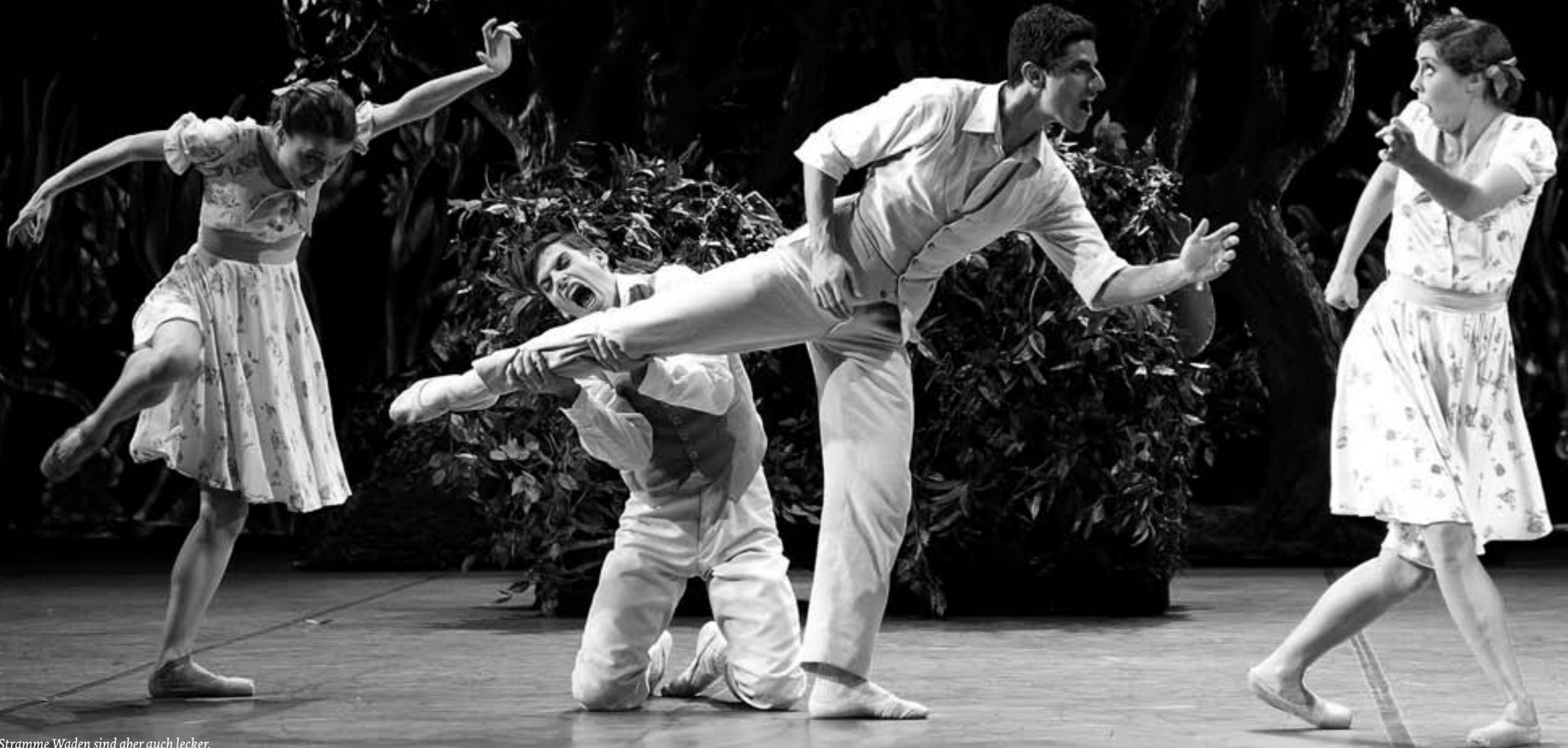
Stramme Waden sind aber auch lecker.

zu den Schuhplattlerbuben) die Zuschauer ein. Die verschiebbaren Büsche gewähren den Liebenden Unterschlupf und wackeln mächtig, wenn sich dahinter etwas tut. Die Grashalme wachsen bis in den Himmel, so daß die Elfentänzer und