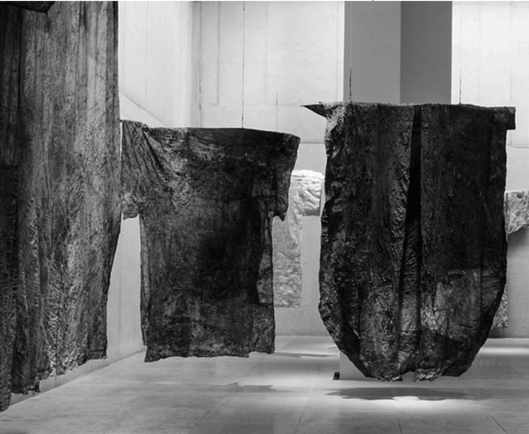
Riesenhemdchen auf der Leine