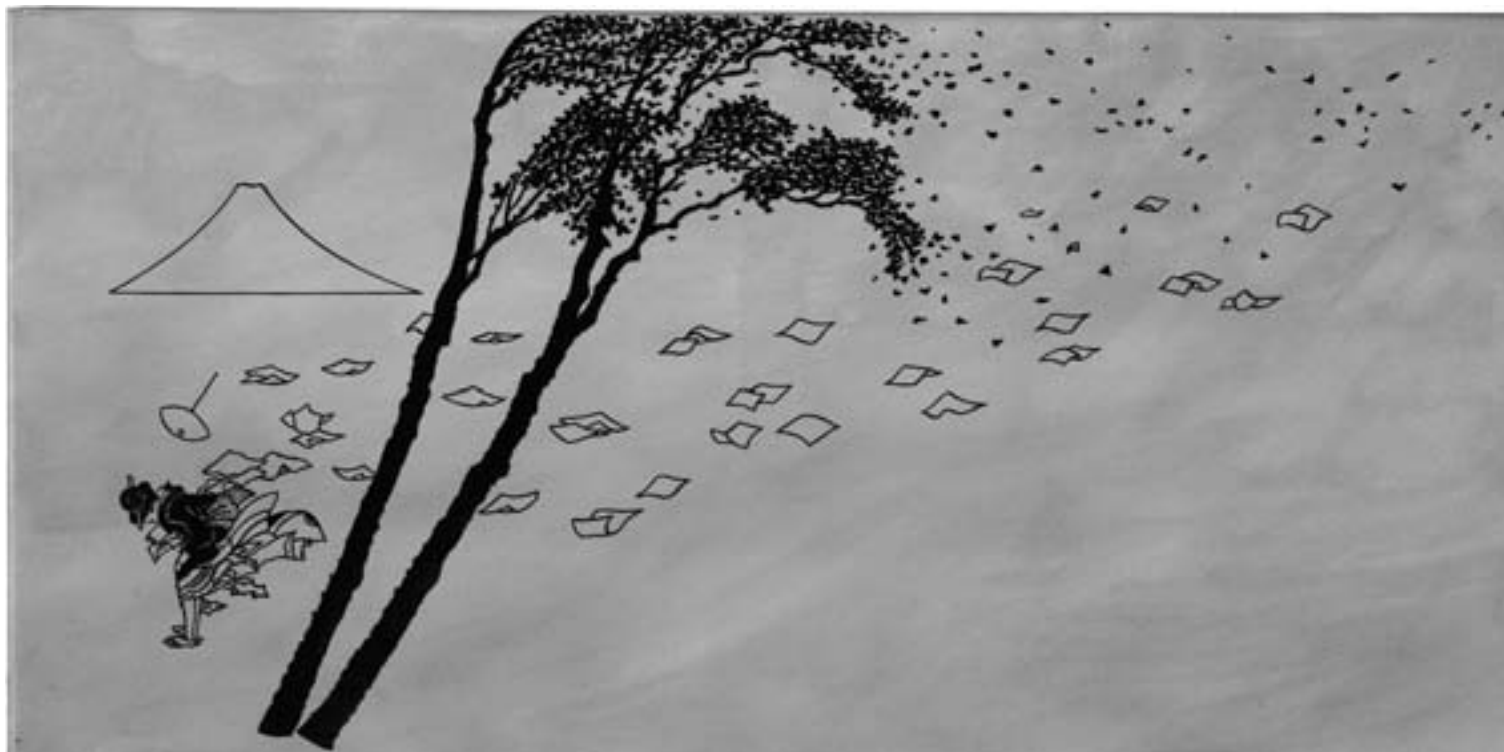
Windstoß in der Provinz Suruga, 2007 Öl auf Leinwand

In der „westlichen“ Kunst gilt immer noch das Originale, das Eigenschöpferische, der neuartige Impuls als ein Postulat und Merkmal für Kunst schlechthin. Nicht so in der „östlichen“ Kunst. Da bemißt man den Wert eines Kunstwerks danach, inwieweit ein Künstler großen Vorbildern nahekommen kann. Und – jedenfalls bis vor kurzem – übten sich die Zöglinge von chinesischen Kunstschulen an den immer gleichen Vorlagen. Wer ein guter Kalligraph oder Maler werden wollte, hatte lange Jahre in die Lehre zu gehen, d. h. seine Vorbilder nachzuahmen. Deshalb verwundert es etwas, wenn ein westlicher Maler sich berühmte Holzschnitte aus Japan vornimmt. Allerdings verändert er sie dann doch.