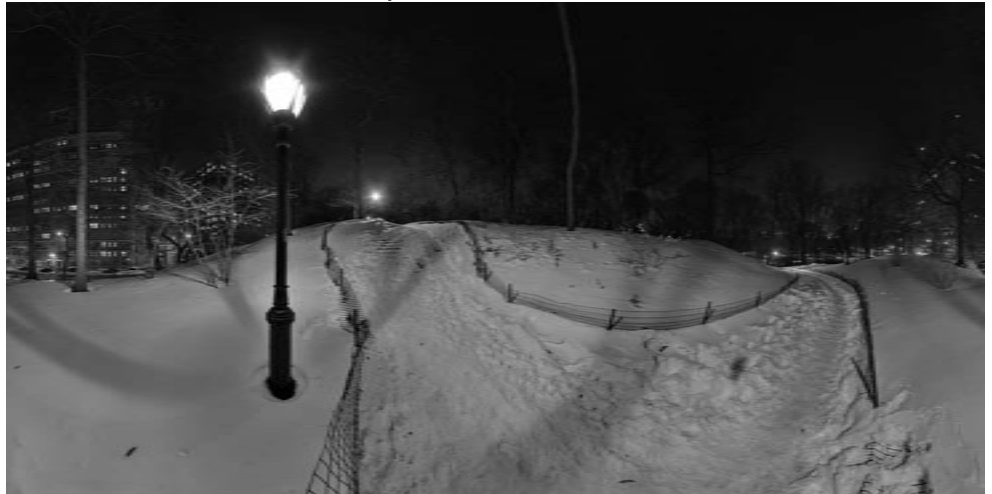
Jörgen Geerds: Central Park in the Snow