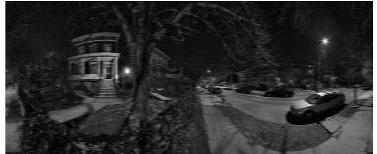
Jörgen Geerds: Old Astoria

Qualität des Inneren in sich birgt und Einblicke in unterschiedliche private Bereiche gewährt. So täuscht uns Geerds vor, unsere eigene Welt wiederzuerkennen: Zum ersten Mal genügt New York ganz sich selbst, ohne Menschen, aber doch von ihnen geprägt und gestaltet, und gleichzeitig sie prägend und gestaltend. ¶