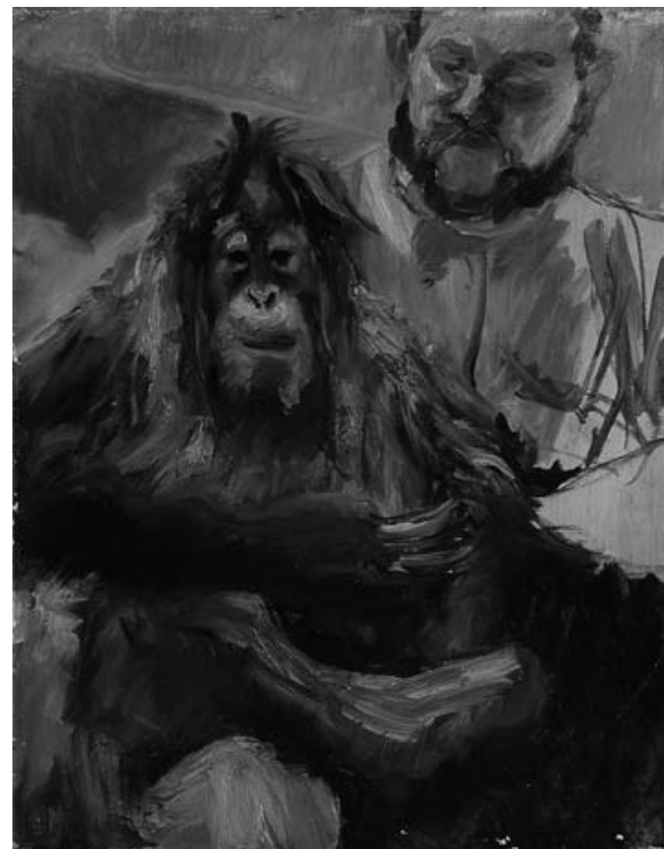
Max Slevogt: Der Orang Utan „Seemann“ und sein Wärter.

Impressionismus in der Kunsthalle Jesuitenkirche in Aschaffenburg zeigt eigentlich meist anderes: die Auseinandersetzung der wichtigsten Vertreter der bildenden Kunst vom Anfang des 20. Jahrhunderts mit Stil-Tendenzen zwischen Realismus, Naturalismus und Expressionismus, die Suche nach