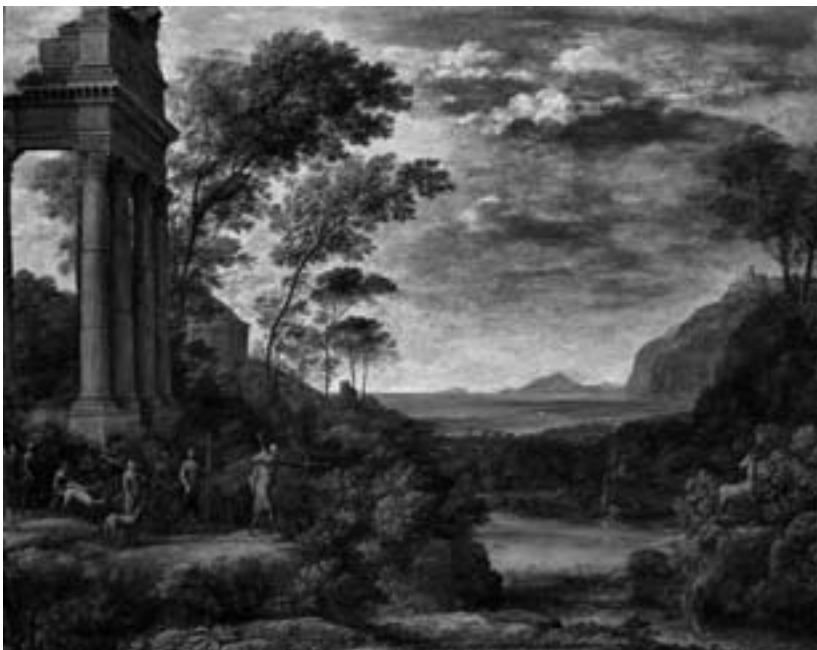
Claude Lorrain: Ascanius 1682