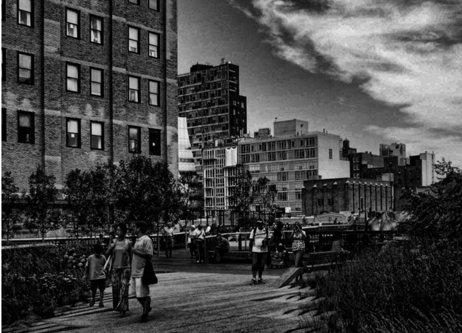
High Line Park New York

Rekultivierung ist auch in Würzburg die Aufgabe. Ein Flugplatz, ein Kasernengelände sind der menschlichen Nutzung zurückzugewinnen. Wie könnte es geschehen? Welche Notwendigkeiten, welche Wünsche sind zu berücksichtigen? Die folgenden Gedanken könnten uns vielleicht dem Paradies näherbringen: Die städtische Gesellschaft ist vielgestaltig, bunt und heterogen. Das Angebot der Grünflächen auf den Leighton Barracks soll Menschen unterschiedlicher Herkunft, unterschiedlicher Interessen und Bildung, Junge und Alte ansprechen. Dem Bevölkerungsgemisch entsprechen offene Flächen für mannigfaltige, multifunktionale Nutzungen. Der Park braucht gesellschaftliche Treffpunkte, Orte der Begegnung und der Restauration. Neben Flächen für sportliche oder sonstige Aktivitäten sind Orte der Stille und der Zurückgezogenheit anzubieten. Stadt ist