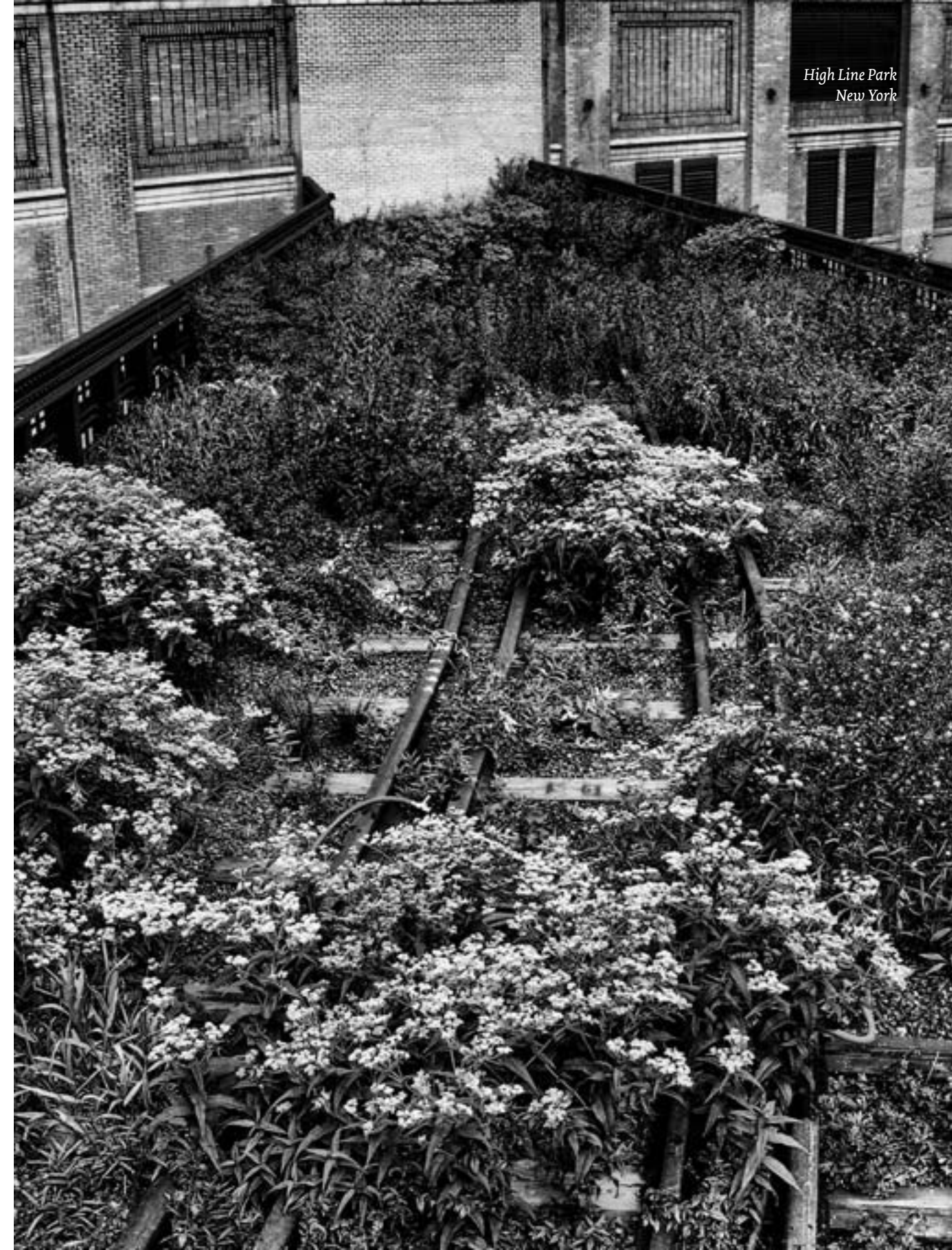
High Line Park New York

Vielfach entstanden große Volksparks, Erholungsflächen angereichert mit Sportanlagen der verschiedensten Art. Berühmtes Beispiel ist der Hamburger Volkspark, der 1927 nach der Planung von Fritz Schumacher entstanden ist. Er vereint Flächen für Erholung und Sport mit einer Stadthalle, einem Café, mit Wasserturm, Stadion, einem Landhaus und einem Bauernhof, Ziergärten und Gewässern. Daneben öffneten Volksgärten, in denen Familien Kaffee kochen und sich vergnügen konnten. Hier drängten sich die Menschen in riesige Stadien, dort zogen sie sich in die Idylle des Schrebergartens zurück. Notzeiten, Kriege und Wirtschaftskrisen ließen den Nutzgarten immer wieder aufleben. Ein