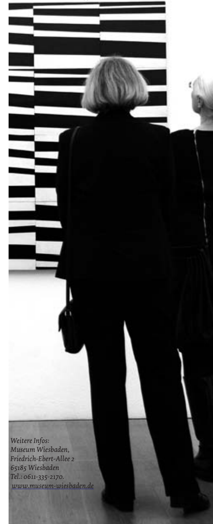
Besucherinnen vor „Cité“, 1951

Weitere Infos: Museum Wiesbaden, Friedrich-Ebert-Allee 2 65185 Wiesbaden Tel.: 0611-335-2170. www.museum-wiesbaden.de