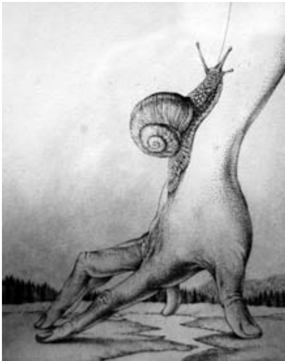
Christian Mischke: „Istanbul – Frau“ (Farbradierung mit Strichätzung, 1974/75) ■

Christian Mischke: „Das Incognito“ (Radierung mit Strichätzung, 1991), aus dem Zyklus „Zu Eichen