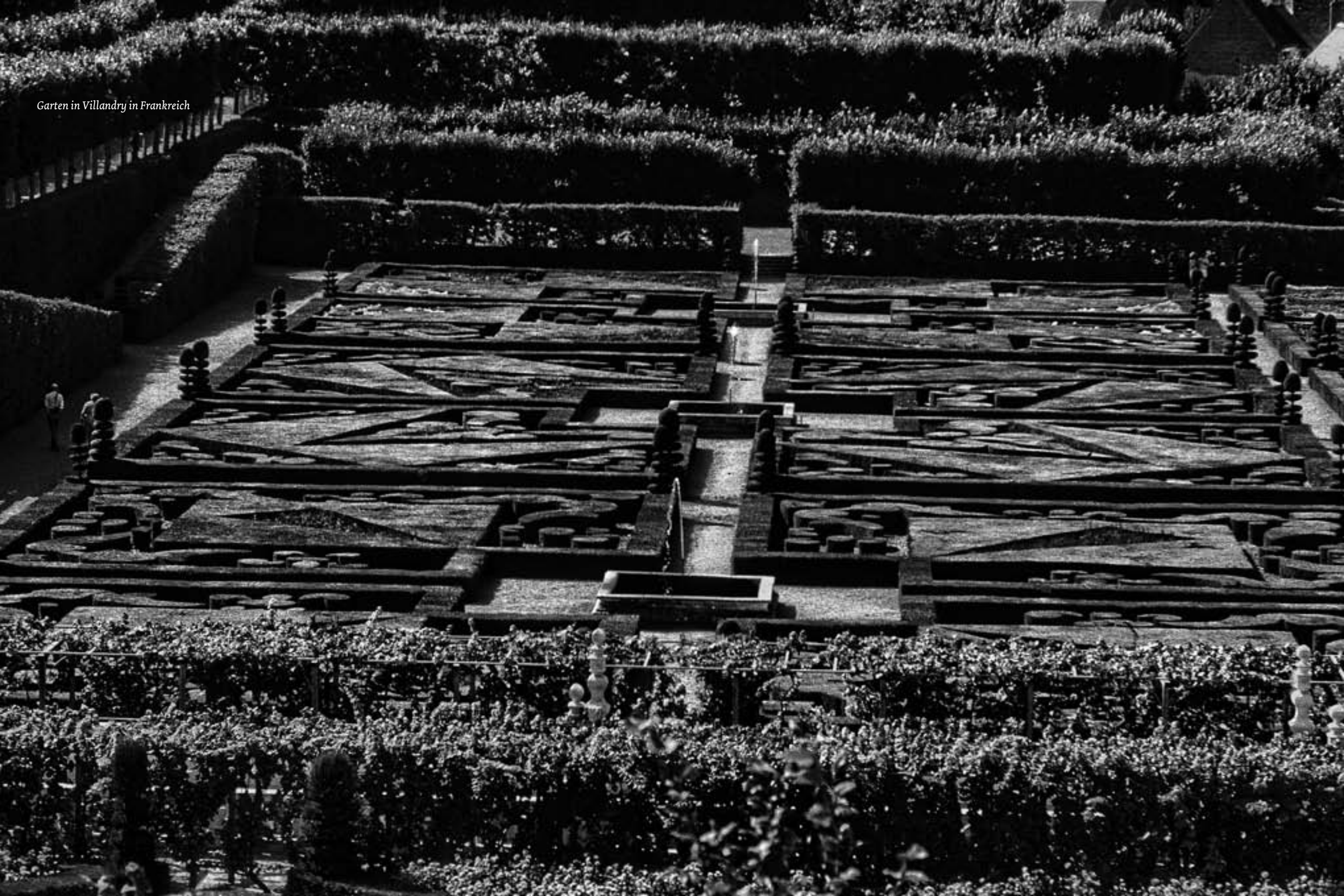
Garten in Villandry in Frankreich