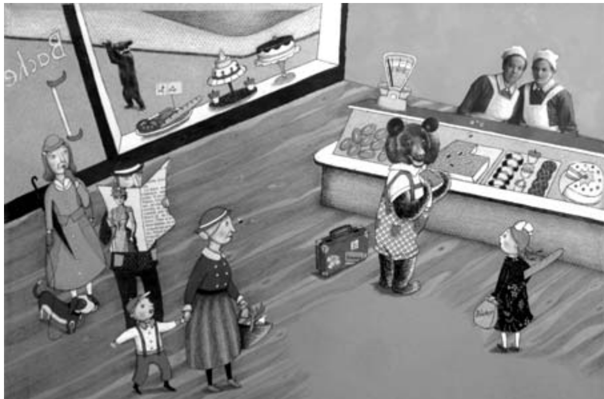
Eine Illustration aus dem Gewinnerbuch

Mit einfachen Worten erzählt die in Karlsruhe lebende Autorin von den Erlebnissen eines kleinen