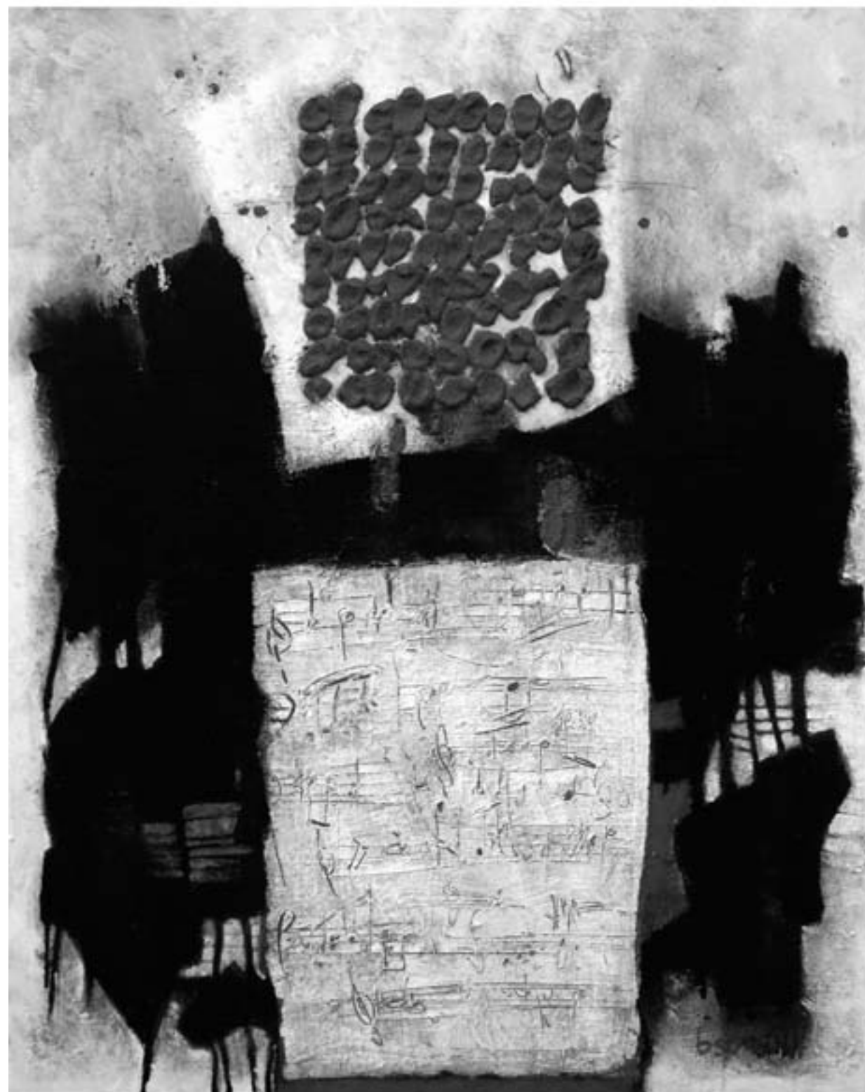
„Ständchen für Sali“ (2011)

Öffnungszeiten der Ausstellung „Passagen – Stationen“ im Spitale: Di.-Do., Sa. u. So. 11-18, Fr. 11-20. Bis 23. Oktober. – Infos im Internet unter http://vku-kunst.de/