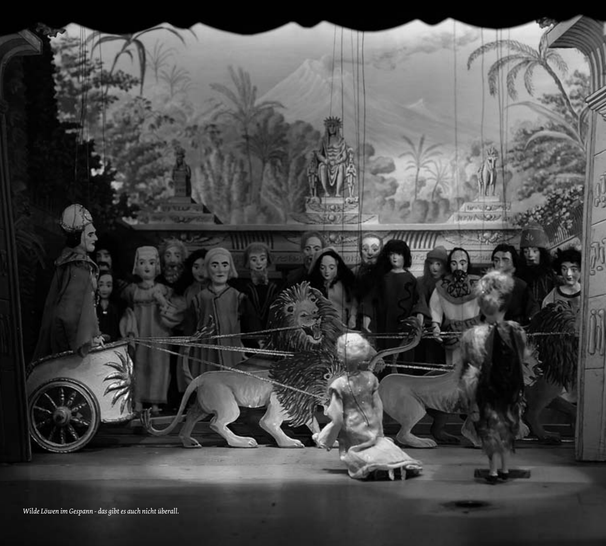
Wilde Löwen im Gespann - das gibt es auch nicht überall.