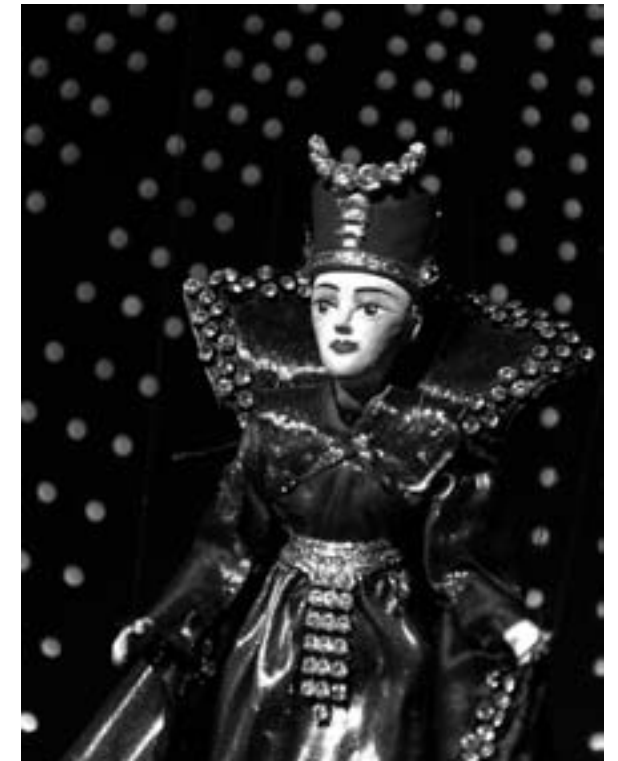
Die Königin der Nacht vor aufgeräumtem Sternenhimmel.

Wie das im Detail funktioniert, können die Zuschauer nach dem Ende der Vorstellung entdecken. Denn sie dürfen das Marionettenreich auch hinter der Bühne betreten. Dort arbeiten je nach Stück drei bis fünf Figurenführer und ein Beleuchter, der die komplexe Anlage noch manuell bedient (auch das ist ein Relikt vergangener Zeiten). Er öffnet alle Vorhänge, bewegt Schleier oder bedient die Nebelmaschine und die neue, moderne Tonanlage. Die Stimmen der Puppen stammen von echten Schauspielern oder aus historischen Operaufnahmen, und sie laufen natürlich vom Band (wie auch sämtliche