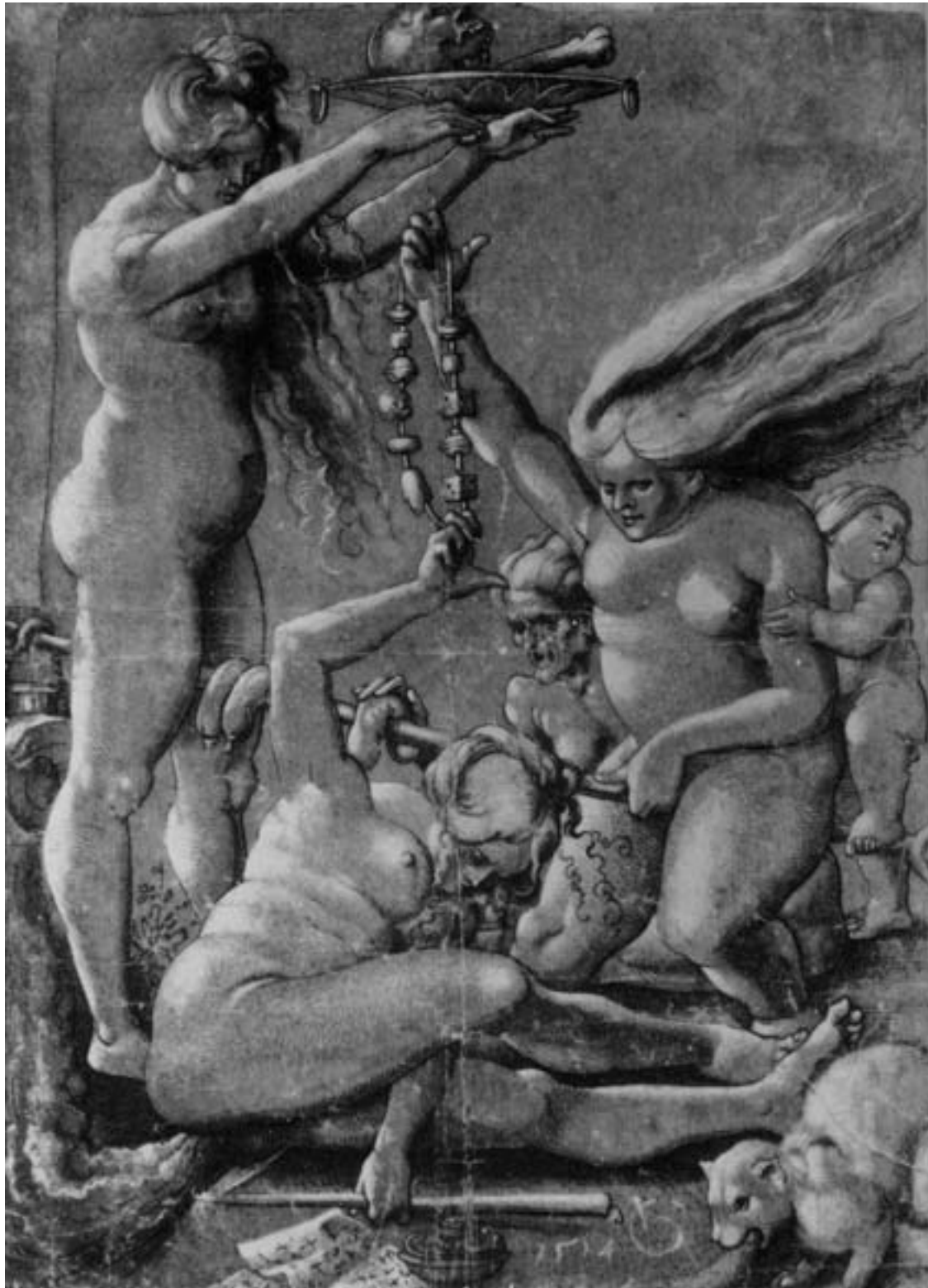
Hexensabbat, Hans Baldung Grien, 1514