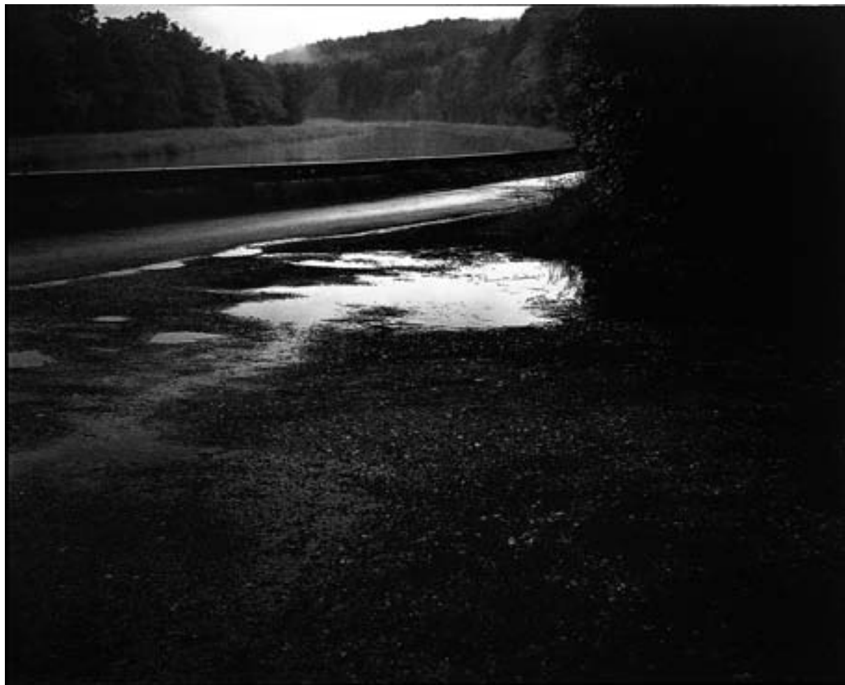
Yukara Shimizu: Aus der Serie „Andauer“. C-Print 2010