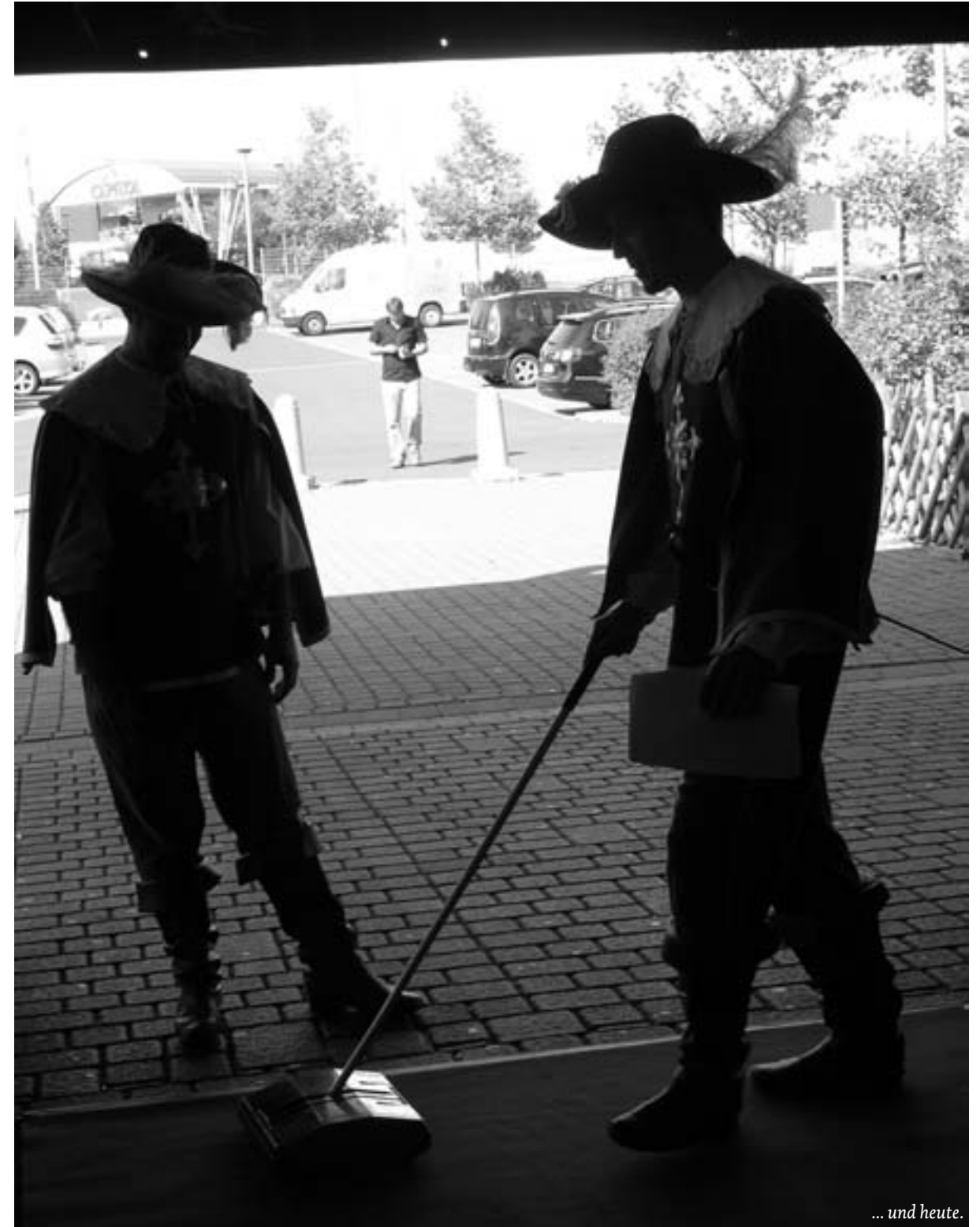
... und heute.