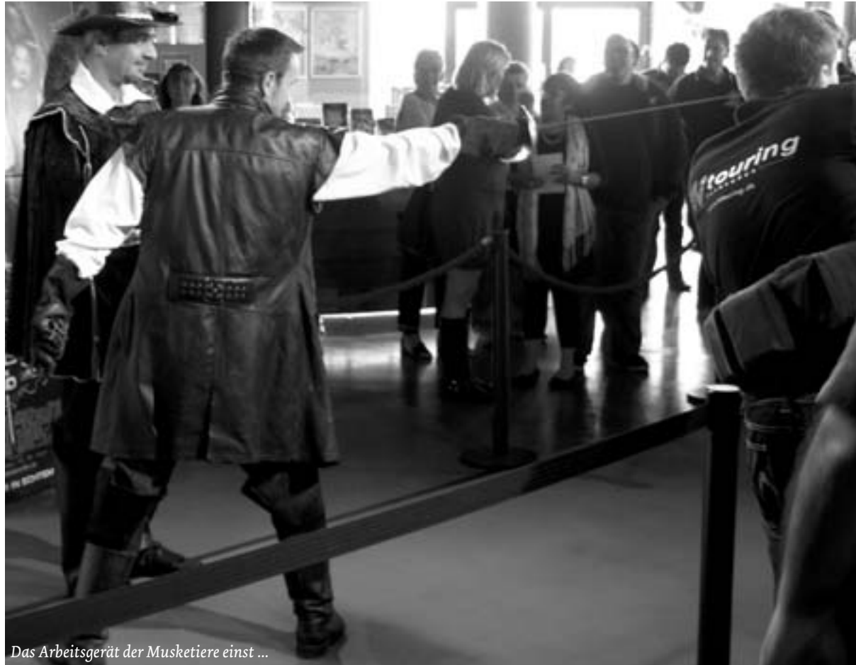
Das Arbeitsgerät der Musketiere einst ...