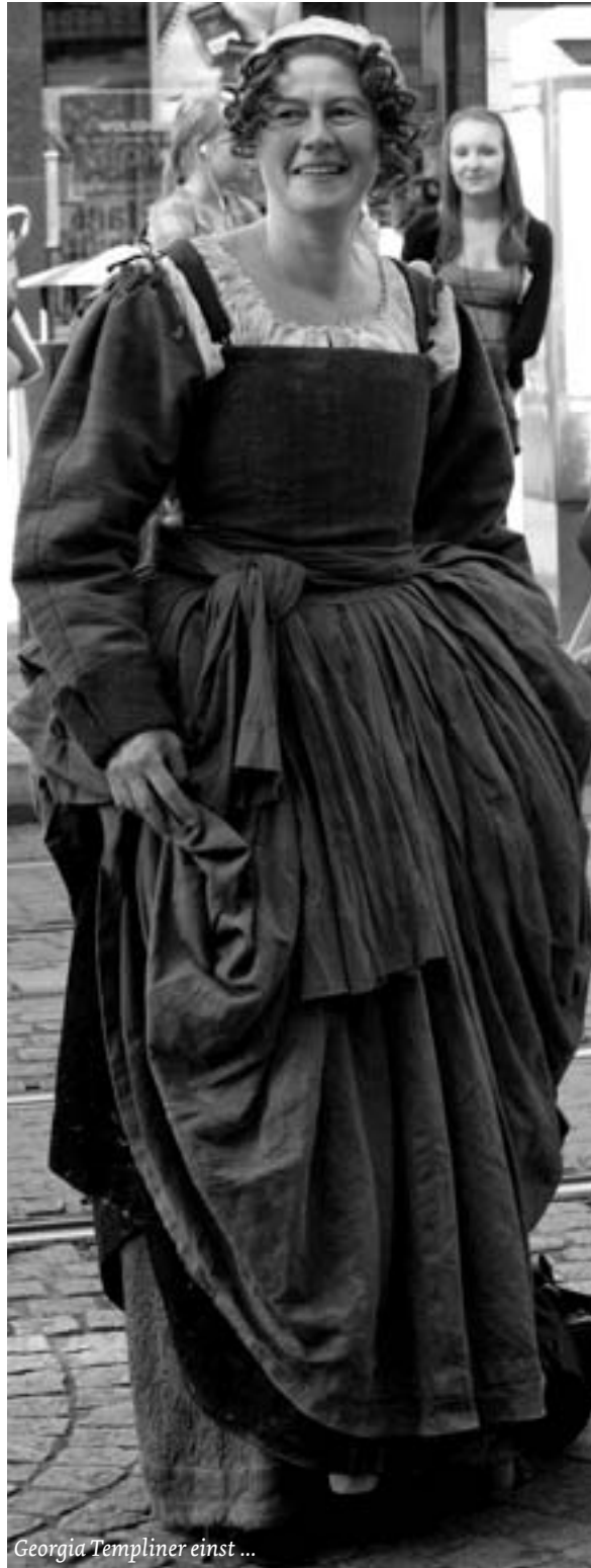
Georgia Templiner einst ...