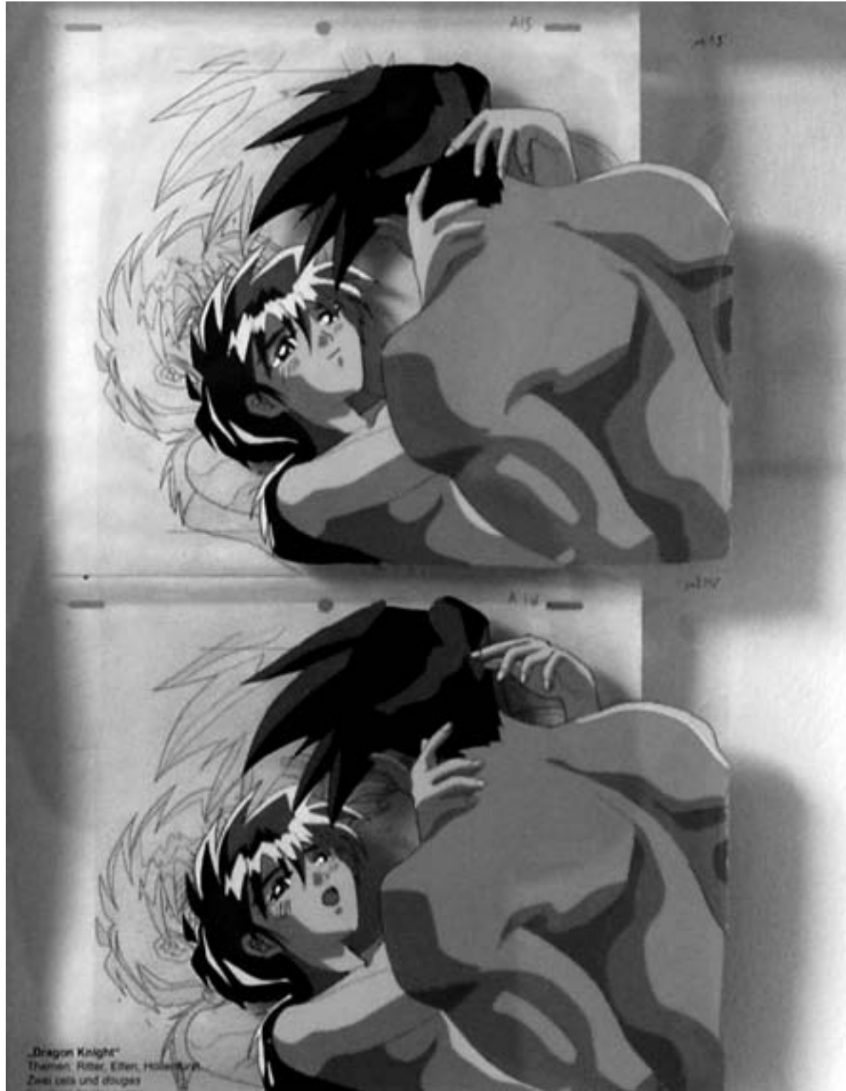
„Dragon Knight“. Zwei cels und dougas für einen Hentai-anime. (Was auch immer das heißt. Der Layouter)