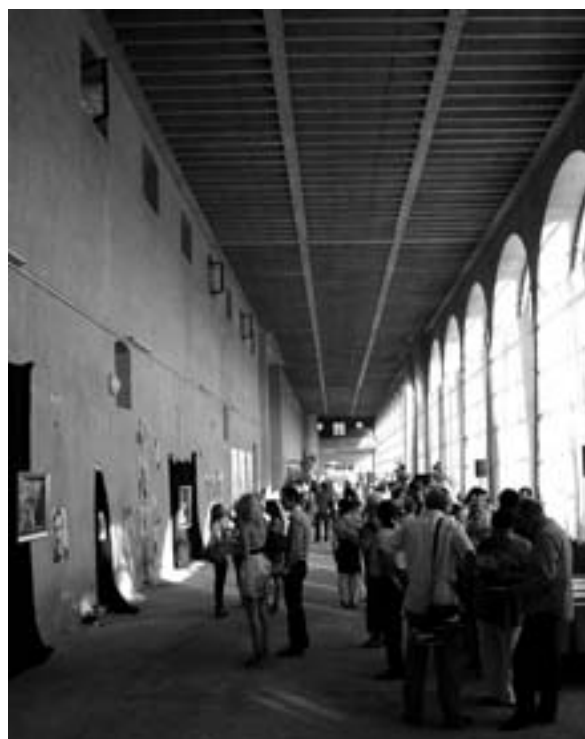
Kunst – Film – Comic Vernissage in der Orangerie

ihren Fabelwesen und Fantasy-Welten sehr nahe. Auch Erotik und Pornographie nahmen bereits zu früheren Zeiten bei Mangas einen breiten Raum ein (der betreffende Ausstellungsraum ist durch Vorhänge vom Rest des Museums abgetrennt und darf nur von Personen ab 18 Jahren betreten werden). Dadurch, daß das Siebold-Museum die aktuellen Mangas – und ihre filmische Umsetzung in Anime-Filmen – in den ehrwürdigen, historischen Kontext stellt, erhalten moderne japanische Comics nicht nur Kult-Status, den sie bei ihren (zumeist jugendlichen) Fans sowieso haben, sondern auch Kultur-Status, was diesem graphischen Massenphänomen sehr zugute kommt. Kein Wunder, daß nach Angaben der Ausstellungsmacher die Museumsbesucher auch von weiter her den Weg in die Frankfurter Straße 87 gefunden haben. Kein