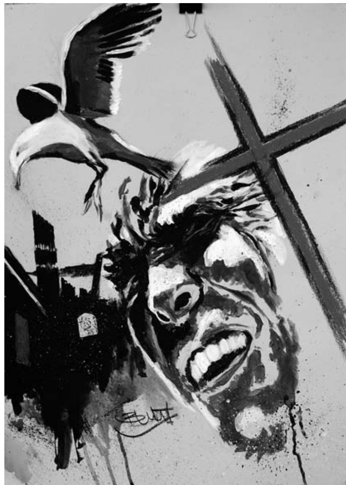
Arbeit von Alex Bumbulut

Die Ausstellung ist optischer Rahmen der Reihe „Kunst – Film – Comic“, die „Art In Residence“, das Label der „Stiftung Zukunft Kultur“, unterstützt von zahlreichen Sponsoren, in der Orangerie veranstaltet. Weitere Programmpunkte sind exquisite Filme rund ums Thema Comic am 8., 9., 10., 16. und 17. September um jeweils 20 Uhr sowie eine Performance am 24. September um 17 Uhr. Das komplette Programm gibt's im Internet auf der Homepage eines der Sponsoren unter http://www.comicdealer.de/allgemeines/kultur-fur-wuerzburg/ Die Öffnungszeiten des Siebold-Museums sind Montag-Freitag 15-17 Uhr, Samstag und Sonntag 10-12 Uhr. Infos im Internet unter http://siebold-museum.byuseum.de/de/ausstellungen/sonderausstellung