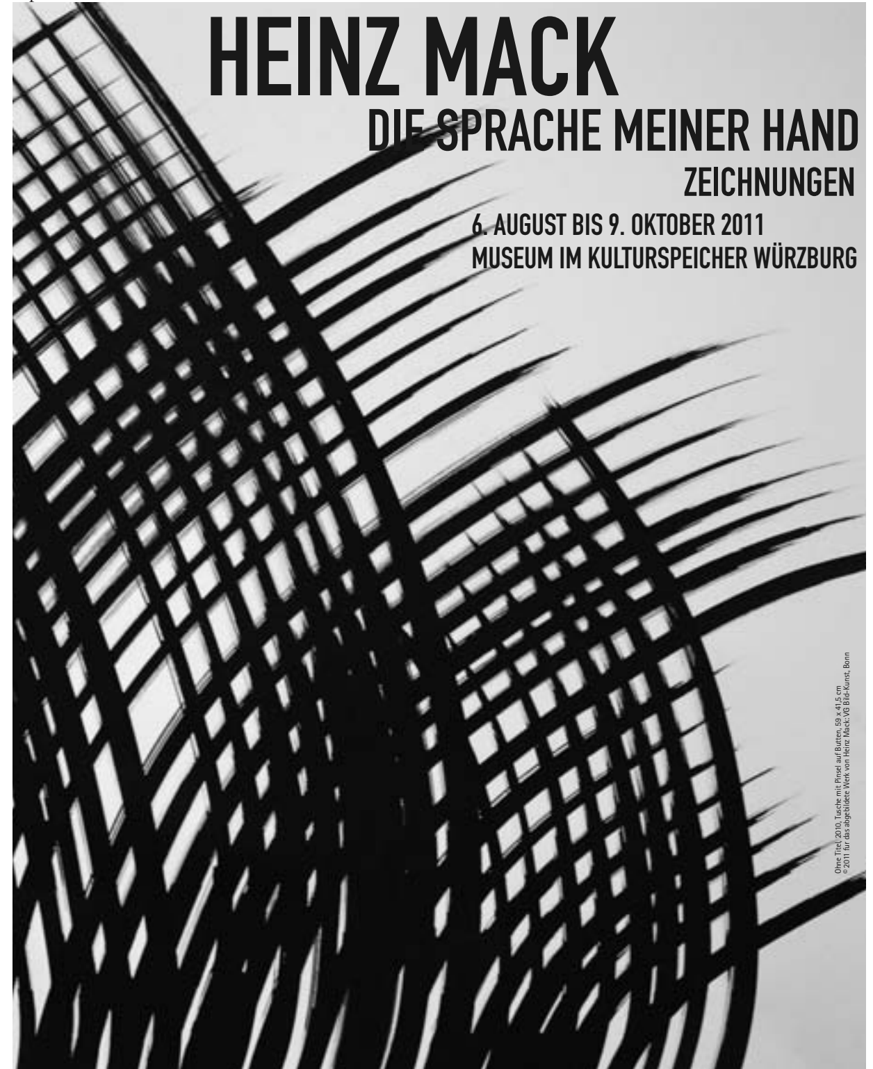
Oben: Titel, 2010, Tusche mit Pinsel auf Bütten, 69 x 41,5 cm © 2011 für das abgebildete Werk von Heinz Mack, VG Bild-Kunst, Bonn

6. AUGUST BIS 9. OKTOBER 2011 MUSEUM IM KULTURSPICHER WÜRZBURG