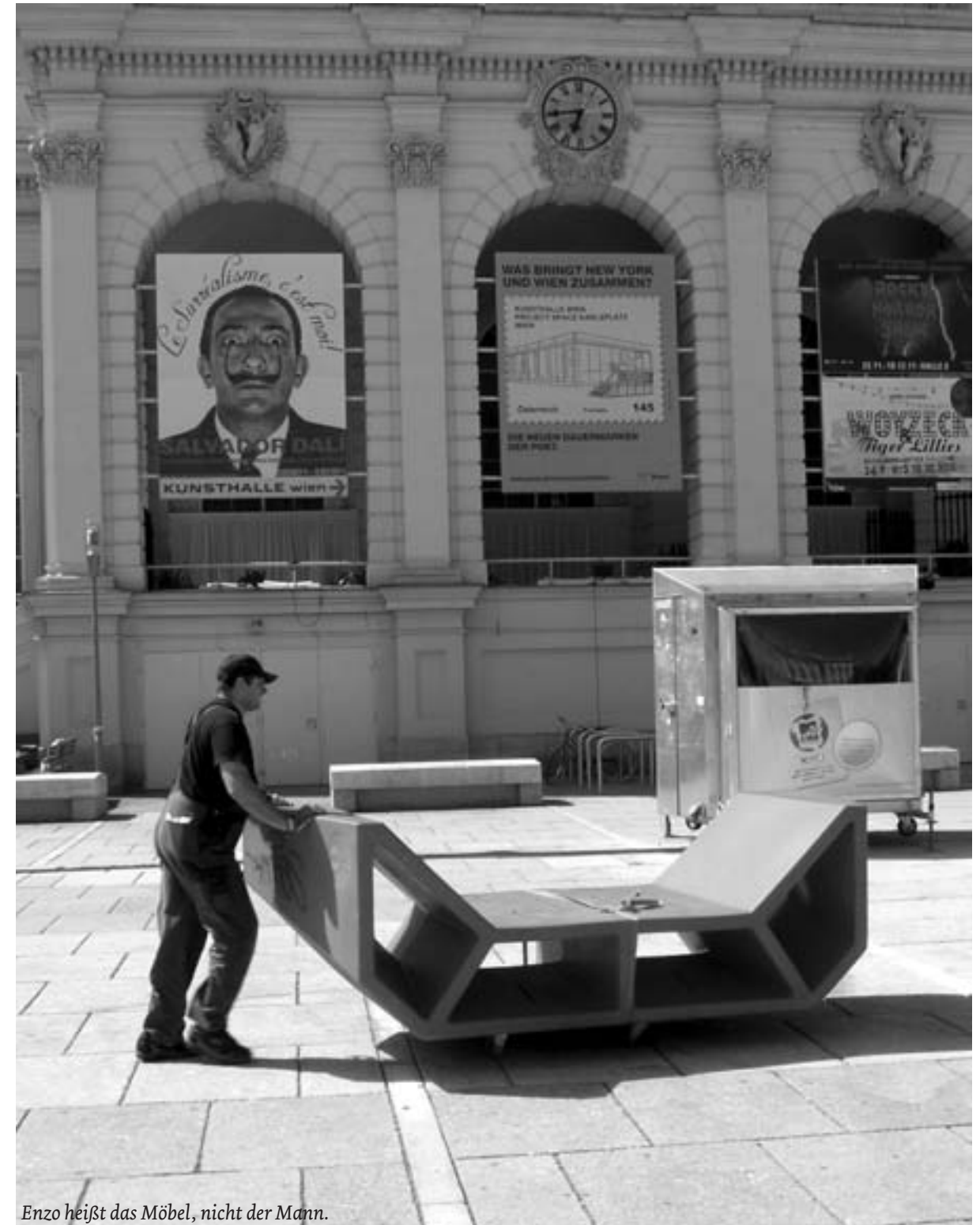
Enzo heißt das Möbel, nicht der Mann.

Aktuelle Ausstellungstips im MuseumsQuartier: Mumok – Museum moderne Kunst Stiftung Ludwig Wien: „Museum der Wünsche“ bis 8.1.2012 Kunsthalle Wien: „Le Surréalisme, c`est moi. Salvador Dali &...“ bis 23. 10. 2011 Sammlung Leopold: „Magie des Augenblicks – Meisterwerke der Fotografie“ bis 3. 10. 2011 „Egon Schiele- Melancholie und Provokation“ von 23.9.2011- 30.1.2012