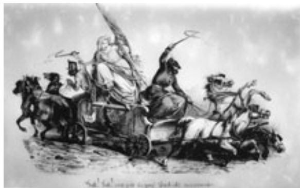
(Das Bild füllt hier lediglich eine Lücke, macht dies aber gut.)