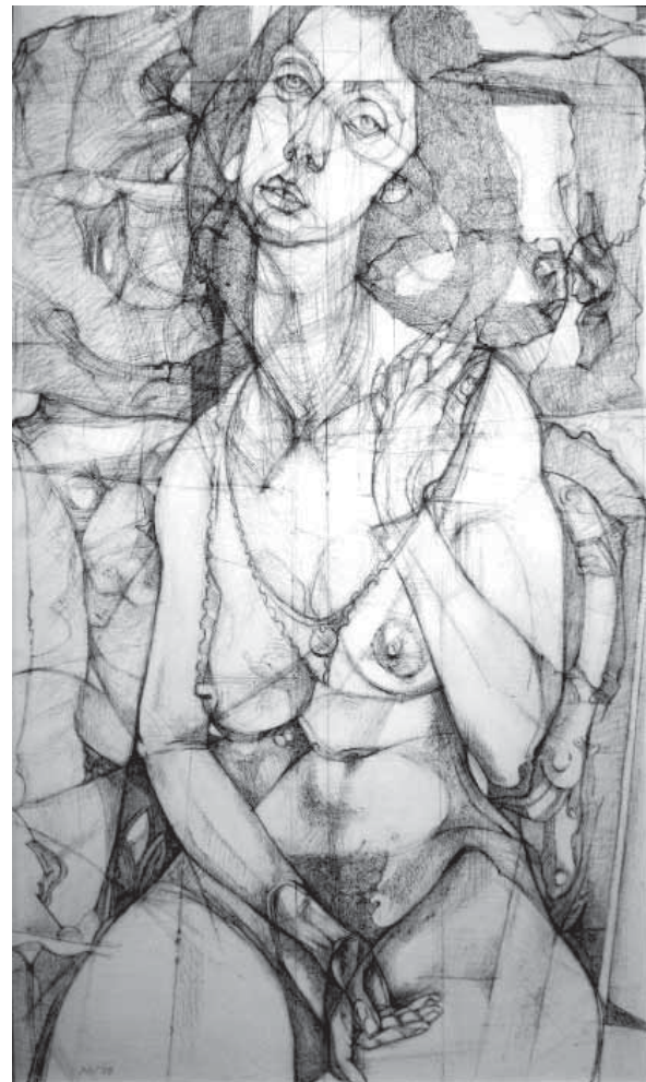
Arnulf Wallner, Akt (1970)

Die Zeiten haben sich geändert. Wallner wird nicht mehr neben dem Dom, sondern in der Werkstattgalerie im BBK-Künstlerhaus gezeigt. Die Würzburger wirken nicht mehr so, als würden sie bei allem Sexuellen in der Kunst sofort einen moralischen Zusammenbruch bekommen. „Skandal“, „Pornographie“ wird heute wohl niemandem mehr schreien. Obwohl Wallners Zeichnungen und Graphiken, das muß man sagen, auch heute noch