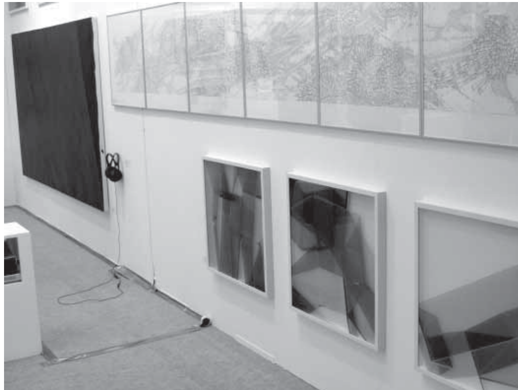
Blick in die Koj der Galerie „pack of patches“