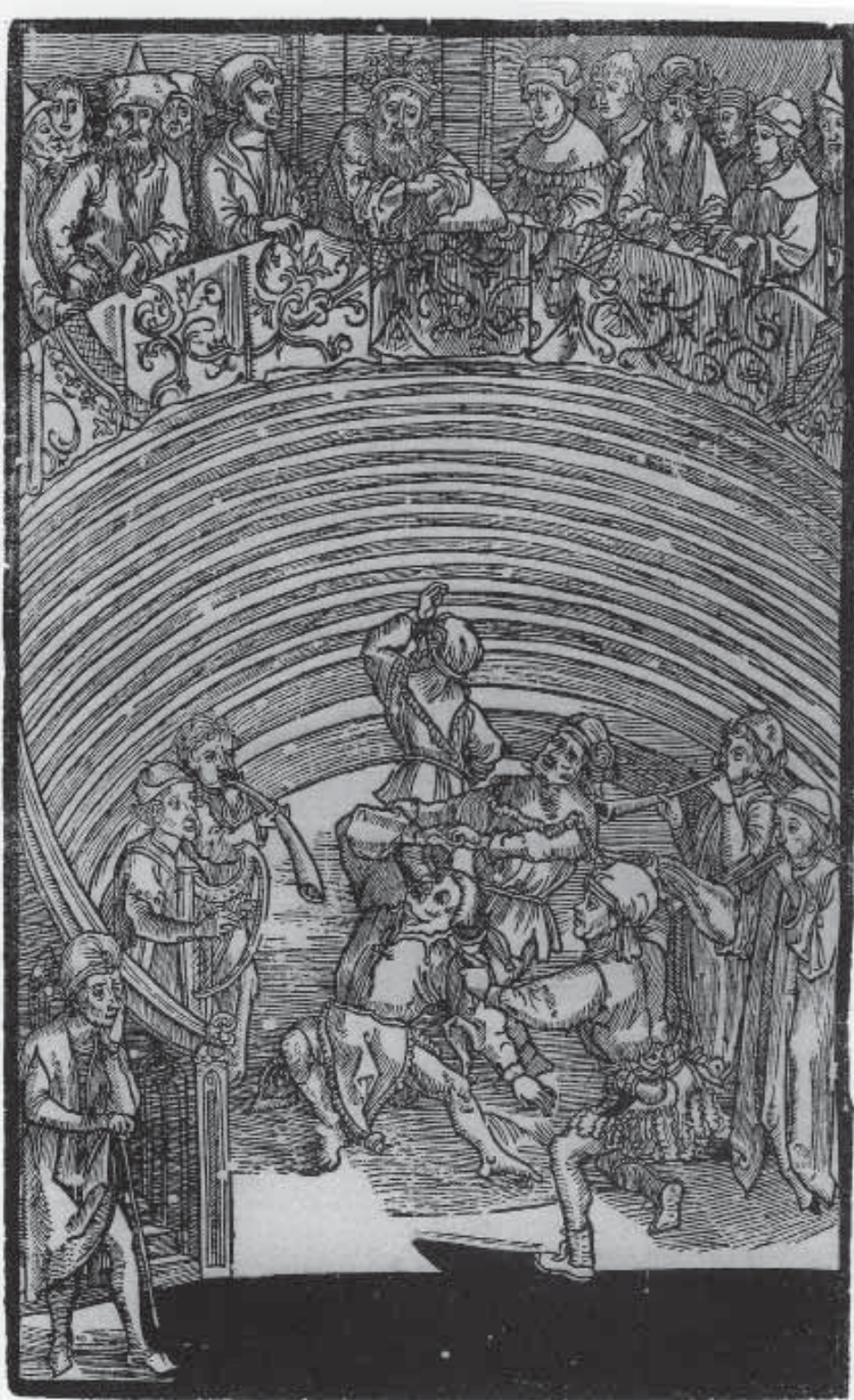
Albrecht Dürer, Das Theater des Terenz, ca. 1492/93

bereits vorliegenden Holzschnitte, die es schon als Einzelblätter gab. So sind die Holzschnitte ganzseitig auf der rechten, optisch wichtigeren Buchseite plaziert. Dieses „Bilderbuch“ funktionierte auch ohne den Text, der nicht immer genau zum Bild paßte, und hatte großen Erfolg, nicht zuletzt wegen der hohen Qualität, zu erkennen etwa bei den vier apokalyptischen Reitern mit ihrer plastischen Tiefe, der dramatischen Erzählung und der Brillanz und Differenziertheit des Holzschnitts. Neuartig war auch das kalligraphisch gestaltete Titelblatt mit einer prachtvollen Initialen; damit imitierte Dürer die Kunst der Schreibmeister. Befreundet war Dürer mit dem Humanisten Conrad Celtis. Das fand seinen Niederschlag auch in quasi programmatischen Holzschnittillustrationen. So schuf er zu dessen Ausgabe der Werke der Roswitha von Gandersheim zwei Widmungsblätter; beim ersten sitzt die Philosophie, nicht die Theologie als Herrscherin auf dem Thron: Sie hat also den Vorrang in den geistigen Wissenschaften erhalten, hat die Theologie abgelöst. Und beim zweiten ist der mit dem Dichterlorbeer bekränzte Conrad Celtis zu sehen, ein Zeichen dafür, daß Deutschland nun auch in der Poesie führend ist.