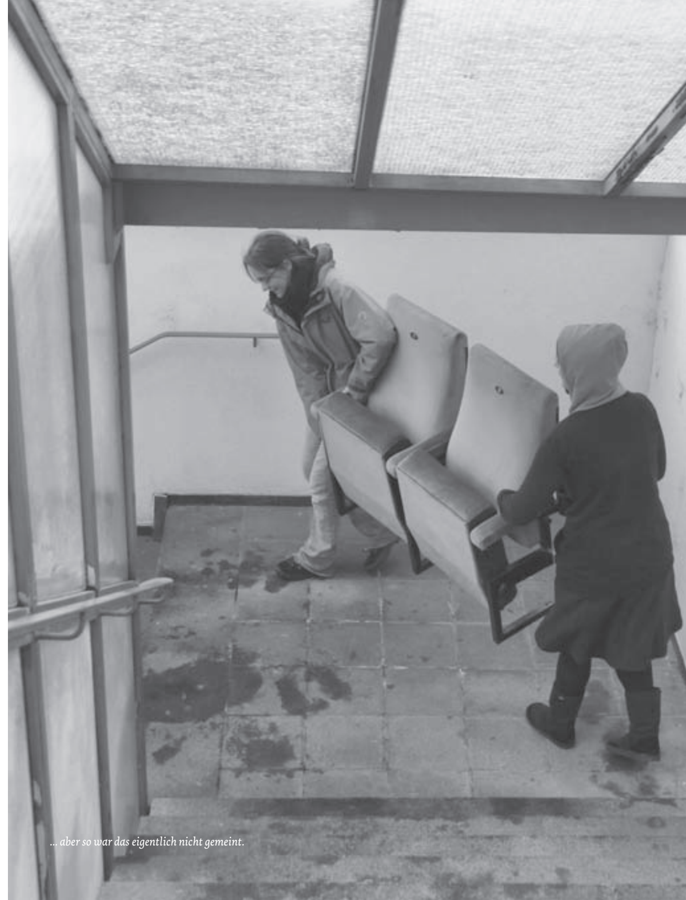
... aber so war das eigentlich nicht gemeint.

Es ist Montag, der 4. Januar in einer neuen Dekade des 21. Jahrhunderts. Das große Krabbeln beginnt. Gibt es etwas umsonst, ist auch der Nichtkinogänger gefordert. Punkt 9 Uhr morgens öffnet sich der frühere Notausgang zum Kino 1. Die Hundertschaft eines mobilen Schraubkommandos stürmt über die lange Hinterhoftreppe in den Saal. Mit Ratschen und Schraubenschlüssel geht es ans Werk. Männer und Frauen sinken auf die Knie, kriechen und krabbeln in die Gänge zwischen den Stühlen und widmen sich fieberhaft der Demontage derselben. Denn, wer früh kommt, sitzt zuerst! In einem echten Corso-Kinosessel. Zu Hause oder in einem Partykeller oder Vereinsheim läßt sich bequem vor einem Großbildfernseher Krimis, Lustspiele oder Bundesliga gucken. DVD ist angesagt, schließlich ist da der Kühlschrank in der Nähe und die Latschen fürs Pantoffelkino.