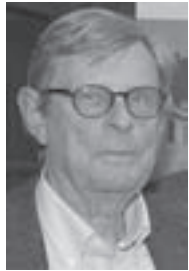
von Ulrich Karl Pfannschmidt (Text und Fotos)