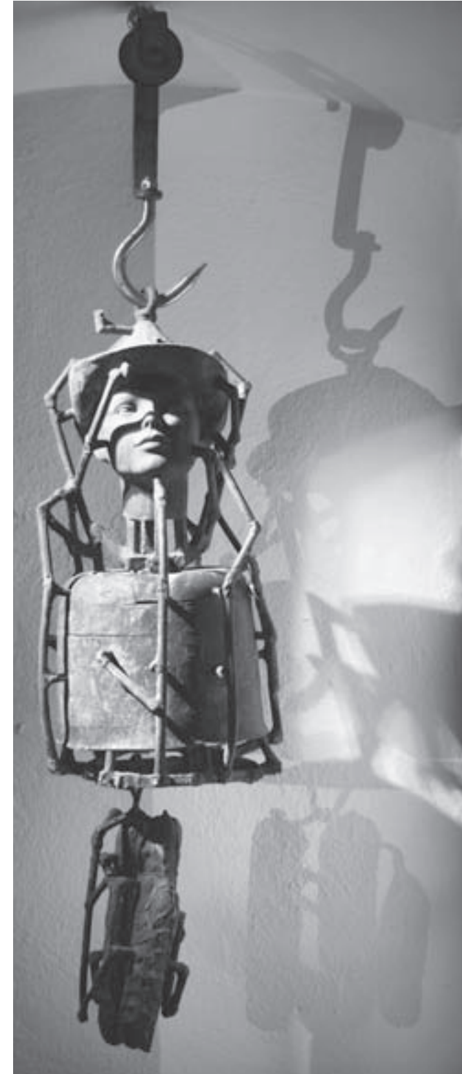
Hans Wurst. Ein Prillwitzer Idol von Daniel Spoerri.

Die Herkunft und ursprüngliche Funktion der Einzelheiten in den im Bronzeuß vereinheitlichten Assemblagen der „Prillwitzer Idole“ zu identifizieren, mag belustigen, ist aber gar nicht so wichtig. Die Wasserhähne und Muscheln, Tierschädel und Masken, Kleidungsstücke und Arbeitsgeräte vom Bauernhof, die technischen Werkzeuge und die Relikte abgelebten Lebens metamorphieren im neuen Kontext zu Spukgestalten und Ausgeburten von Alpträumen. Um das Unheimliche zu verfremden, das Makabre mit dem Bizarren zu verbinden, läßt Spoerri die Gußkanäle seiner im Cidre perdue-Verfahren (d.h. verlorenes Wachs) gewonnenen Bronzen stehen und überzieht das glänzende Metall mit antikisierender Rostpatina. Wie in einem Ader- oder Nervengeflecht hängend, wie Homunkuli aus einem Alien-Labor oder ins Monumentale gewachsene Hieronymus-Bosch-Dämonen flankieren die Figuren nun die Apsis der Kirche als Danse macabre einer überbordenden Künstlerphantasie. Ob Science Fiction oder archäologische Funde einer verschollenen Kultur, die Zeit mäandert in Spoerri's Plastiken zwischen Zukunft und Vergangenheit und bleibt doch unmittelbare Gegenwart des betrachtenden und assoziierenden Subjekts. Um dieses Abenteuer miterleben, um diese fabelhafte Ausstellung zu sehen, sollte kein Weg zu weit, keine Mühe zu groß sein. ¶