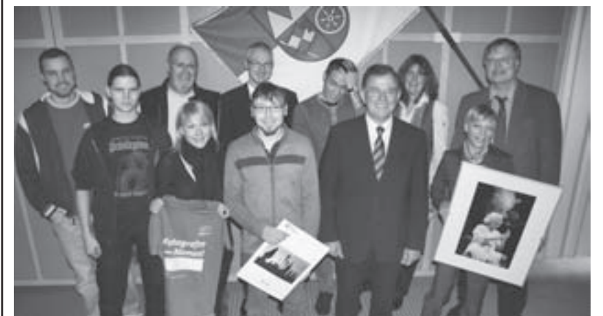
Zum Beispiel: Einen mehrseitigen Bericht über die Ausstellung „Modulation“ von Daniel Buren in Nürnberg. Oder: Lobende Worte zum Pressefoto-Preis aus unterfränkischer Sicht. Na, vielleicht ein ander Mal.