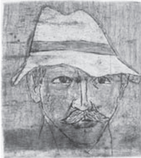
Selbstbildnis Emil Nolde

se, Lebensfreude und Existenzielles, Landschaftsdarstellungen, Südsee, See- und Hafengebäude, biblische Bilder. Das umfaßt so ziemlich alle Sujets Noldes, zumal die „Lebensfreude“ (auch „Lust und Leid“) zum Sammelbecken von Paarbeziehungen, Gesellschaftsszenen, Tier und Pflanze wird. Sogar eine Kaltnadelradierung des in Noldes Oeuvre wohl singulären europäischen Aktes voll scheuem Eros ist dabei.