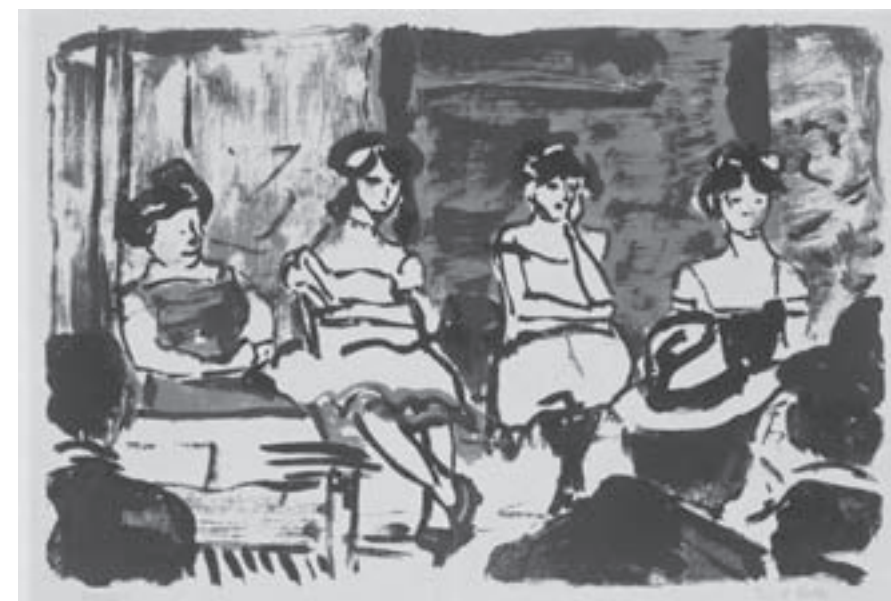
Tingel-Tangel II Emil Nolde

Aber Nolde studierte nicht nur die verschiedenen Volksgruppen, ihre Riten und Sozialstufen, sondern sammelte auch Masken, Fetische und Skulpturen. Auf der Rückreise vom Kriegsausbruch überrascht, mußte er alle seine Gemälde und Objekte in Ägypten bei den Engländern zurücklassen. Erst 1921 fand er sie wie durch ein Wunder in einem Lagerhaus in Plymouth wieder. Vielen der Aquarelle, in erster Linie den Typenstudien, merkt man den vornehmlich dokumentarischen Charakter an. Auch die Farben sind zurückhaltend und zuweilen etwas dumpf. Doch für den ethnologisch Interessierten sind sie eine Fundgrube für Haartrachten, Schmuck, Stammesabzeichen. Daß zu diesen Aquarellen zahlreich hochkarätige Kultobjekte, Masken und Skulpturen der Insulaner hinzugefügt wurden, bereichert die Ausstellung ungemein. ¶