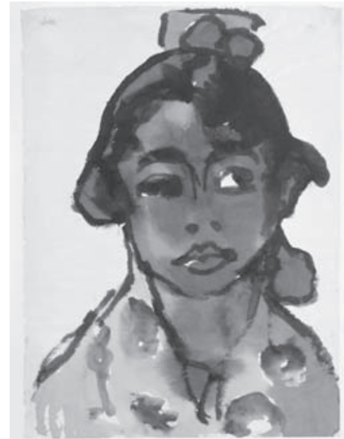
Spanierin Emil Nolde

reduzierte er auf den Typus, auf das Charakteristische und verwandelte Gesichter zu Ausdruckssignalen. Selbst in der ganz linearen Kaltnadelradierung suchte er das Malerische. Hart baute er in den Strich- und Tonätzungen den dramatischen Kontrast Hell-Dunkel („Sklaven“) aus. Ganz ohne Zwischentöne entwickelte er auf Schwarz und Weiß etliche seiner Lithographie. Auch wenn er Geschichten aus der Bibel erzählt, konzentriert sich das ganze Drama auf das menschliche Gesicht. „Prophet“ bündelt Vision und physisches Gebundensein, Entrücktheit und