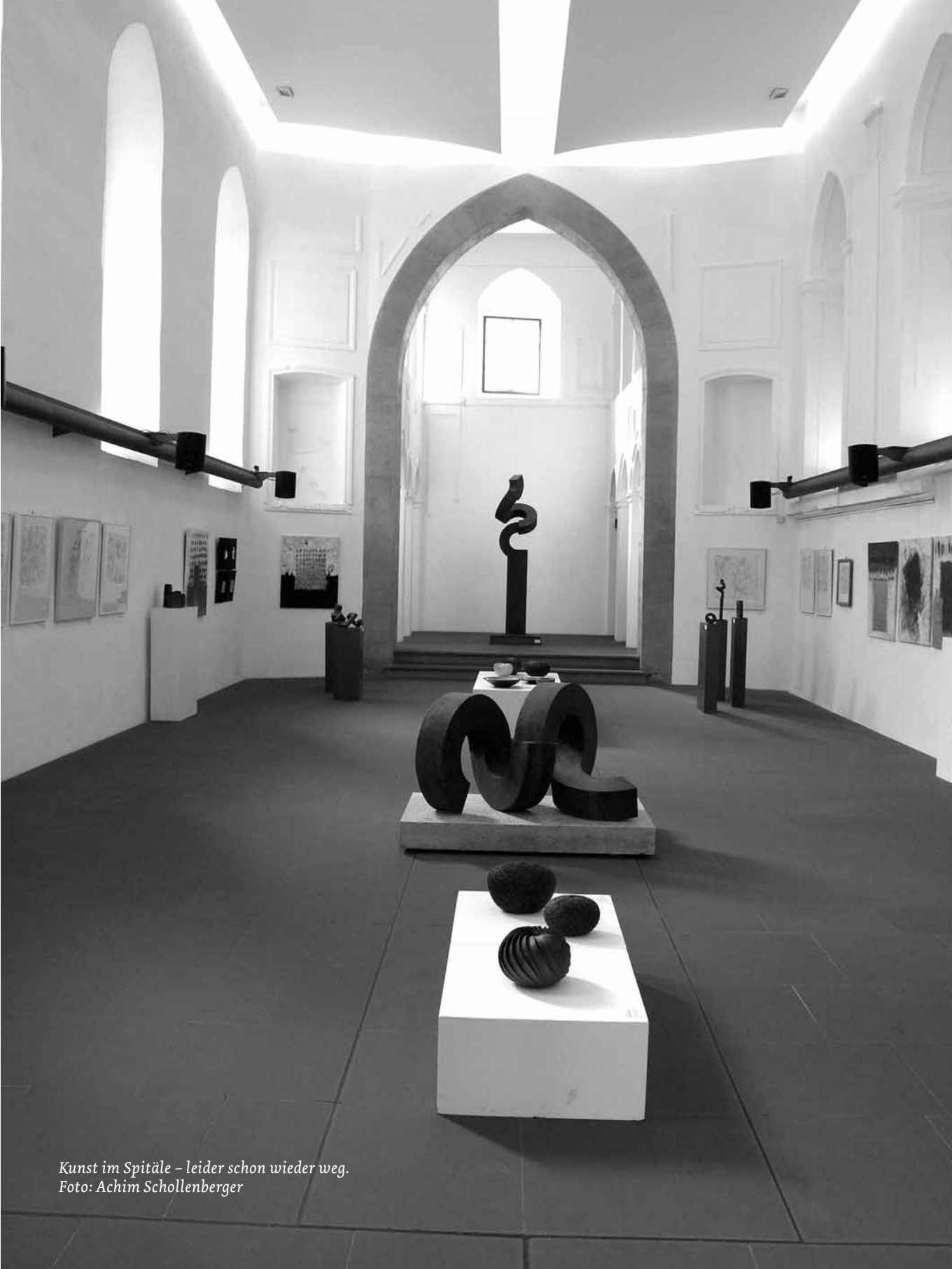
Kunst im Spital – leider schon wieder weg.