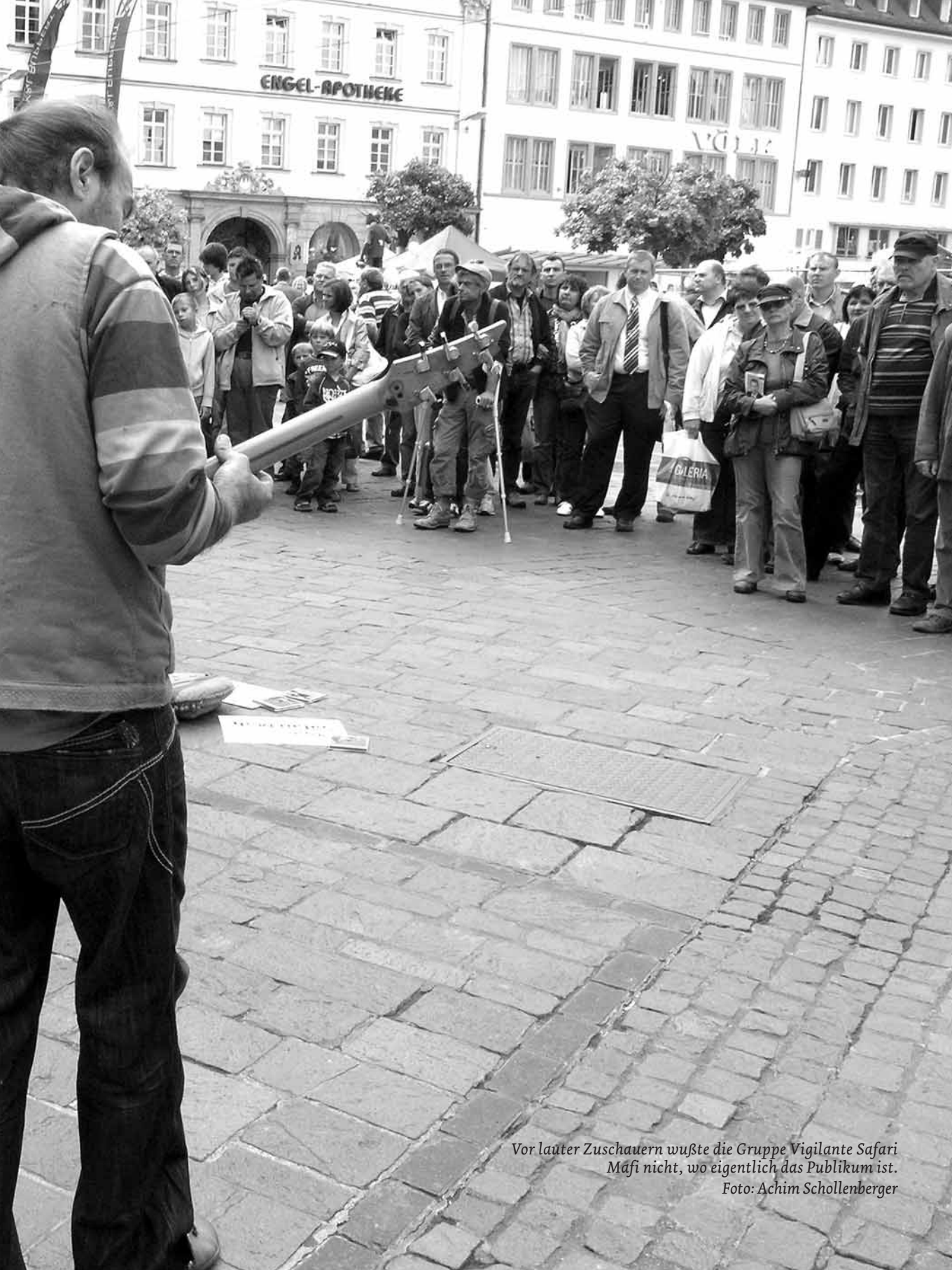
Vor lauter Zuschauern wußte die Gruppe Vigilante Safari Mafi nicht, wo eigentlich das Publikum ist.