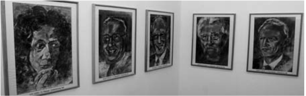
Als Fremdkörper muß man in der Ausstellung allerdings die Porträtstudien des sicher verdienstvollen Computerpioniers Konrad Zuse empfinden.

Konkrete Dichtung gäbe „der Sprachkürze Denkweite“ sagte Jean Paul sinngemäß, denn von der Erfindung des 20. Jahrhunderts konnte der scharfsinnige Spätromantiker noch nichts wissen. Anders als beim Aphorismus, der Umfassendes zum verbalen Fingerzeig bündelt, transportieren das Schriftbild und die Typographie, den Sinn einer Aussage mit. Nicht nur der Inhalt, sondern das