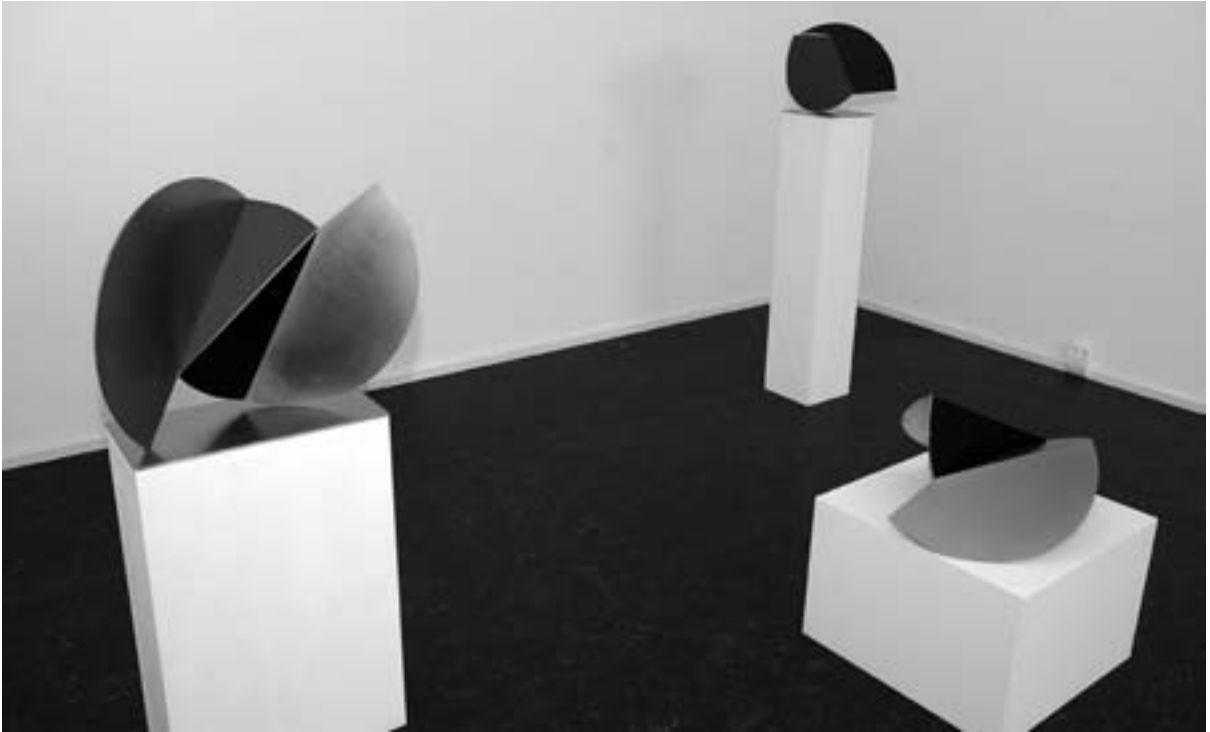
Skulpturen von Klaus J. Albert.

mitsamt seiner inzwischen auf rund 4000 Werke der Konkreten Kunst angewachsenen Sammlung 1990 in Hünfeld nieder. Hier gründete er in Zusammenarbeit mit dem Idea Kunstverein Hünfeld-Fulda die Stiftung Museum Modern Art Hünfeld Sammlung Jürgen Blum. Wo der kleine, quirlige, ansteckend aktive Künstler, der heute nicht mehr selbst malt, zu Gange ist, sprießen die Projekte aus dem Boden. Vom freimütigen Bürgermeister, vor allem aber auch von den Bürgern Hünfelds unterstützt, begann 1997 die Realisierung des „Offenen Buchs“. Seit 2003 finden im durch Pavillons erweiterten Gaswerk alljährlich einjährige Ausstellungen statt, die in 30 Räumen 31 Künstler der Konkreten und wie Blum gerne sagt: der Intelligiblen Kunst, eine Zusammensetzung aus „intelligent“ und „sensibel“, vorstellt. Die jetzige Ausstellung ( sie dauert bis 30. April 2010) ist der Auftakt zu einem Großjubiläum: Vor 800 Jahren wurde Hünfeld das Stadtrecht verliehen, der lange in dieser Stadt wohnende Computerpionier Konrad Zuse wäre 100 Jahre alt geworden, und Blum feiert seinen 80. Geburtstag.