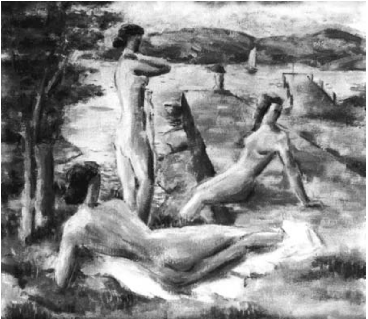
Willi Baumeister 1889-1955, Badende 1911/12, Öl auf Karton