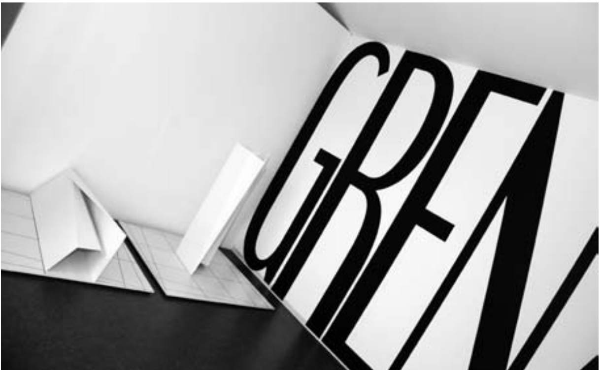
Arbeit von Karl-Heinz Adler

neunmal durch die Stadt, und was übrig blieb wurde durch ein Großfeuer 1888 zerstört. Schließlich tat der 2. Weltkrieg das Seine. Nicht einmal ideell konnte Hünfeld bisher auftrumpfen. Goethe bekundete seinen Besuch des Hünfelder Jahrmarkt 1814 zwar poetisch, doch wenig schmeichelhaft: „Bauern und Bürger, die schienen stumm,/ Die guten Knaben