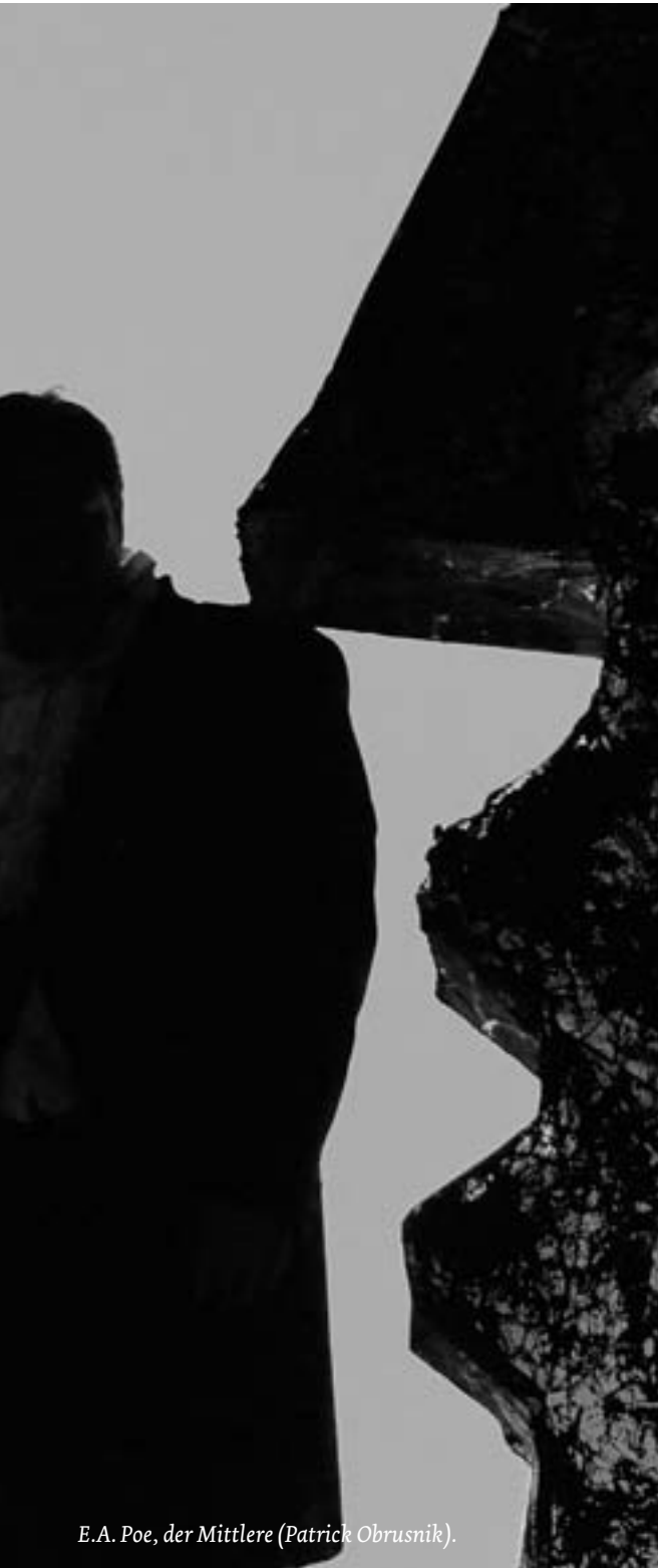
E.A. Poe, der Mittlere (Patrick Obrusnik).

Obsessionen, Alpträume, unnennbares Grauen – all das erzeugt in uns Visionen, Furcht erregende Bilder unserer Fantasie oder Träume. Aber wirklichen Schauer zu erzeugen durch ein Bühnengeschehen, das ist ein ganz schwieriges Unterfangen. Dies war auch beim durchaus ambitionierten Abend mit dem Titel „Schattenseiten“ im Theater am Neunerplatz zu spüren. Regisseur Thomas Lazarus wollte in einem umfassenden Konzept mit üppigen Bildern, Rezitation, mit Lichteffekten, mit Tanz und Musik Person und Werk des Schriftstellers Edgar Allan Poe nahe kommen. Poe wurde vor 200 Jahren in Boston geboren und gilt vielen als der Erfinder des Kriminal- oder besser Detektivromans. Damit steht er in der Tradition seiner Zeit, in der Epoche der Schauerromantik. Der 1849 unter mysteriösen Umständen gestorbene Dichter, Redakteur, Literaturkritiker und Schriftsteller provozierte immer wieder selbst seine Freunde, verursachte Skandale. Er war Trinker, war unstet, gab sich als Macho und Rassist, besaß aber auch zarte Saiten, wie das etwa die unerschütterliche Liebe zu seiner Cousine Virginia dokumentiert, die er als 13jährige heiratete und deren Verlust er, als sie 24jährig an Schwindsucht starb, zutiefst betrauerte.