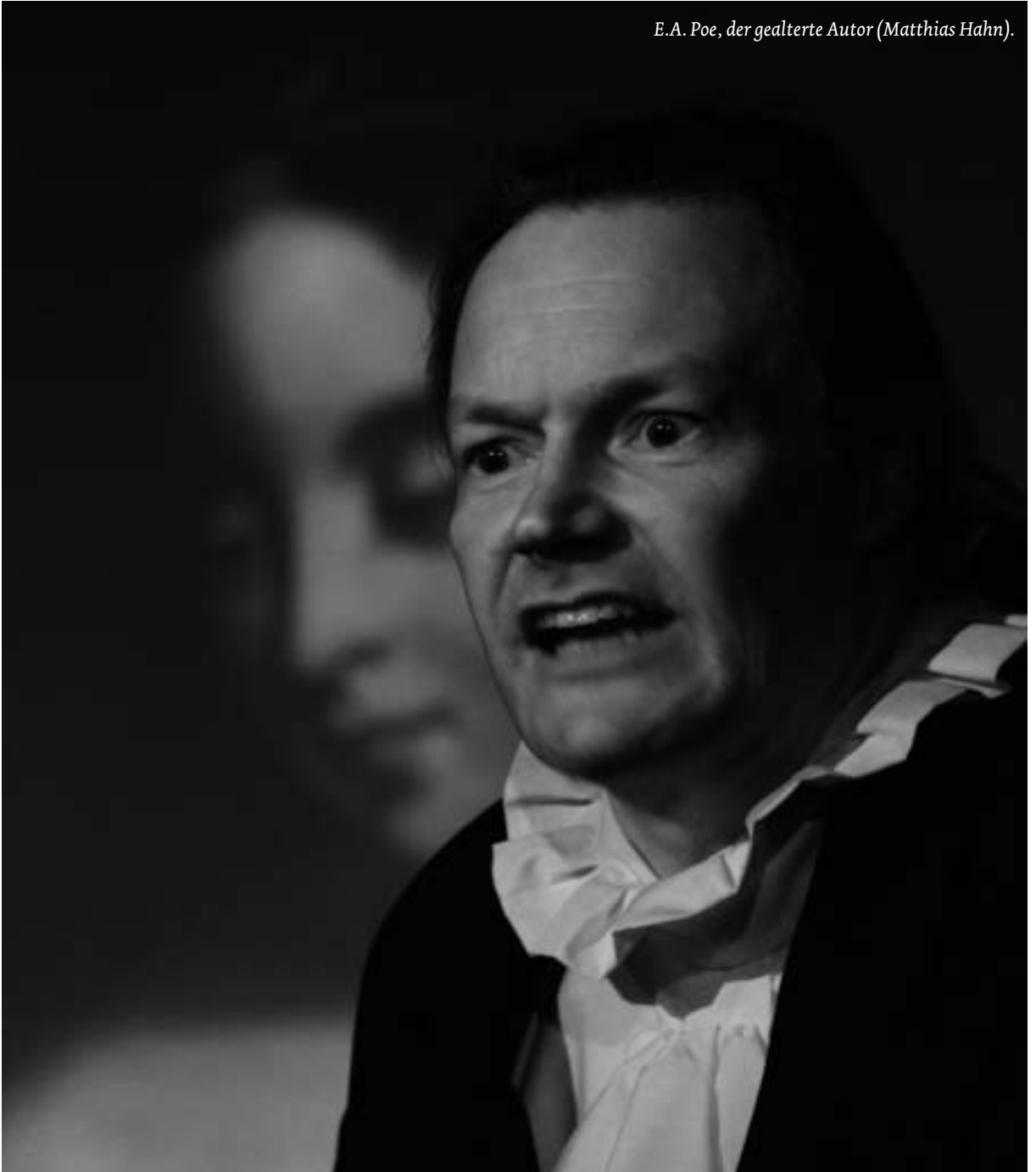
E.A. Poe, der gealterte Autor (Matthias Hahn).

Wucherndes, konnten zusammengeschoben werden und stellten, so zusammengepreßt, ein irgendwie bedrohliches Moment dar, da der Mensch zwischen ihnen eingequetscht zu werden schien. In den Szenen selbst lernte der Zuschauer Ausschnitte