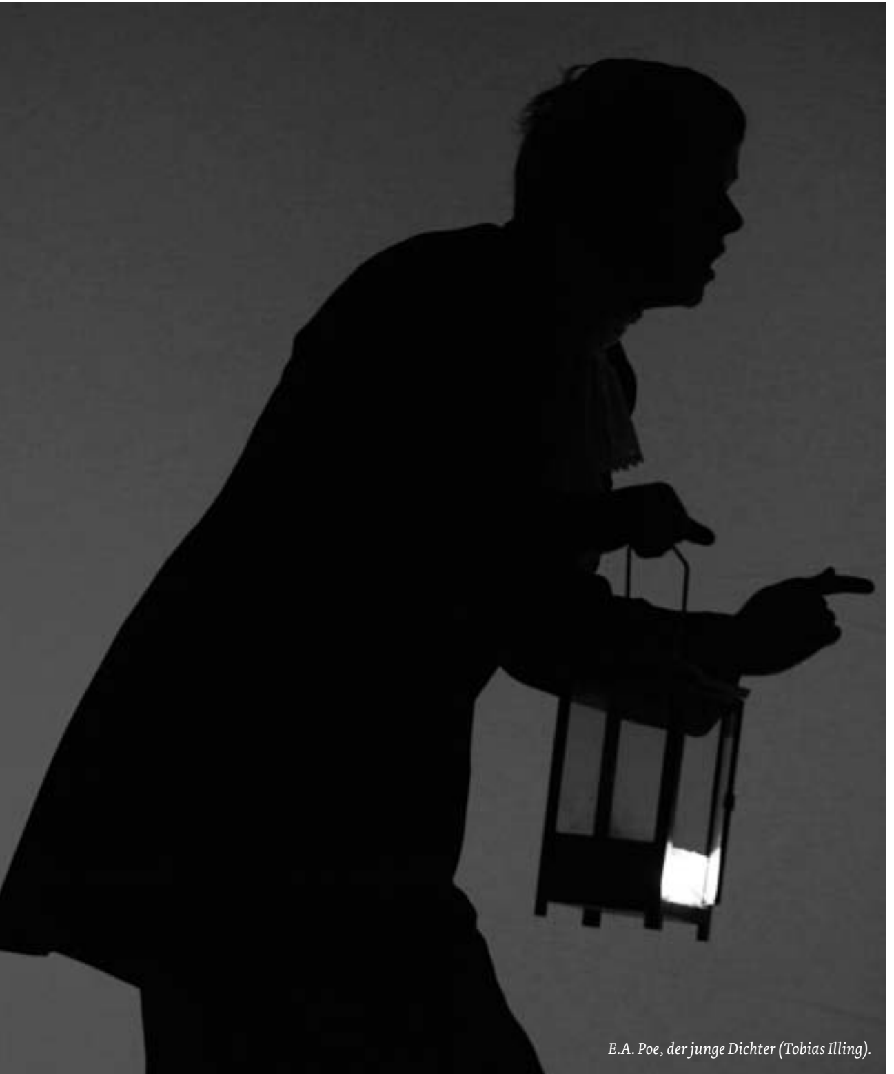
E.A. Poe, der junge Dichter (Tobias Illing).