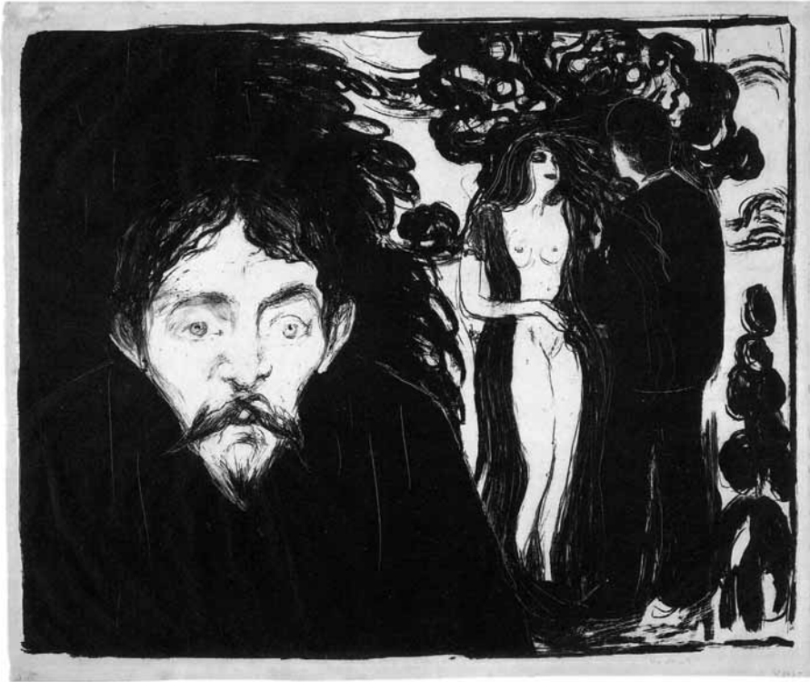
„Eifersucht“ von Edvard Munch, 1896

noch erweitert um Alte, Dirnen, gleichgeschlechtliche Paar und anderes mehr.