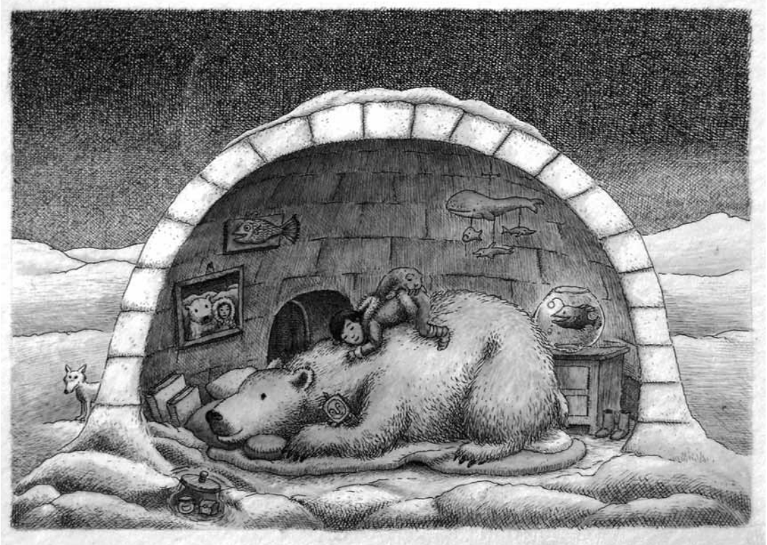
Aus „Das Land hinter dem Winter“ von Mirko Brüchler / Anna Lutter

E ine Socke hat wohl jeder schon einmal verloren. Kein Beinbruch in Kinderbüchern. Doch ob puppentrickartige Fotografie oder am Comic orientierte, dabei sehr expressive Zeichnungen, das geeignete Medium sind, um kindliche Leser zu faszinieren, scheint fraglich. Daß es in Märchen nicht immer zimperlich zugeht, haben die Gebrüder Grimm in