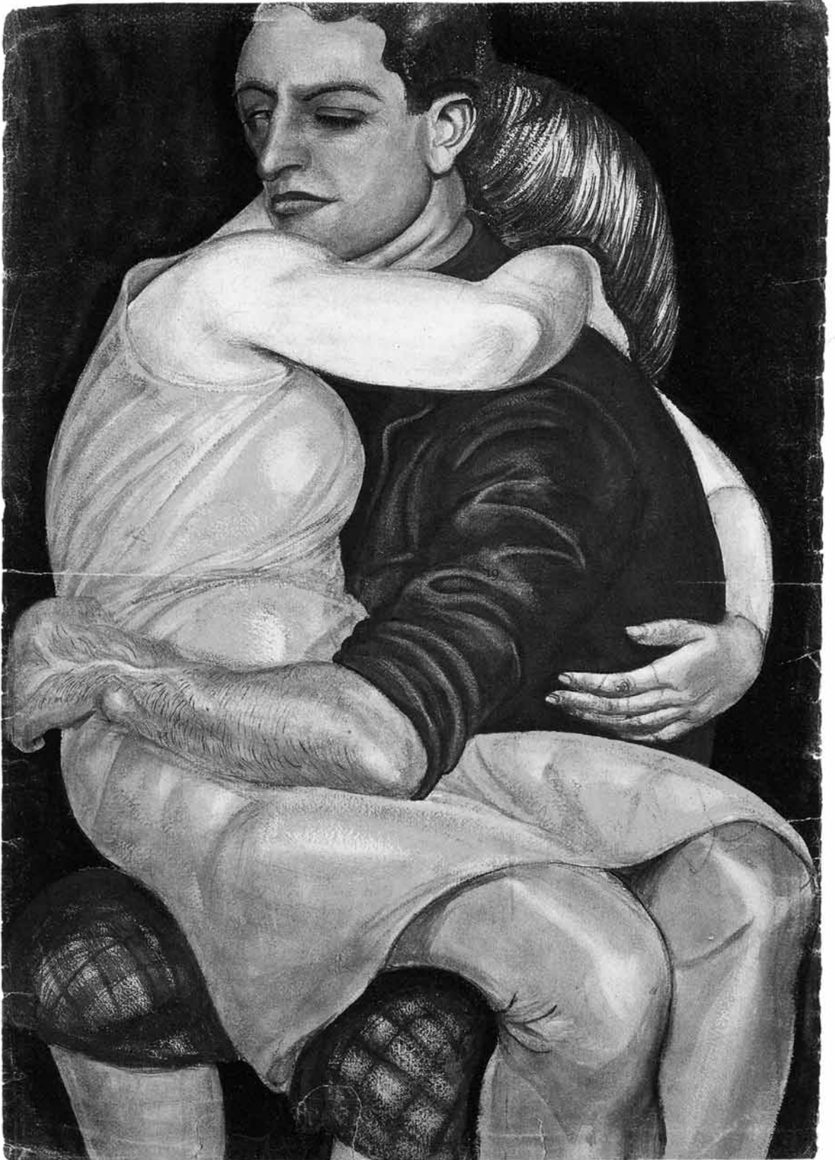
„Liebespaar“ von Kurt Günther 1928, Abb. Katalog