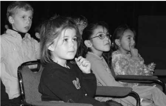
Im Theater am Neunerplatz, während der Kindershow.

Vielmehr entzieht sich das Improtheater – jedenfalls das, was in Würzburg geboten wurde – überhaupt einer Beurteilung; man kann nur festhalten, der oder die ist mir sympathisch, der oder die nicht. Was aber ist der Hintergrund, das Ziel: Sind es Übungsstunden für Schauspieler, Supervision von Selbsterfahrungsgruppen, soll es sich um Volksbelustigung handeln? Nichts gegen Volksbelustigung, nur auch