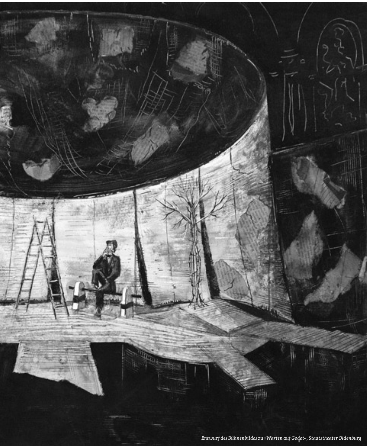
Entwurf des Bühnenbildes zu »Warten auf Godot«, Staatstheater Oldenburg