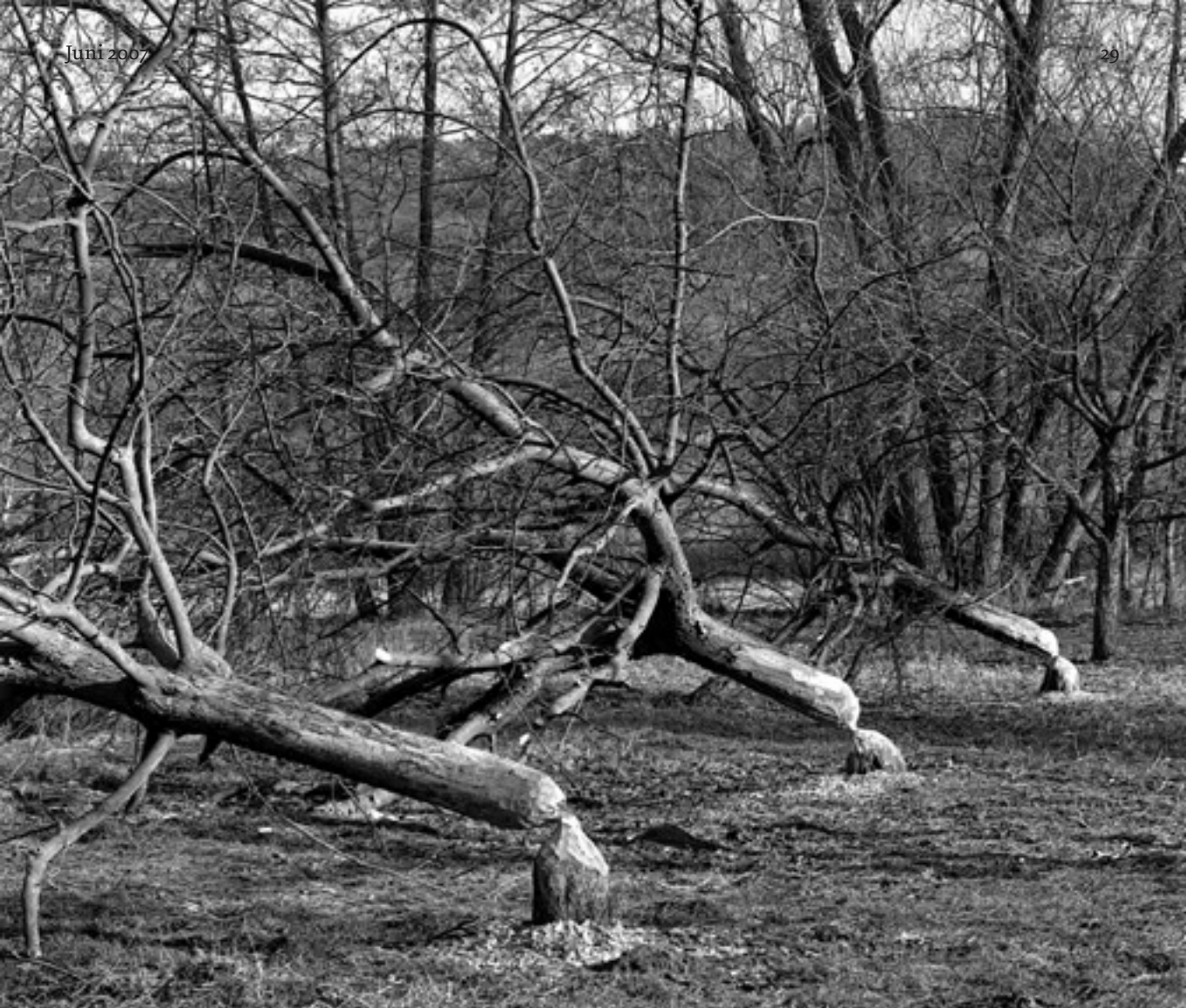
»Radikale Anarchie«.

Wer seiner Zeit weit voraus ist, muß mitunter in erbärmlichen Hütten auf sie warten, weiß meine Aphorismensammlung. In diesem Fall ist das freilich selbstverschuldet, durch die Verwendung eines zu unappetitlichen Begriffes. Anarchie, »radikale Anarchie« erst recht, akzeptiert der feinsinnige Bürger nicht einmal in einem Künstlermythos; man will mit der Hautwassersucht einfach nichts zu tun haben.