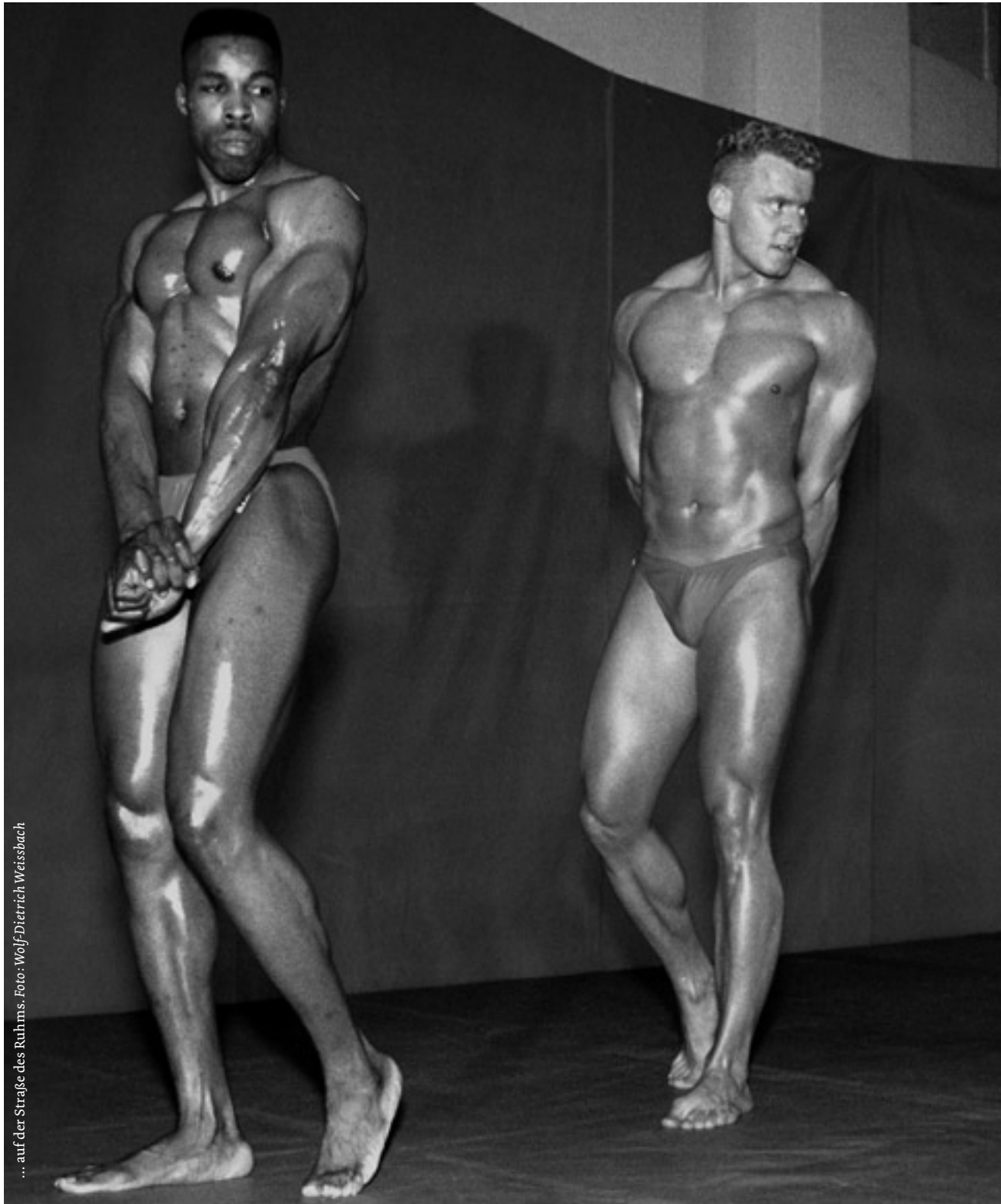
... auf der Straße des Ruhms.