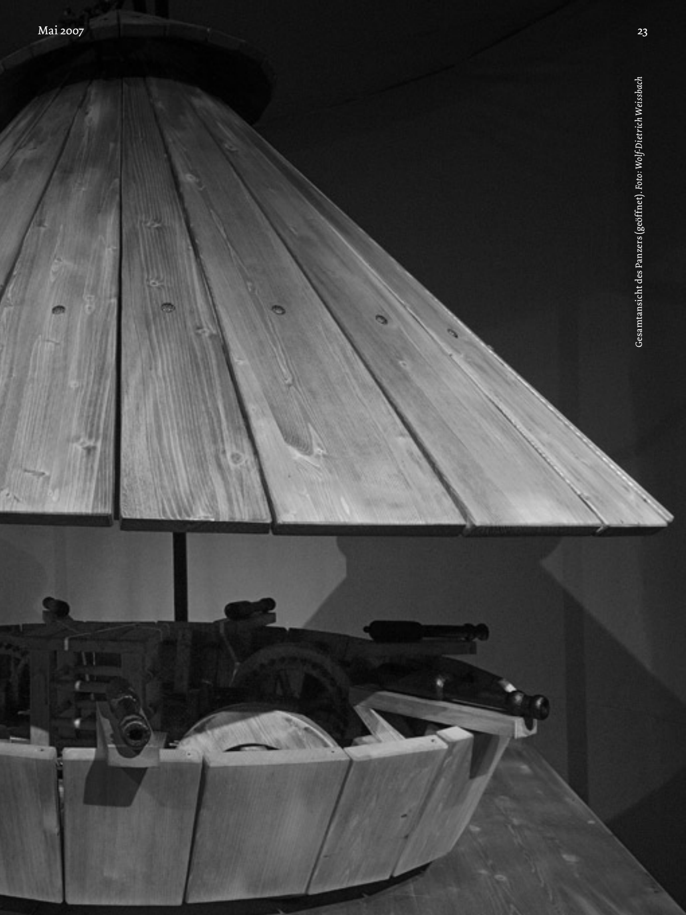
Gesamtansicht des Panzers (geöffnet).