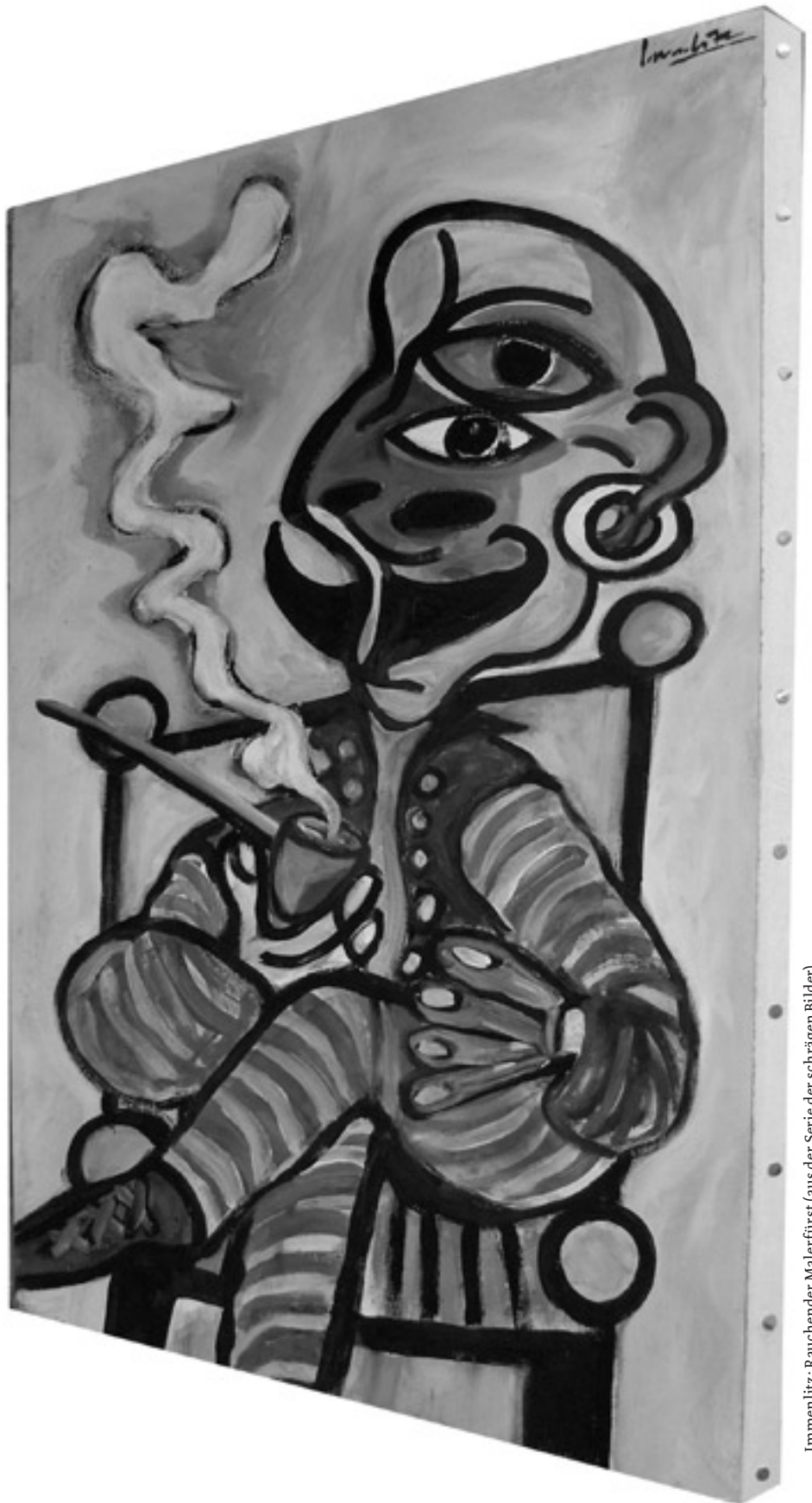
Immenlitz: Rauchender Malerfürst (aus der Serie der schrägen Bilder)