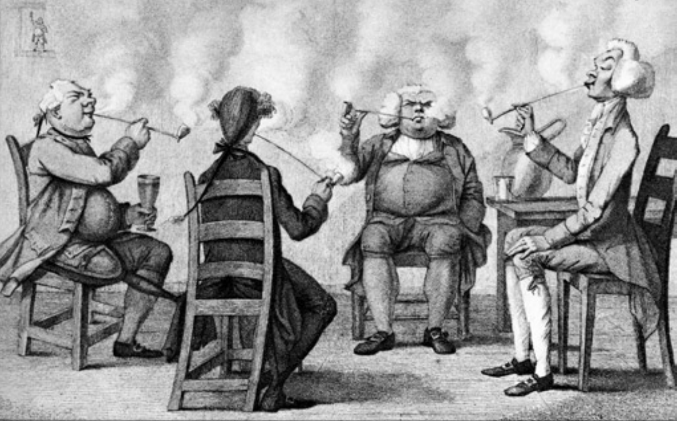
Englische Raucher. Die Vorboten der industriellen Revolution? Künstler unbekannt.