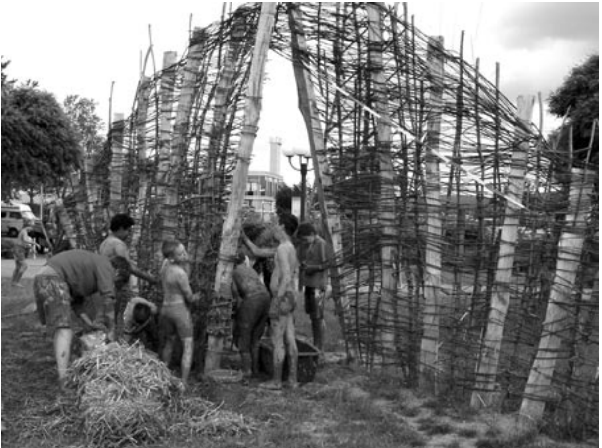
»Blickachse« im Werden.