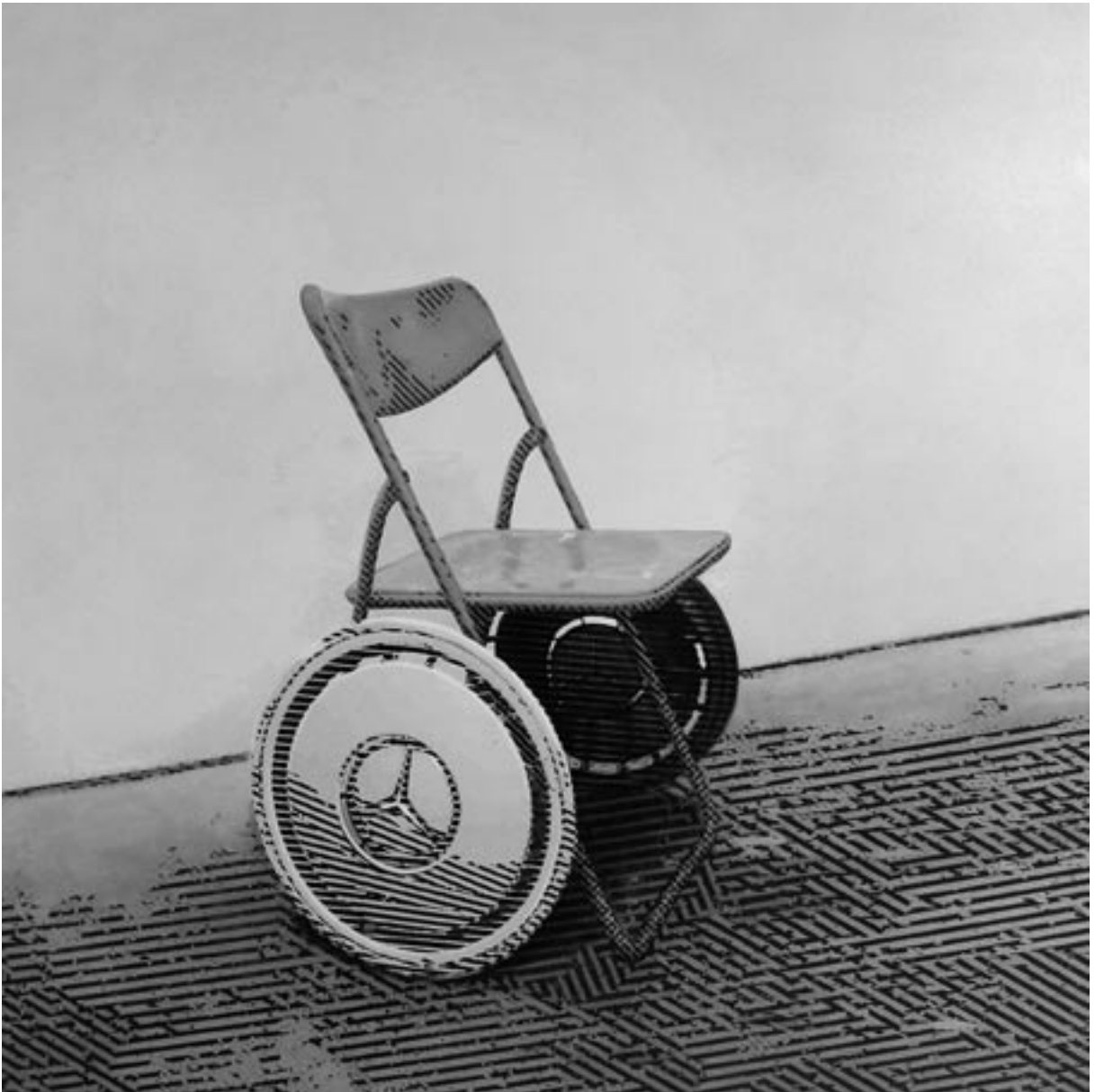
Harald Klemm: »Chair-Holders-Value«, 2006

Der Besucher der Ausstellung tut gut daran, das, was zu sehen ist, nicht oberflächlich zu goutieren. Es steckt weitaus mehr hinter der Fassade der gezeigten Werke. Daß sich beide Künstler einer humorvollen Sprache bedienen, ist ihrer Ernsthaftigkeit nicht abträglich. Der Blick auf die »Deutsche Einheit« in Schweinfurt lohnt sich. ¶