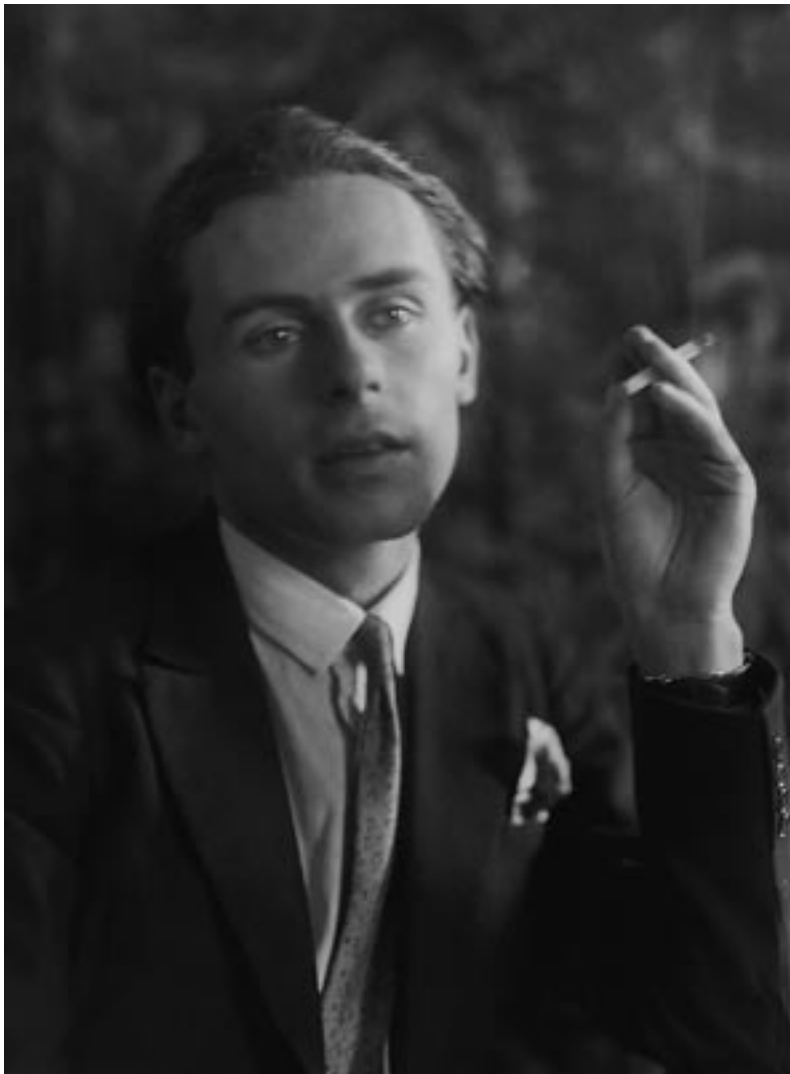
Klaus Mann.

KLAUS MANN würde 100 Jahre alt – man kann es nicht glauben, denn seine ganze Erscheinung, sein ganzes Werk war voller Jugendlichkeit und Frische. Als alter Mann oder gar Greis ist Klaus Mann schwer vorstellbar. Aber die Chroniken sprechen eine unmißverständliche Sprache: Es gilt, seines 100. Geburtstags zu gedenken.