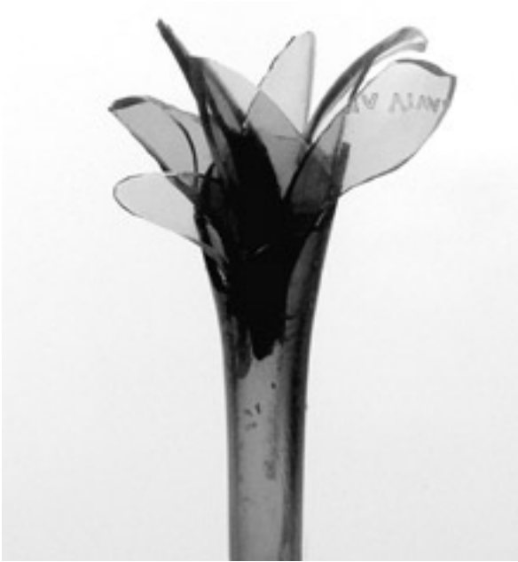
Publikumspreis: »Flores« von Alfredo Garcia Omana.