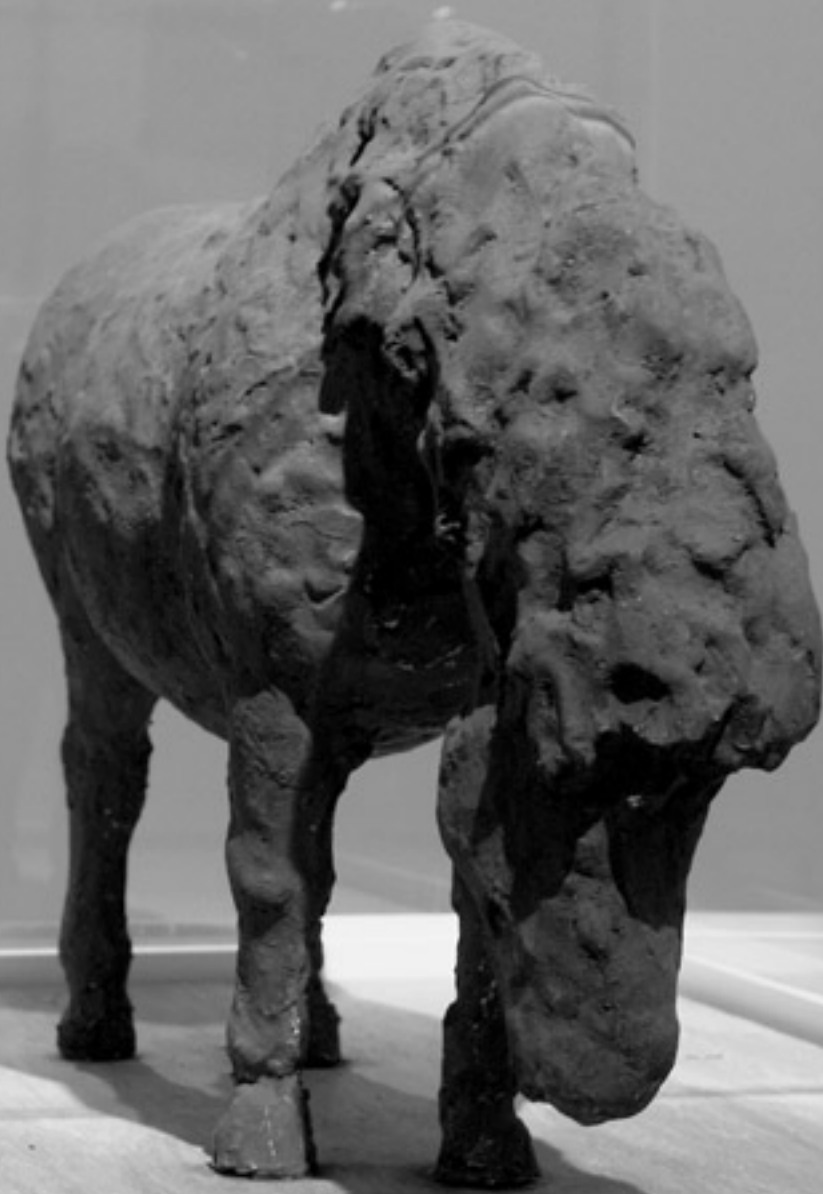
Johannes Brus: »Blaues Pferd«, 1983.

als pfiffig umgesetztes Wortspiel »Continental City«. Allerdings vermag manches gezeichnete Werk eher durch den Künstlernamen zu beeindrucken, denn durch die gestalterische Aussage. Gesprächsstoff satt also bei diesem »Dialog«, und die angenehm großzügige Präsentation ohne Überfrachtung lässt Luft dafür. ♪