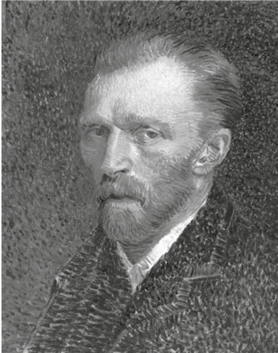
Vincent van Gogh, „Selbstporträt“, 1887, The Art Institute of Chicago, Joseph Winterbotham Collection