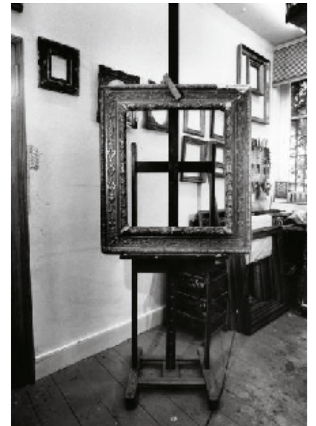
Der leere Bilderrahmen von Vincent van Goghs „Bildnis des Dr. Gachet“ im Depot des Städel, 2001

Van Gogh stellte nicht nur in Kaschemmen aus, er war auch mehrfach im „Salon des Indépendants“ in Paris vertreten, der wichtigsten Ausstellung der Avantgardekünstler, und in der berühmten Ausstellung „Les Vingt“ in Brüssel. Seine Arbeiten wurden von Kritikern durchaus lobend erwähnt und von Künstlern, wie Monet und Toulouse-Lautrec, geschätzt. Im Januar 1890 erschien in einer Literaturzeitschrift ein nahezu hymnischer Artikel von Albert Aurier, der van Gogh nicht nur in die Nähe des „Goldenen Zeitalters“ in den Niederlanden rückte, sondern auch den Grundstein für die spätere Rezeption legte: „Was sein Werk in seiner Gesamtheit charakterisiert, ist der Überschuss an Kraft, an Nervosität, an Heftigkeit des Ausdrucks ... Darüber hinaus, wie aufgrund der fast orgiastischen Ausschweifungen in fast allen seinen Bildern zu vermuten, ist er ein Fanatiker, ein Feind der bürgerlichen Nüchternheit und Kleinlich-