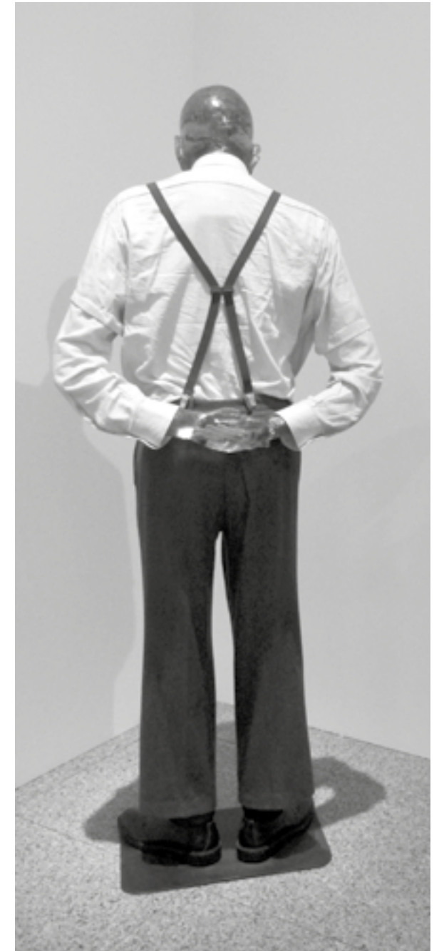
Martin Kippenberger, „Martin, ab in die Ecke und schäm Dich“, 1989/90, Private Collection

Konnte man Ende des 20. Jahrhunderts überhaupt noch malen und Anerkennung im Kunstmarkt finden? Geht es denn überhaupt um Anerkennung? Kollege Albert Oehlen behauptet, Bilder wollen gemalt werden, nimmt sich quasi selbst aus der Rolle des Initiators, wird zum Medium, malen nicht, um zu ..., sondern als unabhängiger Vorgang von Markt und Vorsatz. Es gelang einigen, den Düsseldorfer Künstlern Sigmar Polke, Konrad Lueg und Gerhard Richter mit ihrem „Kapitalistischen Realismus“, den Neo-Expressionisten, den Neuen Wilden und eben den Hetzler-Boys mit Martin Kippenberger. Doch der sagt mit 25, er sei fertig als Maler, schreibt, dichtet, performed, will Schauspieler werden, mutiert om-