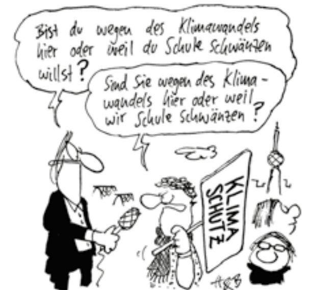
„Fridays for future“ von Hauck & Bauer