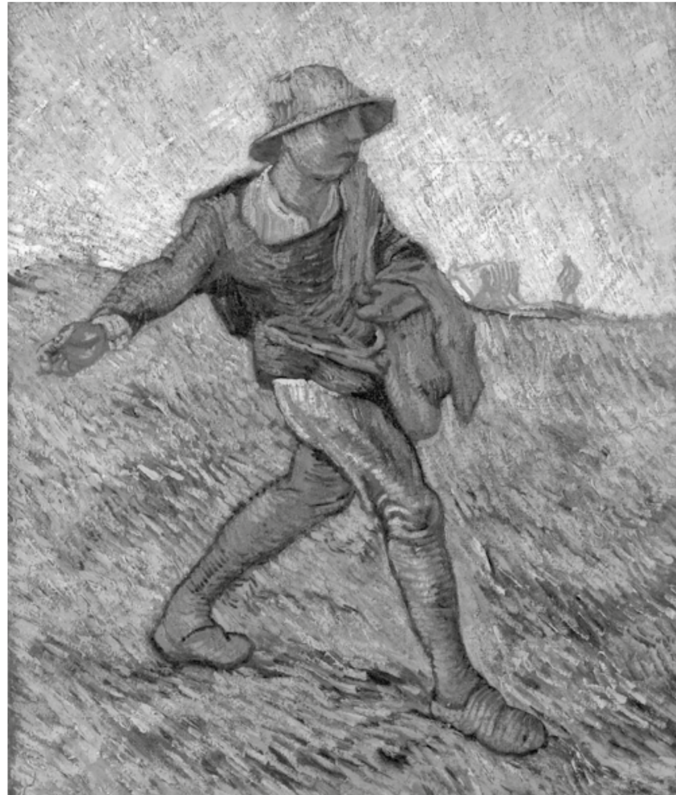
Vincent van Gogh, „Der Sämann“ (nach Millet), 1980