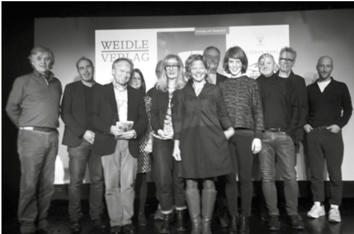
Die unabhängigen Verlegerinnen und Verleger und ein Schauspieler im Theater am Neunerplatz in Würzburg.

Diese literarische Soiree fand am 22. November 2019 im Theater am Neunerplatz statt, und was zunächst vielleicht etwas trocken klang (unabhängige Verleger?), entpuppte sich rasch als gar nicht trocken, sondern als äußerst heiterer, spannender, ja anregender Abend, eine neue Art Bücher vorzustellen – und sicher auch zu verkaufen! Was sind unabhängige Verlage oder Verleger? Es handelt sich hier um die Unabhängigkeit von publizistischen Konzernen wie zum Beispiel Random House/Bertelsmann, dem allein 47 Verlage angehören. Seit 2000 fördert die Kurt Wolff Stiftung