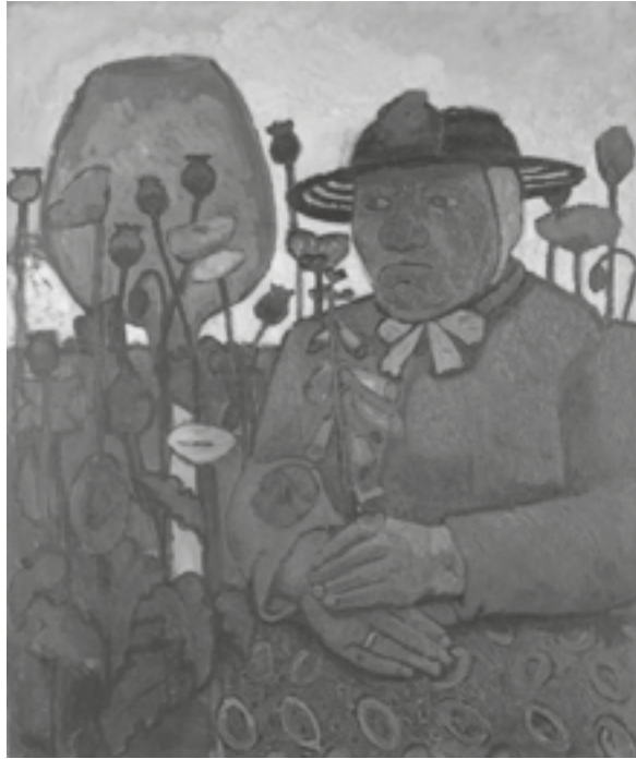
Paula Modersohn-Becker, „Alte Armenhüßlerin mit Glaskugel und Mohnblumen“ (1907)

senbeschaffung versteigert und befindet sich heute, unzugänglich für die Öffentlichkeit, in Privatbesitz. In der Frankfurter Schau hängt der leere Originalrahmen des Gemäldes. Eine weitere traurige Folge des NS-Kunstvandalismus: Vor 1914 befanden sich 150 Arbeiten von van Gogh in öffentlichen und privaten Sammlungen Deutschlands. Nach 1945 waren es nur noch rund 25 Gemälde und Zeichnungen. Die psychischen Probleme des Künstlers, die ihm zuerst Mitgefühl eingebracht hatten, wurden nun gegen ihn verwendet: „Irre“ Künstler könnten nur „irre“ Kunst schaffen, hieß es bei den Nazis. Nach der großen Ausstellung des Sonderbundes 1912 in Köln, die allein van Gogh fünf Säle mit 125 Arbeiten widmete, kannte die überschäumende Liebe der Deutschen zu diesem Künstler kein Halten mehr. Neben der Liebe wuchs freilich auch die Legende um den einsamen, nur seinem Genie folgenden Künstler - befeuert in erster Linie von dem Kritiker und Schriftsteller Julius Meier-Graefe. Neben zahlreichen Aufsätzen räumte er in seiner „Entwicklungsgeschichte der Moderne“ (1904) van Gogh den gewichtigsten Platz ein, feierte ihn gleichzeitig als „brutalen Barbaren“ und „Christus der modernen Kunst“. 1921 schickte er sein Buch „Vincent“ nach, das ab 1932 mit dem Untertitel „Roman eines Gottsuchers“ erschien.