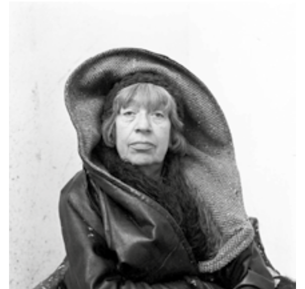
Lee Krasner, Spring NY 1972

Pollock, der ihr im Gegensatz zu Mondrian beim Tanzen dauernd auf die Füße trat, begegnete sie 1936, sah aber erst fünf Jahre später Gemälde von ihm und war fasziniert. 1945 heirateten sie, kauften mit einem Darlehen von Peggy Guggenheim, einer Mäzenin des jungen Pollock, ein Schindelhaus im ruhigen Long Island. Die Einsamkeit, so fand Lee Krasner, bekomme dem schwer alkoholkranken Pollock besser als die stets verführerische Großstadt. „Ohne sie wäre ich schon lange tot“, bemerkte Pollock oft. Während der Ehe stockte Lee Krasners Karriere. Während Pollock im umgebauten Schuppen seine Dripping-Choreographien auf riesige, auf dem Boden liegende Leinwände tanzte, verzog sich Lee in eine Schlafzimmerecke des Wohnhauses und widmete sich notgedrungen kleinen Formaten. Ihre „Little Images“ bezeugen aber schon ihre Liebe zur Kalligraphie, zu rhythmischen Formen, die wie eine Geheimschrift dicht bei