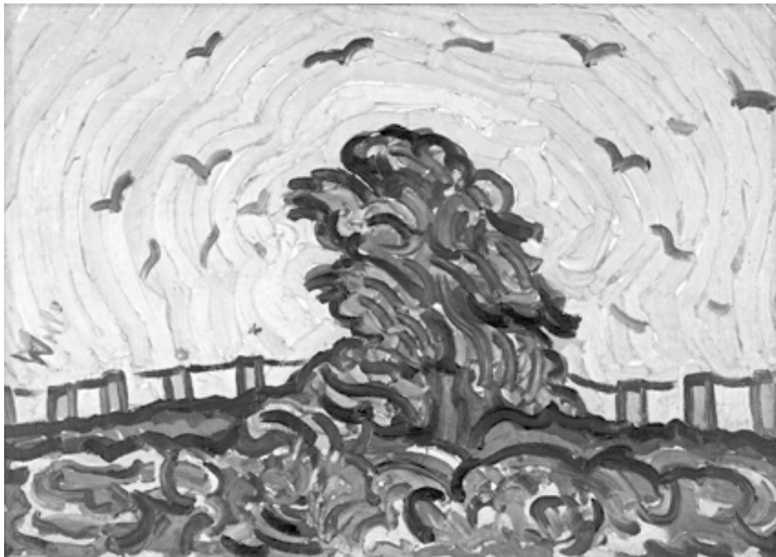
Wilhelm Morgner, „Der Baum“, Museum Wilhelm Morgner, Soest

Das weitaus revolutionärere „Bildnis des Dr. Gachet“ (1890), das 1911 in den Besitz des Städel gelangte, wurde 1937 als „entartet“ beschlagnahmt, zur Devi-