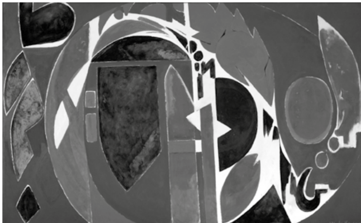
Lee Krasner, „Palingenesis“, 1971, ©Pollock-Krasner Foundation/VG Bild-Kunst Bonn 2019. Courtesy Kasmin Gallery, New York

tragen so vielsagende Titel wie „Prophecy“, aber auch „Birth“ und „Three in Two“. Im Gegensatz zum späten Pollock gab Krasner ihren Arbeiten immer Titel, von der Literatur beeinflusst, die sie liebte. Schon 1957 zog sie ins ehemalige Atelier ihres Mannes, die Scheune in Long Island, und von nun an wurden ihre Arbeiten groß und größer. „The Eye is the First Circle“ (1960), schwer umrandete, braune und schwarze Kreisformationen, die über nicht grundierte Leinwand jagen, „Polar Stampede“ (1960), rhythmisch zerhackte biomorphe Formen, in stakkatohaftem Schwarz und hellem Braun sowie „Another Storm“ (1963) mit breiten, purpurnen Pinselschlägen auf weißem Grund wie Gischt in einem Blutstrom sind mehr als 2,50 Meter hoch und fast fünf Meter breit. Die 1,60 Meter große Lee Krasner, die ihre Leinwände immer zum Arbeiten an die Wand hängte, brauchte oft eine Leiter, um die oberen Passagen des Bildes zu erreichen.