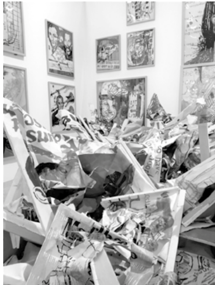
Martin Kippenberger, „Heavy Burschi“, 1989/90, K21 Kunstsammlung Nordrhein-Westfalen (Container mit Leinwandschrott)

Der Puls rast eher durch Locations der Metropolen, da tobt der Bär und mit ihm Kippenberger. Er findet Wege, lässt malen und ist bei aller Schrägheit spürbar echt, bleibt bei allem Klamauk und Tamtam sensibel und am Herzschlag seiner Zeit, streitbar für seine Kunst! Weniger für seine Person, aber immer im Bilde, nimmt er Politik und Kulturszene und Künstlerego liebevoll böse auf Korn, entlarvt und hat Spaß. Humorvoll und nur scheinbar absurd gibt er den Kunst-Kasper in bestem Sinne, immer