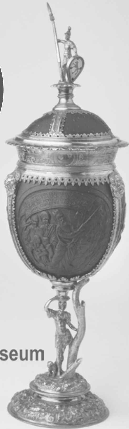
Wilhelm Dewyll, Kokosnusspokal, 16. Jahrhundert, aus der Schatzkammer des Deutschen Ordens in Wien