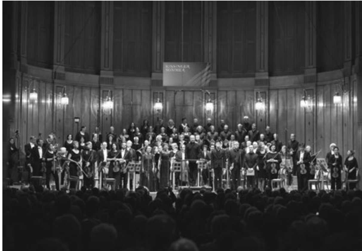
Das große Abschiedskonzert ist passé.