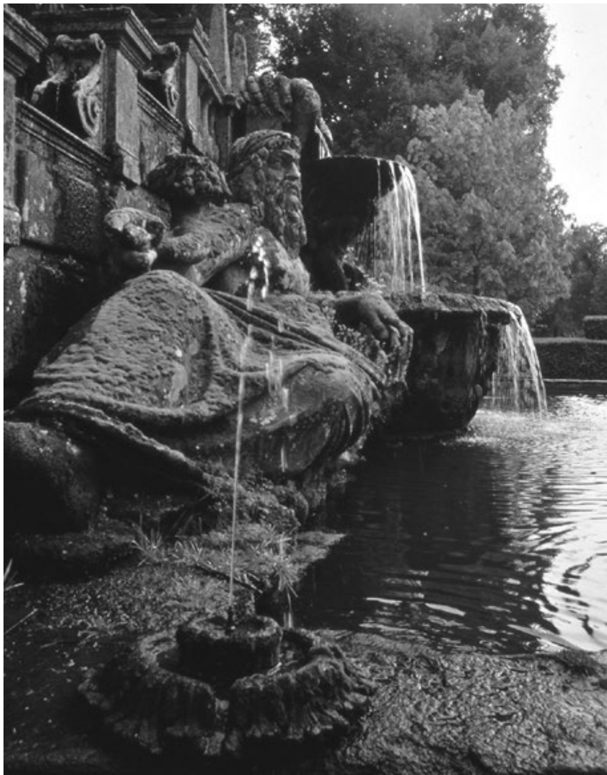
Villa Lante in Bagnaia, Italien