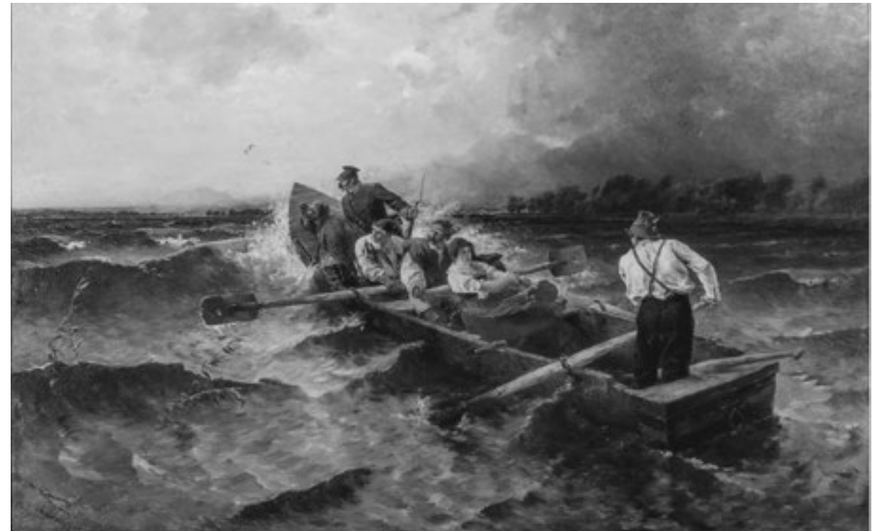
Josef Wopfner, „Verfolgung von Wilderern auf dem Chiemsee“, 1884