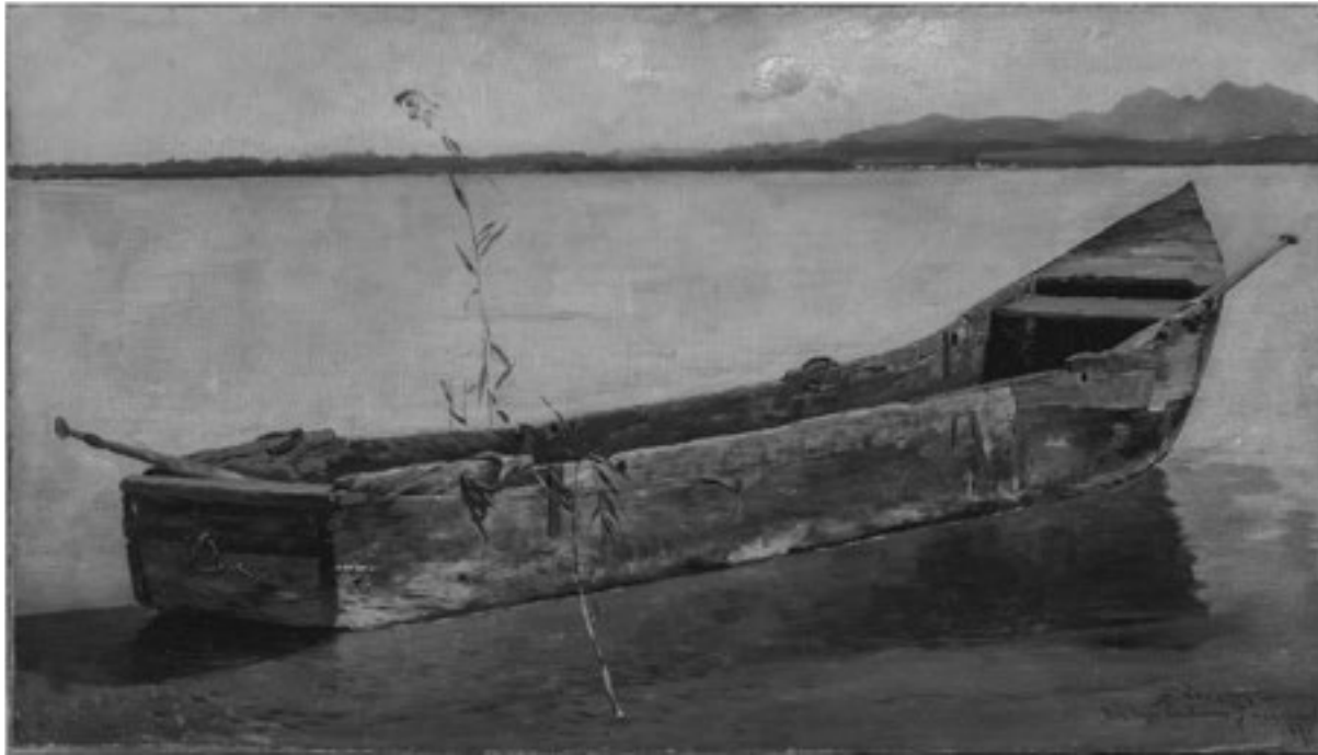
Josef Wopfner, „Der letzte Einbaum“, 1887