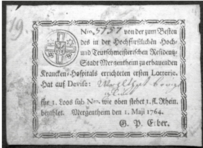
Lotterieschein Nr. 5157 vom 1. Mai 1764, Sammlung Deutschordensmuseum

chen für einen Finger der Hl. Katharina von Alexandrien, 1240 in einer Straßburger Werkstatt gefertigt, ein Vortragekreuz von 1487, ein Werk des Würzburger Meisters Hans Peter, ebenso ein fein aus einer Kokosnuß geschnittener Pokal, gefaßt von einem Wiener Goldschmied, ein Geschenk für den Komtur und Hochmeister von Westernach, geschaffen zwischen 1571 und 1582.