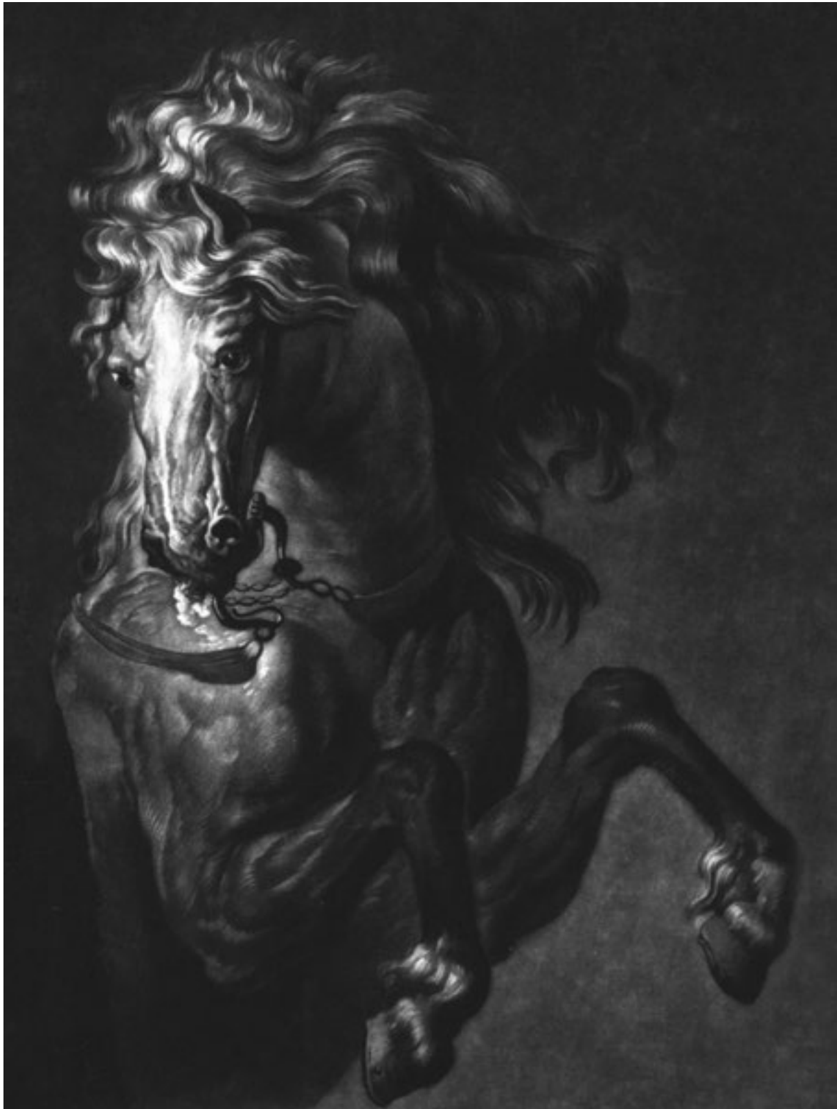
Pferdekopf nach Rubens (andere meinen nach van Dyck)