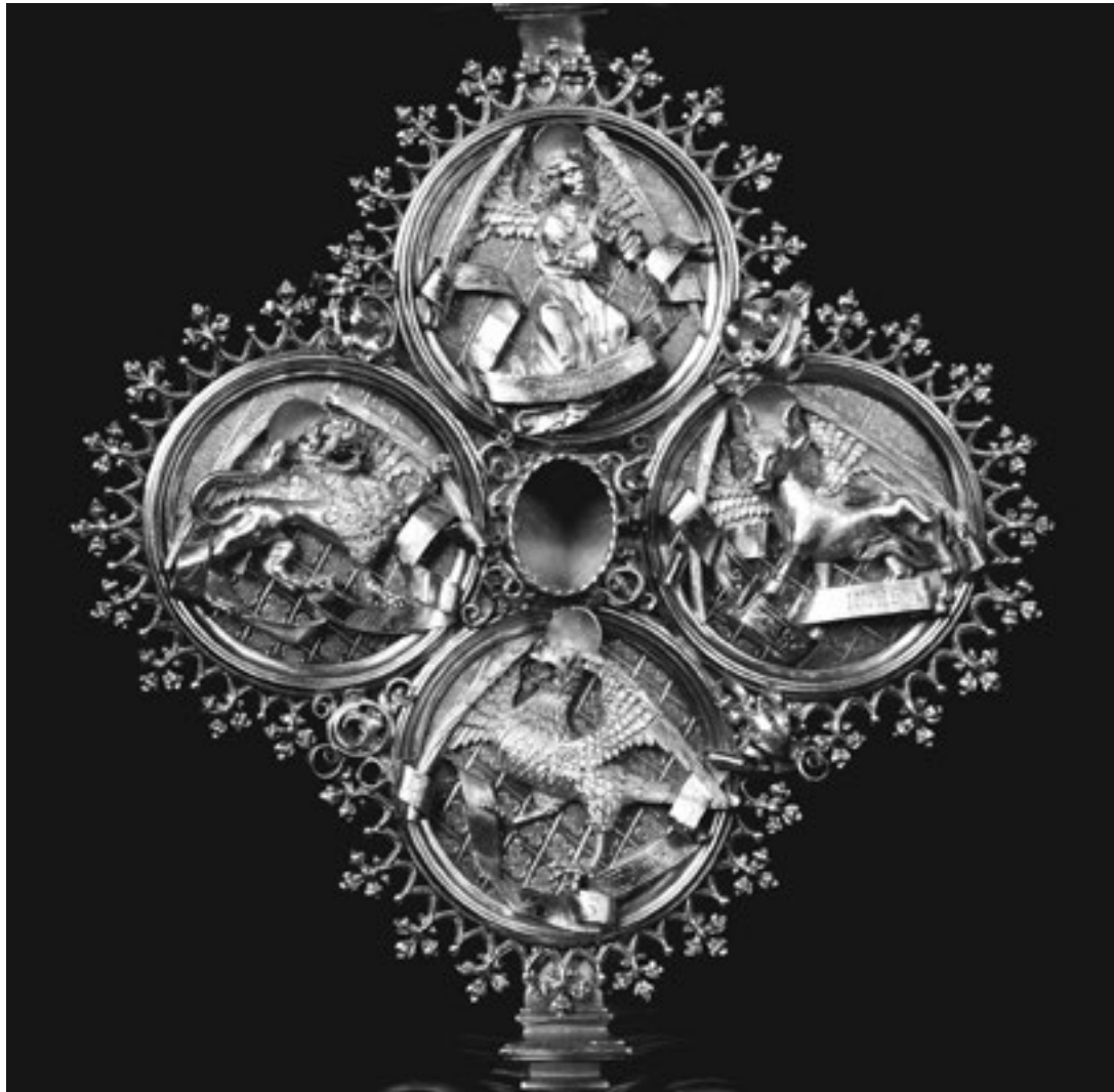
Gotisches Vortragekreuz, 1482, Goldschmiedearbeit von Hans Peter, Würzburg

Gegründet wurde der Orden 1190 im Heiligen Land als Hospitalorden; die Niederlassungen im deutschen Raum dienten der Unterstützung der Kreuzritter im Kampf gegen die Muslime; Schutzpatron war der Hl.