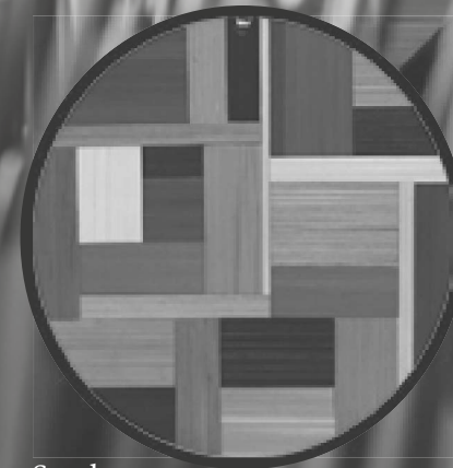
Schmuck aus Stroh