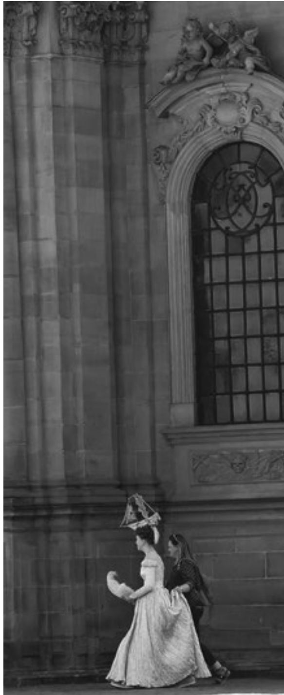
Maritimer Kopfschmuck, elegant präsentiert...

P.S. nummer 146 erscheint Mitte September.