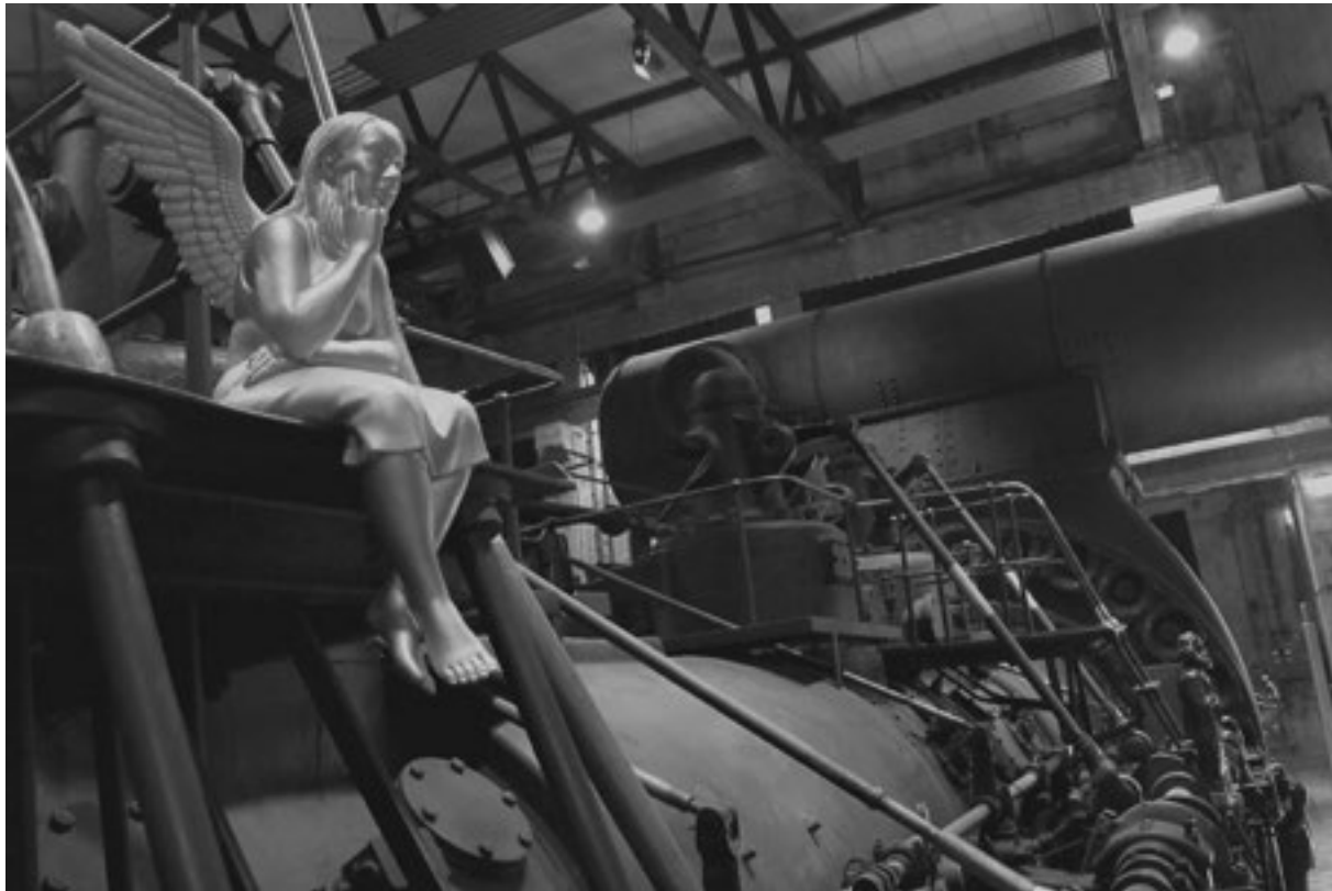
Engel von Ottmar Hörl

vor der Fleißarbeit. Einige Arbeiten von Mentalgassindes sind eigens für die Völklinger Hütte konzipiert und ummanteln riesige Silotürme mit gigantischen Gesichtern, bereichern die organische Anmutung der Anlage. Der Versuch, diese Kunstform als reines Ausstellungskonzept zu generieren bleibt problematisch und gelingt nur in Teilen. Auf dieses Phänomen der Kunstwelt gehen wir im folgenden detaillierter ein und schlagen einen Bogen zu einem der angesagtesten Orte und Spielplätze der Urban Art in Europa, dem Standort Berlin: URBAN NATION. Was soll Kunst können? Muß sie etwas transportieren, einem Motto folgen, inhaltlich aufgeladen sein dieser Tage?