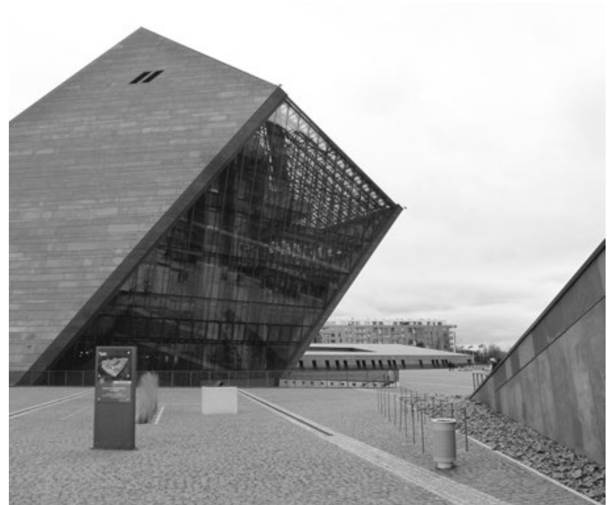
Museum Zweiter Weltkrieg in Danzig

Turm der Nikolaikirche mit 95 Metern dominiert wird. Die Fassaden der neuen Häuser wagen einen Spagat zwischen historistisch und modernistisch. Um einen möglichst lebendigen Eindruck zu erzeugen, ist der Phantasie der Architekten kaum eine Grenze gesetzt worden. Wesentlich lockerer als bei der Rekonstruktion der Frankfurter Altstadt wird hier mit Geschichte als Formgeber gespielt. Noch ist viel zu tun. Eine besondere Herausforderung wird die neue Gestaltung des Ufers am Elbingfluß sein. Die Rekonstruktion der Altstadt von Elbing wird, wenn sie einmal vollendet ist, ein Ensemble bilden, das die restaurativen Tendenzen unserer Zeit beispielhaft abbildet. ¶