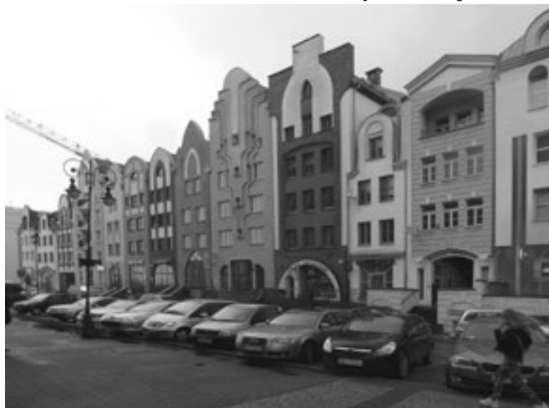
Hafensstadt Elbing, Seitenstraße

Die Hafensstadt Elbing, vom Deutschen Ritterorden 1237 gegründet, 1246 mit Stadtrecht versehen, 1340 durch eine Neustadt erweitert, war planvoll parzelliert und bebaut worden. Eine breite Hauptstraße, zugleich Markt, zog von Nord nach Süd durch die Altstadt. Von ihr zweigten schmale Straßen wie Rippen nach beiden Seiten ab, jeweils mit einem Tor nach außen geöffnet. Die Bauten der Infrastruktur wie Rathaus, St. Nikolaikirche, Dominikanerkloster und Spital fanden in den Blöcken Platz. Das Ganze umwehrten Mauer und Wassergraben. Die Neustadt