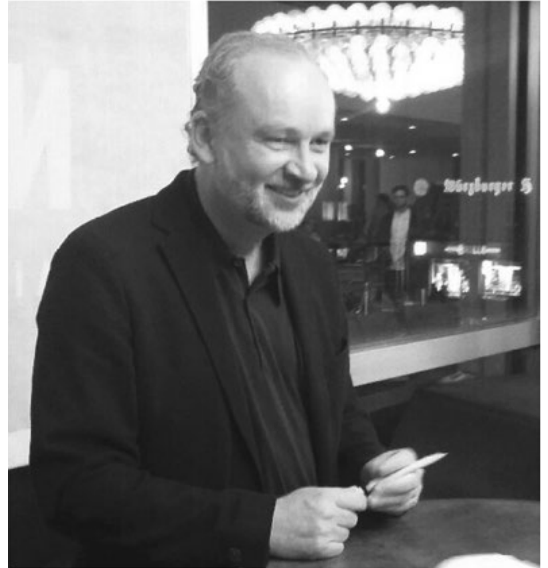
Der Autor Ferdinand von Schirach im Mainfranken Theater Würzburg

Ferdinand von Schirach versteht es auch, mit wenigen hingeworfenen Sätzen diese besondere Atmo-