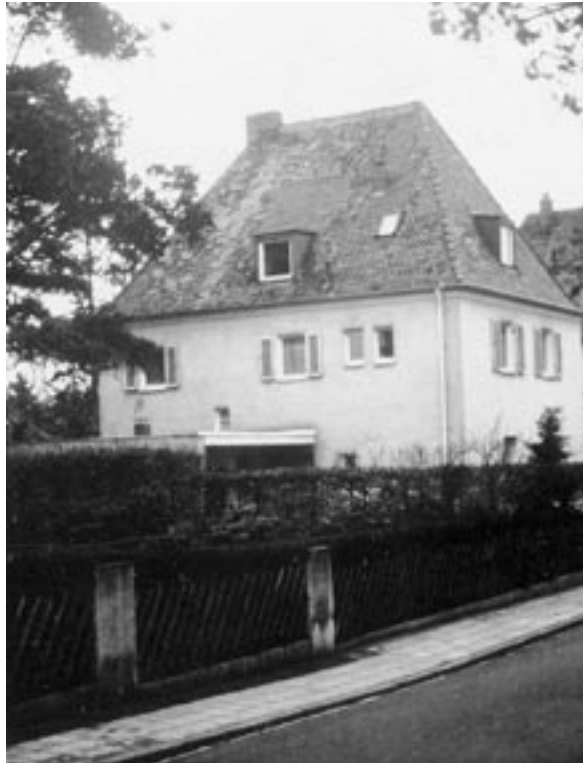
Zeugenhaus in Nürnberg-Erlenstegen.

wirkliche Auseinandersetzung mit dem Geschehenen verhinderte.« Es sind aber Zweifel angebracht, daß diese Zeit schon vorbei ist. Die letztlich ziemlich willkürliche Vermengung, Aneinanderreihung von historischen Fakten, Recherchebericht und kleinen, alltäglichen Geschichten, die mitunter kaum mehr als anzügliche Gerüchte sind, wird man jedenfalls schwerlich als »wirkliche Auseinandersetzung« bezeichnen können. Das Buch macht eher den Eindruck, daß es geschrieben werden mußte, weil bereits viel Arbeit drinsteckte. ¶