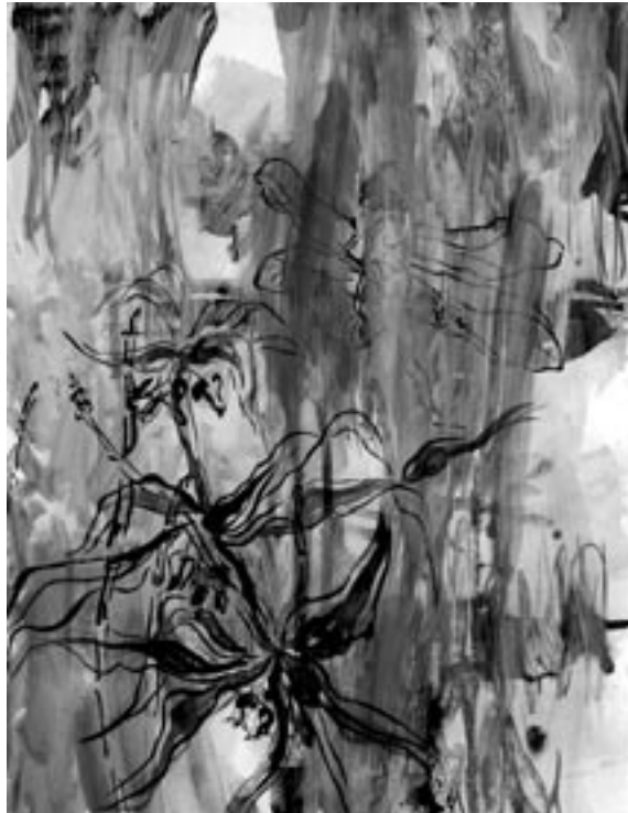
Rosi Schauer: »Libelle« • www.rosi-schauer.de

Ausstellung vom 24. März bis 29. April 2006 Do., Fr., Sa. 16.00–19.30 Uhr u.n.V.