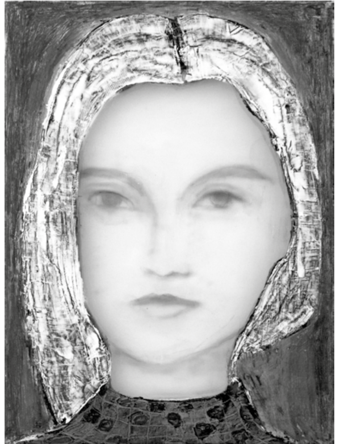
Sue Hayward: „Young Girl (orange shirt)“ (2018)