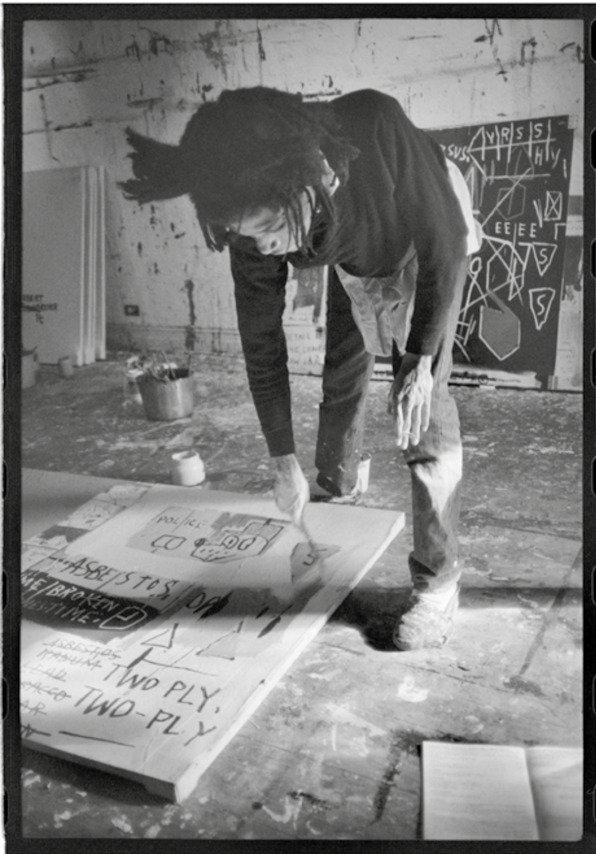
Jean-Michel Basquiat painting, 1983