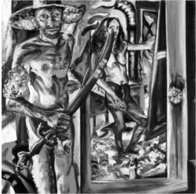
Steffi Mayer-Zwei (2004) – Abbildung aus dem Katalog

Diese Stilleben zeigen überlebensgroß Blumen, die schon für sich den Drang ins Große haben, etwa Liliengewächse unterschiedlichen Aussehens, unterschiedlicher Farbe und Provenienz. Aber große Gewächse müssen nicht schon groß und unanfechtbar im Bild stehen. Im Gegenteil ist beherrschend – grade wenn man von den Bildern weiter zurücktritt – , wie die Blumen und Früchte integriert, ja fast überwuchert sind von anderen, wie die Blätter Eigenleben gewinnen, lebendig zu werden scheinen