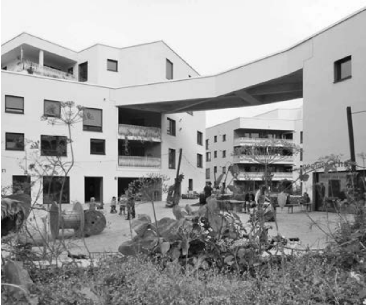
auf dem Gelände einer ehemaligen Kaserne an der Domagkstraße in München. Ein ganzes Quartier mit fünf großen Häusern.

Chance genutzt, das Konzept zu entwickeln und zu realisieren.