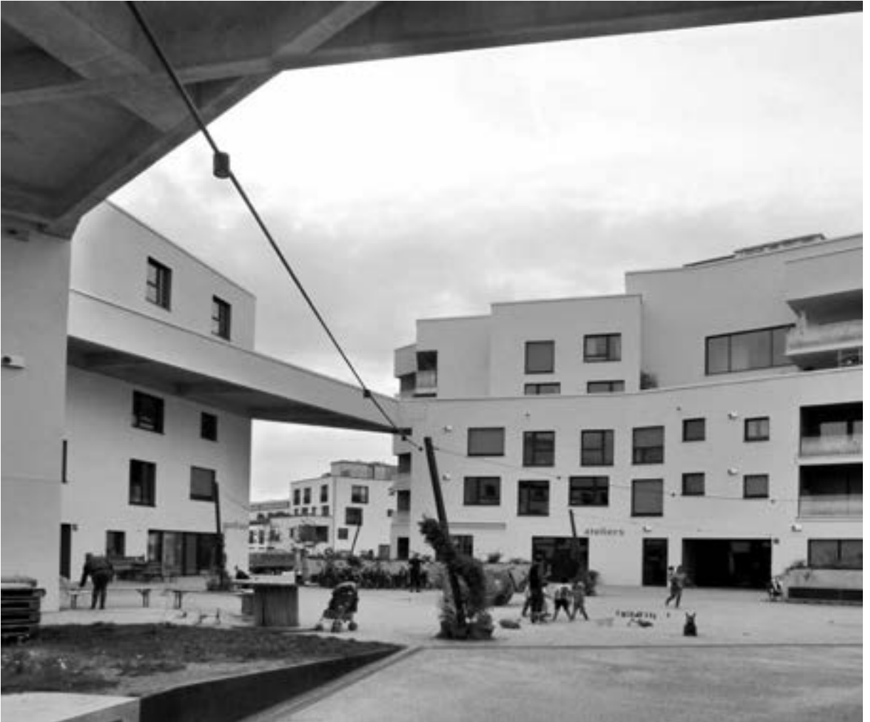
Architekten bogewischs büro und Schindler Hable SHAG, wagnisART -

angeordneten Wohnungen wechseln im Zuschnitt. Es gibt kleine für Singles und größere für Familien mit Kindern, alle mit privaten Freibereichen ausgestattet. Insgesamt bergen die fünf Häuser 163 Wohnungen für circa 500 Personen. Mit Blick auf den demographischen Wandel sind auch neue Wohnformen möglich wie zum Beispiel Wohngemeinschaften oder Wohngruppen um einen Gemeinschaftsbereich mit Küche und Eßplätzen. Das vierte und fünfte Geschöß ist teilweise zurückgesetzt, so daß dort vor den Wohnungen kleine Spiel- und Aufenthaltsflächen liegen, die über Treppen und Brücken zusammengespant sind. Aufzüge und Verzicht auf