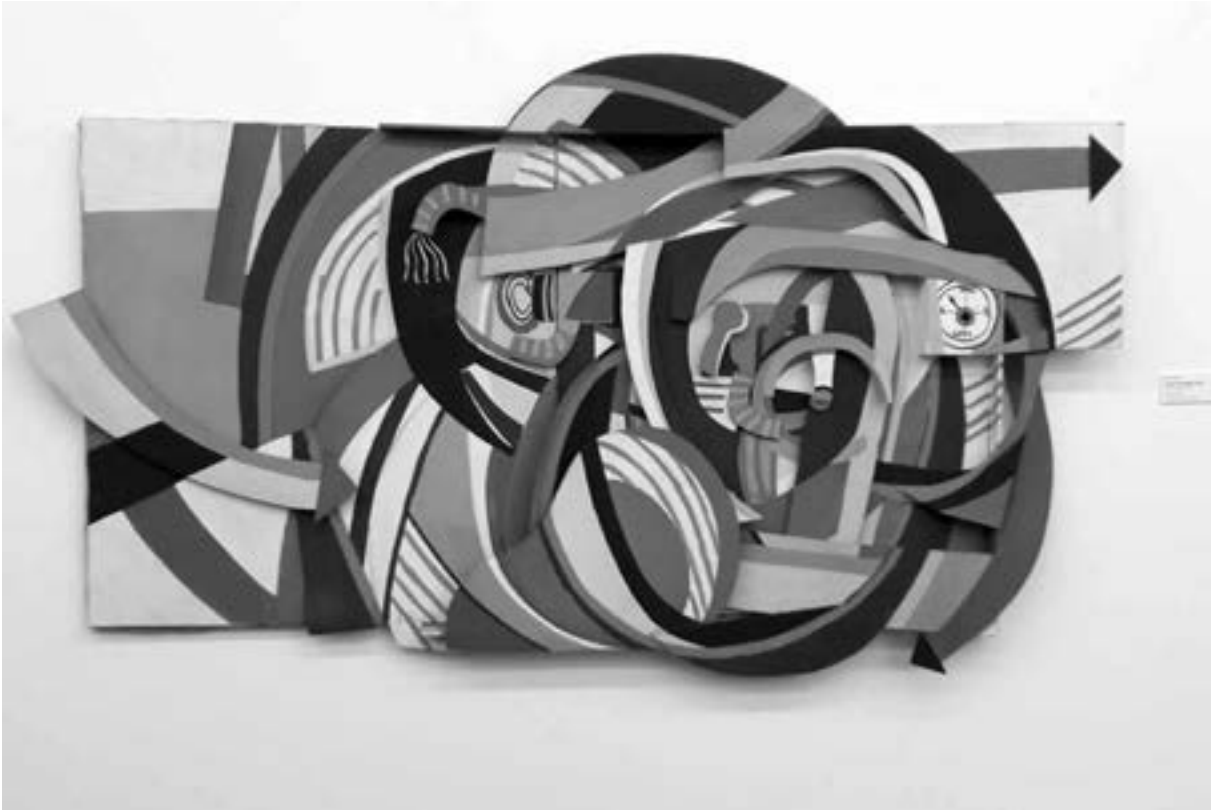
Florian Köhler, Relief ohne Titel, 1965

Bilder stehen im Gegensatz zu der heute so oft beklagten Glätte und unpolitischen Inhalte zeitgenössischer Kunst.