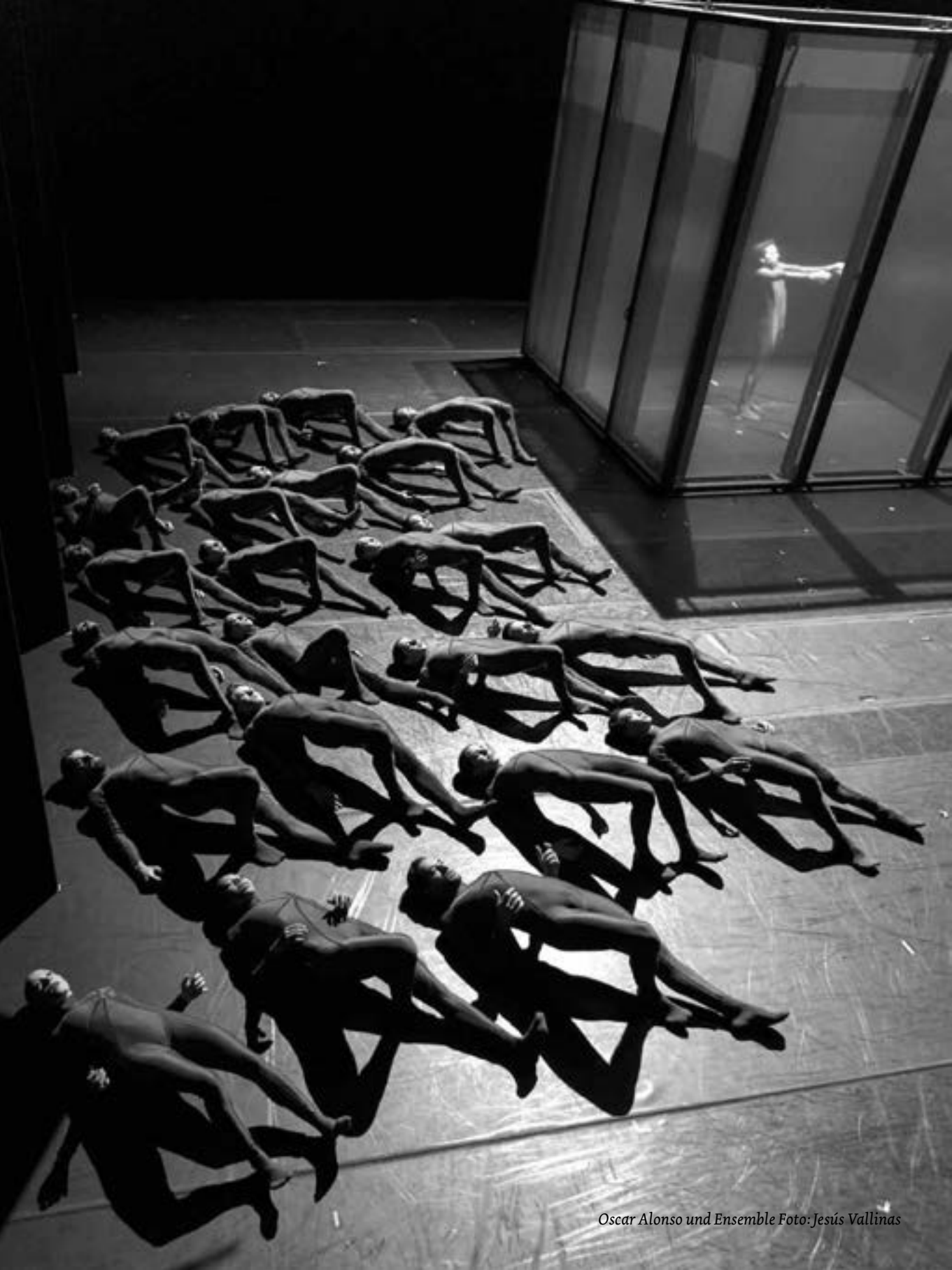
Oscar Alonso und Ensemble