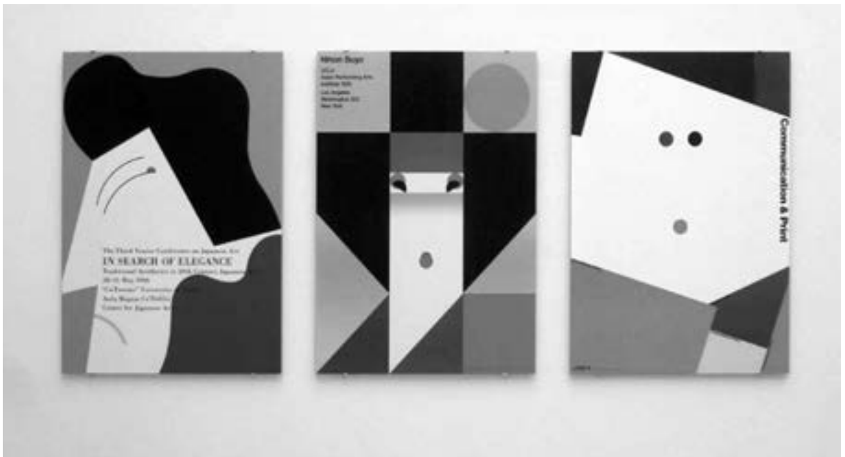
Plakatpräsentation in der Ausstellung