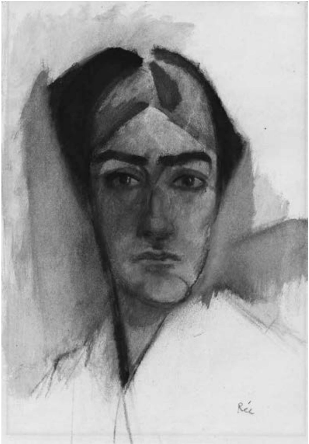
Anita Rée (1885–1933) Selbstbildnis, um 1913, Kohle und Aquarell, 44,5 x 32 cm