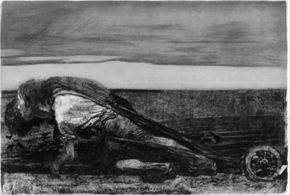
Käthe Kollwitz, Die Pflüger , Blatt 1 der Folge Bauernkrieg , vor Mitte Januar 1907, © Käthe Kollwitz Museum Köln

wesentliche Impuls kam aber von der „Verbindung für historische Kunst“, der Kollwitz 1904 die Radierung „Losbruch“ vorlegte und die die Künstlerin beauftragte, den geplanten Zyklus „Bauernkrieg“ als Vereinsgabe zu schaffen. 1908, nach ihrem Florenz-Aufenthalt, legte sie letzte Hand an das Schlußblatt „Die Gefangenen“ an.