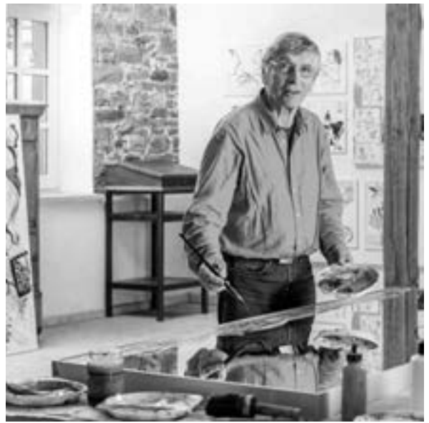
Peter Wölfel im Atelier, 2017

Jeder Besucher der Ausstellung aber muß, bevor er sich ganz in Wölfels Welten begibt, einen fünf Meter langen Spiegel-Gang als „Brücke“ durchschreiten, auf denen er sich selbst sieht und begleitet wird von flüchtig aufgemalten, sehr bunten Zeichen des Künstlers. Gleich fällt dann der Blick auf die dicht an dicht, über und über mit Werken Wölfels bedeckte Rückwand der Kunsthalle in „Petersburger Hängung“. Vor dieser Riesenwand sollen die Besucher verweilen, um vielleicht einzelnes zu entdecken unter den Arbeiten Wölfels, die er geschaffen hat, seit er im Alter von 14 Jahren die Zeichnung von Dürers Mutter kopierte und sich bald darauf entschloß, Künstler zu werden. Der Drang, auf die Schnelle in den verschiedensten Techniken und mit den unterschiedlichsten Materialien Bildliches zu schaffen, ist auf dieser Reise durch Wölfels Welten an der Riesenwand zu spüren, in der Fülle oder auch Vielfalt fast chaotisch.