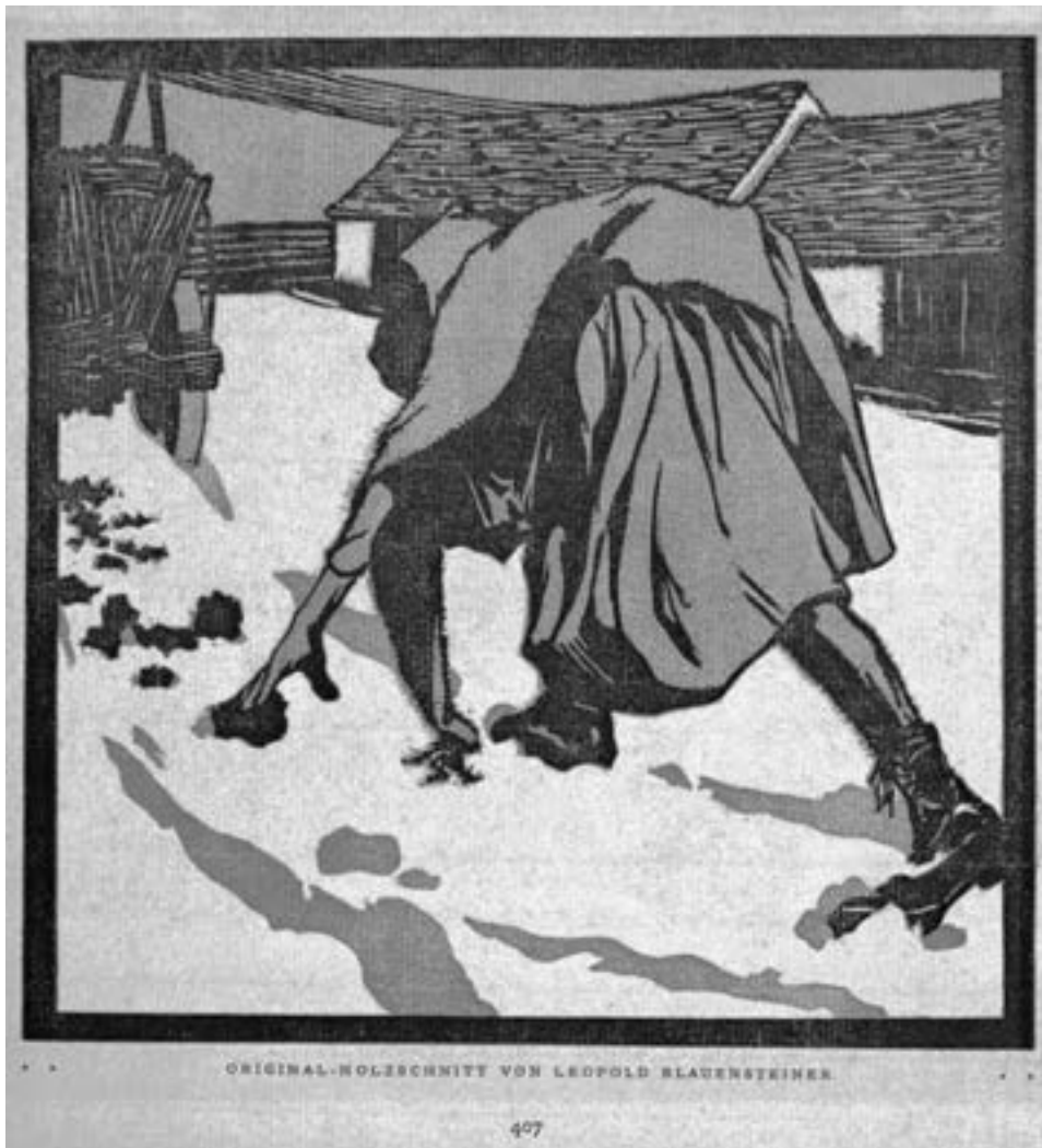
Leopold Blauensteiner, Holzsammlerin, Original-Holzschnitt (VG Bild-Kunst)

Farblichen und formalen Reichtum setzt Karl Johne (1887–1995) in „Bergwinter“ ein. Die Äste der Nadelbäume brechen fast unter der Last des Schnees. Johne stellt die Natur weniger heroisch dar, sondern