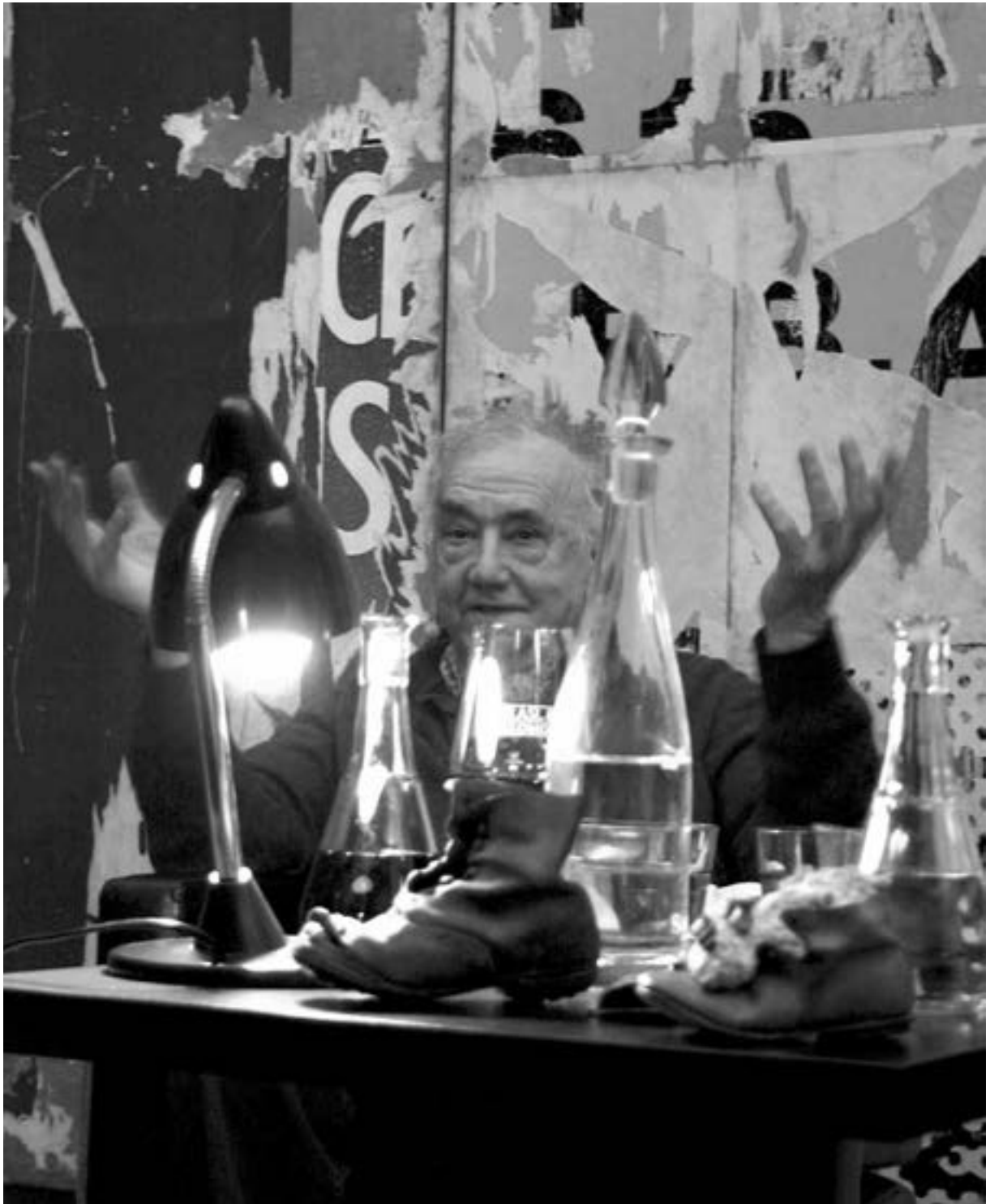
Daniel Spoerri, Krems 2010