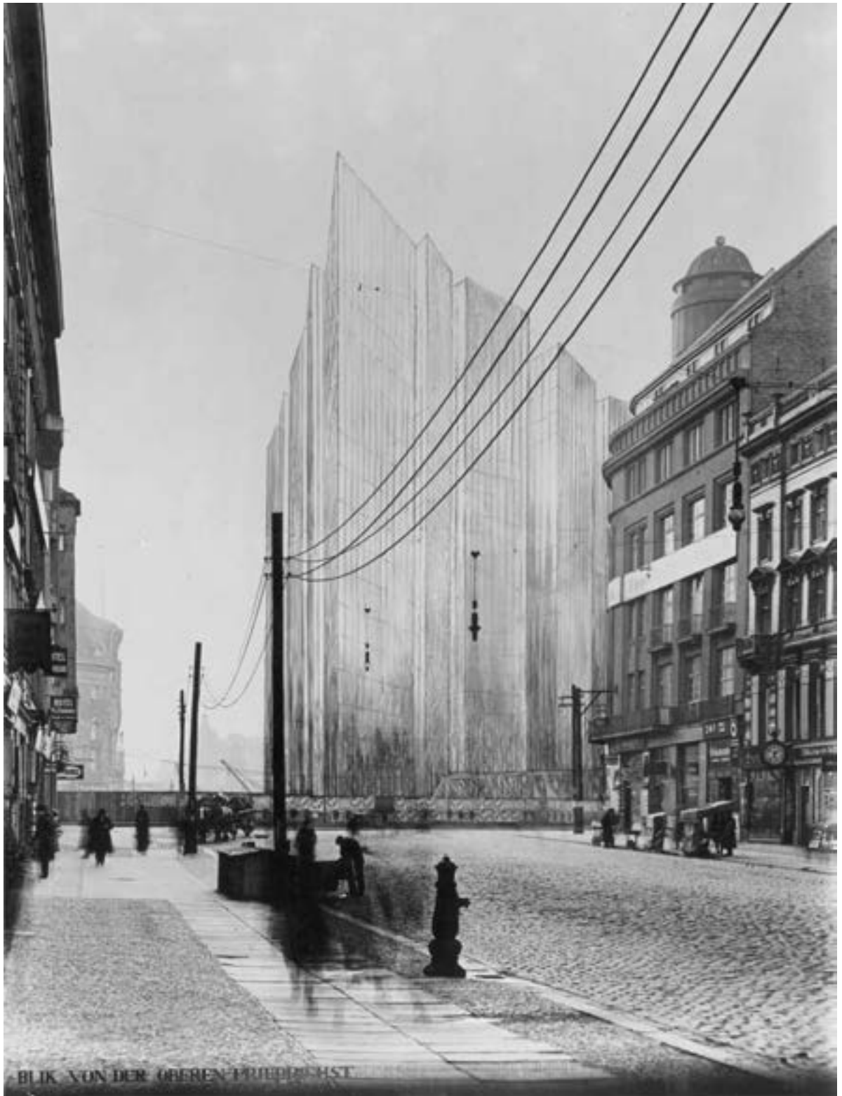
Ludwig Mies van der Rohe, Friedrichstraße Skyscraper Project, entry in the Friedrichstraße skyscraper competition, photograph of lost photo-collage 1921. New York, Museum of Modern Art (MoMA). Gelatin silver print, 10 x 8" (25,4 x 20,3 cm). Mies van der Rohe Archive, gift of the architect. cc. n.: MMA 13724.