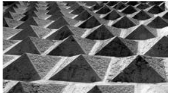
Palazzo dei Diamanti

Die Oberflächen heutiger Bauten zeigen sich häufig flach und glatt. Hinter ihnen sind Pakete von Isoliermaterial versteckt. Wo sie mit Platten bekleidet sind, offenbaren sie das Alter durch wachsende Schichten von Feinstaub. Sind sie verputzt, wirken sie abweisend glatt und steril, wenn sie frisch sind, aber schmutzig im Alter. Sie nähren Algen und Moose und erfreuen die Ohren mit dem munteren Klopfen der Spechte. Ein Gesetzgeber, dem Architektur so gleichgültig wie Kultur ist, hat das so beschlossen.