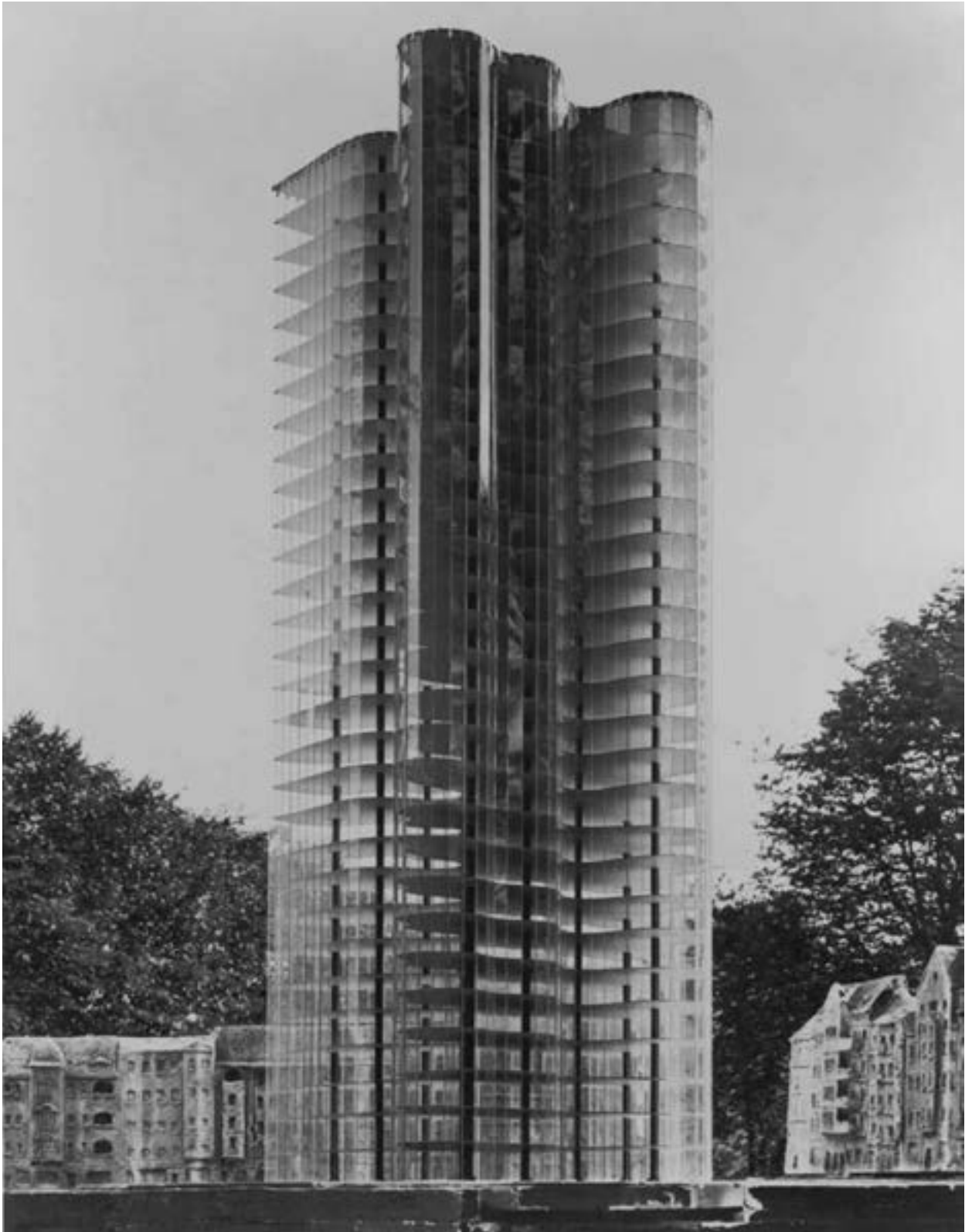
Ludwig Mies van der Rohe, Glass Skyscraper. Berlin, 1922. Model (no longer extant). New York, Museum of Modern Art (MoMA). Mies van der Rohe Archive, gift of the architect. Acc. n.: MI2