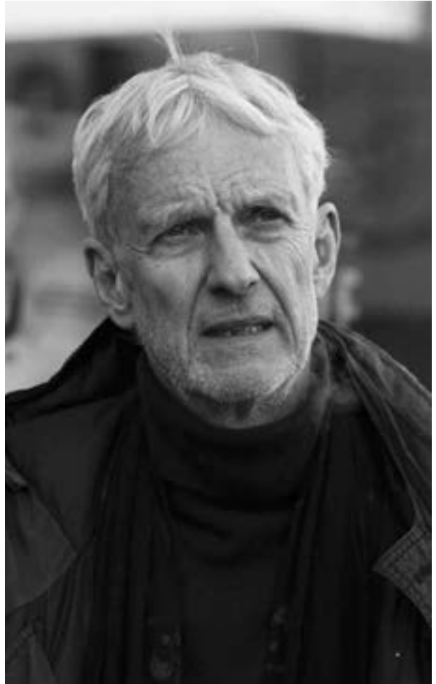
Schauspieler Mathieu Carrière

Der Kurzfilmpreis wird zum 22. Mal verliehen. In diesem Jahr werden zwei Kurzfilme mit je 1000 Euro prämiert. Die Preisgelder werden von der Würzburger Hofbräu und dem Midlifeclub Würzburg gestiftet. Für „Die Selbstgedrehten“ stellt der Bezirk Unterfranken einen Preis in Höhe von 150 Euro zur Verfügung. Außerhalb des Wettbewerbs werden beim Filmwochenende vier Kinder- bzw. Jugendfilme gezeigt. Dieser Programmblock wird von der Sparkasse Mainfranken unterstützt.