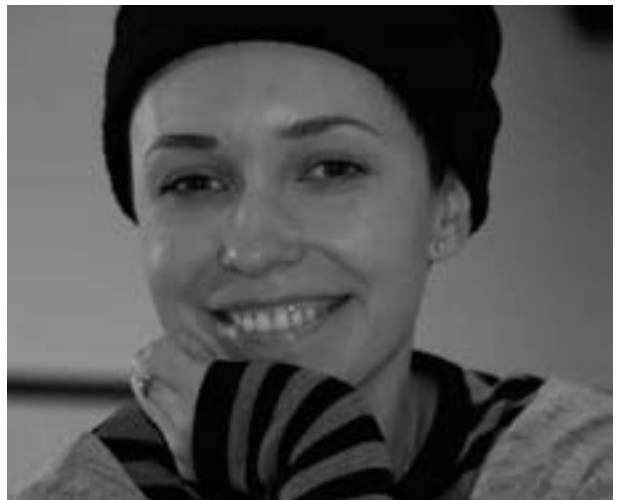
Die russische Schauspielerin Svetlana Smirnova-Martsinkevich.