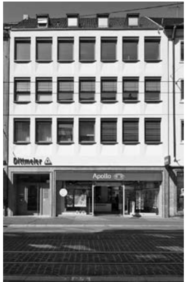
Fassade, Kaiserstraße 23, Würzburg

Der zeittypische Charakter des Baublocks wird dadurch verstärkt. Was früher stufenförmig neben einander stand, ist jetzt in eine zart plastisch geformte Haut verwandelt worden, die das Haus als Ganzes einheitlich umspannt. Im mittäglichen Streiflicht beginnt ein Spiel von Licht und Schatten. Die Fenster sind kaum erkennbar, mit Isolierglas versehen, erneuert worden. Damit die Räume im Innern nicht nur im Winter ihre Wärme besser halten, sondern auch im Sommer kühl bleiben, hindern Jalousien die direkte Sonneneinstrahlung. Dem Büro Redelbach Architekten & Partnern ist eine elegante Lösung für ein schwieriges Problem gelungen. Das Haus hat eine sanierte Fassade des 21. Jahrhunderts, unter der die Bauzeit der fünfziger Jahre des letzten Jahrhunderts durchschimmert. Wie gesagt, man muß schon genau hinschauen, um die Erneuerung zu bemerken. ¶