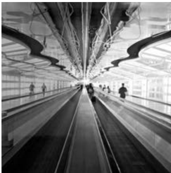
Originalfoto: Harald Müller-Wünsche Abb: Frank Kupke

im Rahmen der alle zwei Jahre stattfindenden Gruppenausstellung der VKU-Neumitglieder zu sehen gewesen. Doch bei aller Monumentalität der Architektur besitzen weder diese noch die anderen Fotoarbeiten, die hier gezeigt werden, auch nur ansatzweise so etwas wie Schwere. Die Leichtigkeit, die freilich in Calatravas organisch geschwungener Architektur bereits angelegt ist, bekommt auf den Fotos noch ein zusätzliches Maß an rhythmischer Eleganz. Der fotografierte Stahl, das Glas, der Beton – alles wird zu einer luftigen, modernen Symphonie aus reinen Farben und Formen.