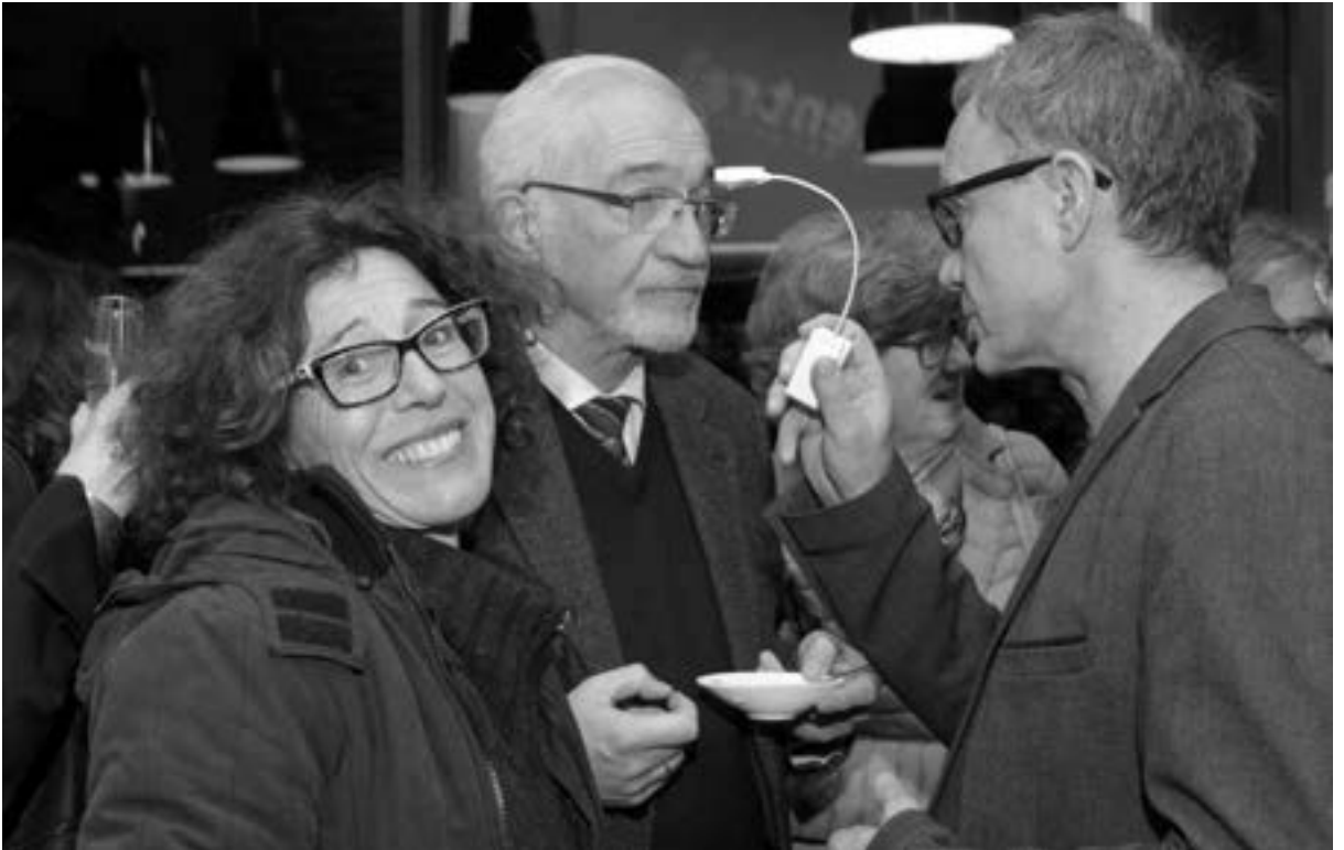
Festivalleiter Thomas Schulz (r) benutzt seine Geheimwaffe, einen sog. Mindfixer. Das Digital-Gadget vermag, im richtigen Moment eingesetzt, Zuneigung, Liebe, Freundschaft oder wie hier beim Regierungspräsidenten von Unterfranken, Paul Beinhofer (M), Wohlwollen und Unterstützung des Filmwochenendes durch Einschleifen von Gehirnstrukturen für alle Ewigkeit sicherzustellen. (Bei der Dame links im Bild wurde der Mindfixer bereits, allerdings zu erfolgreich, eingesetzt.)