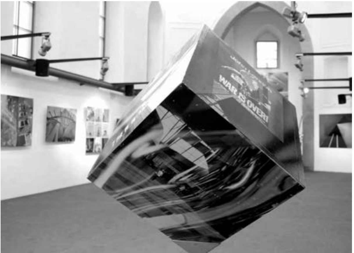
Blick in die Ausstellung von Harald Müller-Wünsche im Spitäle