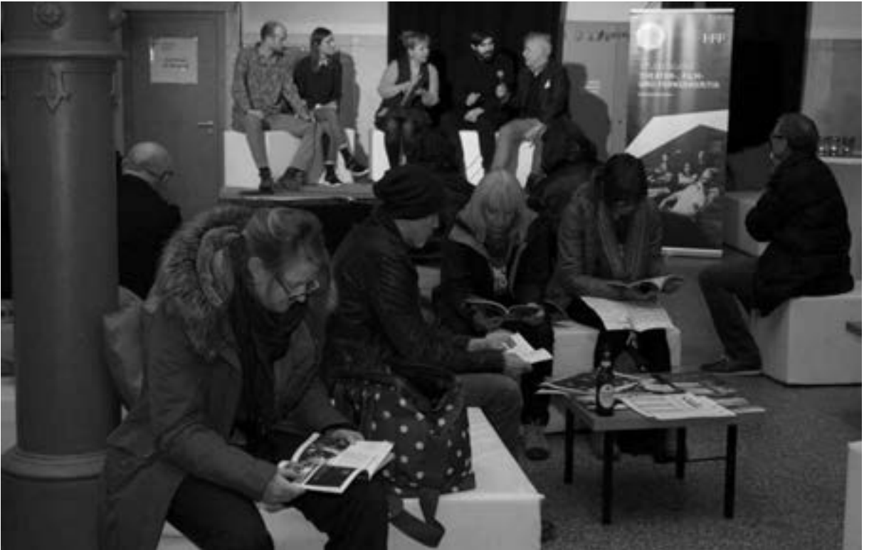
Auch die andere Podiumsdiskussion am Tag vorher über die Frage, ob Kulturkritik benötigt werde, mit Vertretern der Münchner Filmhochschule, den Machern der Festivalzeitschrift „Cult“, erfreute sich ungeteilter Aufmerksamkeit.

Text und alle Fotos: Wolf-Dietrich Weissbach