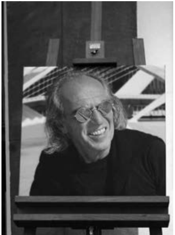
Erinnerung an Harald Müller-Wünsche Abb.: Frank Kupke

Wie vor drei Jahren gibt auch jetzt das leuchtende Ultramarin des iberischen Himmels dem Ausstellungsraum den Grundton. Damals waren die Fotos