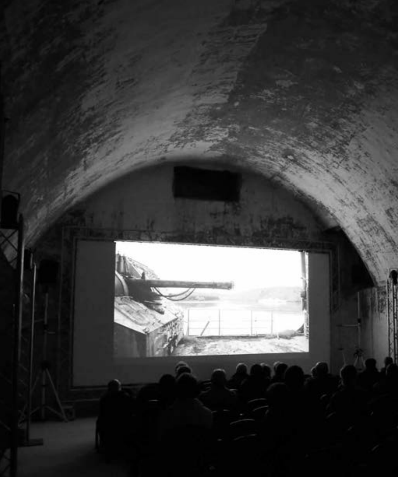
Der bunkerhafte Charme des Zusatzkinos. Auf der Leinwand läuft „Homo Sapiens“ von Nikolaus Geyrhalter