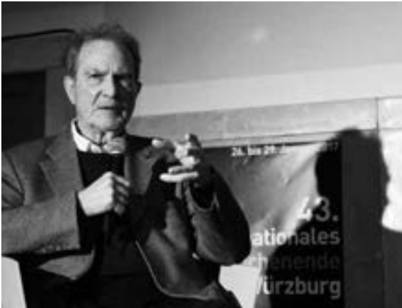
Stargast Edgar Reitz, Regisseur