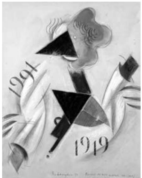
Wladimir Nemuchin, Valet, Marc Chagall , 1991, Karton, Pastell, 76 x 60 cm, Privatsammlung Deutschland, © W. Nemuchin, Foto: Norbert Haentzschel