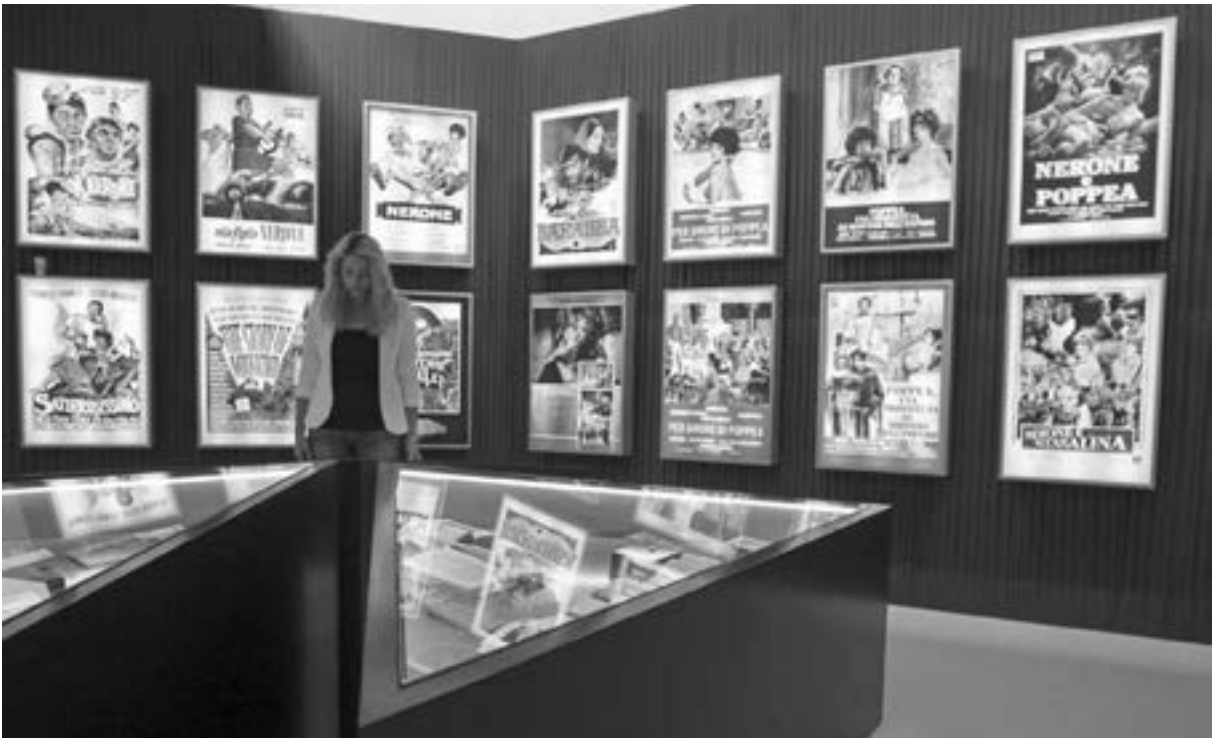
Die Ausstellung „Lust und Verbrechen. Der Mythos Nero in der Kunst“ im Stadtmuseum Simeonstift Trier

Ende der Damnatio memoriae verfiel, sein Name aus Inschriften getilgt, seine Ehrenstatuen enthauptet und mit anderen Kaiserköpfen versehen wurden (nur die langen Locken lassen einstige Nero-Statuen noch identifizieren), schmückte „man“ noch lange sein Privatgrab. Ein Staatsbegräbnis war dem Unbotsamen natürlich verwehrt.