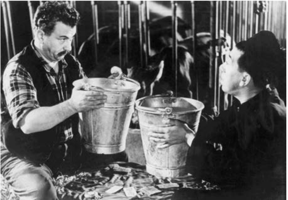
Peppone (Gino Cervi) und Don Camillo (Fernandel)

im ersten der insgesamt sechs Don Camillo-Filme gewünscht hatte. War Guareschi ein Monarchist? Bei einem Satiriker weiß man nie so genau, woran man ist? Nach Leisetreteri hört sich seine Vita jedenfalls nicht an! Vielleicht war die Fahne des Königs ein letztes Aufmucken gegen den Zeitgeist, eine letzte Provokation aus dem Grab heraus!