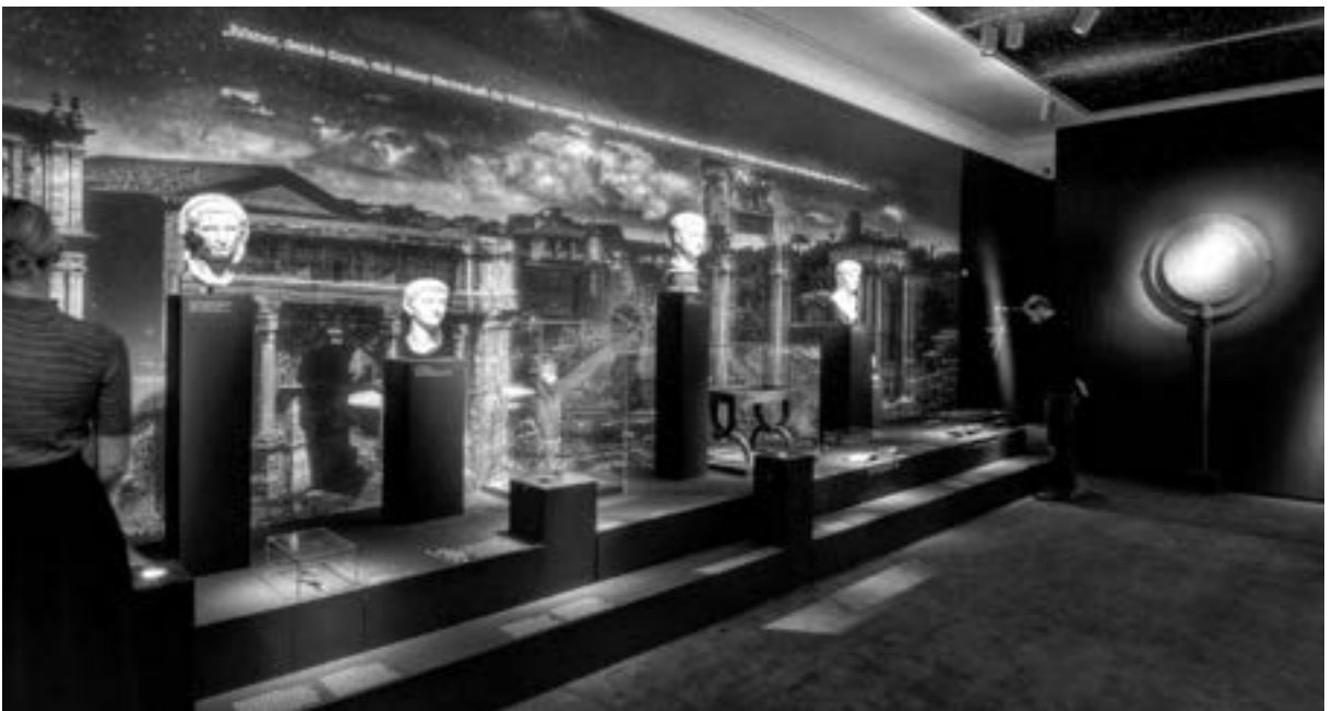
Die Ausstellung „Nero – Kaiser, Künstler und Tyrann“ im Rheinischen Landesmuseum Trier

Selbst als der Kaiser nach seinem unrühmlichen