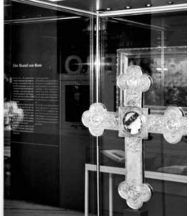
Die Ausstellung „Nero und die Christen“ im Museum am Dom Trier

Ein bißchen zu viel Kulissenzauber ist das mitunter schon - aber Unterhaltung muß sein. Zu Neros Zeiten wie heute. Neben vielen exquisiten Märtyrerdarstellungen aus Mittelalter, Renaissance und Barock, dem Vortragekreuz aus dem Mindener Domschatz mit einer veritablen Nero-Kamee als Spolie (16. Jahrhundert) und einer römischen Jesus-Karikatur (ein Mann mit Eselskopf hängt an einem Kreuz), begegnet man im Museum am Dom zahlreichen Gemälden aus dem 19. Jahrhundert, was nicht verwundert. Kamen die blutigen Szenen der Neronischen Christenverfolgung den Malern der damaligen Zeit gerade recht, ihr Publikum durch Abscheu und Faszination zu fesseln. Je grausamer, um so besser.