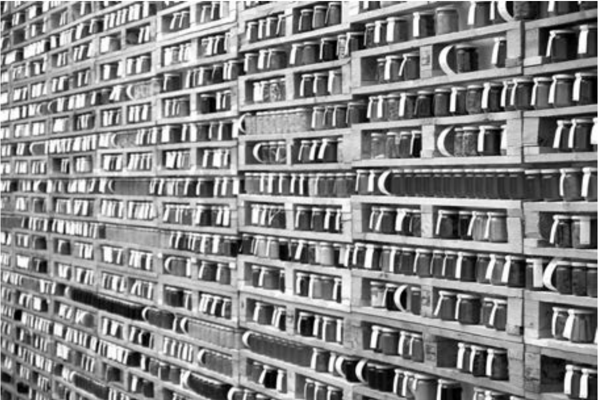
EIN'MACH'ENDE