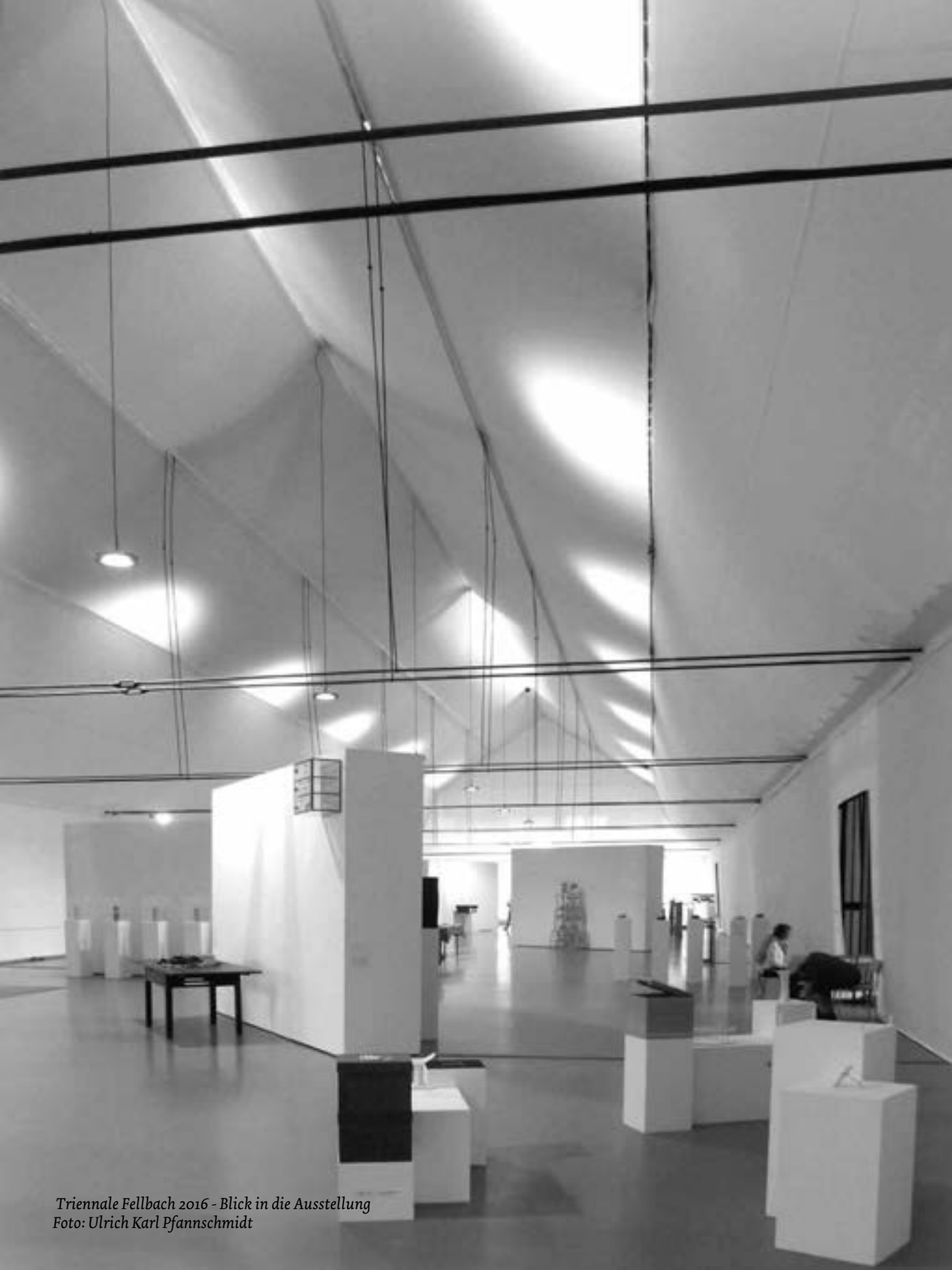
Triennale Fellbach 2016 - Blick in die Ausstellung