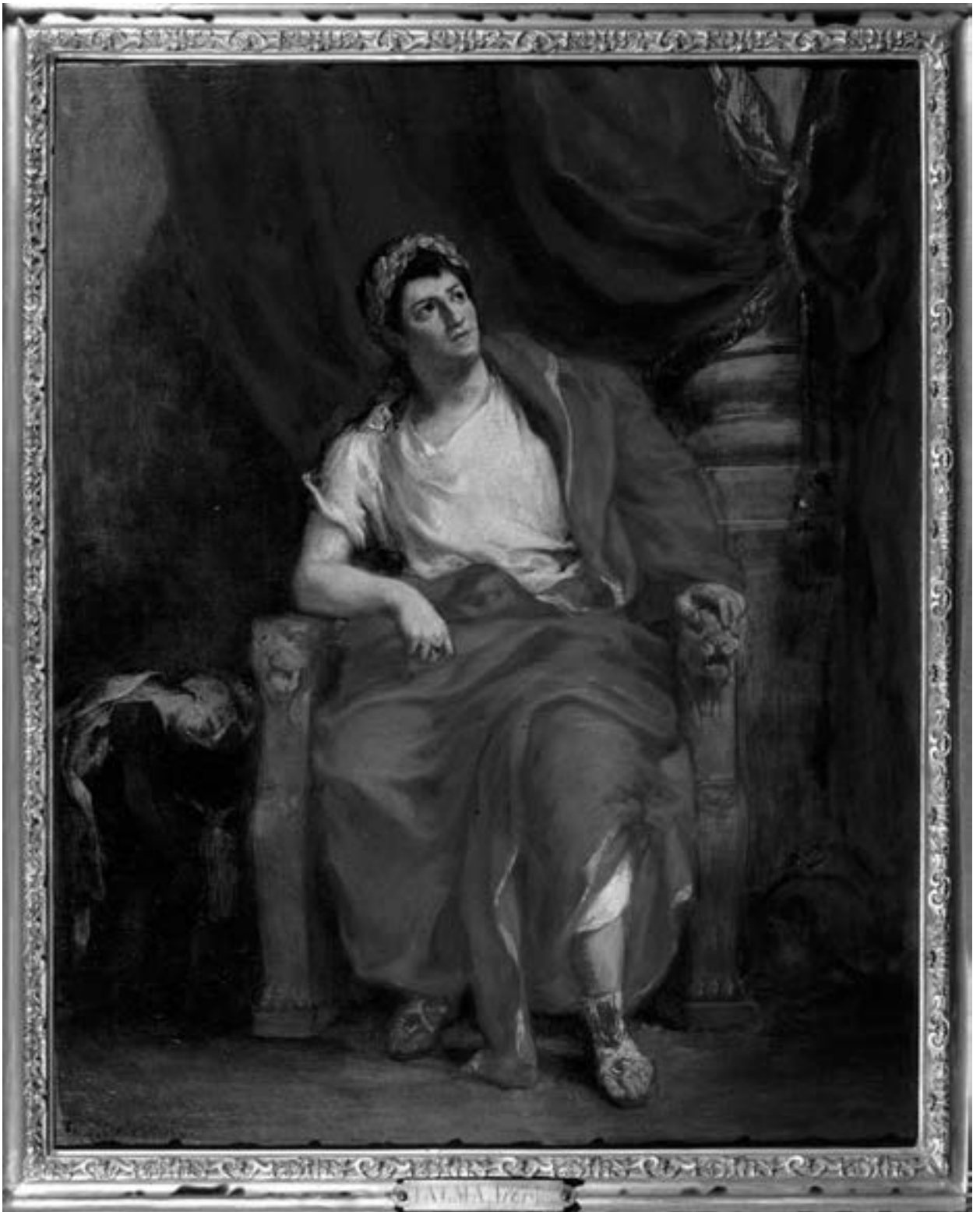
Eugène Delacroix, Der Schauspieler Talma als Nero , Öl auf Leinwand, 1853, © Comédie Française, Paris