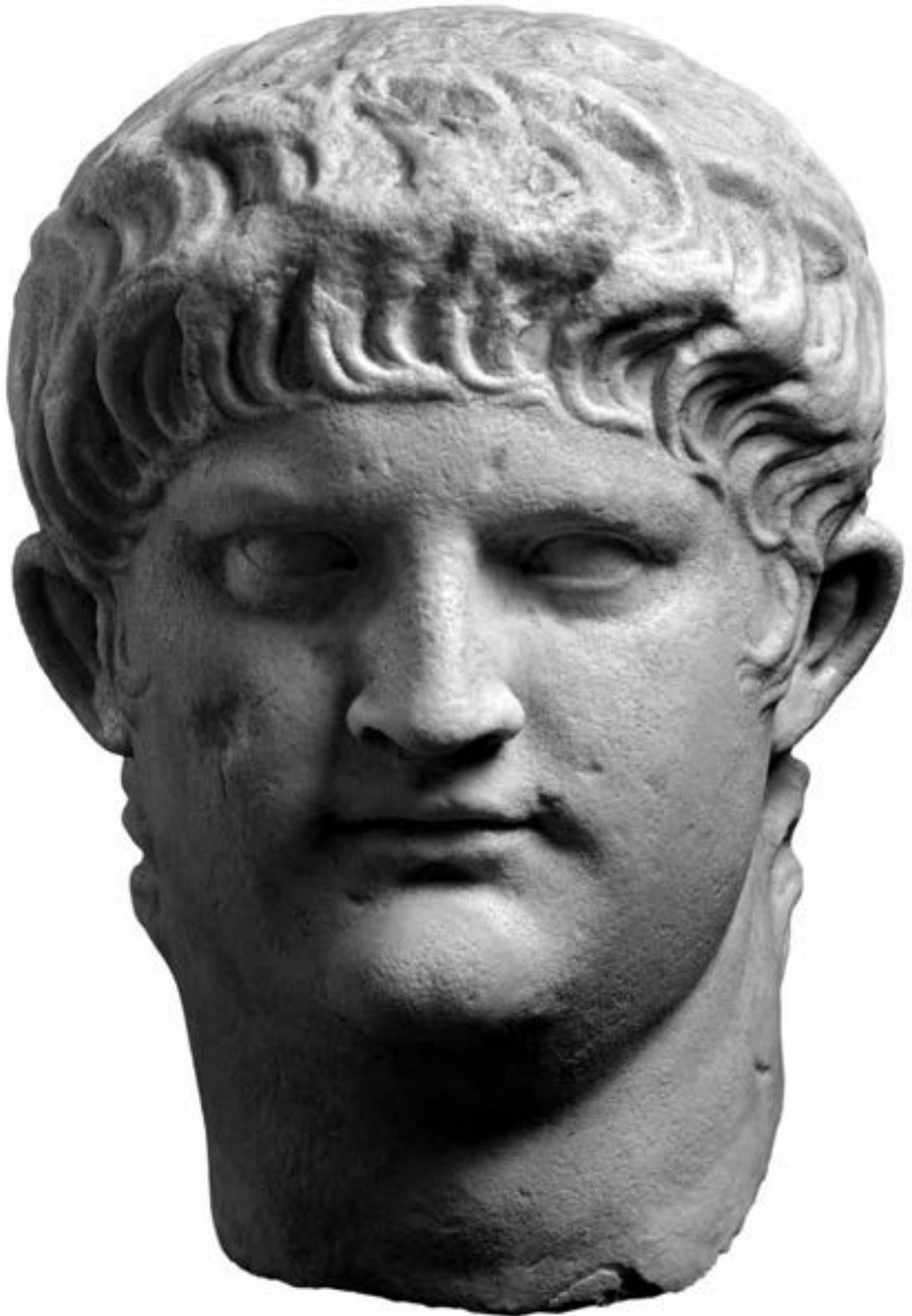
Marmorporträt des Nero, 64-68 n. Chr., © Rheinisches Landesmuseum Trier, Th. Zühmer Original: München, Staatliche Antikensammlungen und Glyptothek