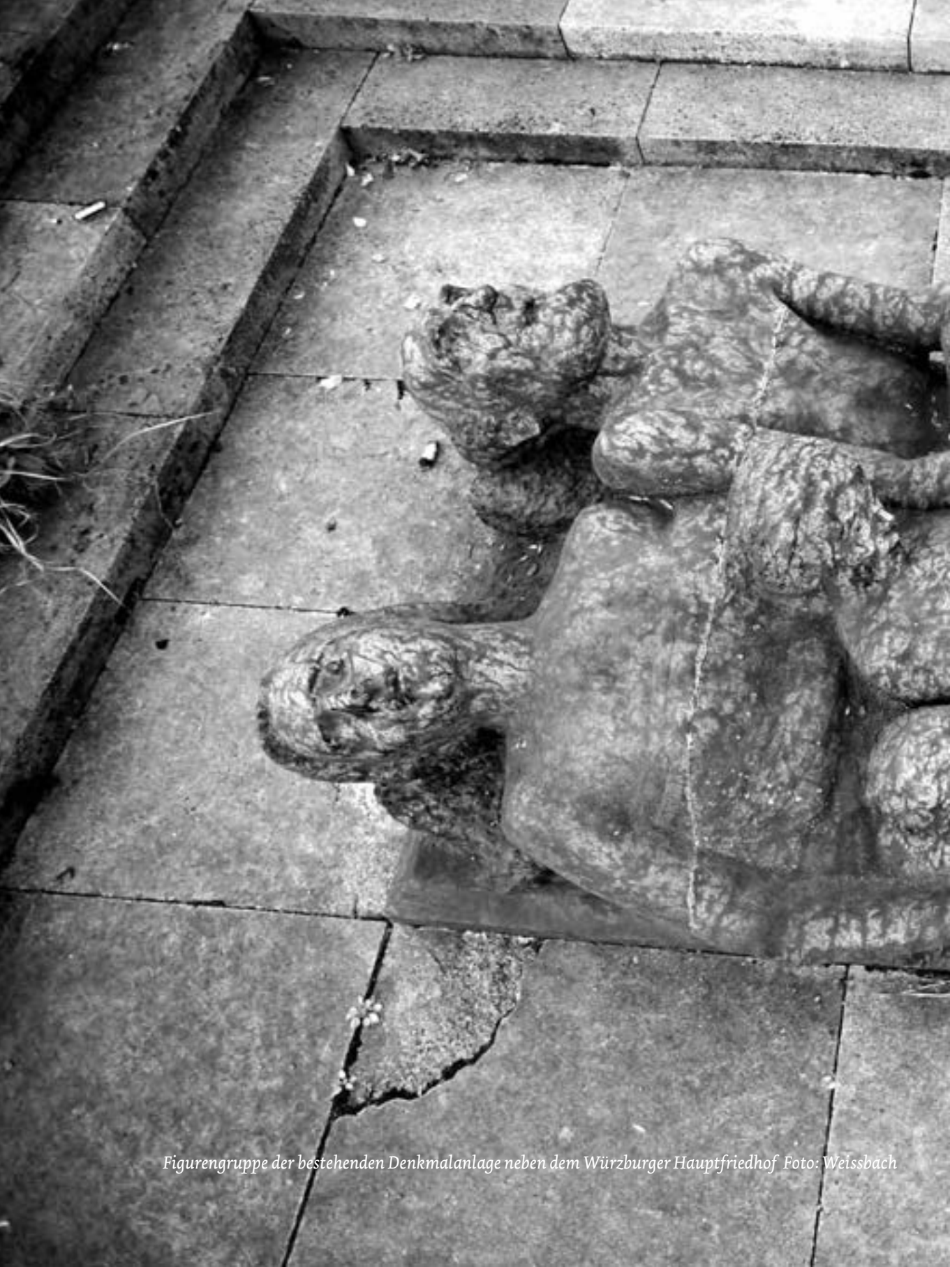
Figurengruppe der bestehenden Denkmalanlage neben dem Würzburger Hauptfriedhof