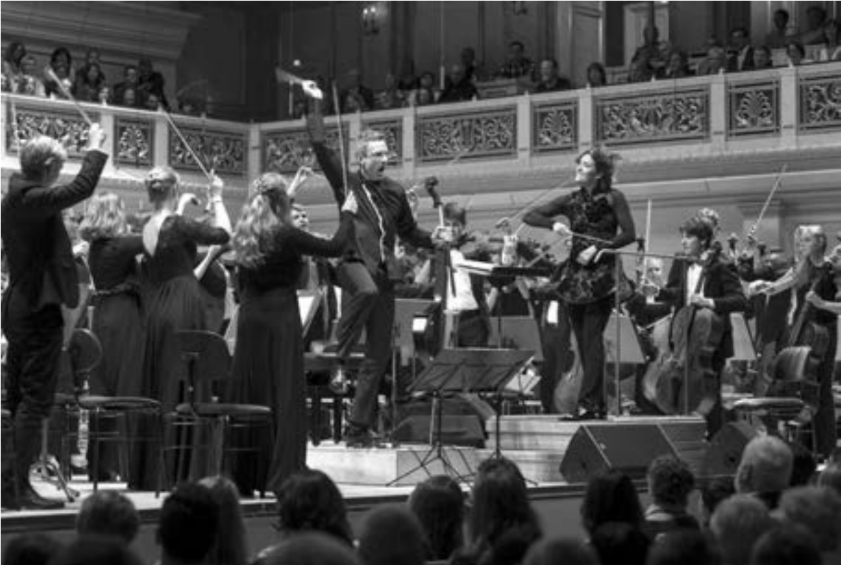
Die mexikanische Dirigentin Alondra de la Parra (erhöhtes Podium) und das deutsche Bundesjugendorchester.