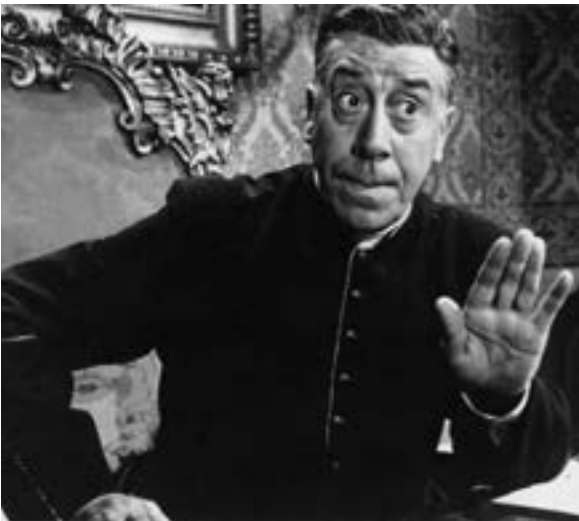
Don Camillo alias Fernandel

Zeit seines Lebens war Guareschi ein kritischer Geist. Nach einer abfälligen Bemerkung über das Mussolini-Regime wurde er 1942 zur Armee eingezogen und geriet im Herbst 1943 in deutsche Kriegsgefangenschaft. Wegen einer Karikatur im „Candido“ wurde er 1951 zu einer Gefängnisstrafe auf Bewährung verurteilt. Drei Jahre später stand er erneut vor Gericht, weil er Alcide De Gasperi, einen der herausragenden europäischen Nachkriegspolitiker, beleidigt hatte. 409 Tage mußte Guareschi dafür im Gefängnis absitzen. Als er 1968 an einem Herzinfarkt starb, legte man auf seinen Sarg eine Flagge mit Königswappen – ganz so, wie es sich die alte Lehrerin