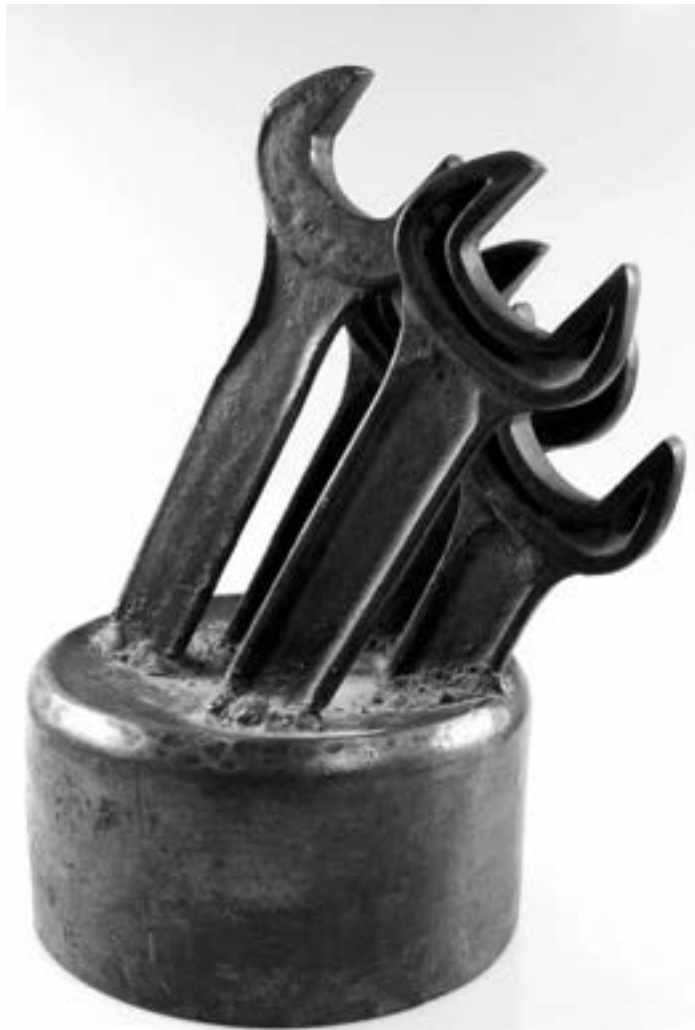
Wladimir Nemuchin, Begierde , 1986, Bronze, 28 x 20 x 21 cm, Privatsammlung Bochum,

zeitgenössischen Strömungen. Seit 1965 taucht dann auch sein „Markenzeichen“ auf, die Spielkarte. Sie steht für den Menschen, seinen Spieltrieb, und damit „signiert“ Nemuchin auch manchmal, ganz klein, seine Werke. Vor allem der Karo-Bube fungiert als Symbolzeichen für das Leben mit Glück und Unglück; er war in der Sowjetunion als Flicker auf der Häftlingskleidung aufgenäht und deutete auf nicht gesellschaftskonformes Verhalten hin. Nemuchin begann zuerst mit der Suche nach der Abstraktion, nannte seine farbstarken Bilder „Komposition“, gab ihnen auch manchmal einen Titel wie „Frühling in der Stadt“ (1958). Aufsehen erregte die Paradekonträre Ausstellung der Nonkonformisten 1974 in einem Moskauer Park, maßgeblich von Nemuchin initiiert, die brutal von Bulldozern niedergewalzt wurde. Doch dadurch wurden die Künstler international bekannt. Und er ließ sich auch später in den 90er Jahren von wiederholten Aufenthalten in Deutschland anregen. Nemuchins Schaffen ist äußerst vielschichtig, umfaßt alle möglichen