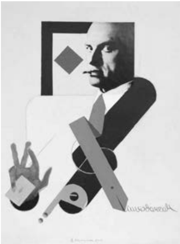
Wladimir Nemuchin, Bube Majakowski , 2010, Acryl, Collage, Leinwand, 71 x 53,5 cm, Privatsammlung Frankfurt, © W. Nemuchin

Techniken. Als Hommage an Cézanne löste er z.B. Grundelemente von dessen Malerei als Kuben, Zylinder, Kegel plastisch auf; ähnlich verfuhr er beim „Andenken“ an andere Künstler. Er transponierte quasi den Gegenstand in die Abstraktion, aber so, daß man den Ursprung noch erkennen kann. Daß er auch spielerisch mit eigenen Einfällen umging, zeigt die Plastik „Dosenöffner“.