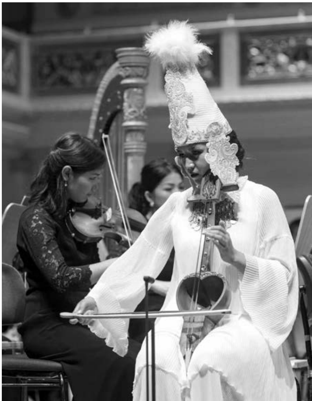
Eine von drei Kobys-Spielern vor dem Symphonieorchester der Nationalen Universität der Künste Kasachstan Uraufführung des Werkes „Tlep“ vom kasachischen Komponisten Alkuat Kazakbaev