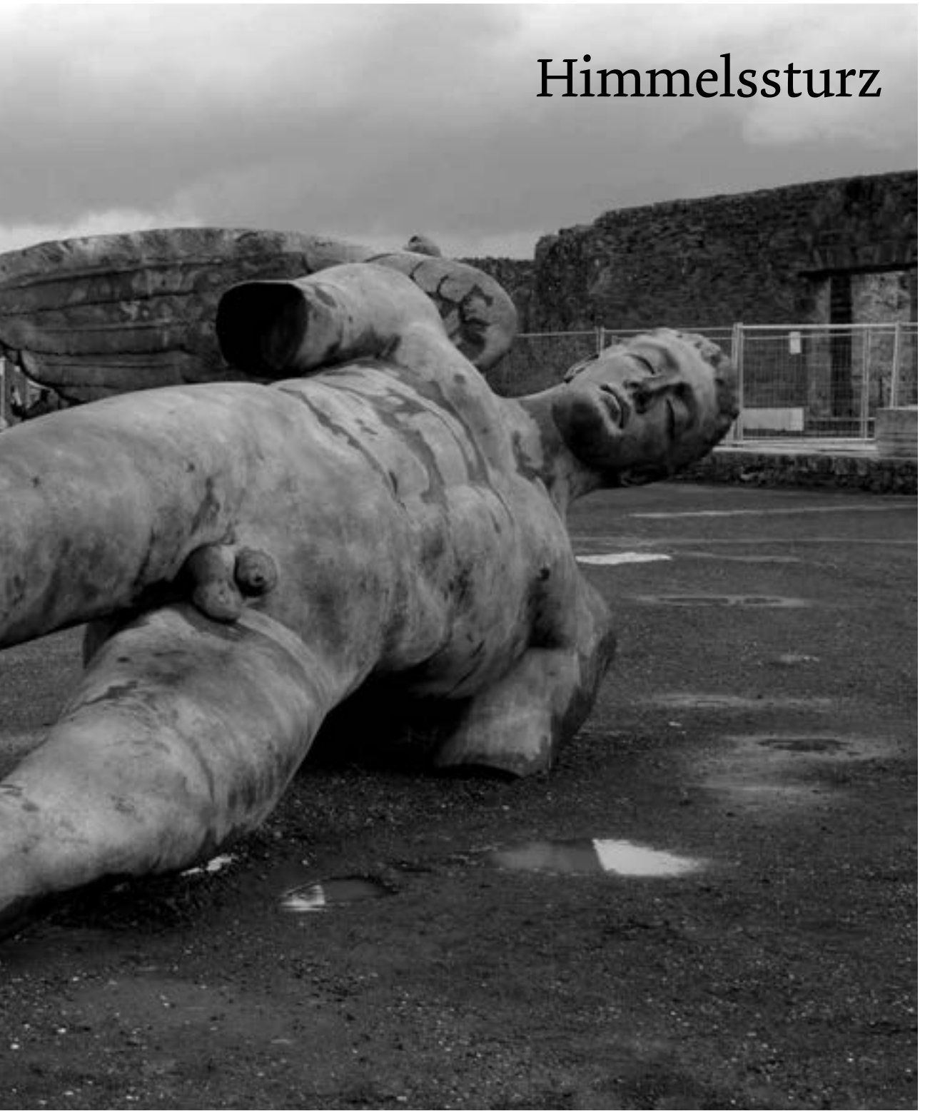
Igor Mitoraj, „Ikaro blu“, Bronze, 2013, im Hintergrund „Tindaro“, Bronze, 1997, Forum Pompeji