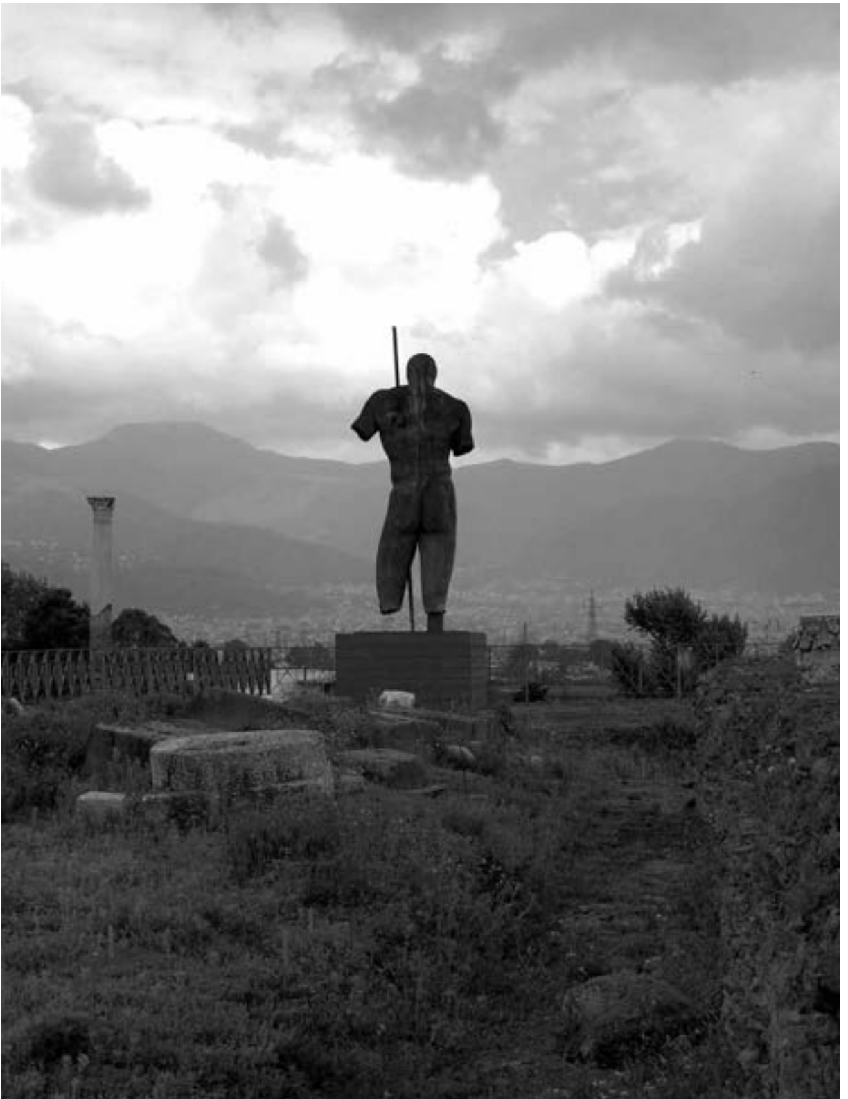
Igor Mitoraj, „Dedalo“, Bronze, 1997, Pompeji