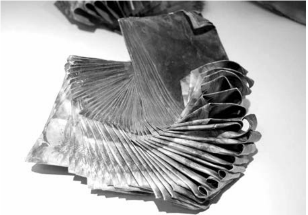
Petra Grupp, „wachsen und reifen“ (o.J.)