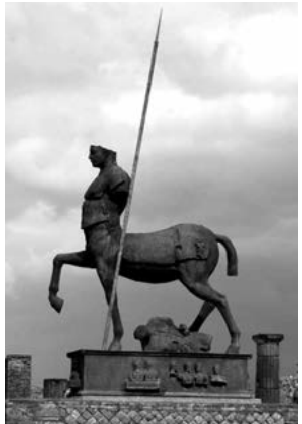
Igor Mitoraj, „Centauro“, Bronze, 1984, Pompeji

Igor Mitoraj wurde 1944 im sächsischen Oederan geboren und lebte nach seiner Ausbildung in Krakau, in Paris und in Pietrasanta, nahe der Marmorbrüche von Carrara, Italien. Er starb im Jahr 2014. ¶