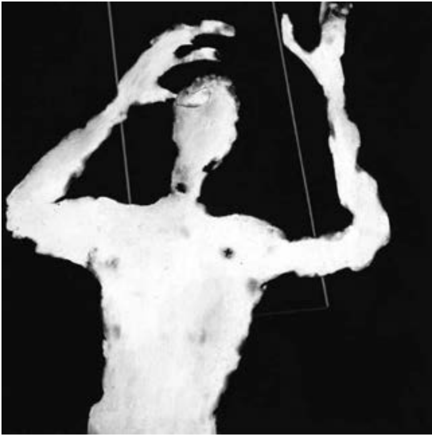
Wiltrud Kuhfuss, „Gegen die Angst IV“ Foto: Wiltrud Kuhfuss