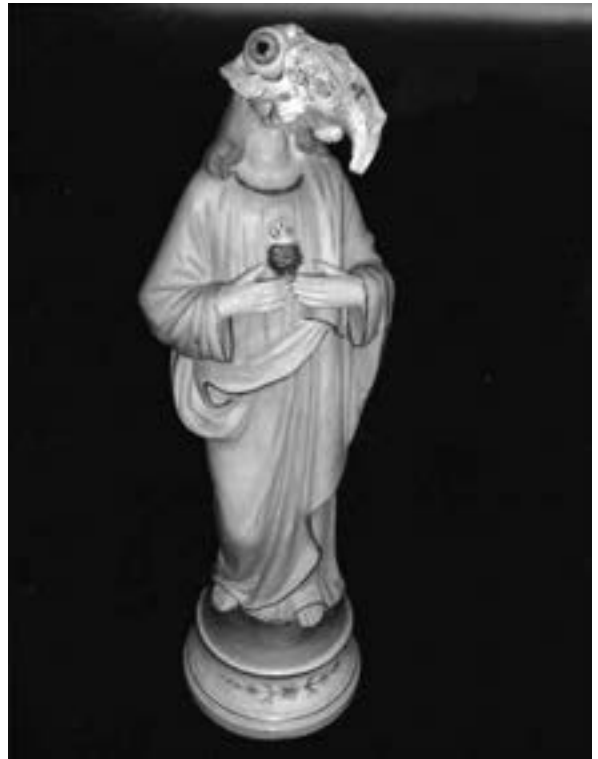
Fred Piehl, „Das Opfer“

Der Grenzziehung in abstrakter Form widmen sich Dagmar Meyer und Wolfgang Kuhfuss; sie in einem gewebten Triptychon („Abgrenzung“) in Rot-, Gelb- und Schwarztönen, er im strengen Gegenüber eines Diptychons mit geometrischen hellgrauen Formen, die durch die gelbe Klammer eine positive Grundstimmung haben. Da der Mensch, nach Camus, unabhängig von