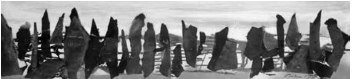
Ruth Roth, „Weggefährten auf der Flucht“