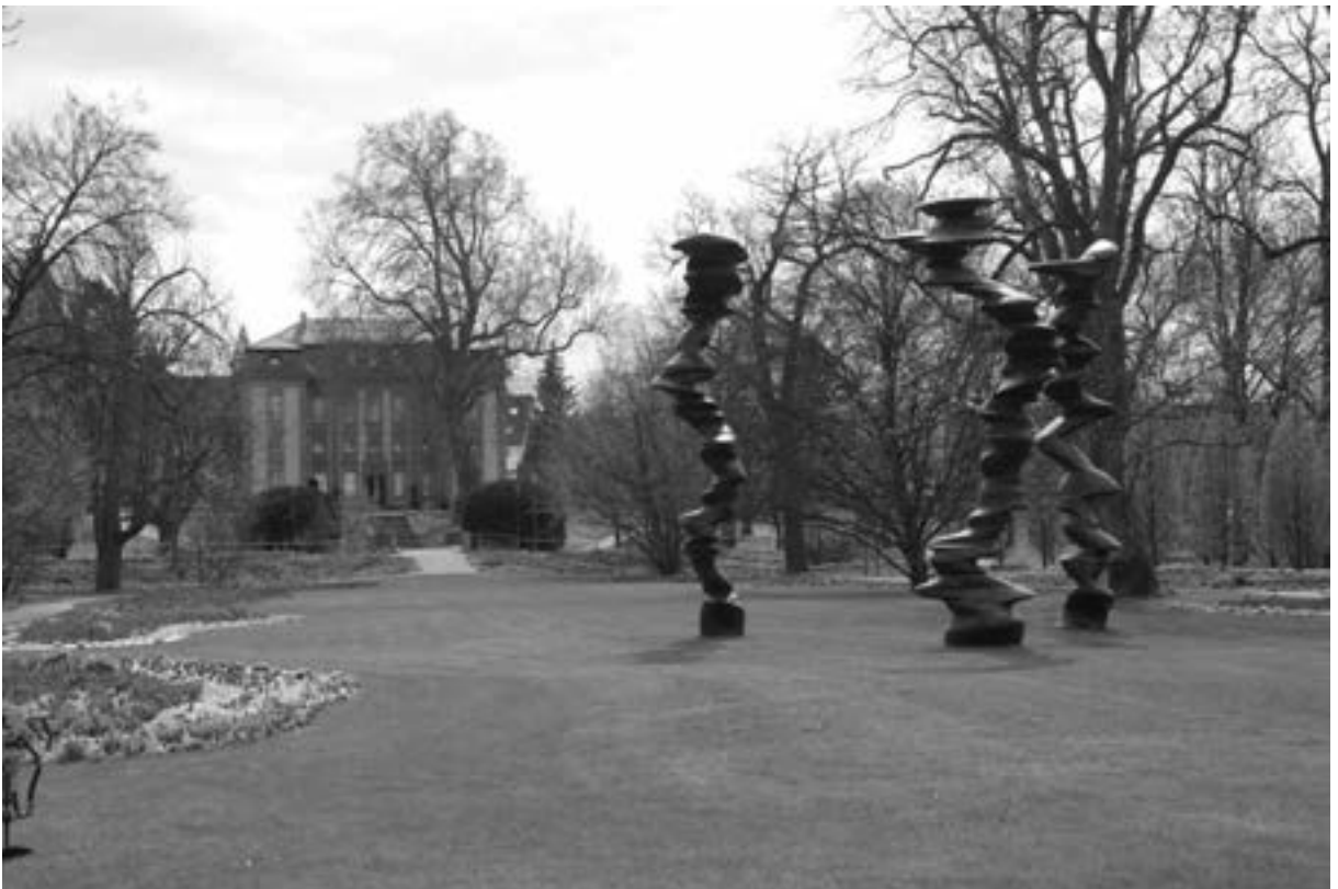
Ein Werk von Tony Cragg aus der Sammlung Würth auf der Landesgartenschau in Öhringen

Mit einem solchen Konzept würde Würzburg der langen Entwicklung der Gartenschauen von der Großen Ruhrländischen Gartenbau Ausstellung in Essen 1929 – GRUGA über die Reichsausstellungen des deutschen Gartenbaus 1936 in Dresden, 1938 wieder in Essen, 1939 auf dem Killesberg in Stuttgart und die vielen folgenden ab 1980 auf dem Wege von einer Schau des Reichsnährstandes zu einem urbanen Entwicklungsinstrument ein neues Kapitel anfügen. Die Bürger der Stadt würden nach Verblühen der Blumen ein dauerhaftes Wohngebiet von hoher Aufenthaltsqualität gewinnen. Der Stadt und den Planern wäre ein Platz in der Geschichte sicher. ¶