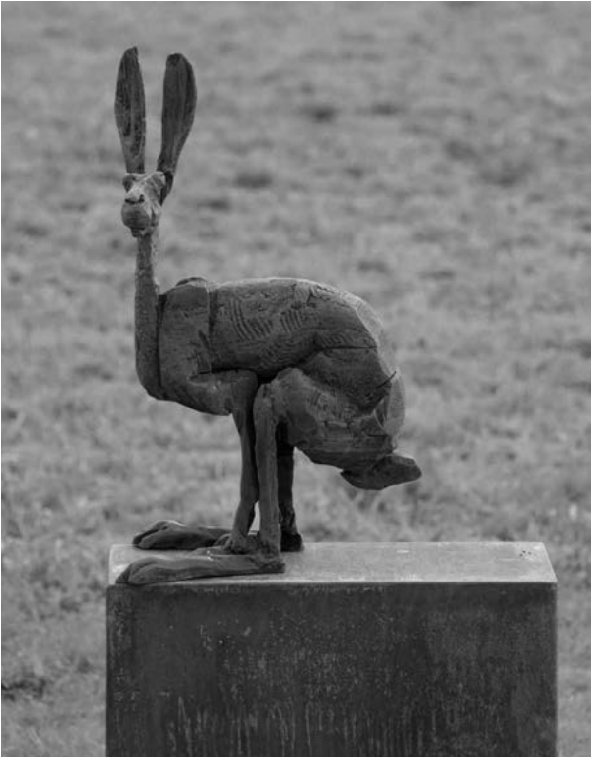
Hase auf der Landesgartenschau in Bayreuth