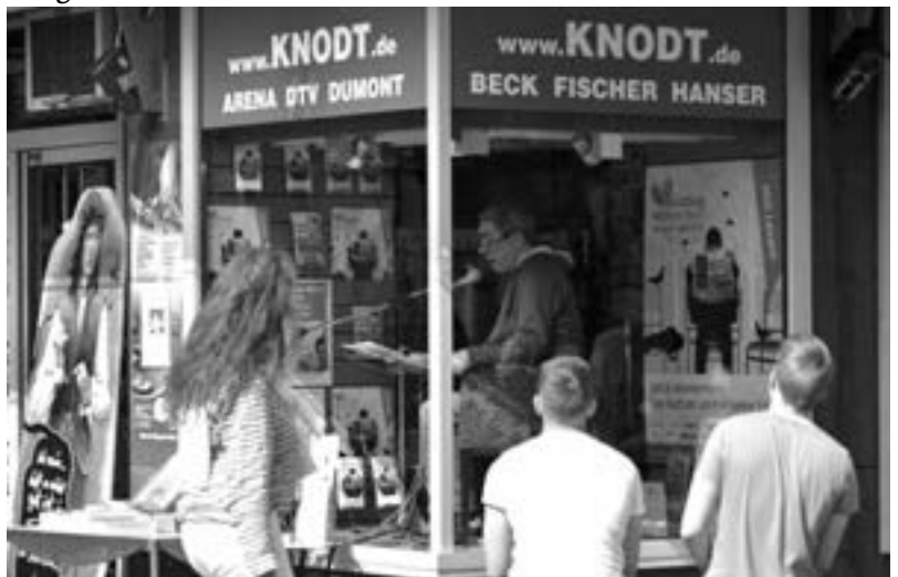
Herr Bischof aus Bad Brückenau liest in der readers corner der Buchhandlung Knodt für Zuhörer drinnen und draußen.

Es ist die breite Vielfalt der Veranstaltungen, die „Würzburg liest ein Buch“ zu einem Literaturfestival gemacht hat, das tatsächlich seinen Anspruch eingelöst hat: mit einem Buch die Menschen unserer Stadt und unserer Region miteinander ins Gespräch zu bringen – und Literatur zu feiern und zu genießen. Man darf hoffen, daß sich dieses Format nun etabliert hat und im Jahr 2018 die dritte Folge stattfinden kann. Noch ist allerdings offen, welches Buch es dann sein wird. ¶