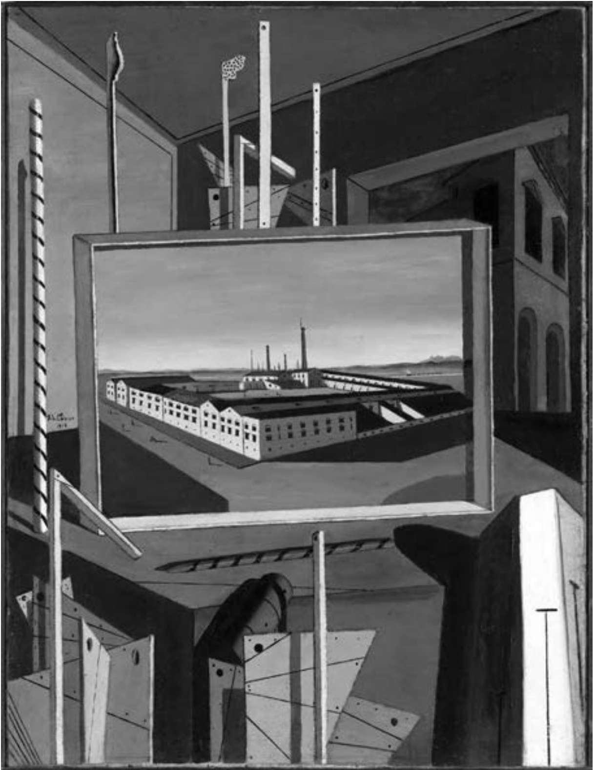
Giorgio de Chirico, „Metaphysisches Interieur mit großer Fabrik“, 1916, Staatsgalerie Stuttgart, ©VG Bild-Kunst, Bonn 2015