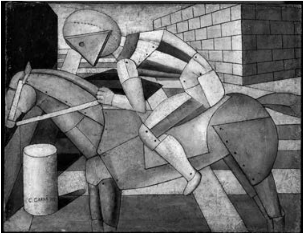
Carlo Carrà, „Der Reiter des Westens“, 1917, Privatsammlung

Landschaft mit einem Staffeleibild, das vermutlich deckungsgleich die eben nicht sichtbare Landschaft wiedergibt. Sein und Schein, Urbild und Abbild sind (natürlich) nicht identisch - auch wenn sie identisch aussehen. Über die Malweise selbst, die schweren Konturen und die formende Farbe, zieht Alexander Kanoldt, freilich in höchst vernünftigen Stilleben einen Hauch de Chirico in den „Magischen Realismus“ und legt so die Aura des Geheimnisvollen um ganz banale Alltagsobjekte.