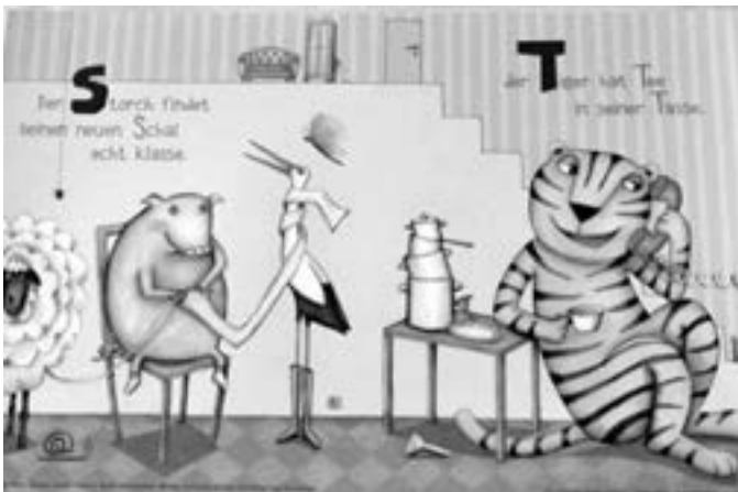
„Ein Dino zuviel“, Illustrator und Autor: Jamie Aspinall Abb.: Stadt Marktheidenfeld

jenen Ton, in dem die rührende Geschichte um Vertrauen und Freundschaft erzählt ist. In der Farbpalette korrespondieren die dominierenden Blau nuances zum einen mit der arktischen Landschaft und stehen darüber hinaus wohl auch für eine gewisse emotionale Umgebungskälte, während die hier und da angedeuteten Braun- und Rottöne nicht nur zur Darstellung etwa des Erdbodens dienen, sondern auch ein behutsamer Ausdruck des inneren emotionalen Geschehens der Geschichte sind, in der es um das allmählich wachsende Vertrauen zur anfangs so wenig vertrauenserweckenden, eisigen Nordpolarmerlandschaft und – ausgehend vom Urvertrauen zu Umkas Eisbär-Mutter – zu den Mit-