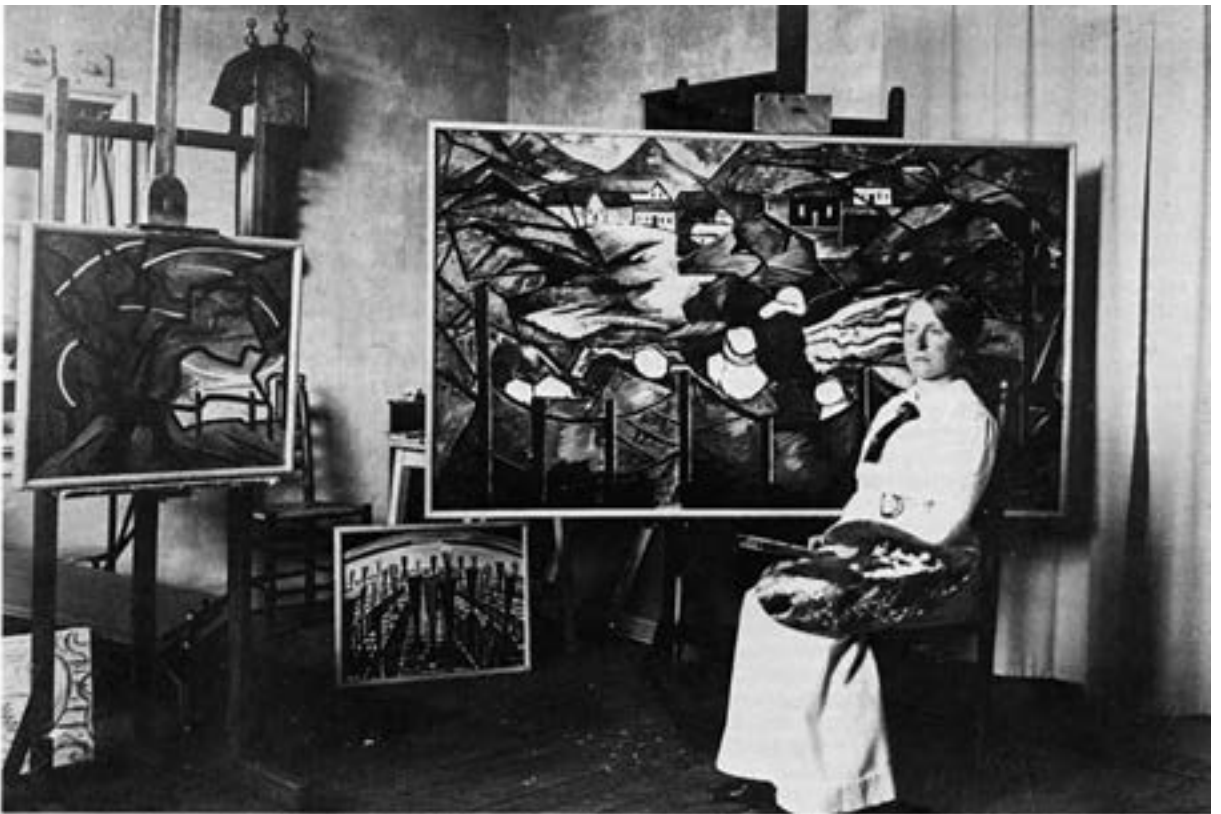
Jacoba von Heemskerck in ihrem Atelier in Den Haag, ca. 1915, Privatbesitz

mal die Auftaktgraphik für die Sturm-Zeitschrift. Die Niederländerin van Heemskerck (1876–1923) gab Walden sogar das alleinige Ausstellungsrecht für ihre Bilder und gründete eine Sturm-Schule in Holland. Von Kandinsky und Marc angeregt, verließ sie ihre farbeglühende, stark stilisierte Gegenständlichkeit und konzentrierte sich auf ebenso farbin intensive Abstraktionen. Freilich fällt auch schon hier auf, daß viele der Künstlerinnen mit oder durch einen künstlerisch oft weit avantgardistischeren Partner in Waldens Blickfeld rückte: die Münter durch Kandinsky, die Werefkin durch Jawlensky, Sonia Delaunay durch ihren Ehemann Robert, Laskerschüler und Nell Walden durch Walden selbst, Natalia Gontscharowa (1881–1962) mit Michail Larionow, die Schwedin Sigrid Hjerten (1885–1948) mit ihrem Mann Isaac Grünwald, die kubofuturistische Russin Helene Grünhoff (1880–1923) mit dem bretonischen Maler Serge Charchoune, die Kandinsky-Verehrerin Hilla von Rebay (1890–1967), die später nach New York emigrierte und dort mit Unterstützung Guggenheims das Museum of Non Objective Art gründete (heute das Guggenheim-Museum) mit Rudolf Bauer.