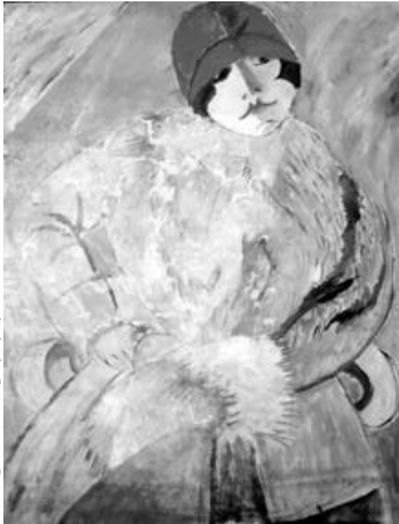
Sigrid Hjertén, Frau mit Pelz und rotem Hut, 1915, Privatsammlung