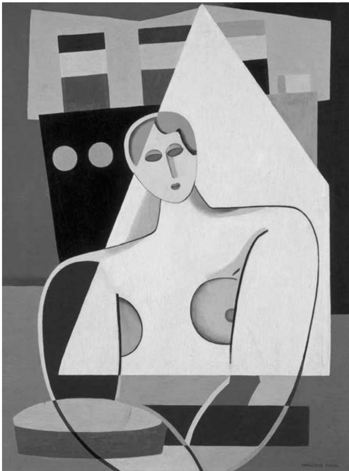
Marcelle Cahn, Frau und Segel , ca. 1926-27, Musée d' Art Moderne et Contemporain de Strasbourg (MAMCS) ©Foto Musées de Strasbourg, A. Plisson