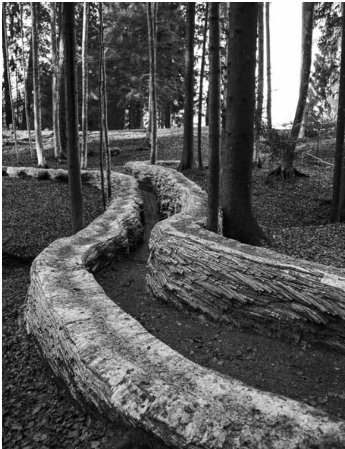
„Bridge 2“ von Steven Siegel, USA, 2009