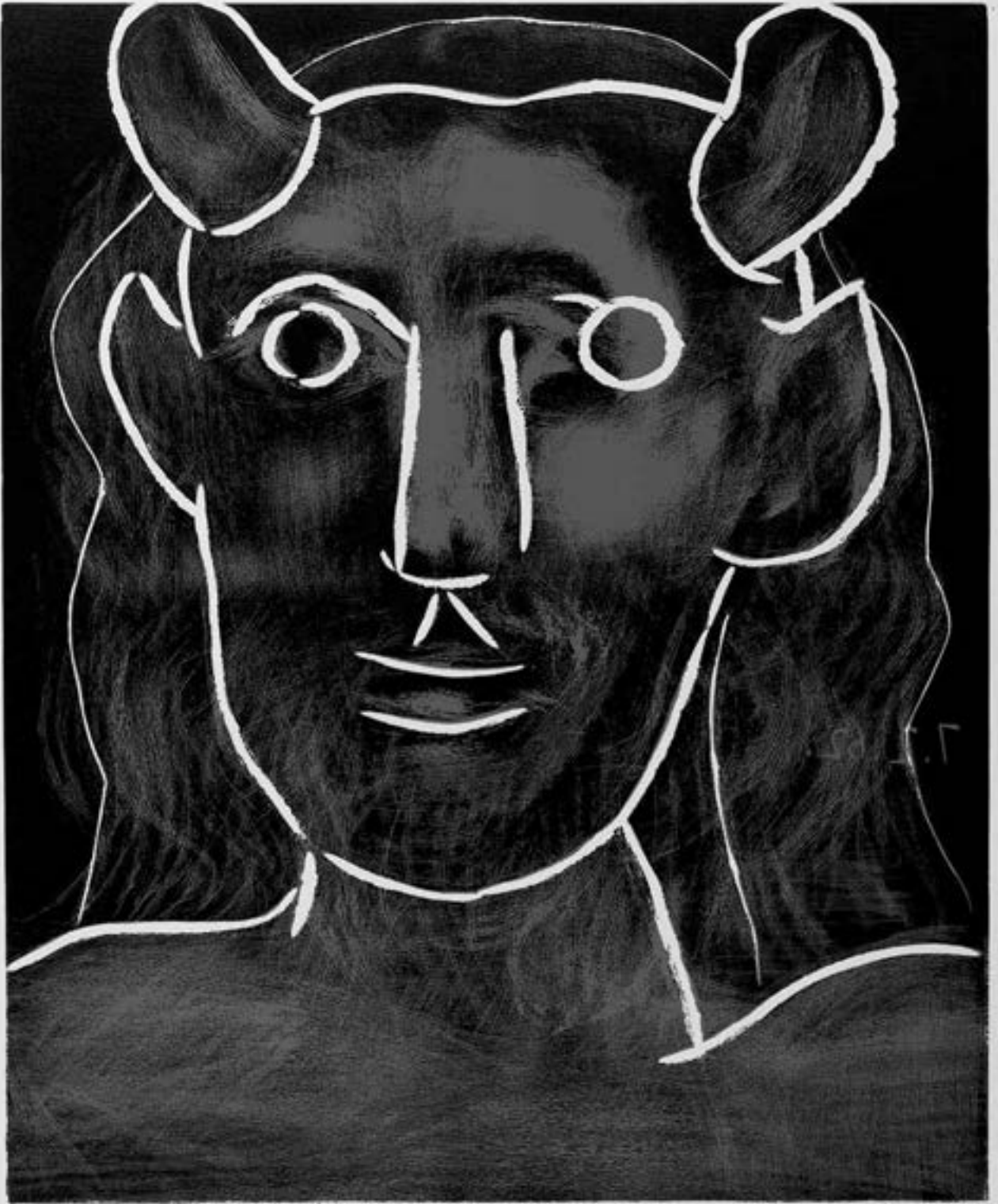
Pablo Picasso, Tête de Faune , 1962, Farblinolschnitt, Museum Kunstpalast Düsseldorf © Succession Picasso/VG Bild-Kunst, Bonn, 2015