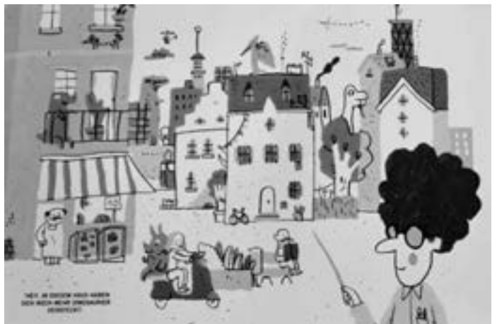
„Das Alphabet fängt mit dem Affen an“, Illustratorin und Autorin: Katrin Dageför