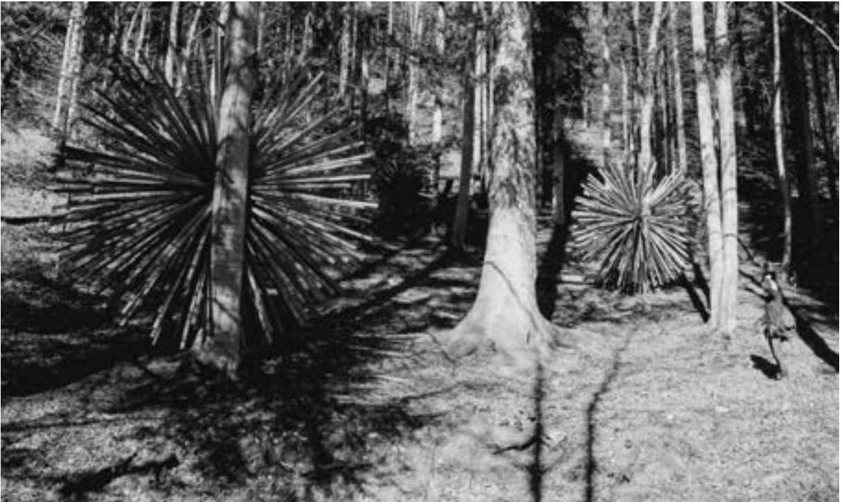
„Transizione“ von Luca Petti, Italien, 2013

Malga Costa. Seit 1998 beherbergt das kleine Hofensemble mit Ausstellungsraum, Restaurant und Ticketbüro gewissermaßen das „Zentrum“ der Arte Sella.