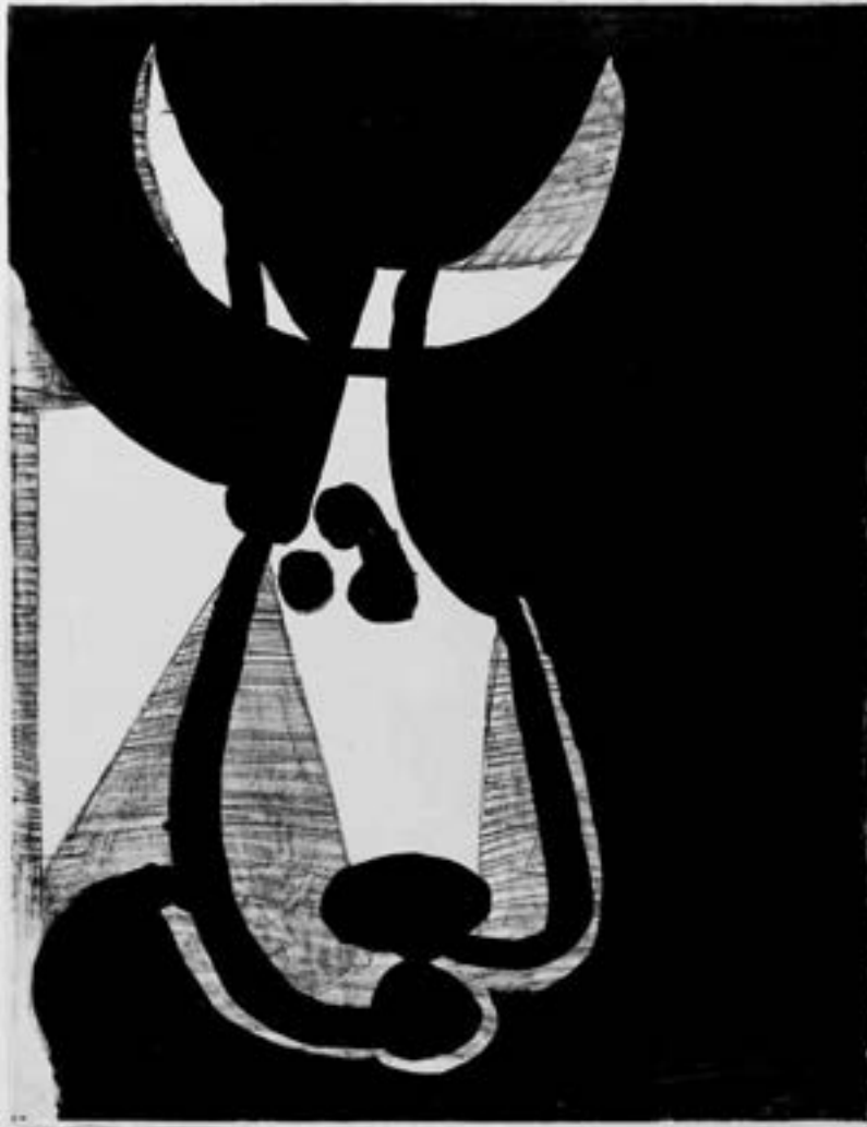
Pablo Picasso, Tête de taureau, tournée à gauche , 1948, Lithographie, M useum Kunstpalast Düsseldorf © Succession Picasso/VG Bild-Kunst, Bonn, 2015