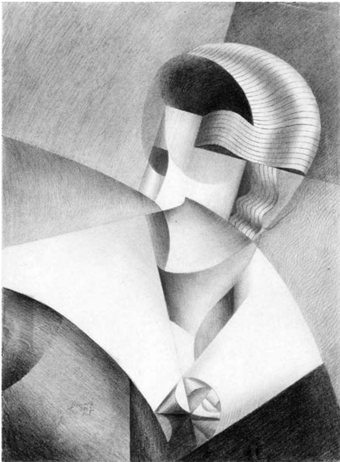
Marthe Donas, Kubistischer Kopf, 1917, Privatsammlung