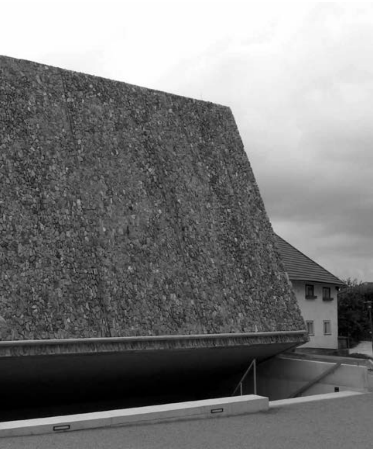
Das Konzerthaus Blaibach