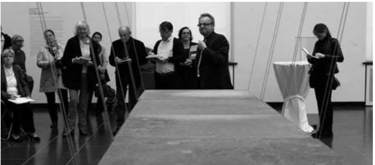
Der überzeugte Blick auf das schwebende Teil