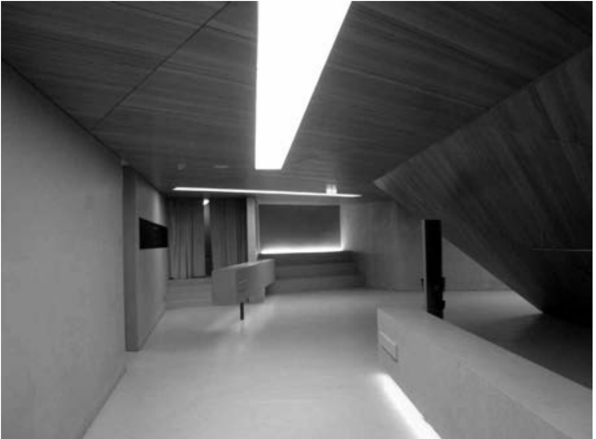
Flur mit Garderobe

Dennoch, der Optimismus siegte. Das Trio fand mit der Planung des Konzerthauses Zugang zu den Fördertöpfen des Freistaats und die Unterstützung zahlreicher Sponsoren. Die Finanzierung gelang und der Beutel des Kängurus füllte sich. Heute steht ein aufsehenerregendes Konzerthaus in Blaibach. Es faßt 200 Besucher. Die Kosten von 1,6 Millionen Euro sind bezahlt. Davon kamen 0,3 aus dem Kulturfonds Bayern, 0,3 von der Gemeinde und 1,0 aus Mitteln der Städtebauförderung. Schon die Kunde von dem geplanten Bauwerk reichte, um einen Gasthof wiederzueröffnen, die Werbung hätte mit Geld nicht bezahlt werden können. Das Konzerthaus ist im September 2014 mit einer Aufführung von Josef Haydns „Schöpfung“ eröffnet worden, gespielt von der Kölner Capella Augustina. Schöpfung zu Schöpfung; weniger hätte es nicht getan.