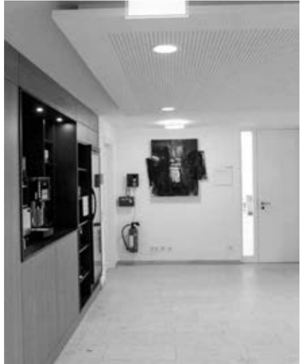
Für einen „Thomas Lange“ ist überall Platz.

jedoch gegen transparentes Glas aus. Um die Sprossen zu reinigen, mußte gar eine neue Methode erfunden werden. Mit dem Landesamt für Denkmalpflege entstand ein illusionistischer Clou: Um die vertikalbetonten Fenster zu akzentuieren, strich man die senkrechten Sprossen in einem Weiß nach Schädels Farbpalette und entschied sich bei den waagerechten Sprossen für ein warmes Anthrazit. Stefano ist sich darüber bewußt, daß dies den wenigsten auffallen wird, doch des Eindrucks, der unterbewußt bei den meisten dadurch entsteht, ist er sich sicher. Die Detailverliebtheit erstreckt sich auch im Inneren des Gebäudes auf den vermeintlich überbordenden Minimalismus. Die dünnen Eisengeländer der geschwungenen Treppenhäuser waren mit Plexiglas gesichert, durch dessen Entfernung den Räumen ihre Eleganz zurückgegeben wurde. Den Boden des alten Hauptfoyers schmückt das Schädel'sche Muster aus Langmarmor und Muschelkalk und auch ein Blick zur Decke lohnt sich; dort wurde der für die 1950er Jahre typische Terrakottafarbtönen rekonstruiert. Daß Bauen im Bestand Flexibilität und Einfallsreichtum bedeutet, erfuhr Stefano spätestens bei den statischen Arbeiten, bei denen zum Erhalt der Oberfläche größere Eingriffe nötig waren, die