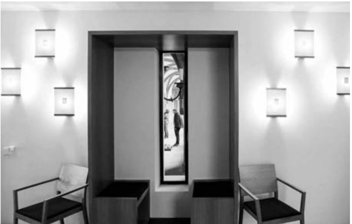
Lichtschlitze lassen Blicke in den Kreuzgang zu.