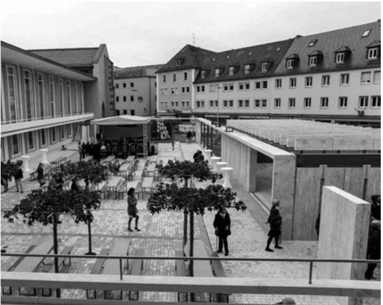
Der neue Festivitätenplatz mit vorgebautem Travertinquader(rechts)

die Anforderungen an einen Zweckbau mit dem filigranen Ästhetikverständnis der 1950er Jahre. 1995 wurde sie unter Denkmalschutz gestellt, was die Stadtobersten jedoch nicht davon abhielt, in der Folge ihren Abriß zu genehmigen. Dieses Jahr forderte eine Mehrheit der Bürger ein, daß sich die Stadt der Aufgabe der Sanierung zu stellen hat. Unterhalb der Domtürme sieht man einen Bau aus derselben Zeit mit denselben zeittypischen Merkmalen, eingebettet in ein bauliches Ensemble aus Mittelalter und Barock. Es ist nun neu gestrichen und überarbeitet und doch sich selber treu geblieben. Auf die Frage, warum sich die Kirche für den Erhalt des Bestandes entschied, antwortet Diözesanbaumeister Cesare Augusto Stefano schlicht: Das Gebäude ist ein eingetragenes Denkmal, und das bedeutet: sanieren. Nur wenige Meter voneinander entfernt, scheinen die Visionen der Hausbesitzer doch Welten zu trennen. Stefano fügt hinzu, daß auch ein Teilabriß ab-