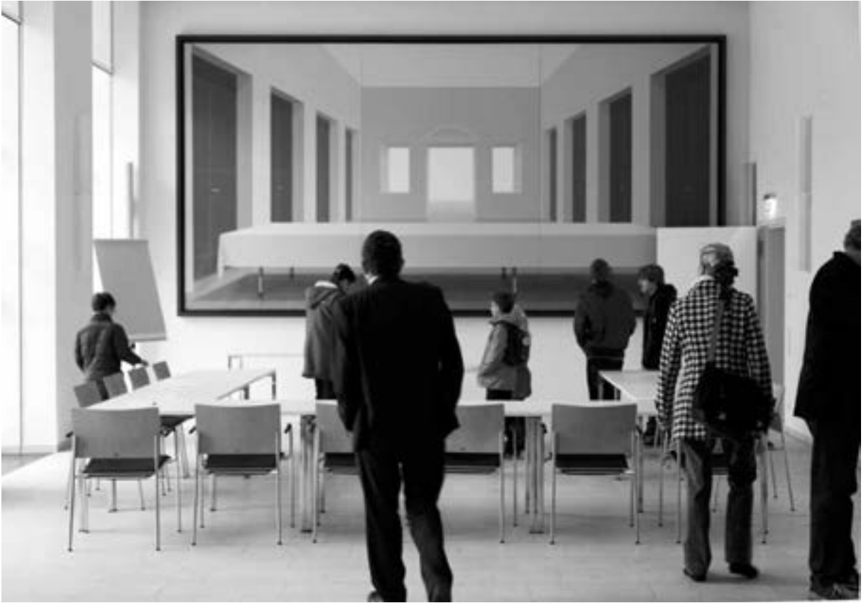
„Abendmahl II“ von Ben Willikens

im Ergebnis unsichtbar bleiben. Augenscheinlicher als die aufwendig restaurierten Abschnitte sind da die vielen Neuheiten, etwa die Guckschlitze in den Kreuzgang hinein oder das Spiel der modernen Materialien mit den alten. Durch geschicktes Verhandeln gelang es Kunstreferent Jürgen Lenssen zudem, weit über 200 Kunstwerke für das Gebäude zu erwerben, und doch sträubt er sich gegen den Vergleich mit einem Museum. Man wird denn auch vergeblich nach Beschriftungen suchen, die die Deutung der Werke vereinfacht oder sie für einige vielleicht erst gänzlich möglich macht. Ein Werk fällt besonders ins Auge: Im ehemaligen Speisesaal ist das monumentale, fotorealistische Gemälde „Abendmahl II“ (2008) von Ben Willikens ausgestellt, das auch ohne Kenntnis seines Titels die entsprechenden Assoziationen zum Mailänder Wandgemälde Leonardo da Vincis weckt. Es ist steril und menschenleer, der Tisch ist lediglich von einem Tuch bedeckt, was dem Bild eine kühle, fast abweisende Ausstrahlung verleiht. Dennoch lädt es zum Verweilen ein, zieht in den Bann und inspiriert zum Philosophieren. Und