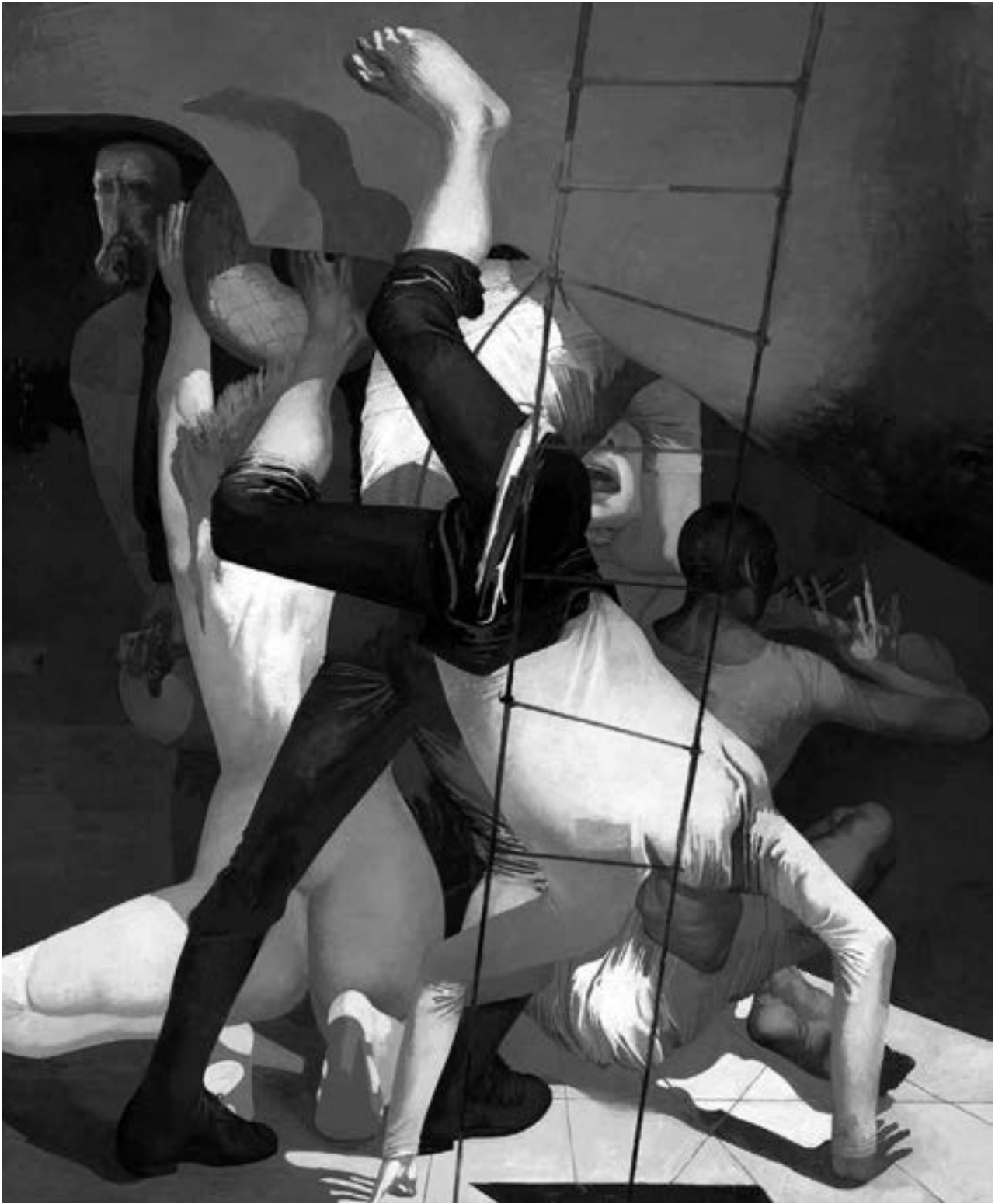
Arno Rink, Nacht der Gaukler , 1988/89, Öl auf Hartfaser, Slg. Hurrle Durbach, Foto: Stephan Hund, © VG Bild-Kunst, Bonn 2015