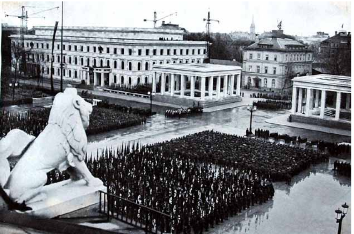
München, Königsplatz 9.11. 1935. So was gab es früher als Sammelbild. Zu sehen auch die Ehrentempel und dahinter das „Braune Haus“. Heute steht dort ...

Jeder, der in diesem Ensemble bauen will, muß die einzelnen Schichten der Entwicklung sorgsam analysieren. Der Königsplatz selbst hat die stärksten Wandlungen erfahren, von der Vision König Ludwigs I. von Tempeln in einem grünen, leicht beweg-