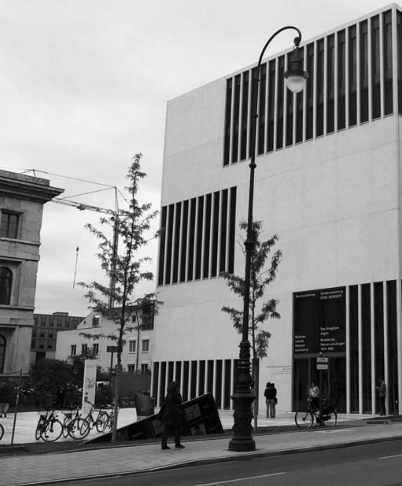
... das neue NS-Dokumentationszentrum.