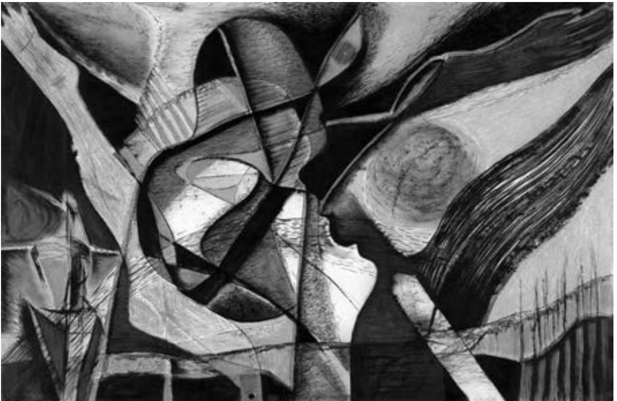
Günther Hurniat, Im Schatten der Brutalität-Der Schrei , 1980, Kohle, Pastell, Farbstifte, Slg. Hurre Durbach, Foto: Dieter Schleicher, © Günther Hurniat, Bonn 2015