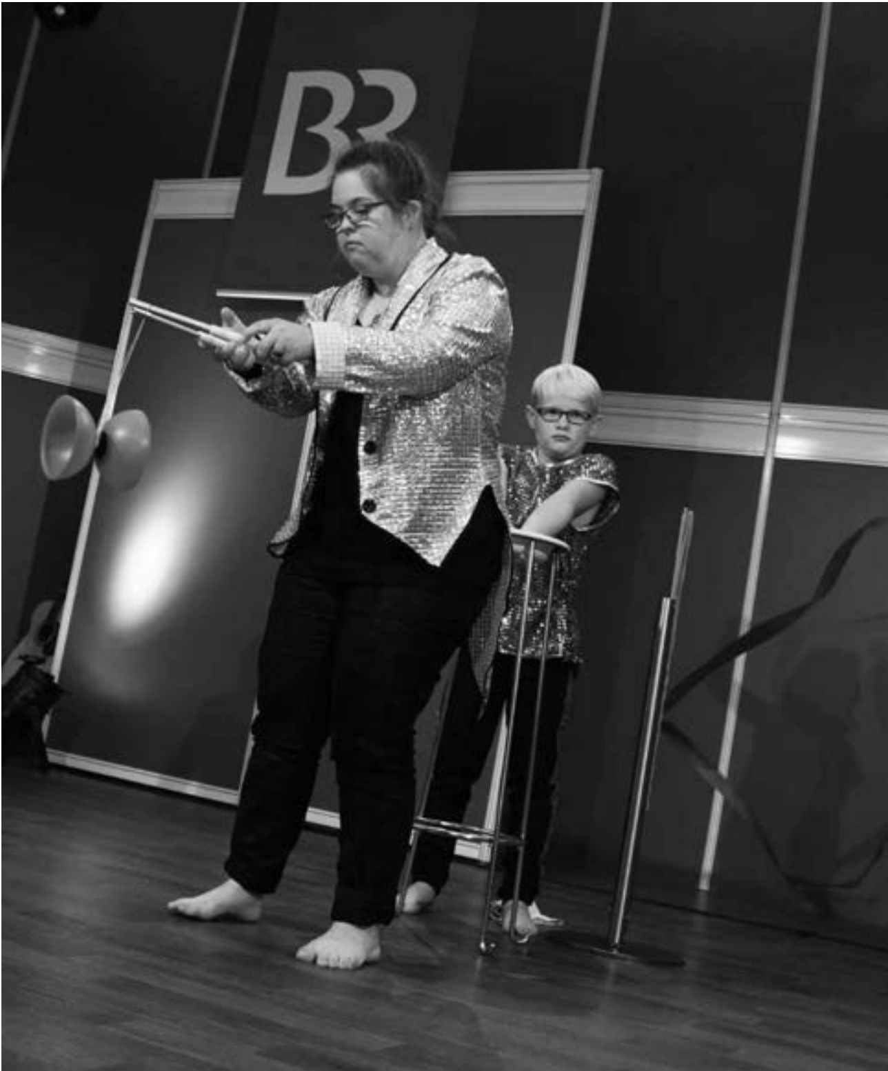
Circus Blamage auf der Mainfrank