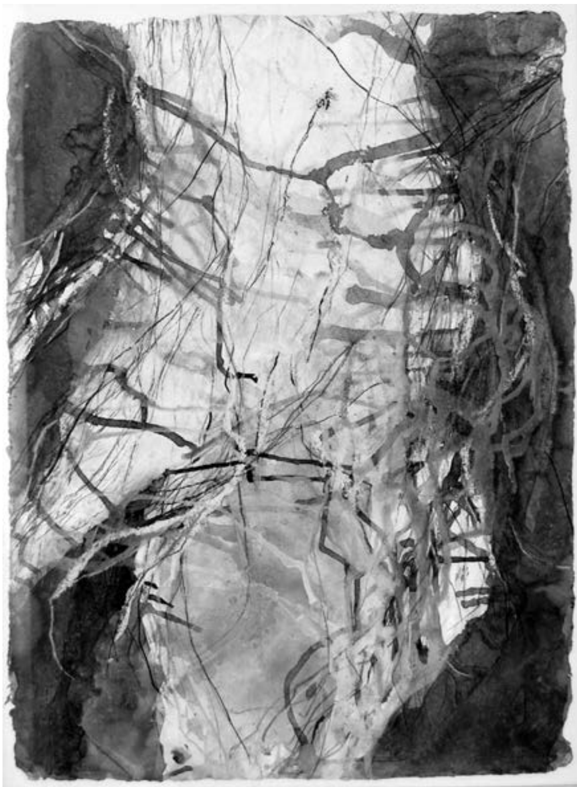
Claire Wimmer: aus der Serie „Verlöschungen“ (2015)