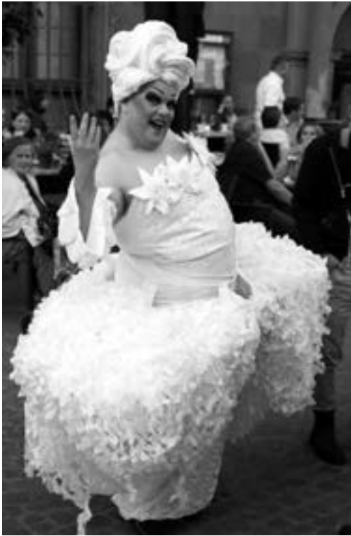
Lola-ein Walking Act.

Gruppenbildung allerorten um die Akteure im Stramu-Zentrum Marktplatz und angrenzende Fußgängerzone, manchmal gab es kaum ein Durchkommen. Ob mit oder ohne elektrische Verstärker, die dargebotene Kunst begeisterte durchwegs. Die Mühen der Künstler fielen hoffentlich nicht den weitverbreiteten, grassierenden Sparzwängen zum Opfer und ließen viele Münzen in den herumgereichten Hüten klingeln. ♪