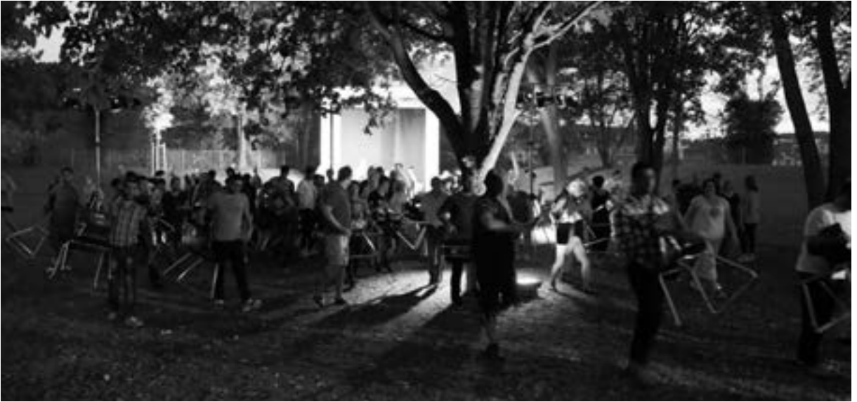
Selbst ist der Zuschauer. Stühlerücken beim Bühnenwechsel