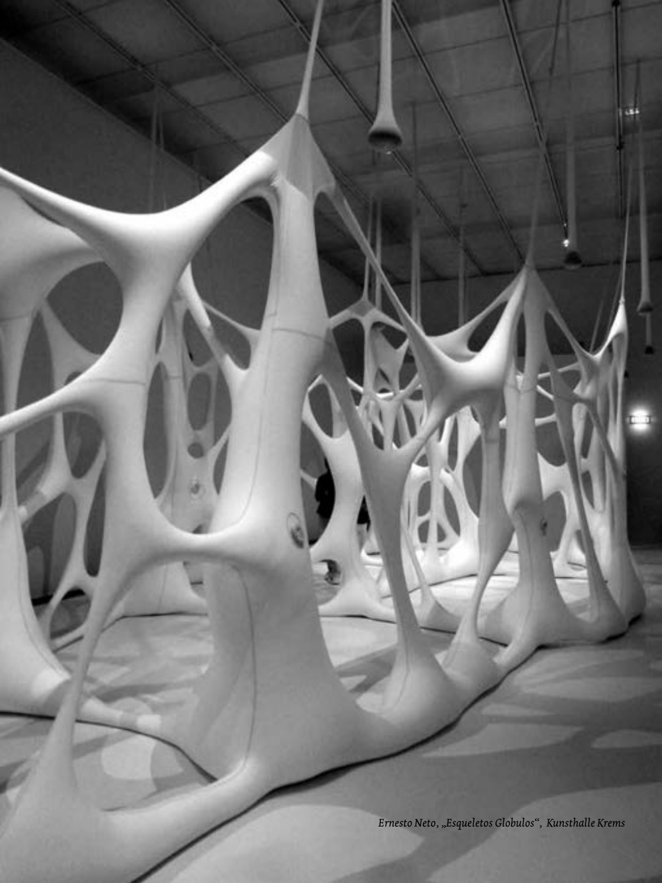
Ernesto Neto, „Esqueletos Globulos“, Kunsthalle Krems