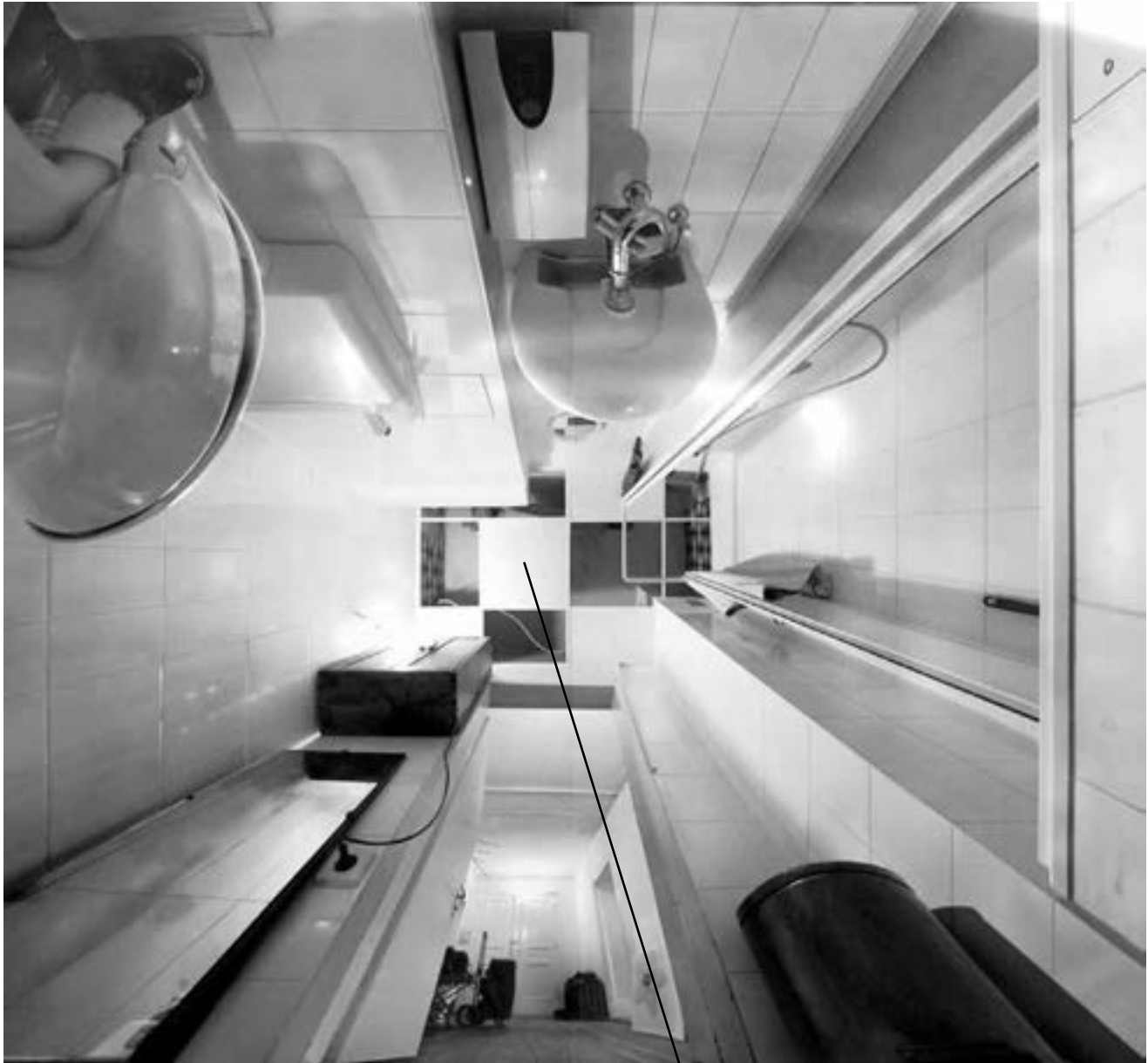
Michael H. Rohde: „bathroom“ (2010)