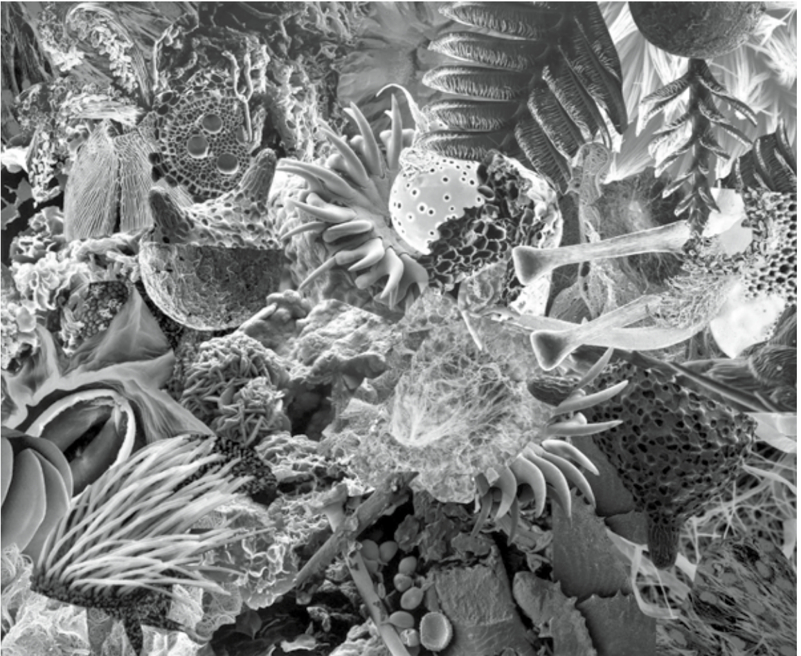
Peter Baumann, „Submarine Sightseeing“, Collage, 80 x 100 cm