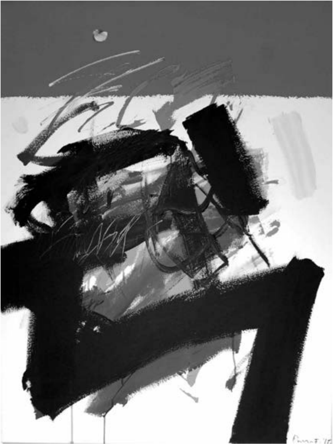
Ferenc Puha, o.T., 2015