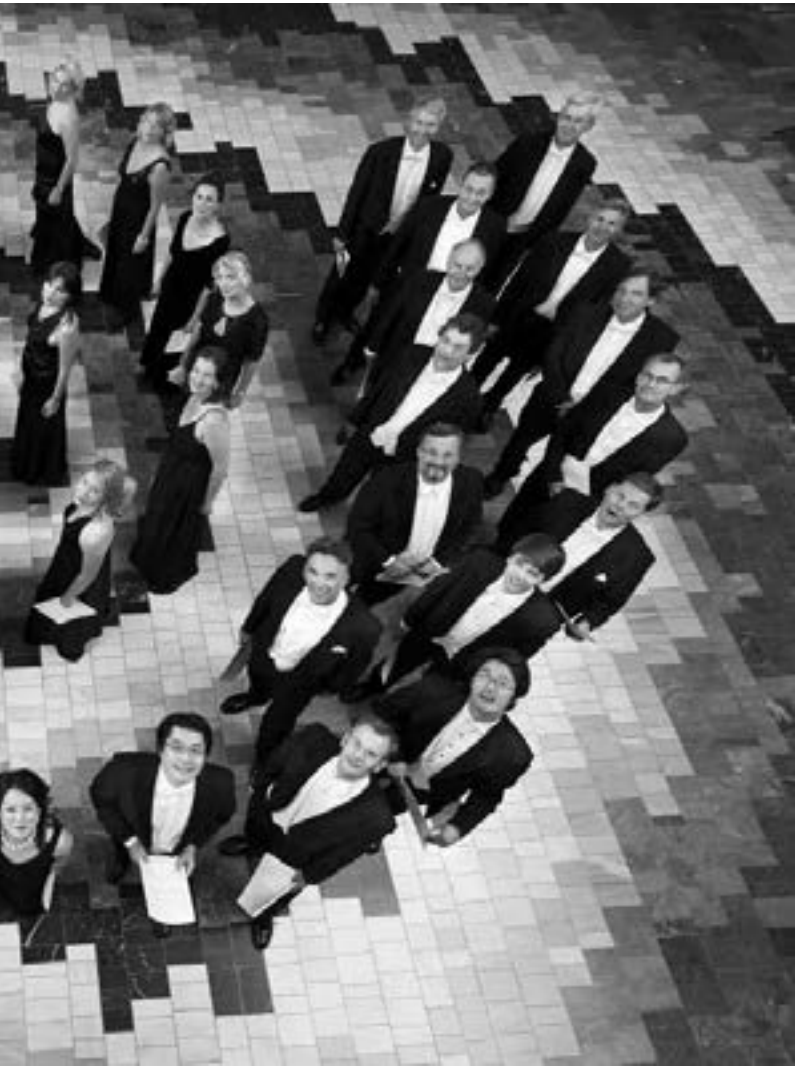
Der versammelte Chor des Bayerischen Rundfunks