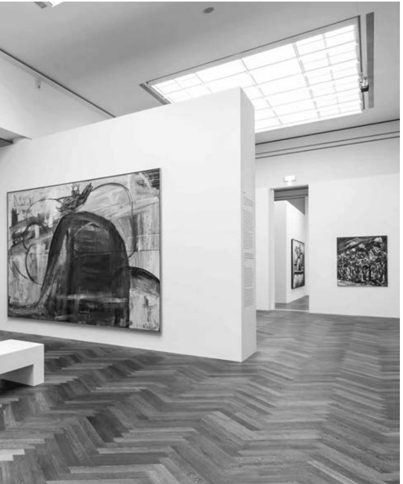
Ausstellungsansicht „Die 80er, Figurative Malerei in der BRD“