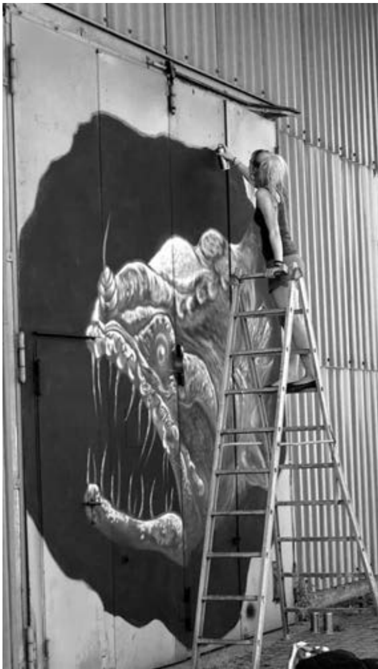
Zauberfisch in der nördlichen Hafenstrasse von Talissa Mehringer aus Mexiko

Text: Achim Schollenberger