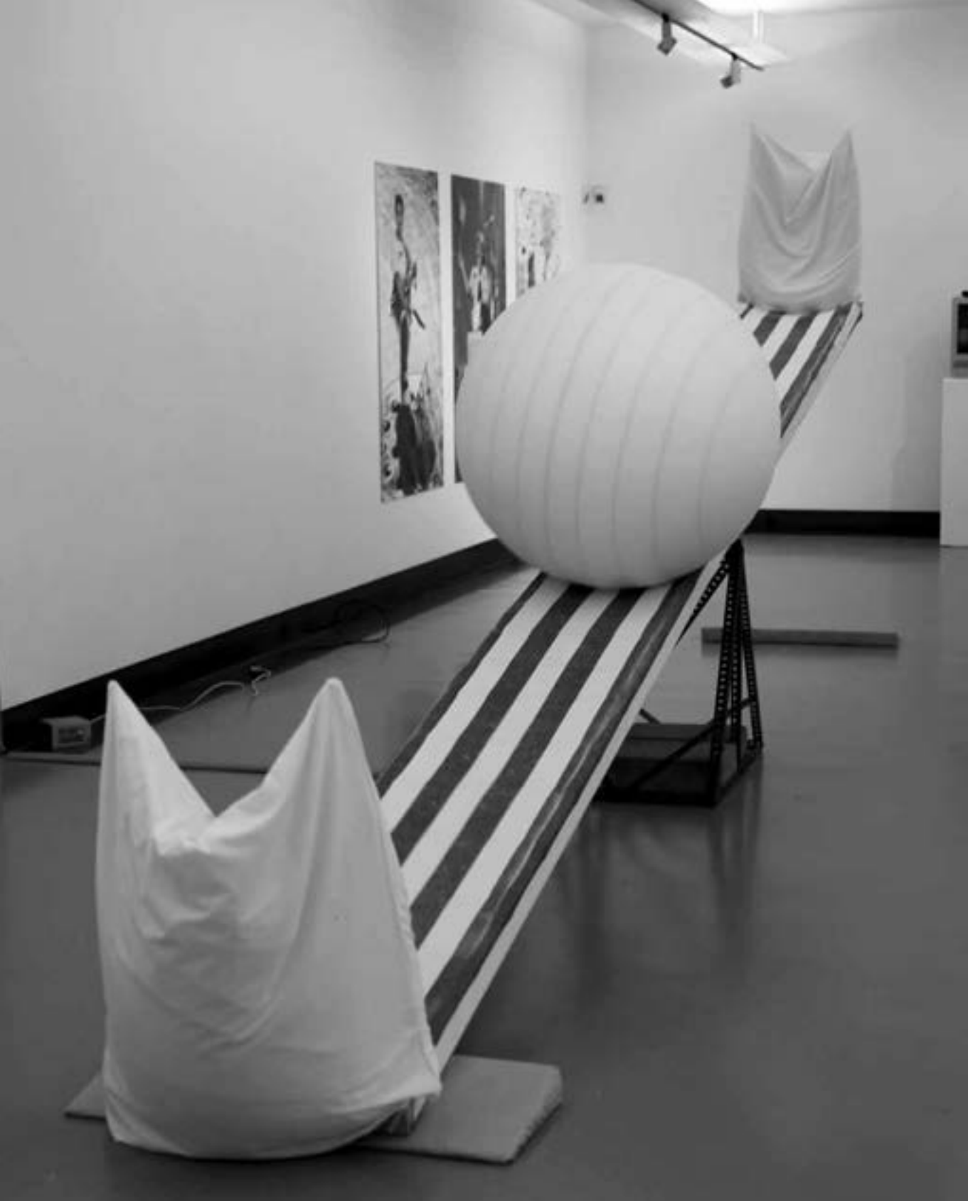
Blick in die Ausstellung. Im Vordergrund: Inge Mahn, „Ohj, lu, lu, lu, lu, lu“, kinetische Plastik, 2006