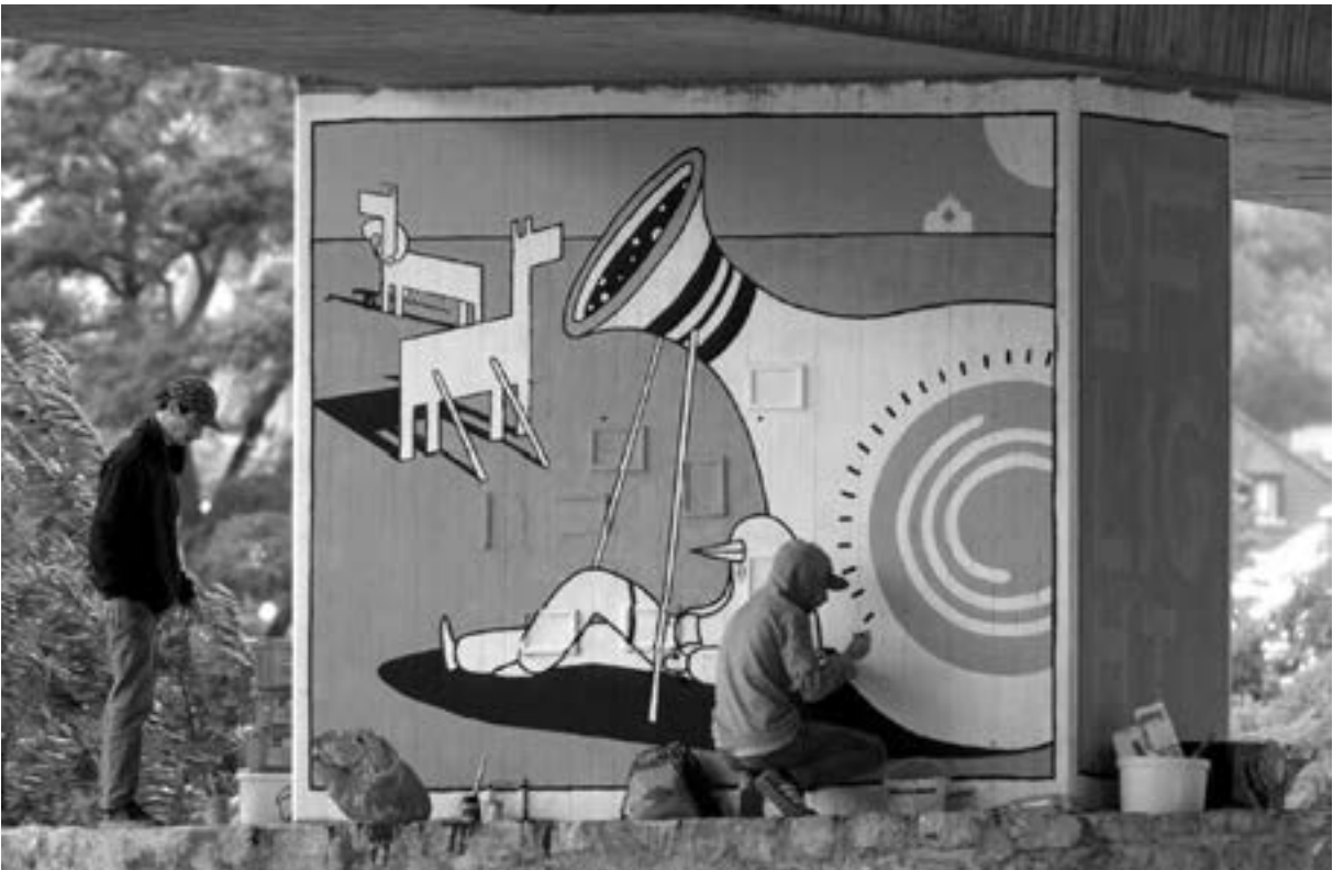
Gavriel und Elnar, die Brothers of Light, verewigen sich der Brücke der Deutschen Einheit.