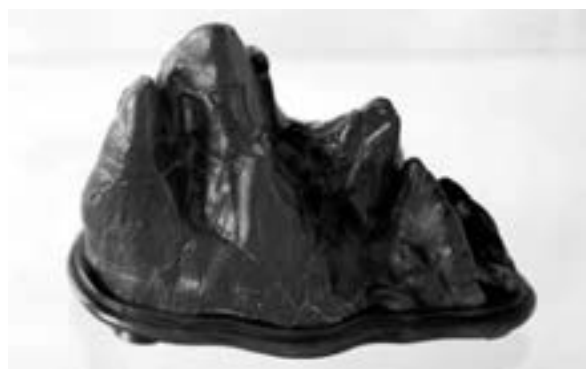
Gebirge, Fundort Japan