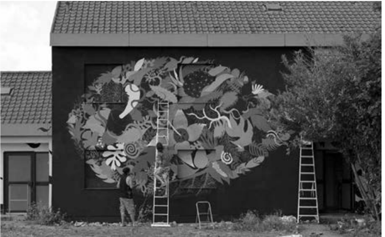
Gola Hundun auf der Leiter und FuchsHand aus Italien und Spanien bemalen das Offiziershaus am Hubland.