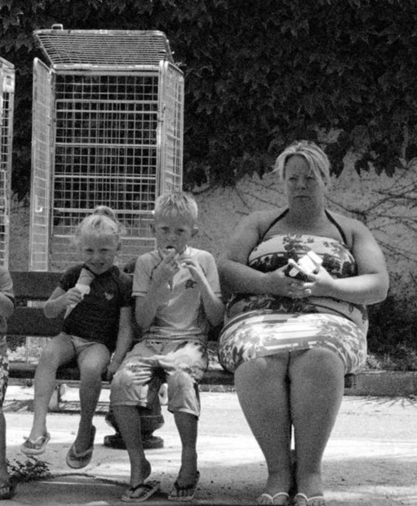
Kleinen enannte noch in diesen wenigstens eine gewisse die Drahtgitter durchgebissen haben. 9