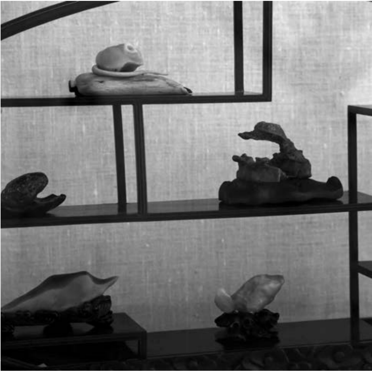
Tierformen, verschiedenen Fundorte