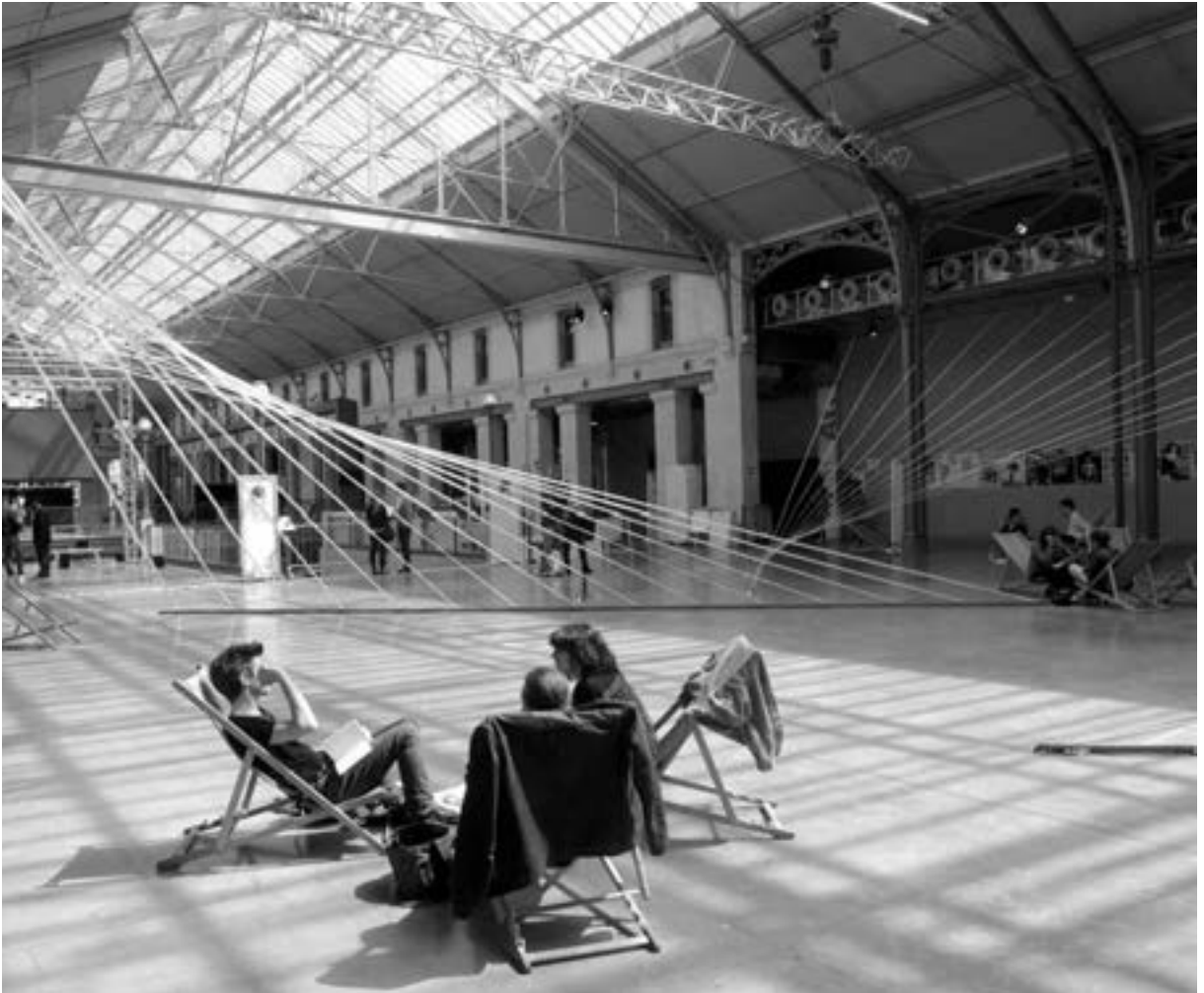
Paris, Le 104

Wenn das Projekt hier vorgestellt wird, möge der Leser bedenken, daß das „Centquatre“ schon wegen seiner Größe kein Beispiel für Würzburg sein kann. Von den anderen Eigenschaften nicht zu reden. Ob Särge oder Schule, wir halten uns nicht lange auf, wir schreiten gleich zum Begräbnis. ¶