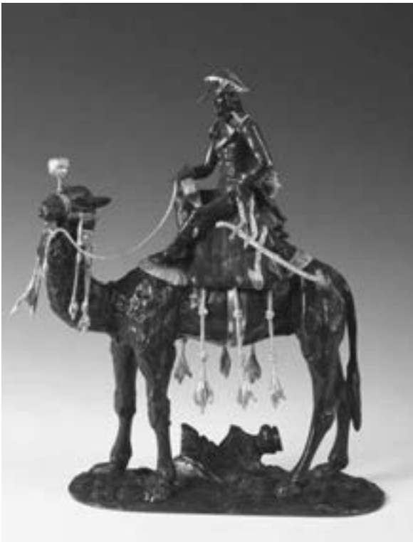
Bonaparte auf einem Dromedar, Bronze, Fondation Napoléon, Paris, Collection Marital Lapeyre Inv. 465

Der bayerische Held dort war General von Wrede, der von König Max I. mit der Herrschaft Ellingen belohnt wurde. Und die bayerische Garde de Corps konnte wieder im Glanz ihrer prächtigen Uniformen strahlen. Aber die Kriegsfolgen waren dramatisch: Staatsbankrott, Ruin vieler Unternehmen, etwa im Tuchgewerbe, eine Hungersnot. Doch die Veteranen und ihre Vereine hielten noch lange Zeit die Erinnerung an die Kriegszüge hoch mit Fahnen, Stammtischzeichen oder Motivtafeln, und auch die Befreiungshalle in Kelheim oder der Obelisk auf dem Karolinenplatz in München dienen weniger dem Gedenken an das Bündnis mit Napoleon als an die Heldentaten bayerischer Soldaten. ¶