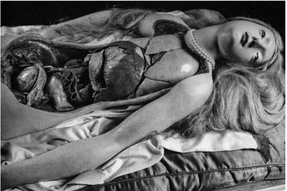
Auch eine Form des Analytischen - Wachspräparat aus dem Wiener Josephinum, aus Rainer Metzger, Die Stadt. Vom antiken Athen bis zu den Megacitys. Eine Weltgeschichte in Geschichten.

Das wird heute üblicherweise so aufgelöst, daß zwei Pianisten spielen, aber nicht irgendetwas, sondern eine Einrichtung für zwei Pianisten. Als Noten kaufen kann man eine Bearbeitung von Busoni. Kit Armstrong, ausgewiesener Komponist, hat offenkundig eine eigene Fassung hergestellt und sie allein bewältigt. Leider läßt uns das Programmheft darüber im Dunkeln. Das wäre sicher noch überzeugender und beeindruckender gewesen, wenn der Flügel seinen pianistischen Ambitionen hätte Gerechtigkeit widerfahren lassen: Der Flügel war unzulänglich – in einem solchen Rahmen, bei einem solchen Konzert, ein Unding. ♯