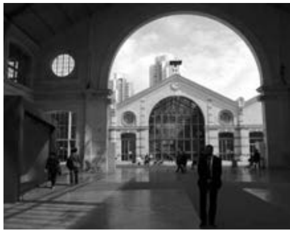
Paris, Le 104

Die Stadt entschied sich für den Entwurf, der den besonderen Charakter des Ortes am besten respektierte. Die Realisierung folgte unverzüglich und im Oktober 2008 wurde das „104“ eröffnet. Aus dem Sarglager wurde eine öffentliche Einrichtung zur freien, kulturellen Zusammenarbeit in Paris. Nur ein großer Totenkopf von Niki de St. Phalle im ersten Höfchen erinnert an alte Zeiten. Im Innern stehen 25 000 qm Nutzfläche zur Verfügung, dazu 7 300 qm Parkfläche und 4 500 qm für den Weg durch das Gelände. Die Nutzfläche teilt sich auf in Flächen für Handel und Dienstleistung (1 900 qm), eine Flächenreserve für Handel und Events (2 500 qm). Im zentralen Schiff zwei Theatersäle für 200 – 400 Besucher mit den dazugehörigen Foyers, Flächen für 16 Ateliers und 18 Büros (4 000 qm), eine Fläche für Unternehmensgründer (800 qm), eine Ausrüstung für Amateurartisten (500 qm) sechs Appartements bis zu vier Zimmern und so weiter. Dazu ein Restaurant und ein Café.