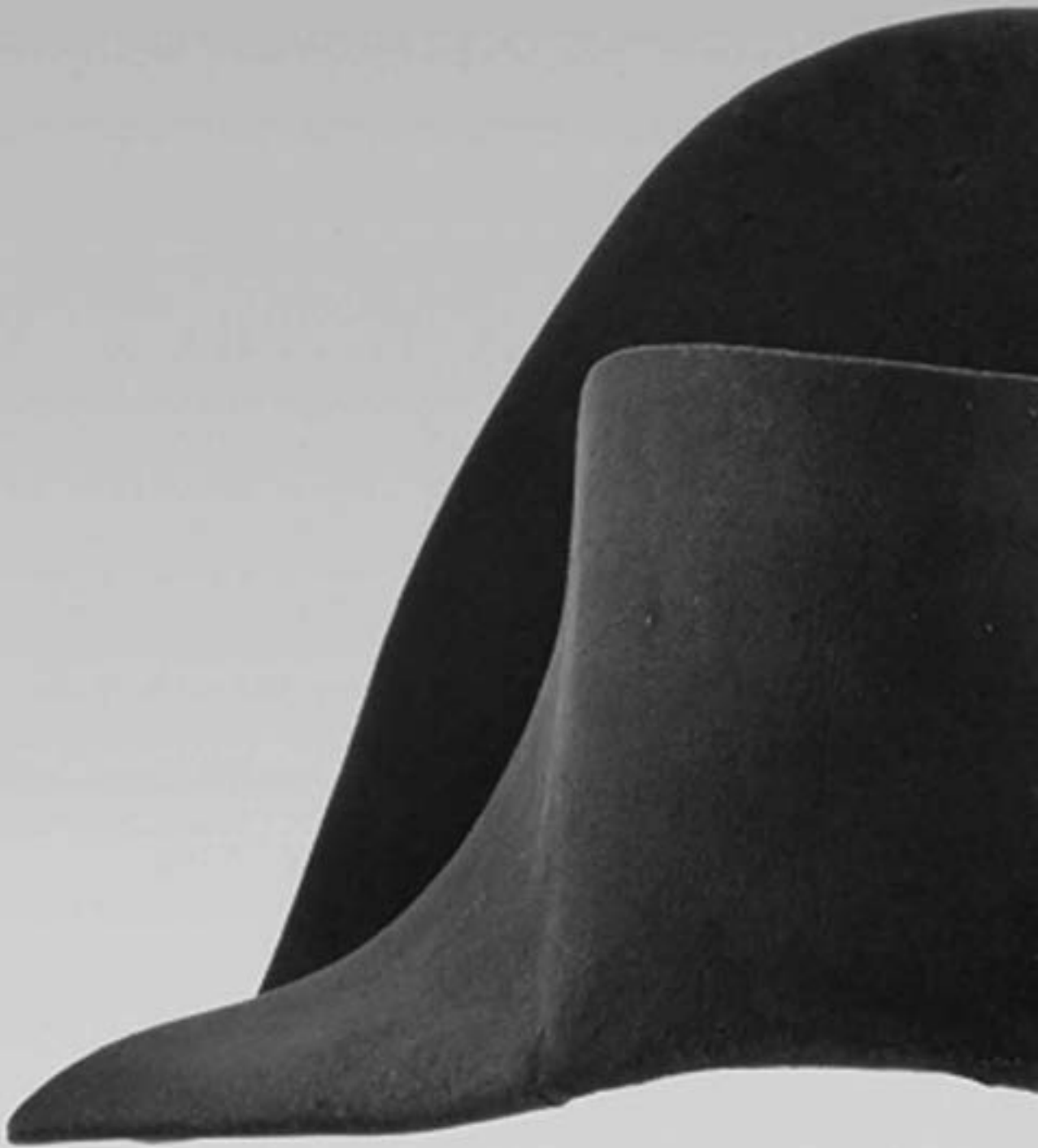
Der Hut Napoleons, Filz, Seide, Holz, Roßhaar, Hutmacher Poupard et Delaunay, Paris, um 1811/1812. Musée de l'Armée Paris - Hôtel national des Invalides, © bpk | RMN - Grand Palais | Paris, Musée de l'Armée | Christophe Chavan