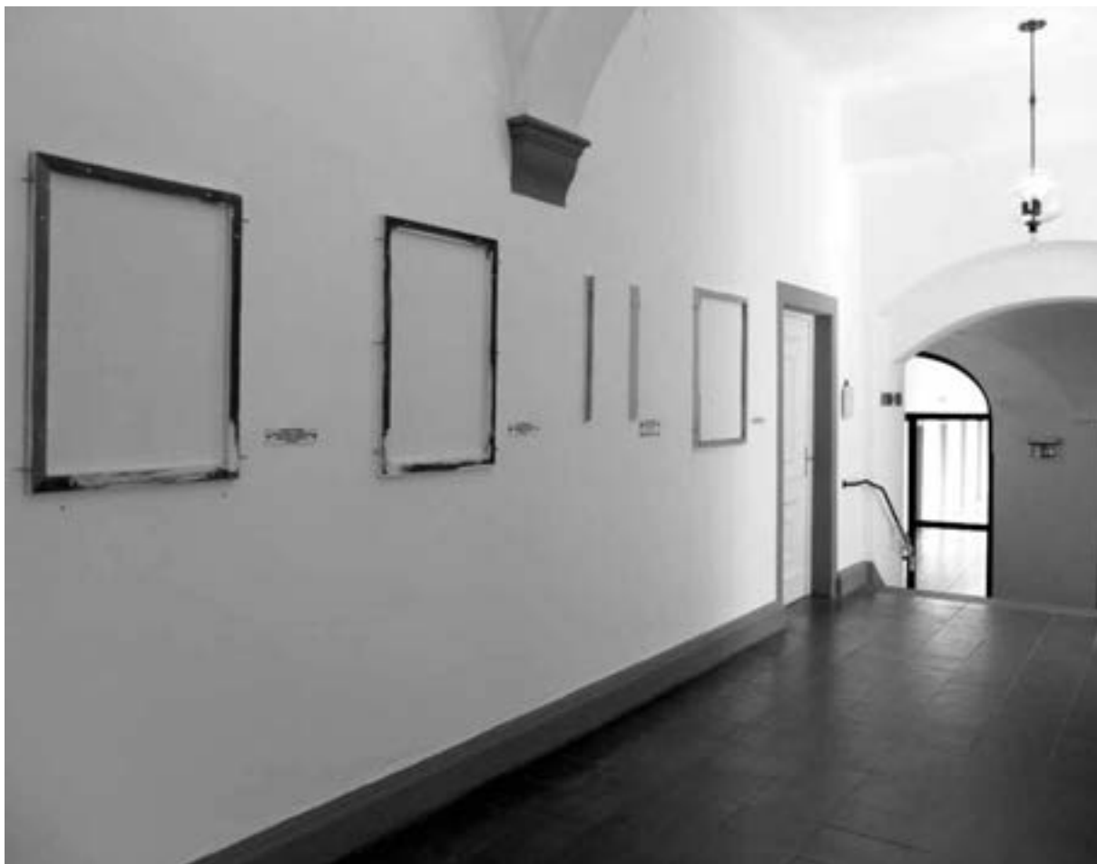
Minimalistische Porträts in den Gängen des Würzburger Rathauses

läßt, schlägt sich ja auch als erstes im Preis nieder. Ein Künstler übt seine Tätigkeit ja nur im besten Fall, meist aber nicht ausschließlich als Beruf aus, von der er leben können muß. Und wer selbst schon versucht hat, ein Porträt seines Gegenübers zu erstellen, das diesem zumindest ähnlich sah, wird die Herausforderung anerkennen, sich mit seinem Werk und den Dargestellten auch noch in der Öffentlichkeit zu präsentieren.