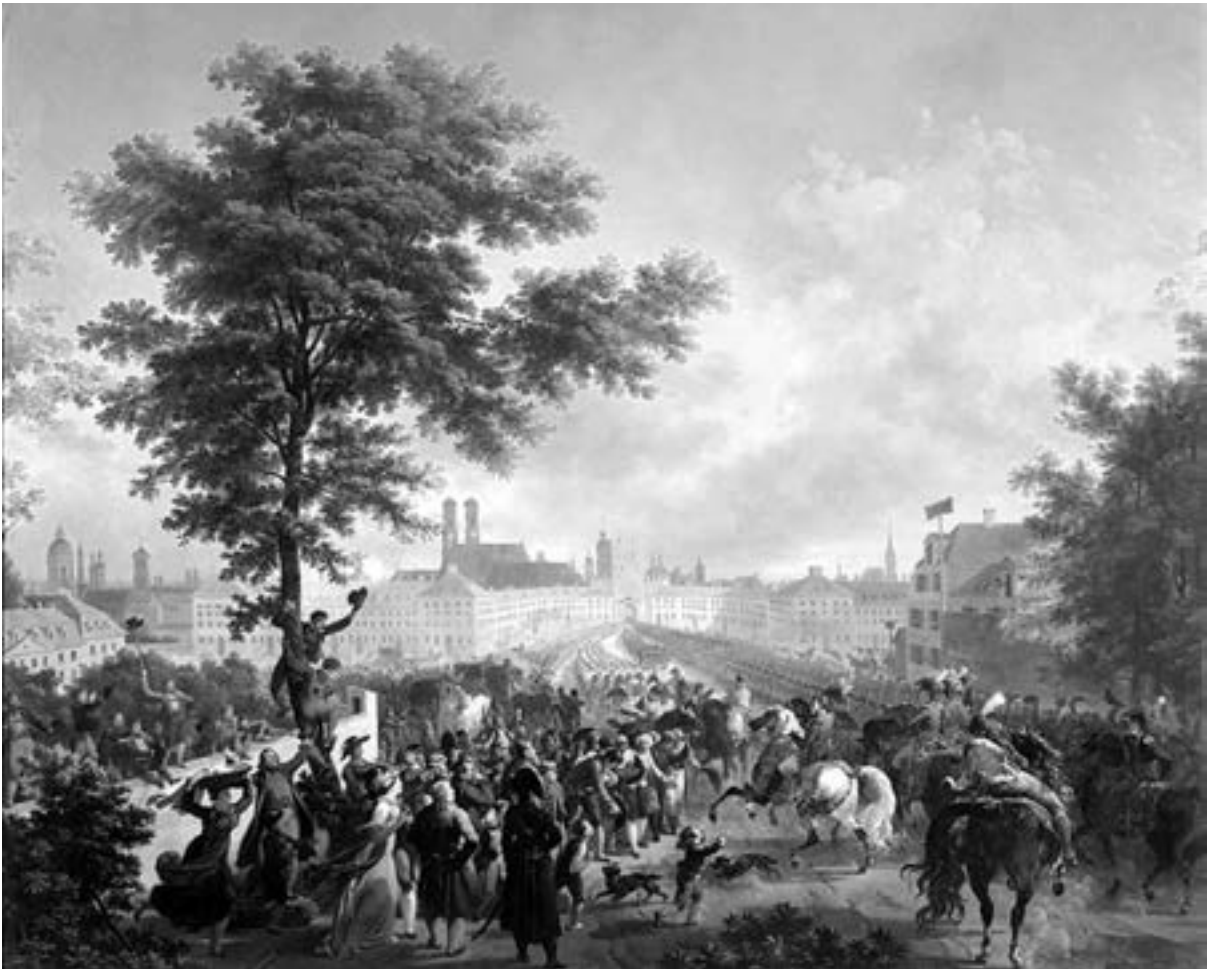
Nicolas-Antoine Taunay (1755–1830), Einzug Napoleons in München 1805, Musée national des châteaux de Versailles et de Trianon, Versailles Inv. Nr. MV 1709

Guillotine – ermöglichte erst den Aufstieg von General Bonaparte, medial vermittelt durch die Zeitung und verherrlicht durch zahlreiche Porträtbüsten, etwa aus Nymphenburger Porzellan; zur Glorifizierung trug auch der Ägyptenfeldzug bei. Persönliche Devotionalien des unermüdlich und rasch umherziehenden Feldherrn können bestaunt werden, so sein Sattel, sein Hausmantel, die Handschuhe, vor allem natürlich sein berühmter Hut (den es übrigens in vielen Ausfertigungen gab und gibt), kostbare Geschenke wie eine Vase aus der Manufaktur von Sèvres oder eine Dose, verziert mit seinem Porträt. Doch nicht alles war so glänzend. Der Durchzug der französischen Revolutionstruppen brachte über die Bevölkerung Not und Elend, wie eine Holztafel von Kloster Scheyern zeigt, und auch der – erzwungene – Kampf Bayerns auf der Seite Österreichs bei