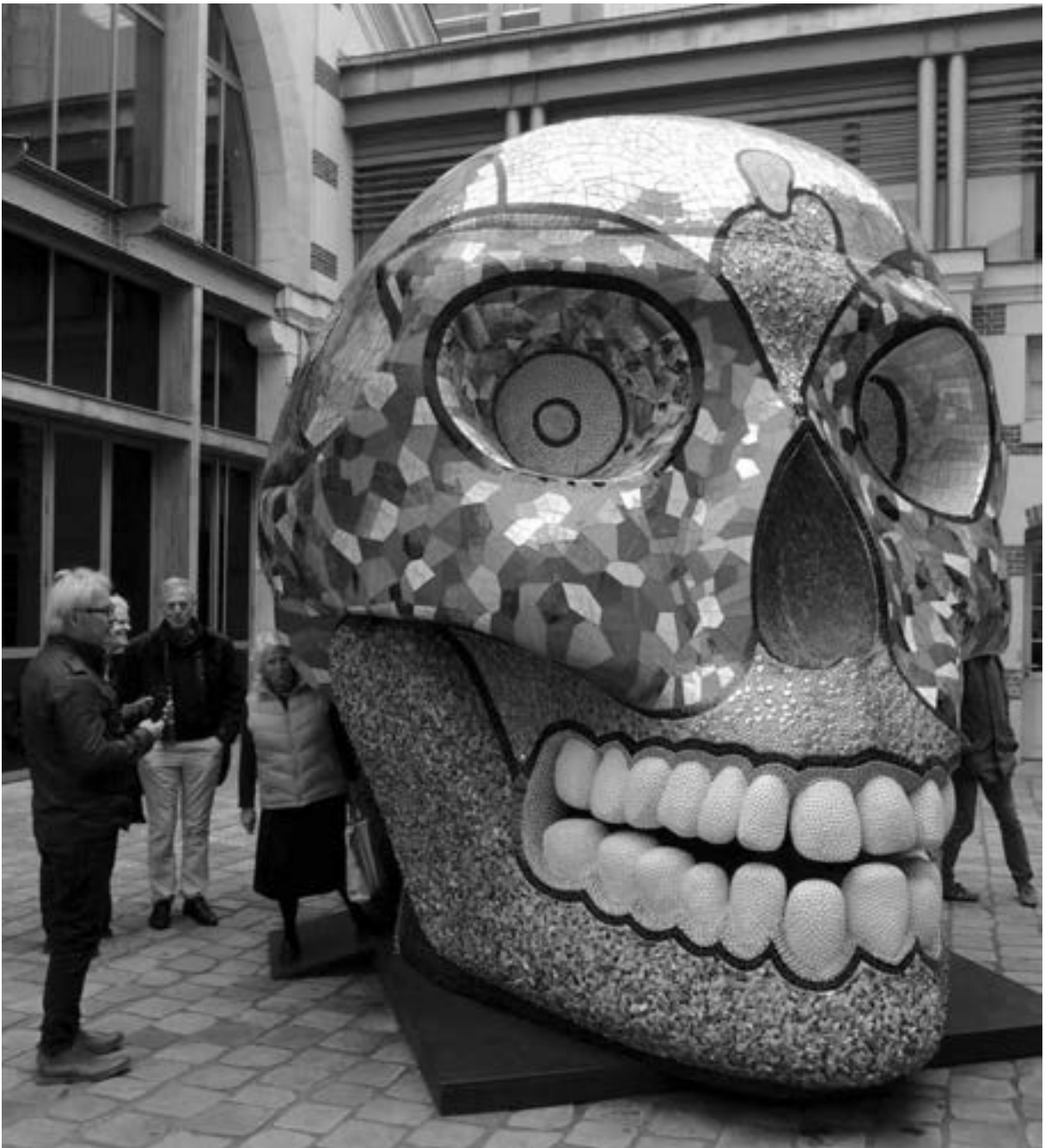
Paris Le 104, ein Werk von Niki de St. Phalle