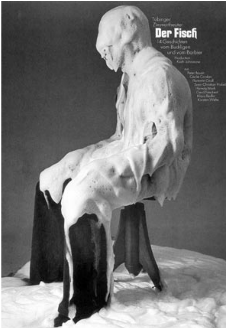
Abbildungen mit freundlicher Genehmigung.