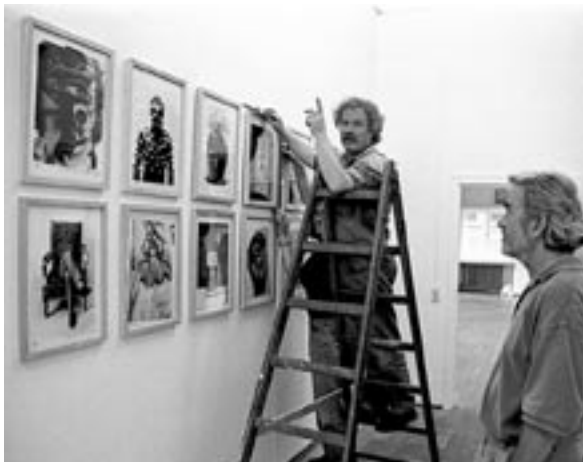
Beim Hängen einer kleinen Ausstellung mit den Bildvorlagen für die Plakate in der ehemaligen Staatsbank, Würzburg, Mitte der 1990er Jahre.

Oder das Plakat zum Stück »Zwischen den Schatten« (1973): Eine Welle der Empörung brandete hoch, als das Motiv des Kruzifix mit der rauchenden Zündschnur in der Öffentlichkeit wahrgenommen wurde. Allerdings wandelte sich die (christliche) Empörung über die vordergründige Provokation schnell in Anerkennung auch durch vorher kritische Stimmen – das Bildmotiv ist eines der stärksten zum Nordirland-Konflikt (und um diesen geht es auch im Stück).