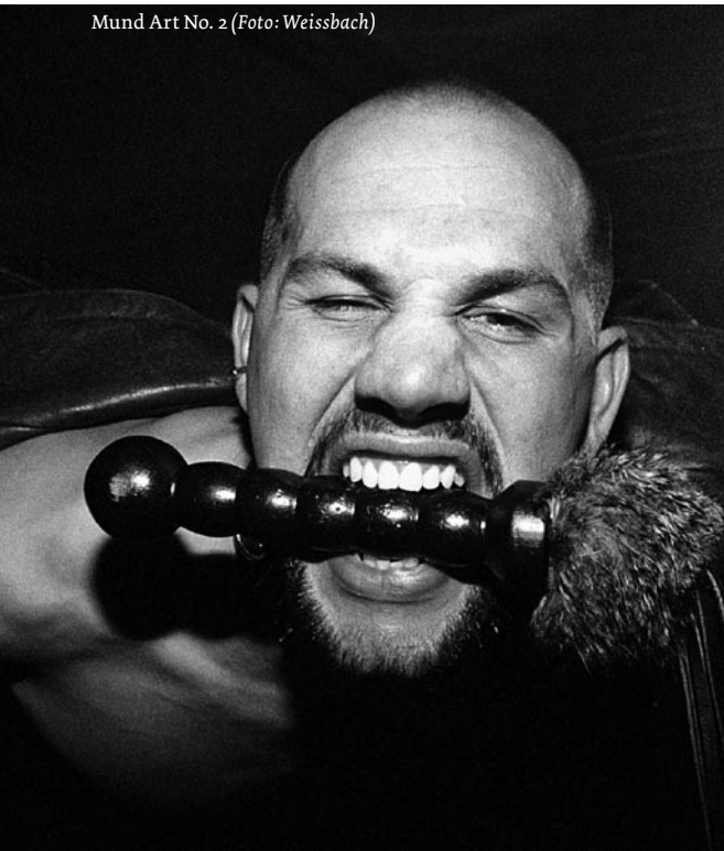
Mund Art No. 2