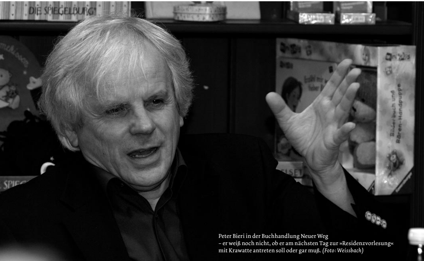
Peter Bieri in der Buchhandlung Neuer Weg – er weiß noch nicht, ob er am nächsten Tag zur »Residenzvorlesung« mit Krawatte antreten soll oder gar muß.

Peter Bieri macht es seinen Lesern leicht und schwer. Er schreibt über komplizierte Themen mit bewundernswerter Klarheit, aber er verwirrt mit einer Doppelexistenz, die bereits kuriose Züge annimmt. Davon zeugt sein neuer Roman Nachtzug nach Lissabon , den er unter dem Pseudonym Pascal Mercier erscheinen ließ und in dem vermerkt ist, daß der Autor – also Mercier – 2001 unter dem Namen Peter Bieri ein Buch mit dem Titel Das Handwerk der Freiheit herausbrachte.